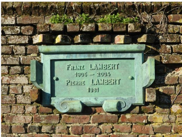
Foto 3: Grafteken Lasserre, detail grafplaat familie Lambert (latere invulling epigrafie)