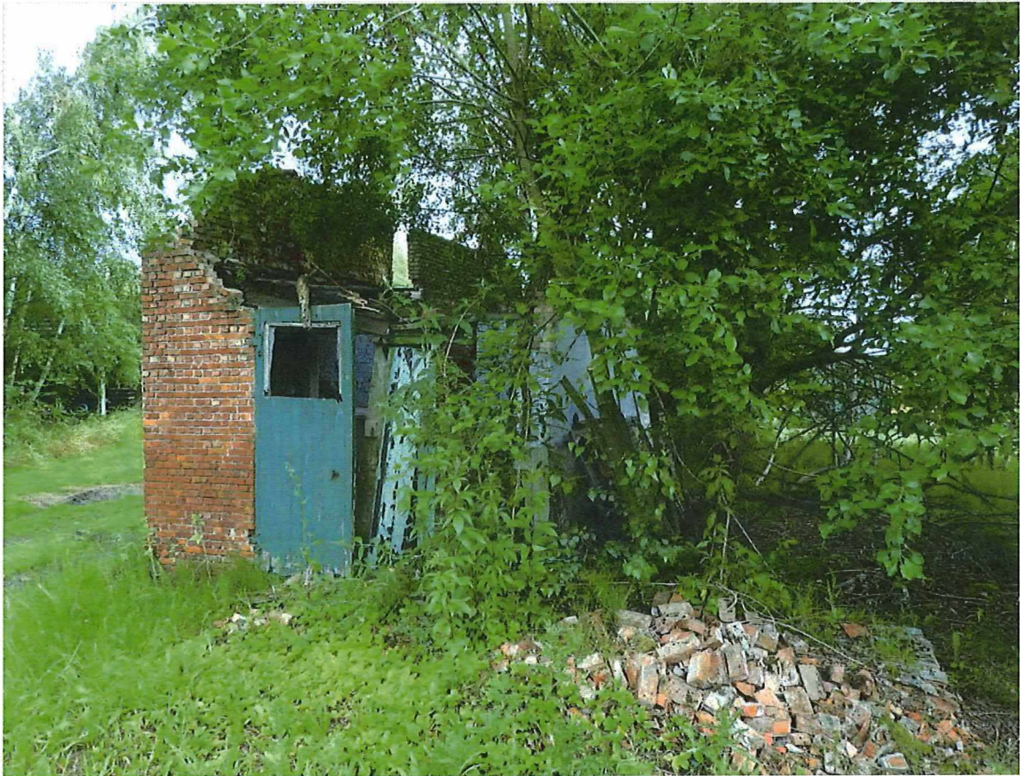
Foto 3: vooraanzicht van de hoek van de vroegere voorgevel en de westelijke zijgevel.