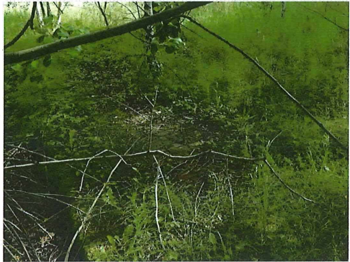
Foto 6: restant van een baksteenvloer of bovenzijde van een keldergewelf.