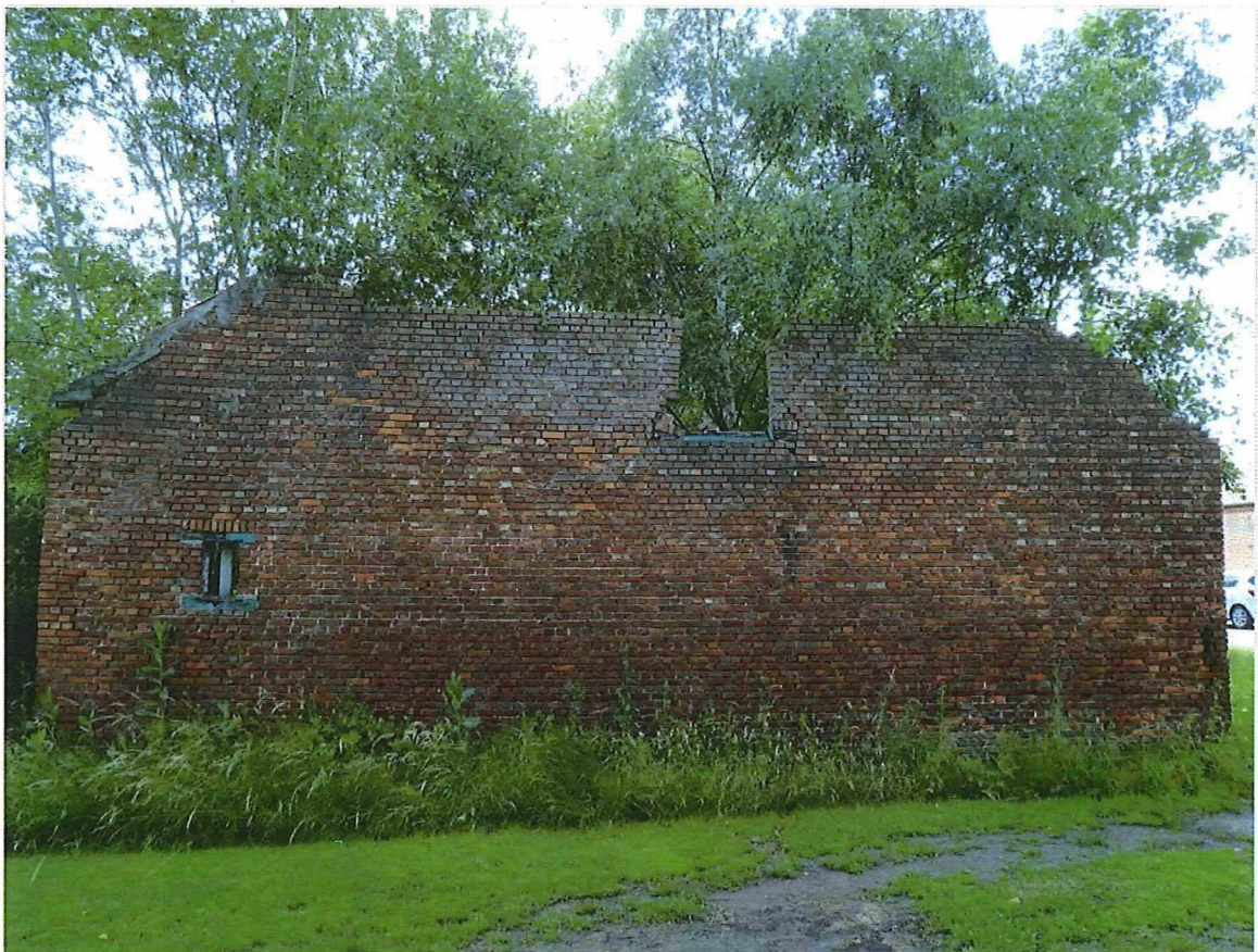
Foto 2: overblijfsel van de westelijke zijgevel van het hoevegebouw.