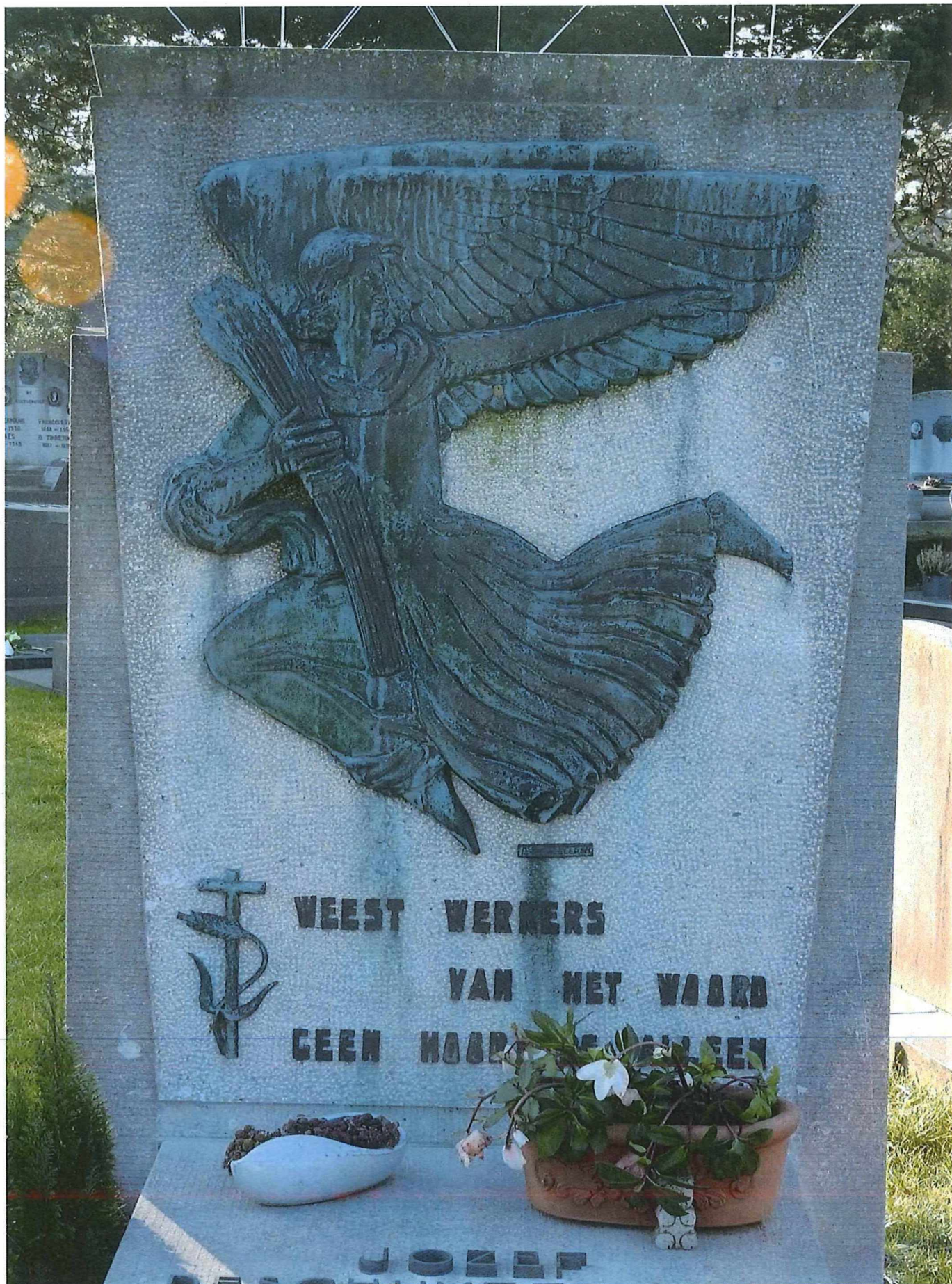
2. Het graf en grafteken Deschuyffeleer, stèle met sculptuur van Oscar De Clerck en de tekst uit Jacobus, 1