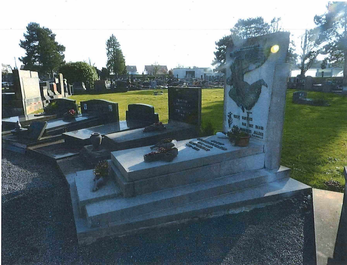
5. Het graf en grafteken Deschuyffeeler, totaalbeeld met context