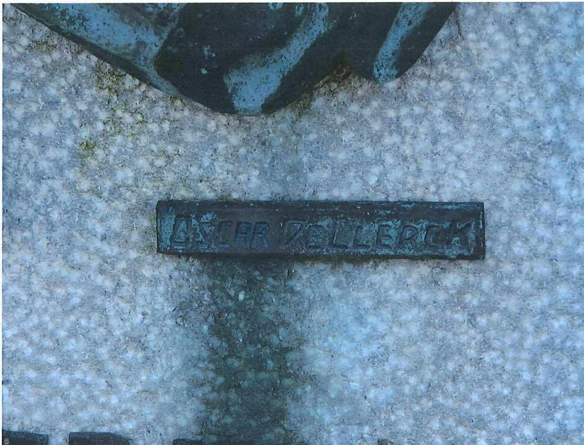
3. Het graf en grafteken Deschuyffeeler, stèle met signatuur van Oscar De Clerck