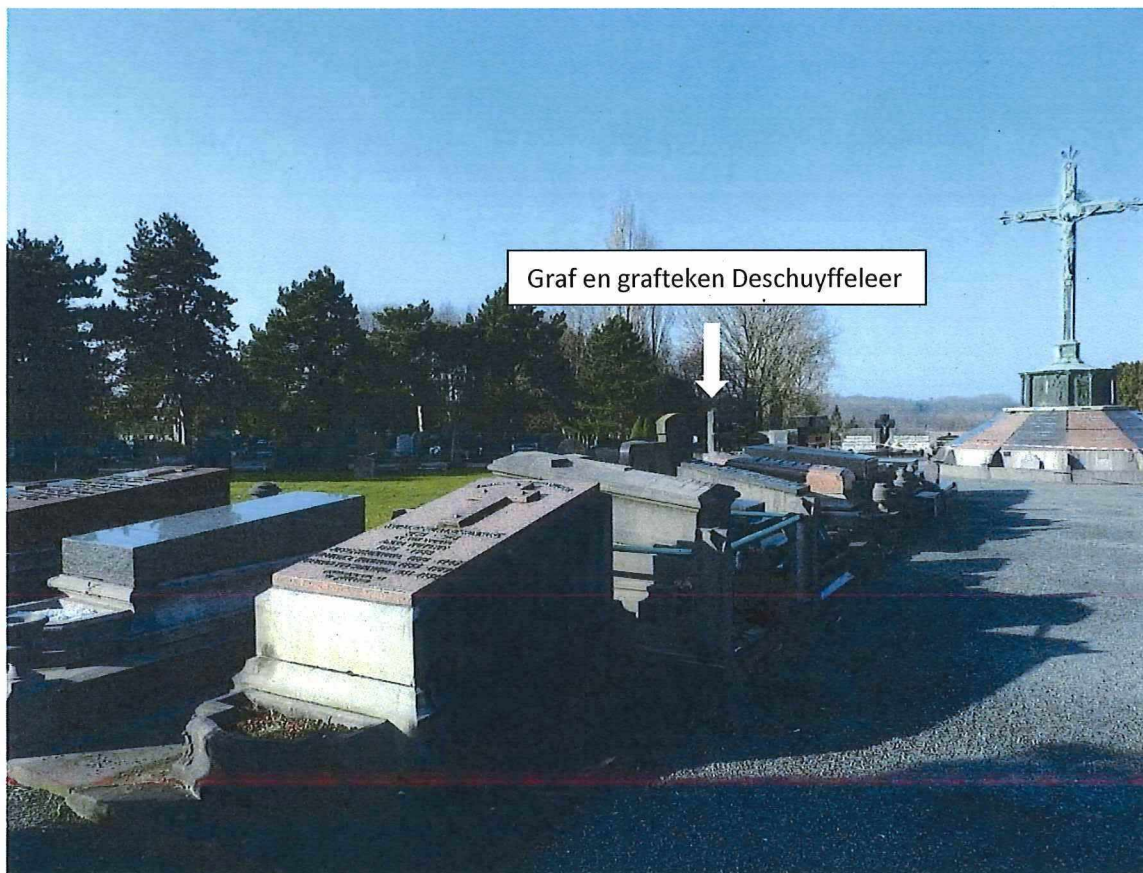
6. Het graf en grafteken Deschuyffeeler, totaalbeeld met context waaronder de calvarie