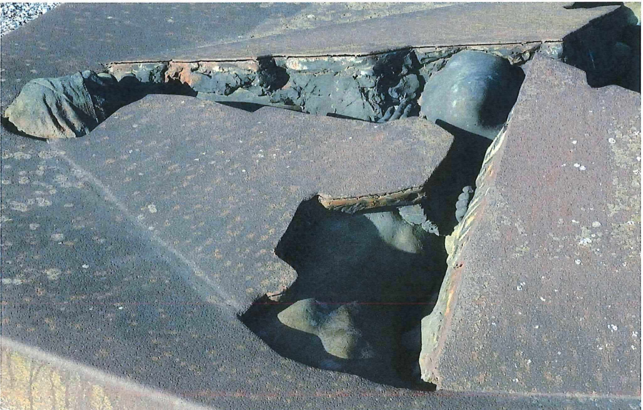
6. Het grafteken Pincket, detail