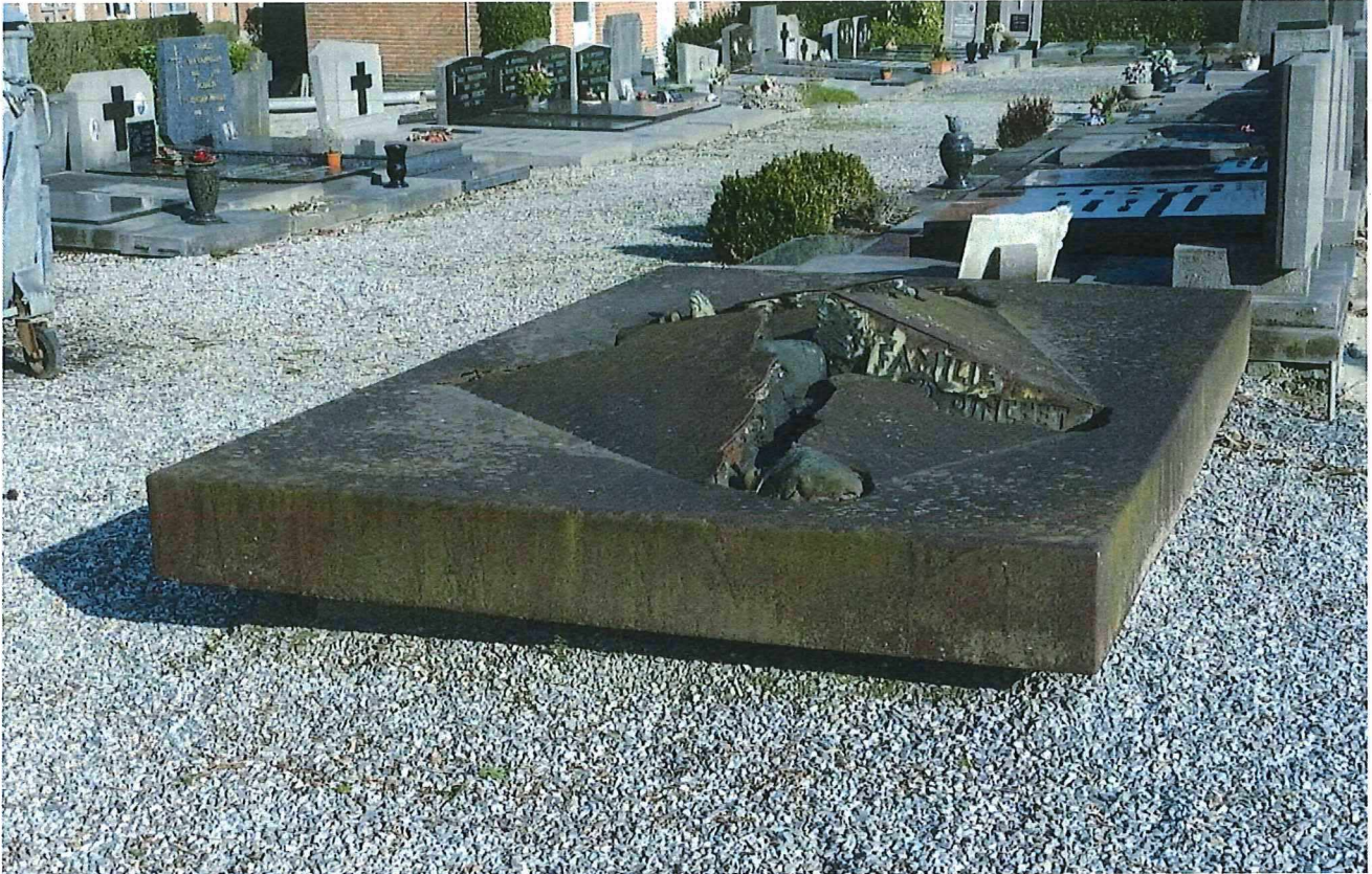
1. Het grafteken Pincket, totaalbeeld