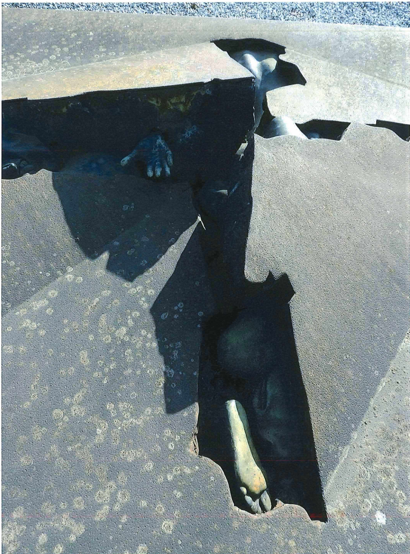
4.Het grafteken Pincket, detail