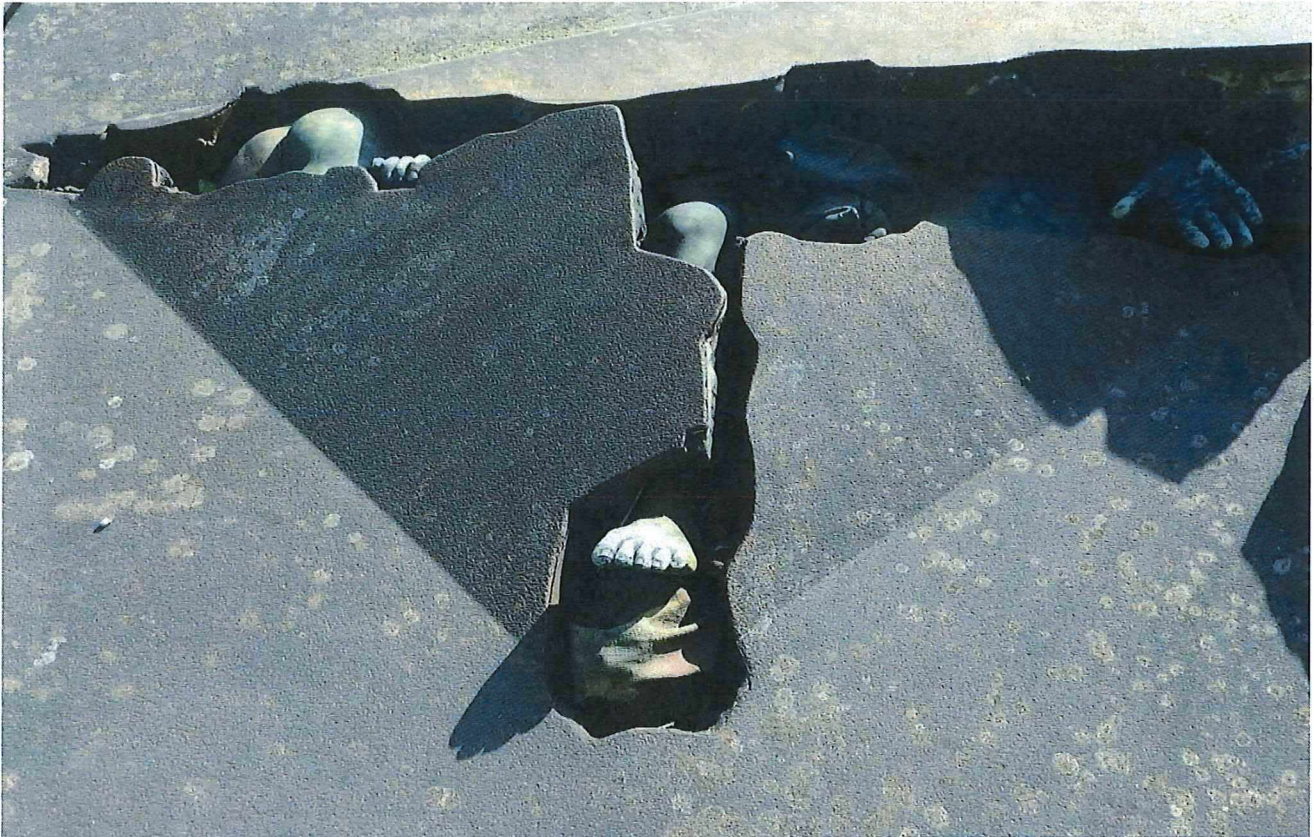
5. Het grafteken Pincket, detail