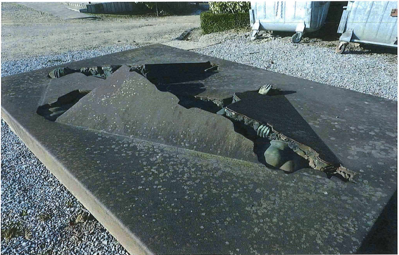
7. Het grafteken Pincket, detail