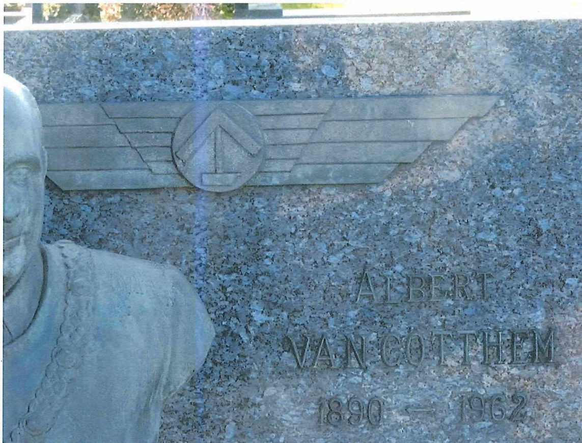
4. Detail opgelegde epigrafie