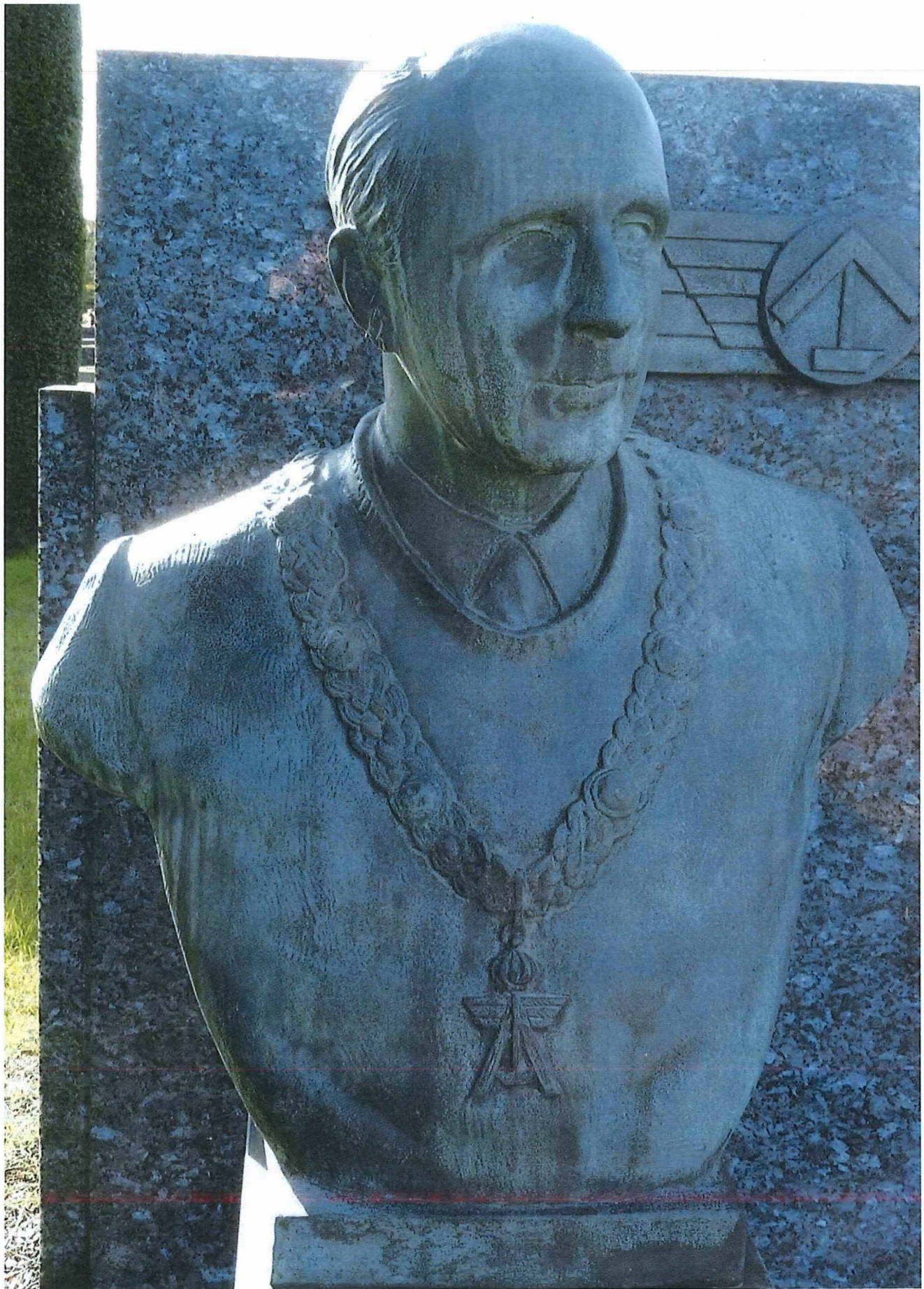
3. Bronzen buste