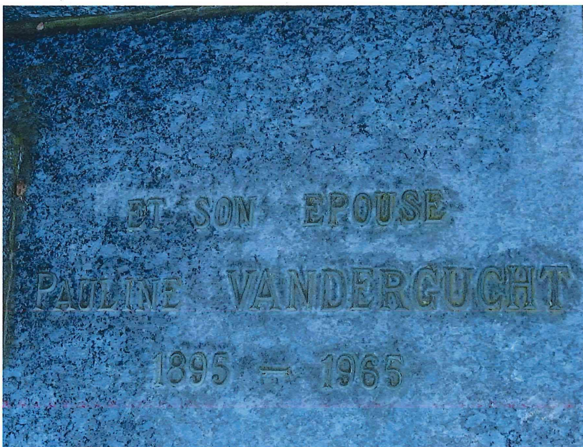
5. Detail opgelegde epigrafie