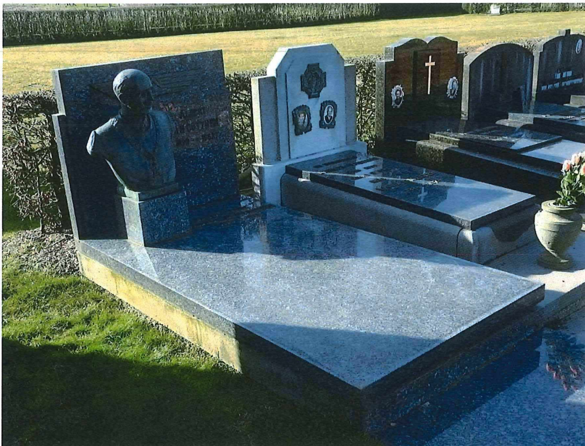
1. Totaalbeeld van het grafteken.