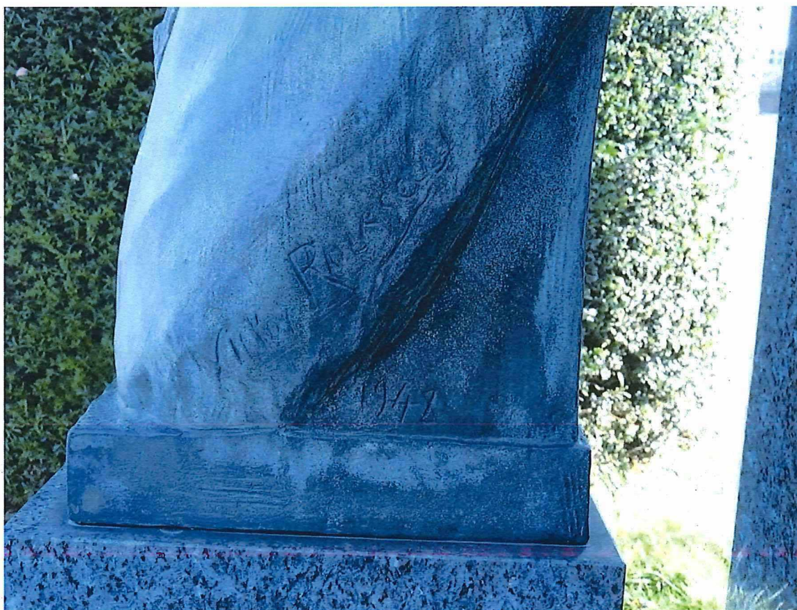
2. Signatuur en datum op het borstbeeld