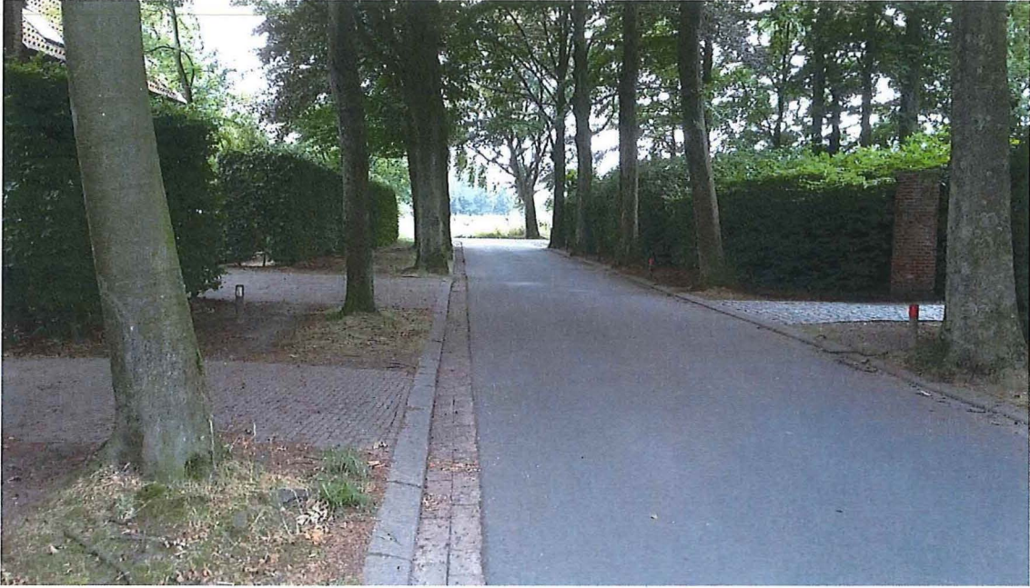
Foto 3: Solhofdreef langs zuidoostzijde van park Solhof, met inboetingen iets verder van de weg (links)