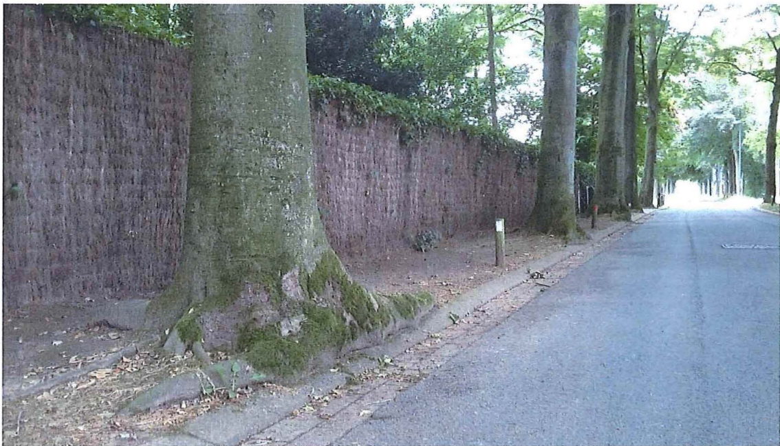
Foto 4: Solhofdreef langs zuidoostzijde van park Solhof, met overgroeiingen van de stoeprand door de oude bomen