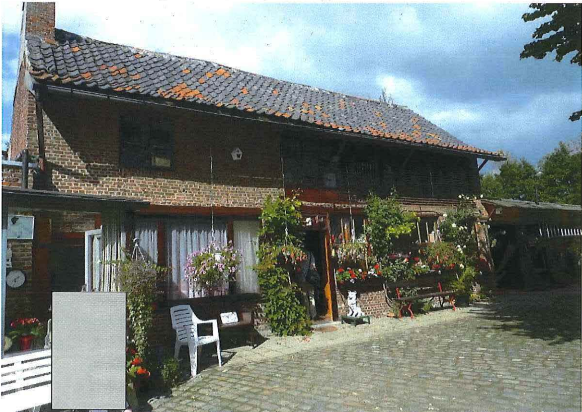
Foto 14: Voormalige blokstal. Voorgevel. Ter vergelijking toestand 5 september 2012.