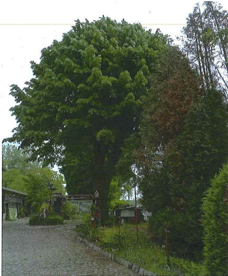
Foto 24: Lindeboom op achtererf ten zuiden van rookoven en lagere werkhuis. Toestand 26 mei 2019.