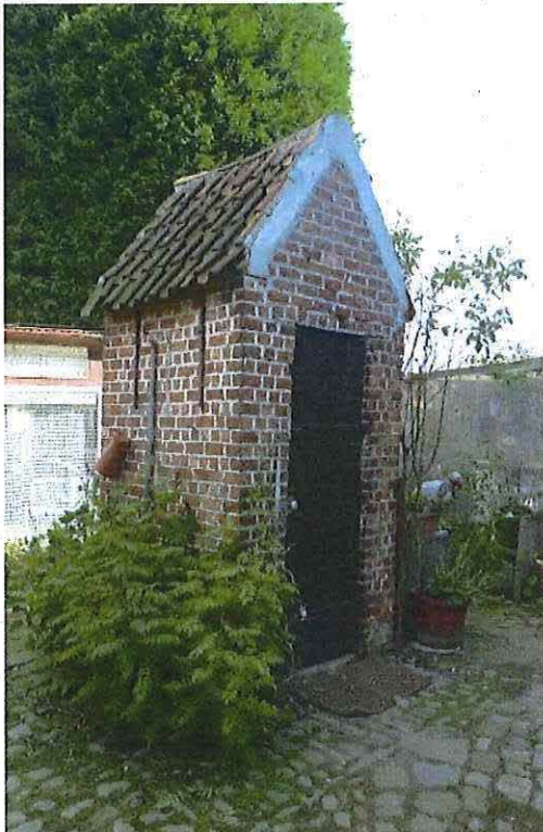
Foto 29: Rookoventje op achtererf. Ter vergelijking toestand 5 september 2012.