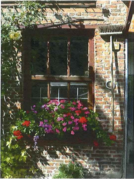
Foto 18: Voormalige blokstal. Venster begane grond. Toestand 5 september 2012.