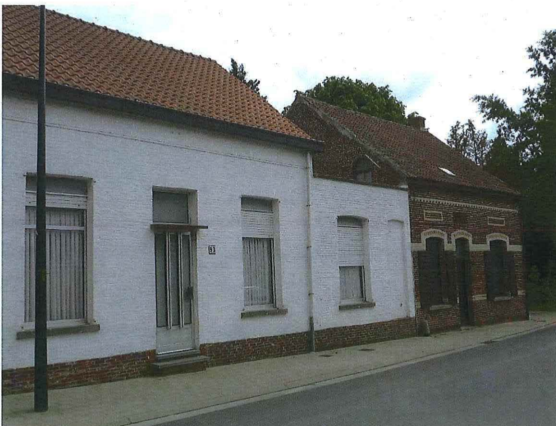
Foto 2: Zicht op Daalstraat 93 (wit huis) en 91 (rode baksteenbouw en voormalige klompenmakerij De Kimpe). Toestand 26 mei 2019.