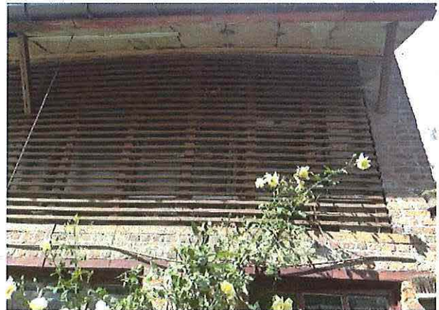
Foto 21: Voormalige blokstal. Zolderverdieping. Kenmerkende droogconstrutie.in stijl- en regelwerk. Toestand 5 september 2012.