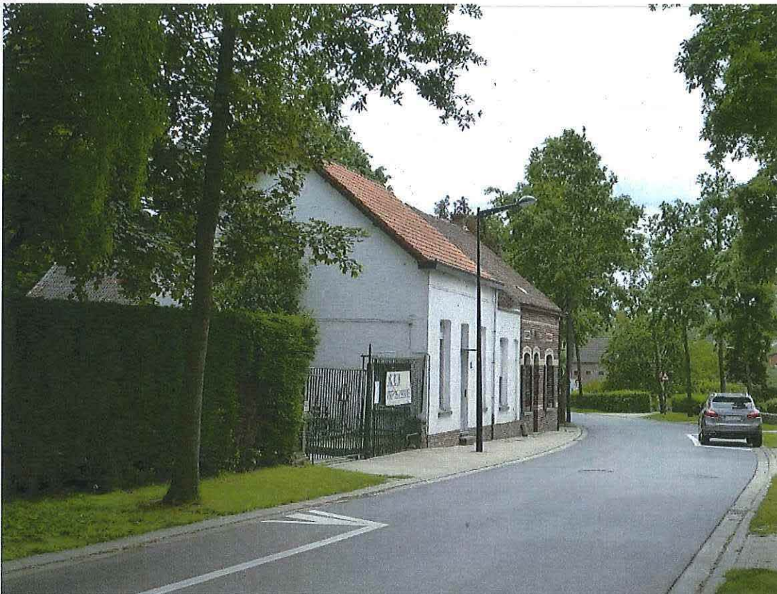
Foto 1: Zicht op Daalstraat. De voormalige klompenmakerij De Kimpe is het tweede huis aan de linkerkant van de straat. Toestand 26 mei 2019.