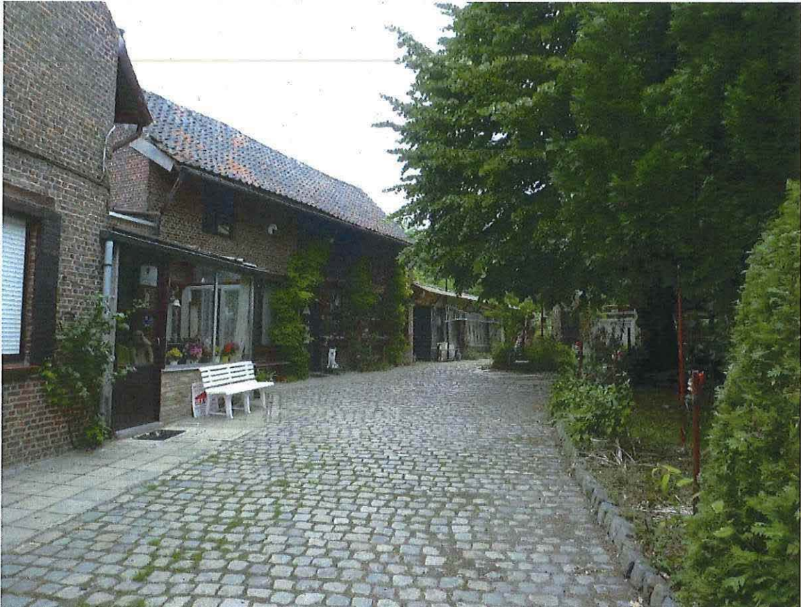
Foto 9: Voormalige blokstal van 1918 met lager werkhuis, aan verharde oprit (met jongere kasseien) en lindeboom bij rookoven op het achtererf. Toestand 10 juli 2017.