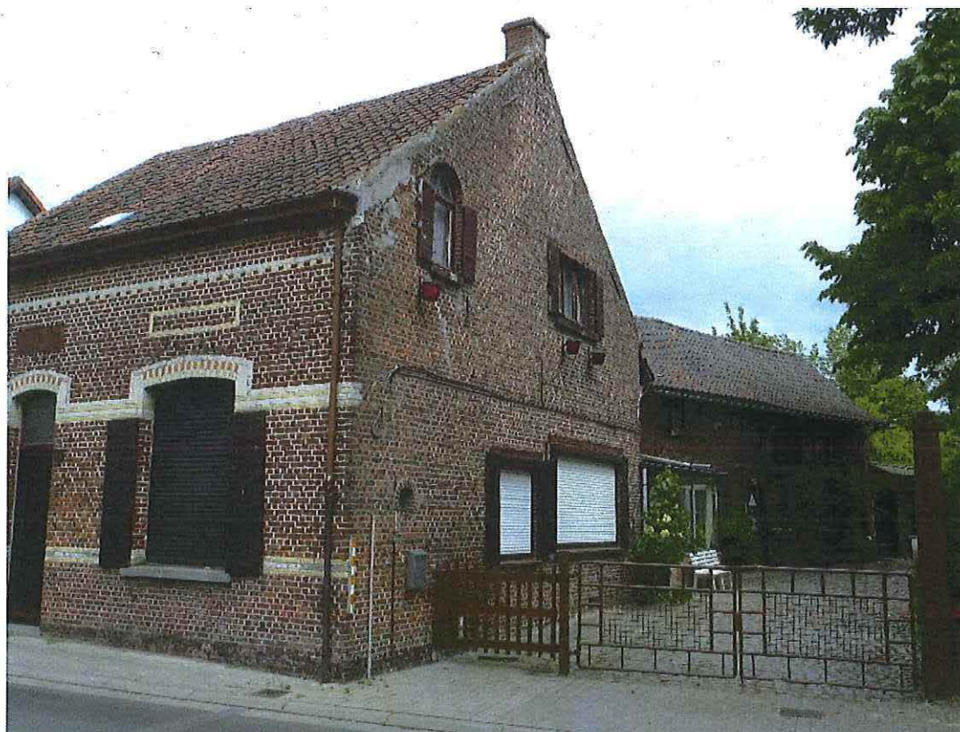
Foto 6: Woonhuis. Zuidelijke zijgevel met rond venstertje op de begane grond en rondbogig in de puntgeveltop. Toestand 26 mei 2019.