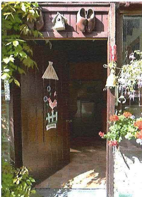
Foto 16: Voormalige blokstal. Voordeur gevat in houten omlijsting. Toestand 5 september 2012.