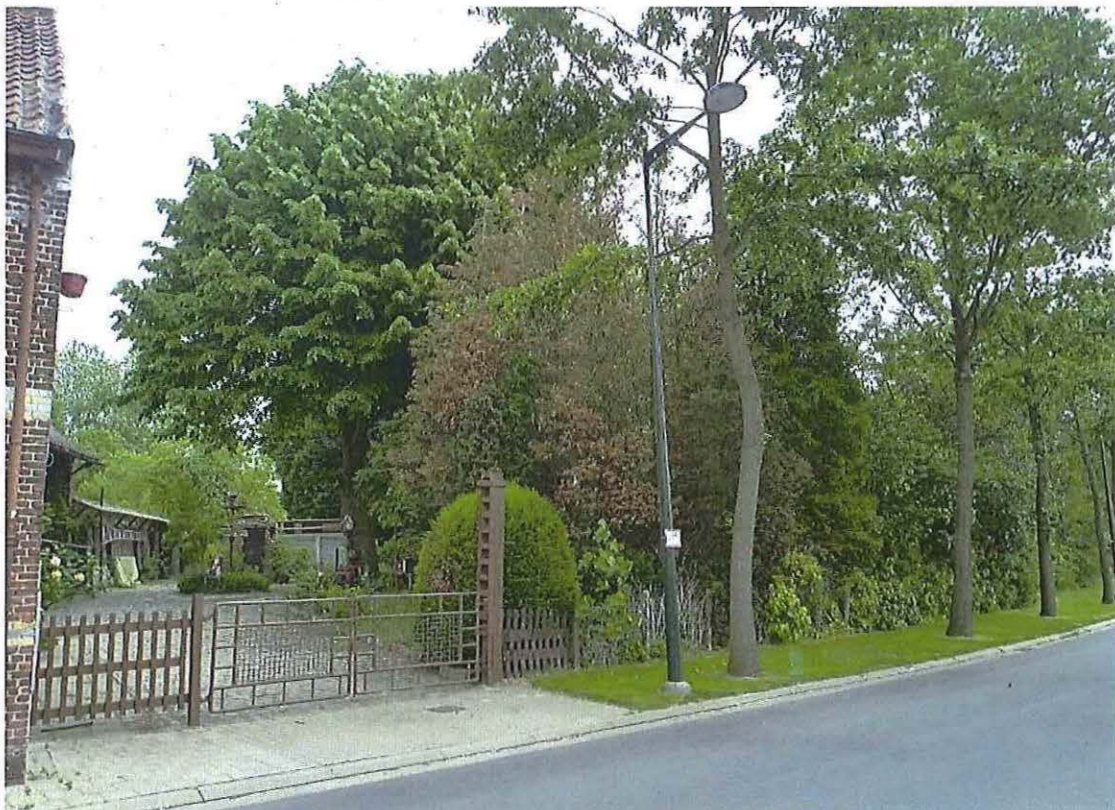
Foto 8: Woonhuis met achterin de blokstal met werkhuis, de verharde oprit met rookoven, lindeboom en voortuinstrook die naar verluidt vroeger ook voor houtopslag werd gebruikt. Toestand 26 mei 2019.