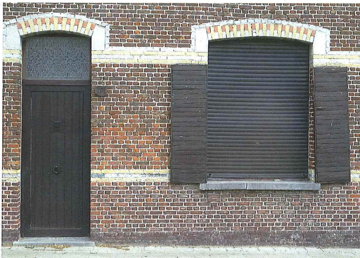
Foto 5: Woonhuis. Detail decoratief metselwerk. Toestand 26 mei 2019.