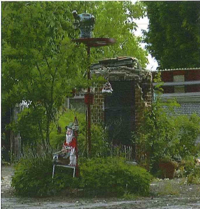
Foto 27: Rookoven op achtererf. Punttop beschadigd. Sokkel en deur behouden. Toestand 26 mei 2019.