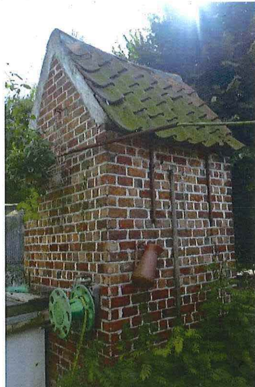
Foto 30: Rookoventje op achtererf. Ter vergelijking toestand 5 september 2012.