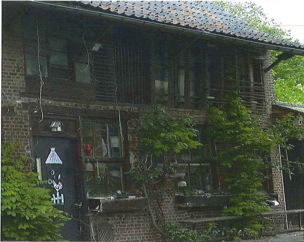
Foto 13: Voormalige blokstal. Voorgevel. Detail. Toestand 26 mei 2019.