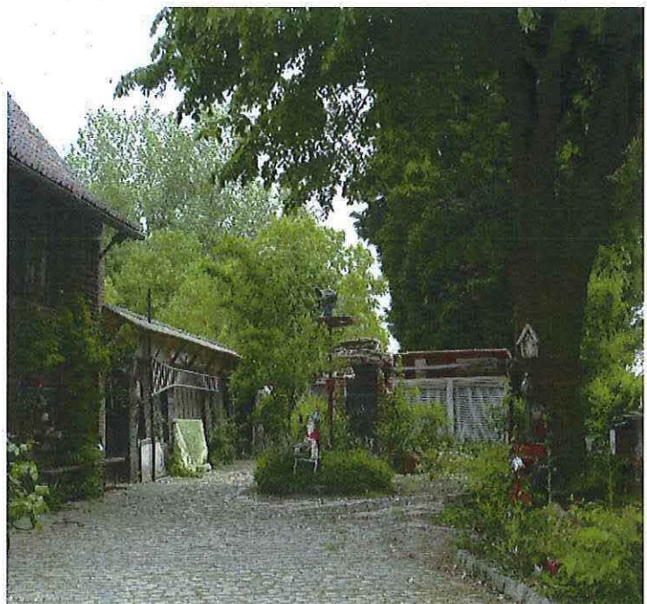
Foto 26: Lindeboom op achtererf ten zuiden van beschadigde rookoven aan verharde oprit. Toestand 26 mei 2019.