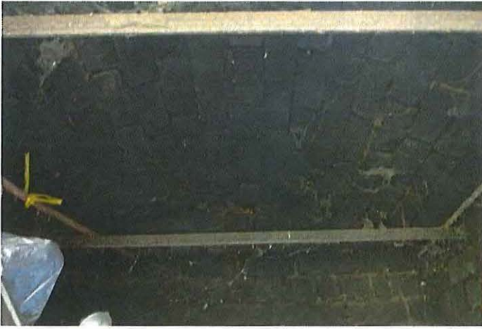
Foto 31: Rookoventje. Binnenkant. Gewelf. Toestand 5 september 2012.