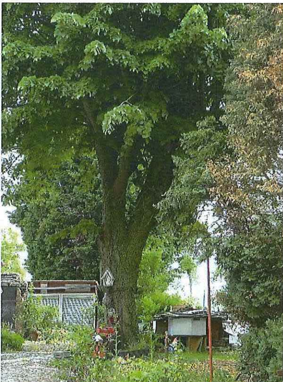
Foto 25: Lindeboom op achtererf. Detail. Verspringing stamdikte net onder boomkapelletje. Toestand 26 mei 2019.