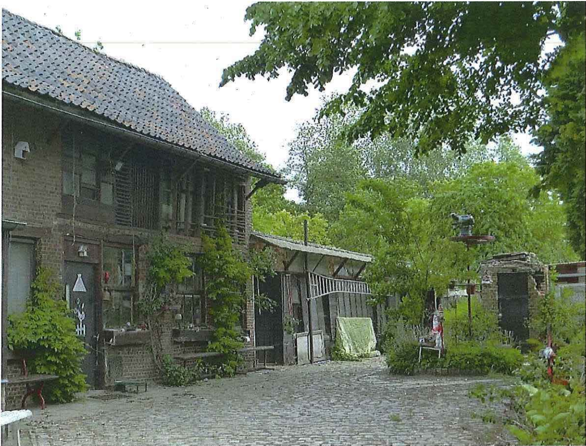
Foto 11: Voormalige blokstal met aangebouwd lager werkhuis (links). Vrijstaand beschadigd rookoentje en bladerdek van lindeboom (rechts). Toestand 26 mei 2019.