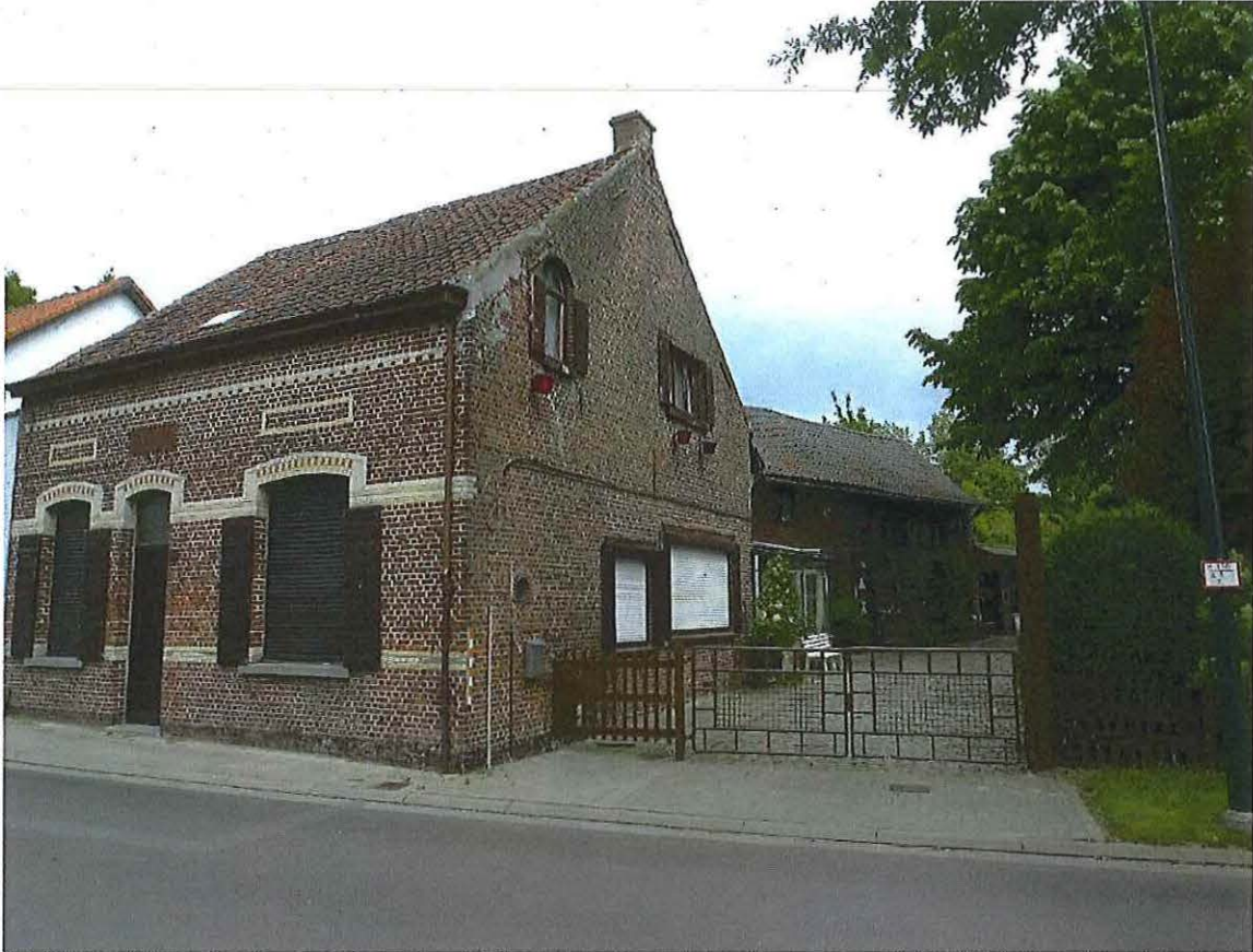
Foto 7: Woonhuis met verharde oprit (met jongere kasseien) en zone voor houtstockage rechts, blokstal en werkhuis achterin. Toestand 26 mei 2019.