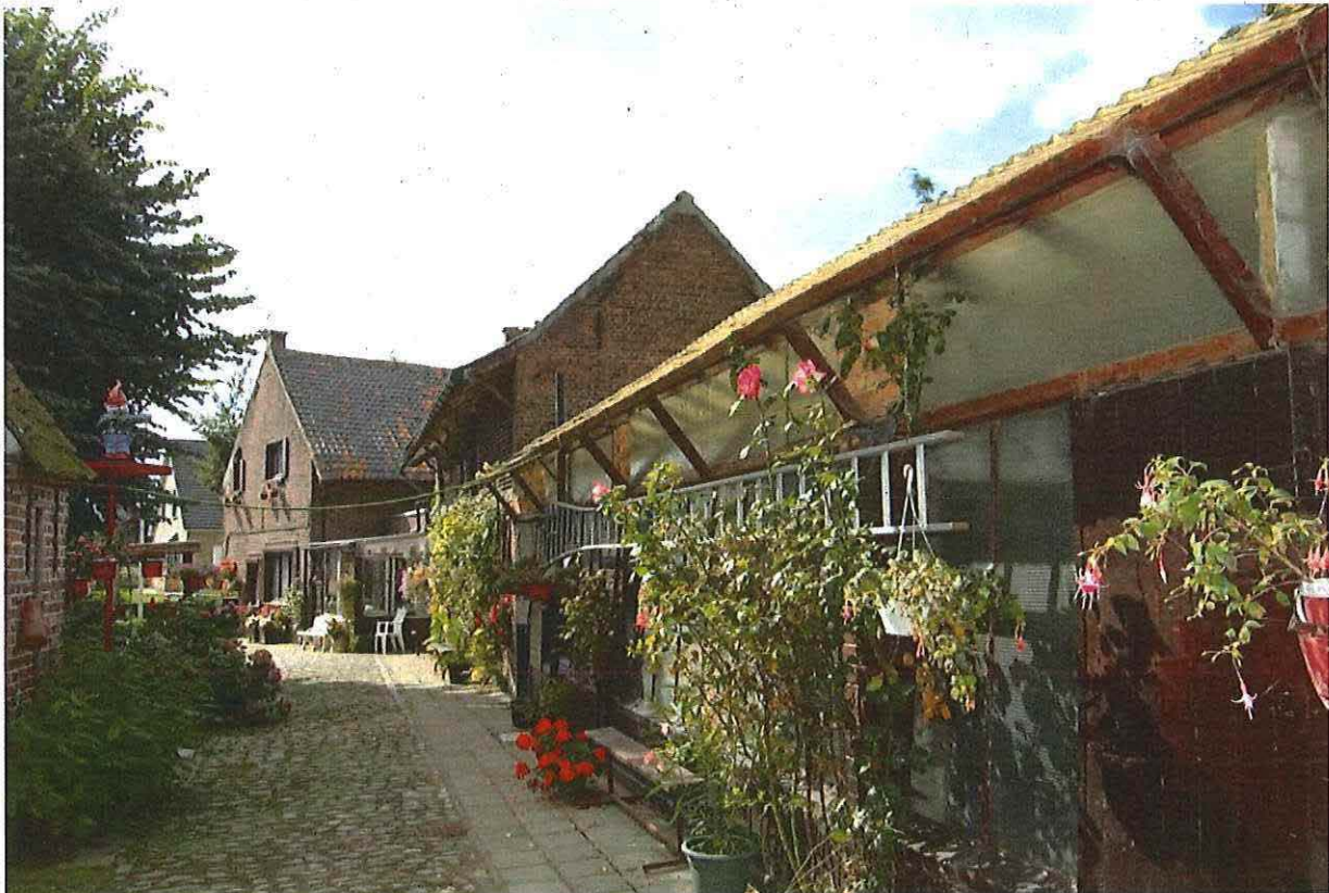
Foto 23: Aangebouwd lager werkhuis met zicht op blokstal en woonhuis en gekasseide oprit (rechts) en rookoventje en deel van kruin lindeboom (links). Toestand 5 september 2012.