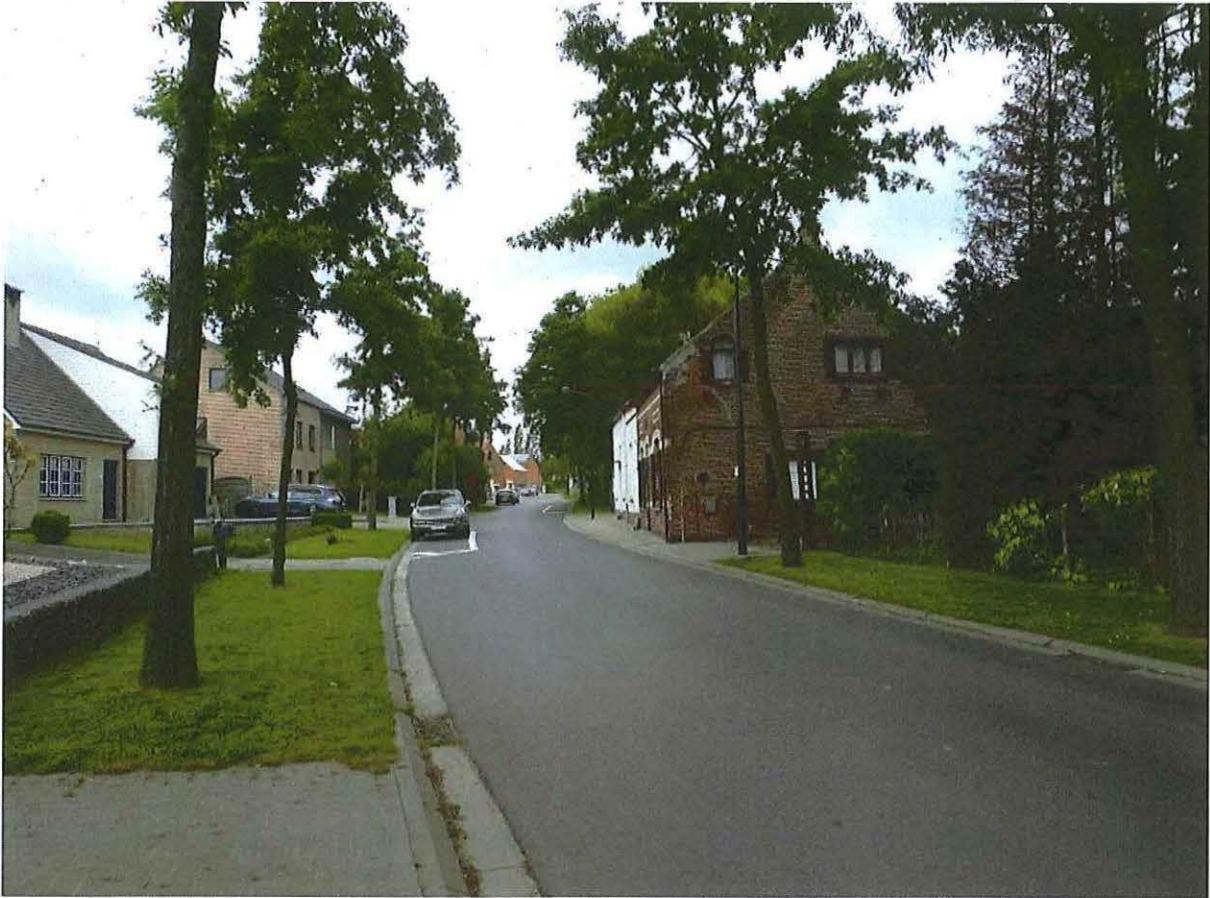
Foto 3: Zicht op Daalstraat. Voormalige klompenmakerij De Kimpe is eerste woning rechts. Woonhuis gebouwd in 1912, met oprit ervoor. Toestand 26 mei 2019.