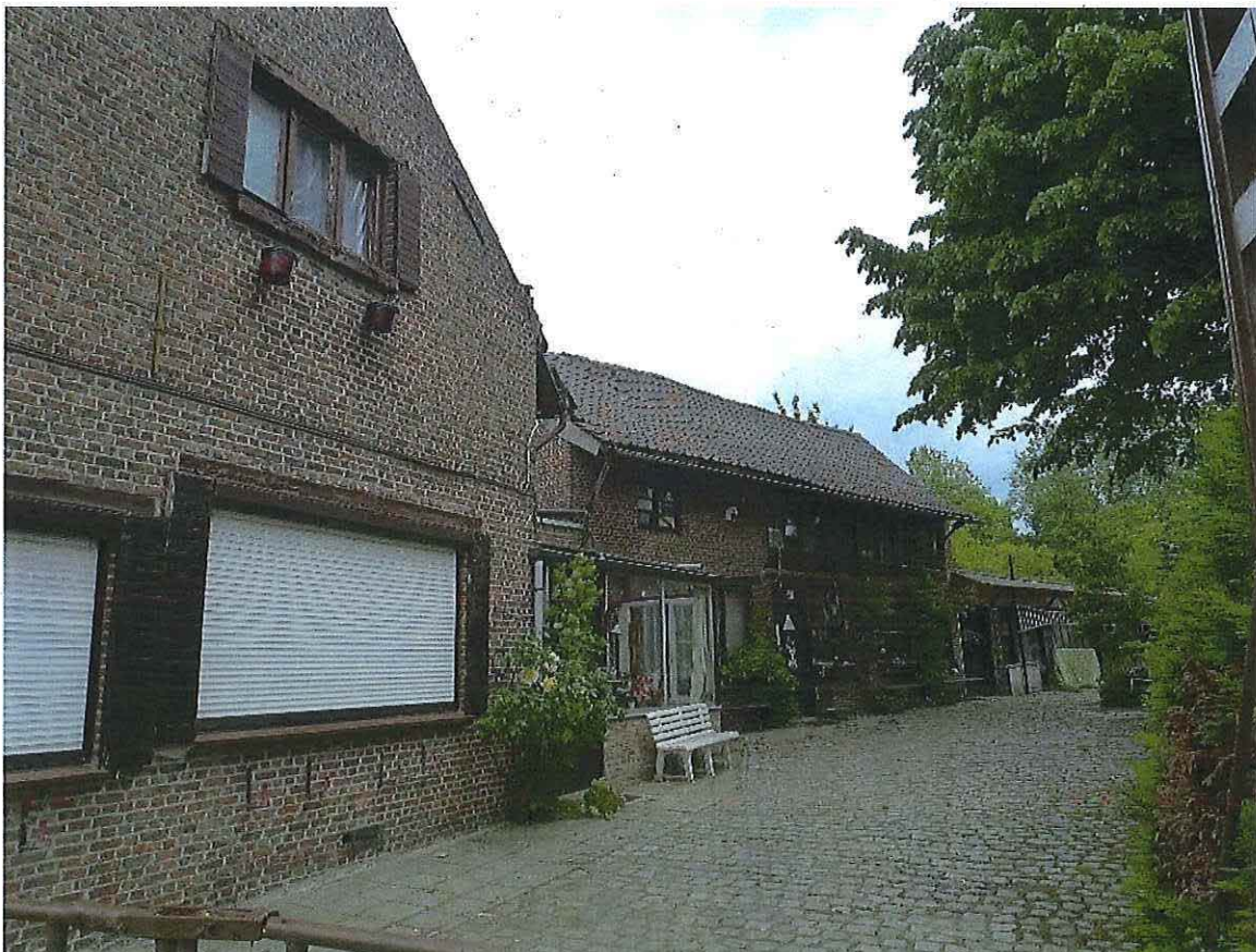
Foto 10: Zijgevel woonhuis. Met voormalige blokstal van 1918 en lager werkhuis op achtererf, aan verharde oprit (met jongere kasseien). Kruin lindeboom. Toestand 26 mei 2019.