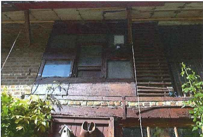
Foto 20: Voormalige blokstal. Zolderverdieping deels opgevuld met houtwerk. Toestand 5 september 2012.