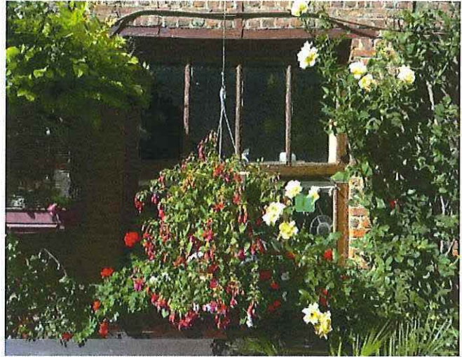
Foto 19: Voormalige blokstal. Venster begane grond. Toestand 5 september 2012.