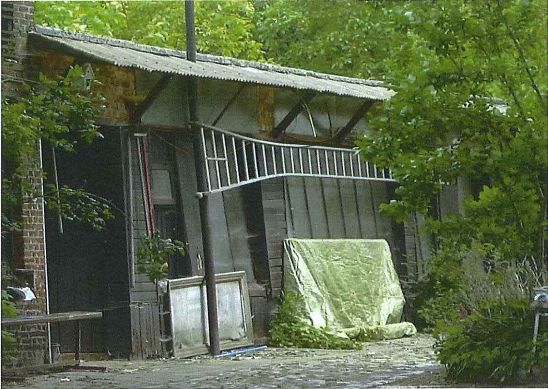
Foto 22: Aangebouwd lager werkhuis. Voorgevel. Toestand 26 mei 2019.