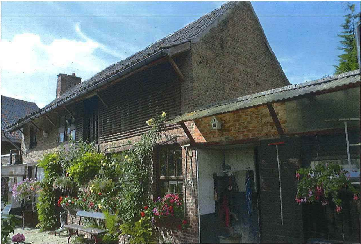
Foto 15: Voormalige blokstal. Voorgevel. Ter vergelijking toestand 5 september 2012.