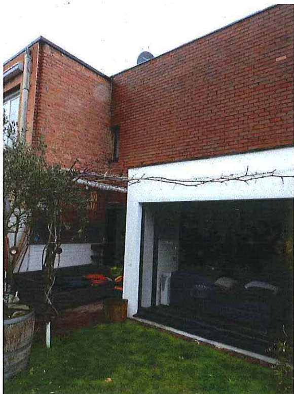
Foto 7: Detail achtergevel met terras voor living (28 maart 2018)