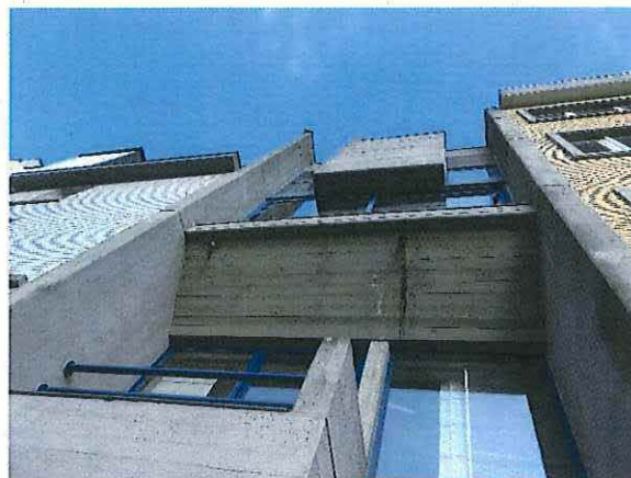
Foto 5: Woning De Zordo – detail van de voorgevel, 23 februari 2018