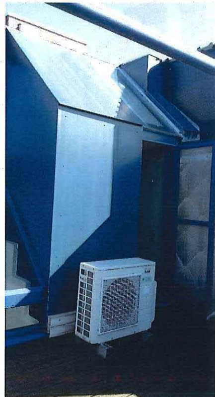
Foto 10: Woning De Zordo – buitengevel dakterras, 10 augustus 2018