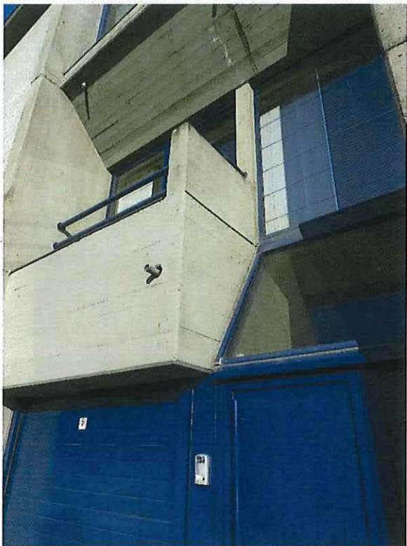
Foto 4: Woning De Zordo – detail van de voorgevel, 23 februari 2018