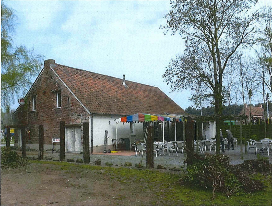
Foto 8: Voormalige afspanning Sint-Sebastiaan, zuid- en achtergevel (21/04/2017)