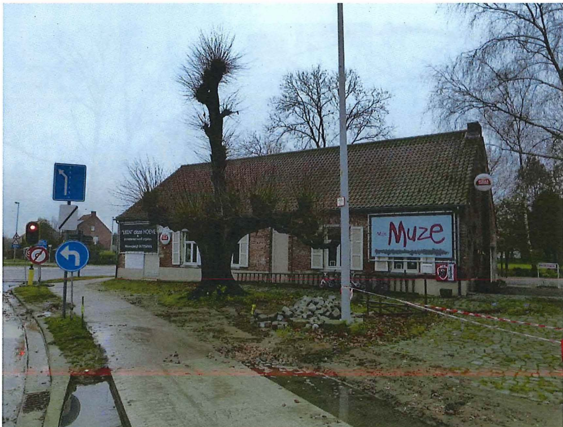
Foto 5: Etageleinde met voormalige afspanning Sint-Sebastiaan en recent aangelegd fietspad (29/11/2017)