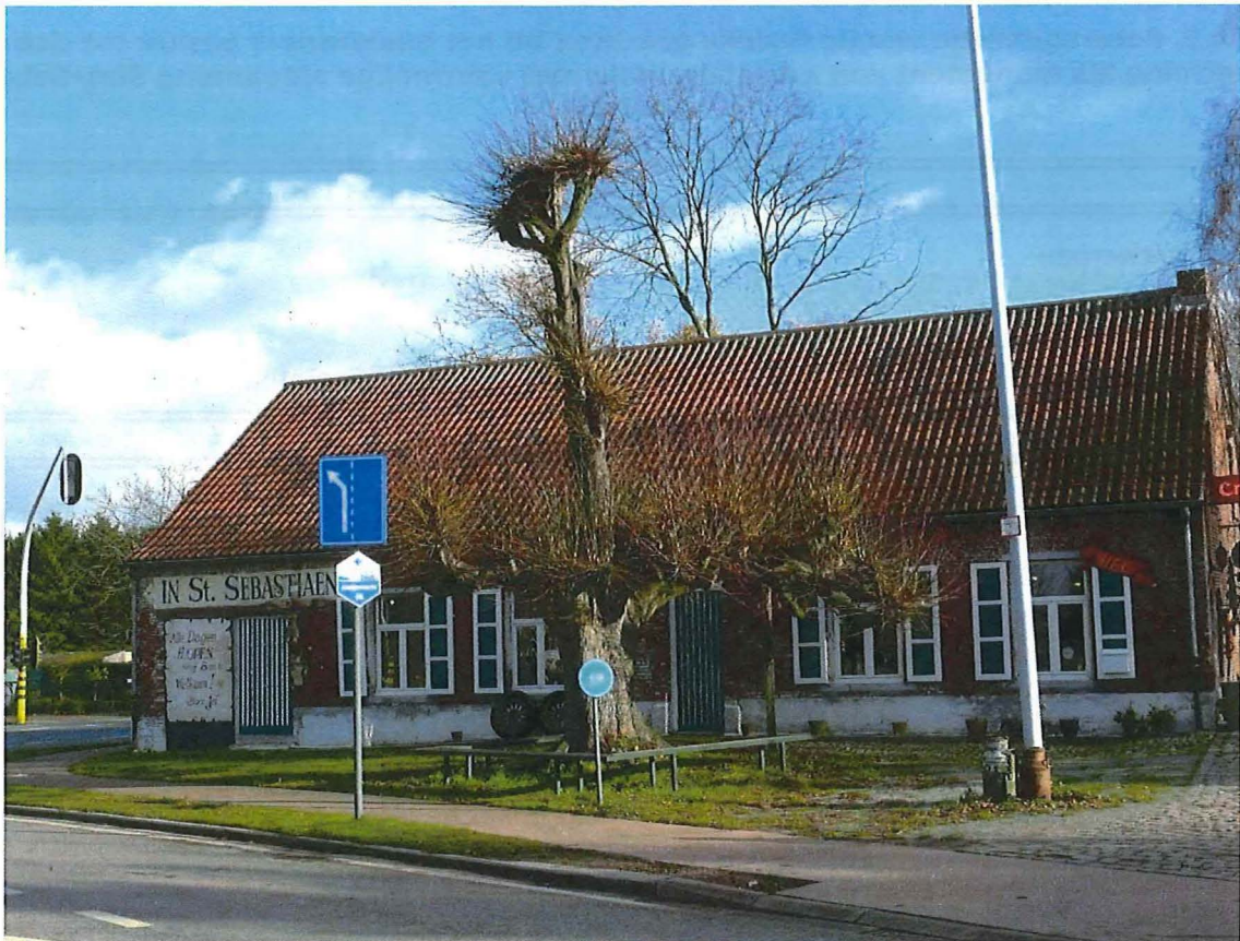
Foto 1: Etagelinde met voormalige afspanning Sint-Sebastiaan (29/11/2012)