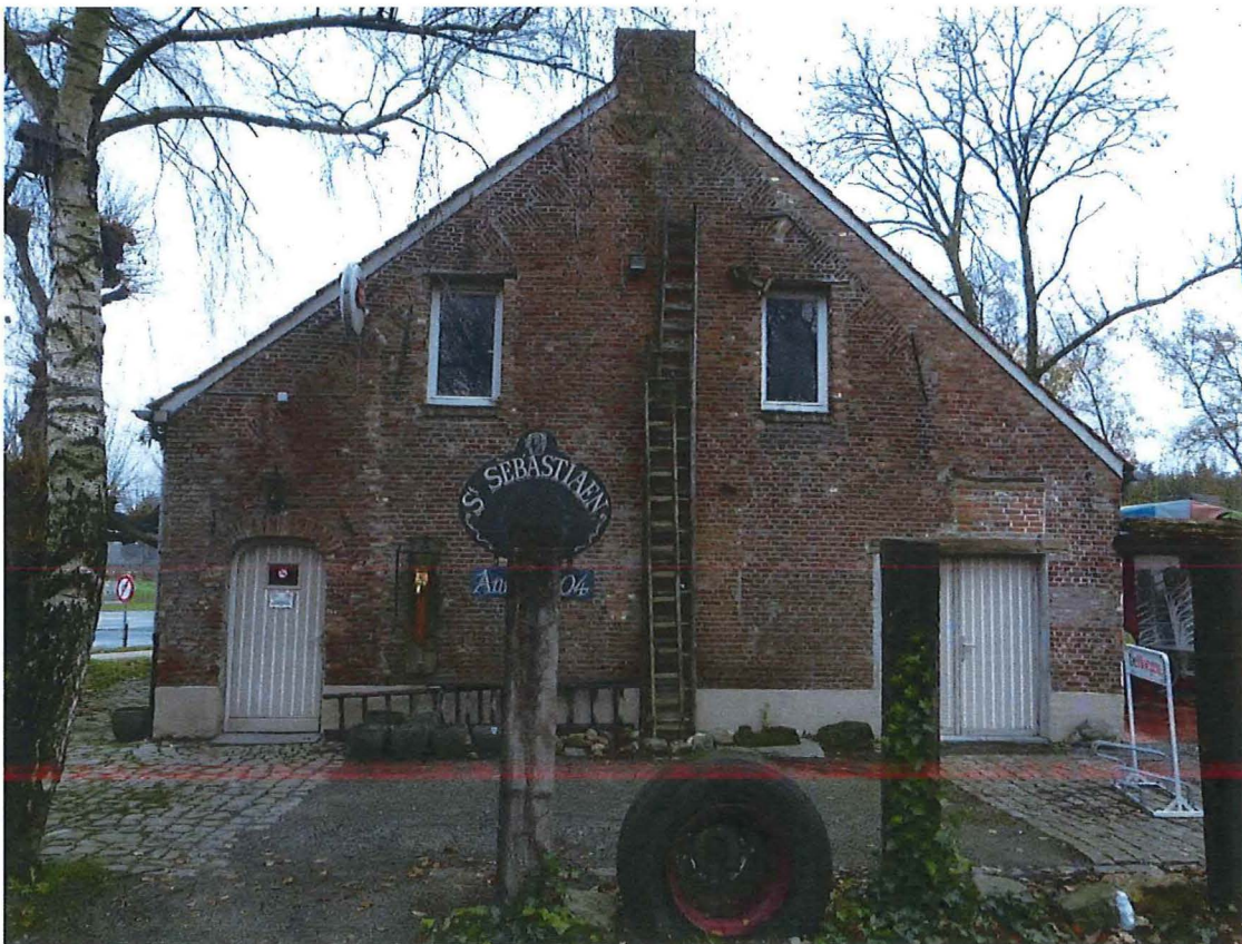
Foto 7: Voormalige afspanning Sint-Sebastiaan, zuidgevel (29/11/2017)