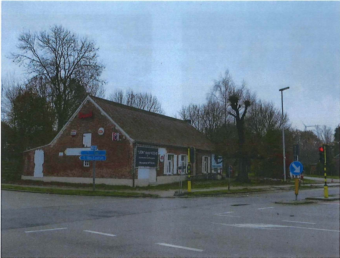
Foto 6: Kruispunt met etagelinde en voormalige afspanning Sint-Sebastiaan (29/11/2017)