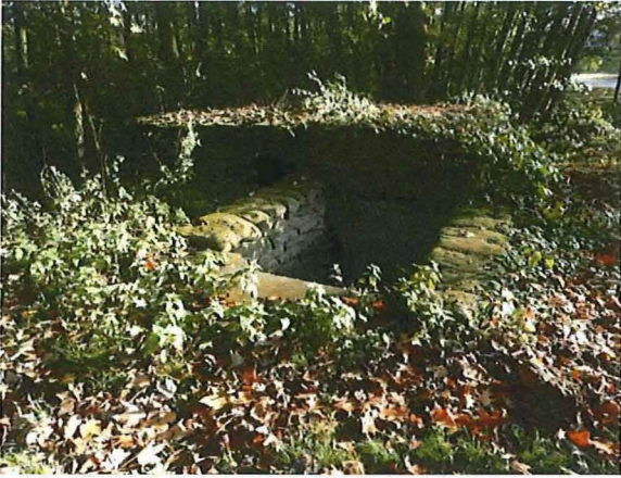
Foto 24: Zicht op de westelijke toegang, waar recent een trap tussen zandzakjes is aangelegd. In de toegang is recent een ijzeren deur met invlieggleuf voor vleermuizen geplaatst.