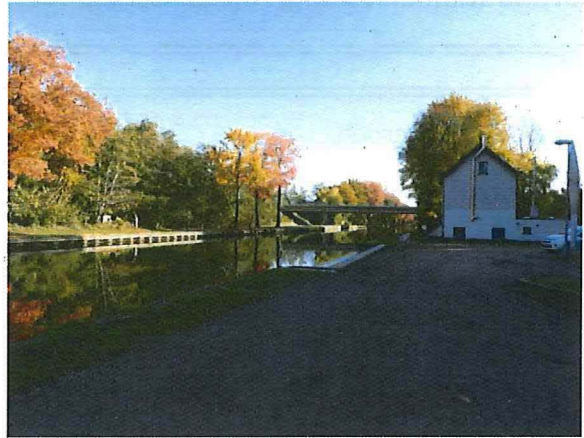
Foto 2: Zicht vanuit westelijke richting op het kanaal, ter hoogte van de voormalige Brug 3. Rechts het brugwachtershuisje, links de site van het voormalige bruggenhoofd met bunkers. Op de achtergrond is de huidige brug van de R13 te zien.