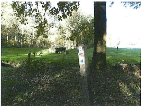
Foto 8: De bunker vanuit zuidoostelijke richting, langs Wieltjes loopt een wandelpad.