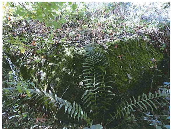
Foto 4: Zicht op de noordoostelijke hoek van de bunker. De randen van het dak zijn schuin afgewerkt.