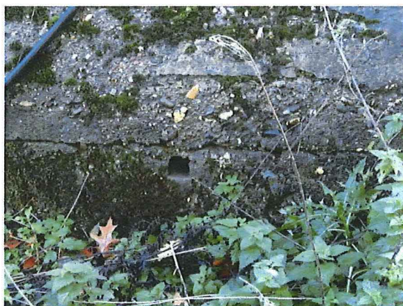
Foto 11: Het kleine waarnemingsgaatje aan de noordwestelijke voorzijde.