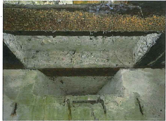
Foto 20: Zicht op de rechthoekige uitsparing in het plafond boven de observatiegleuf.