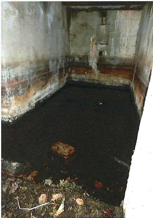
Foto 7: Zicht in de oostelijke binnenruimte. Onderaan de doorgang zijn bakstenen gemetst.