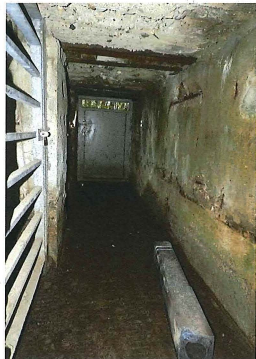
Foto 27: De gang van de bunker is de voorbije jaren ingericht in functie van openstelling en vleermuizenschuilplaats.