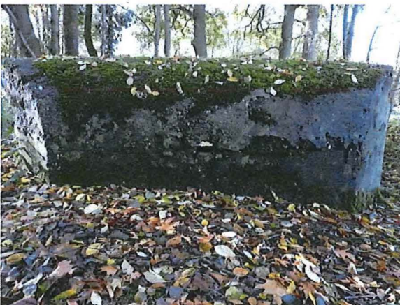
Foto 17: De gebogen frontzijde met kleine waarnemingsopening aan noordoostelijke zijde.