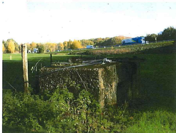
Foto 9: De bunker vanuit zuidwestelijke richting, met op de achtergrond de R13.