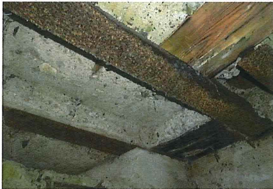
Foto 21: Zicht op het plafond, met rechthoekige uitsparing en opening met buis uit grès. Tussen de stalen profielen zitten nog houten planken.