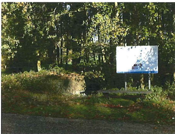
Foto 22: Zicht op de bunker vanaf het jaagpad. Bij de recente ontsluiting van de bunker is een informatiebord en zitbank geplaatst.