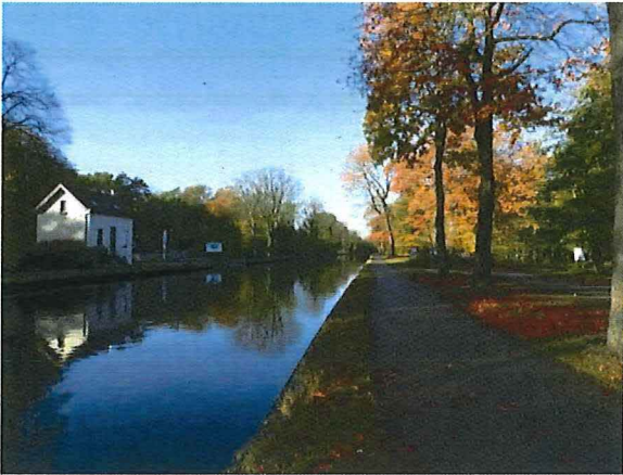
Foto 1: Zicht vanuit oostelijke richting op het kanaal tussen Turnhout en Schoten, ter hoogte van de voormalige Brug 3. Links het brugwachtershuisje, rechts langs het jaagpad de site van het voormalige bruggenhoofd met bunkers.