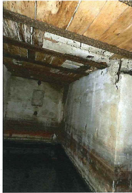
Foto 6: Zicht in de westelijke binnenruimte. Tegen het plafond zitten houten planken. In de frontmuur zit een nis, met bovenaan en onderaan een ijzeren buis.