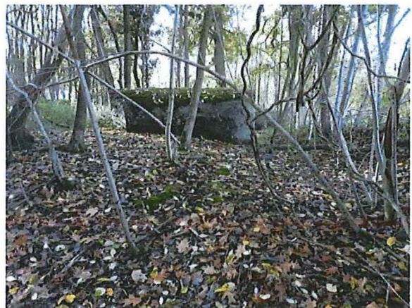
Foto 18: Zicht op het microreliëf aan de noordoostelijke zijde van de bunker.