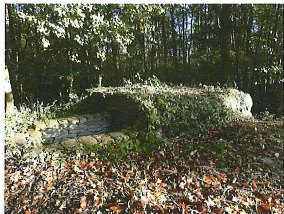
Foto 23: Zicht op de bunker vanaf zuidwestelijke hoek. Bij de ontsluiting van de bunker is een trap, geflankeerd door zandzakjes aangelegd.