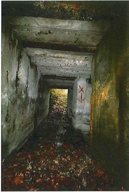
Foto 5: Zicht in de gang van de bunker, met rechts de doorgangen tot de binnenruimtes. De verticale betonnen randen van de doorgangen zijn afgewerkt met een schuine boord.