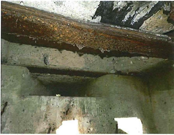
Foto 14: De observatiegleuf aan de binnenzijde versmalt tot een klein gaatje aan de buitenzijde. Tegen het plafond zijn stalen profielen en restanten van houten planken te zien.