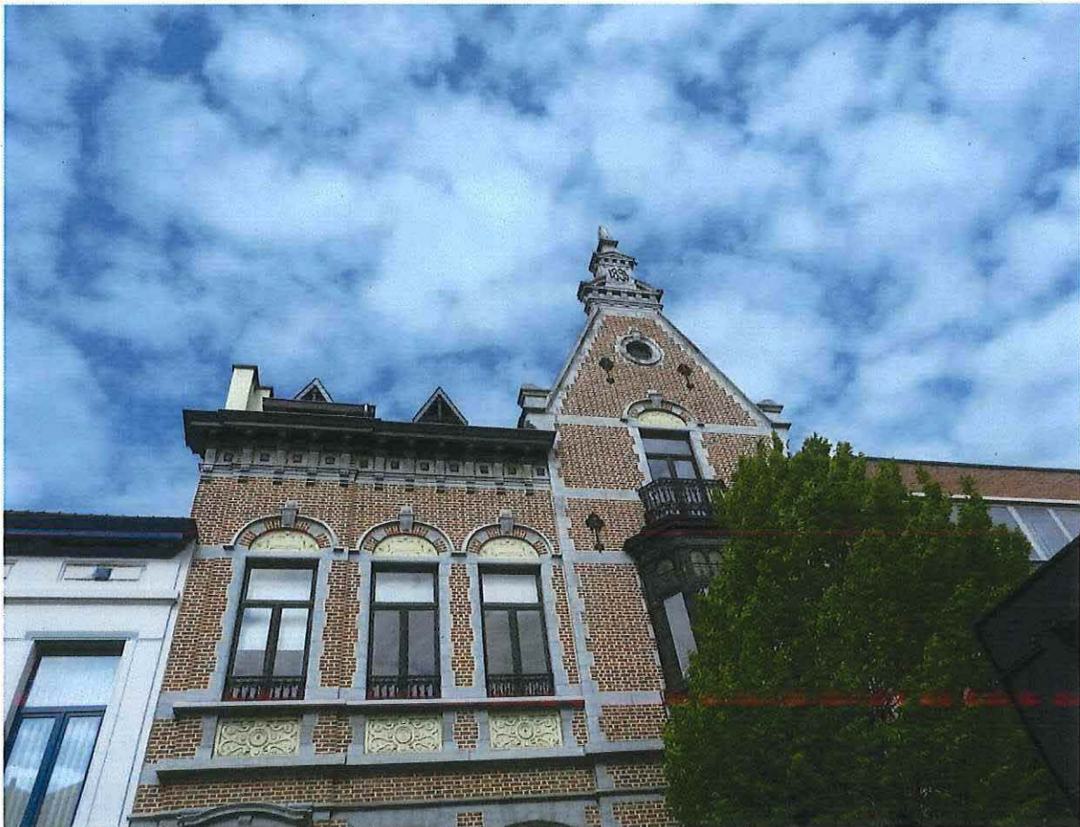
Foto 3: Lijst- en puntgevel met geveltop van de herenwoning Delacre (24 april 2017).