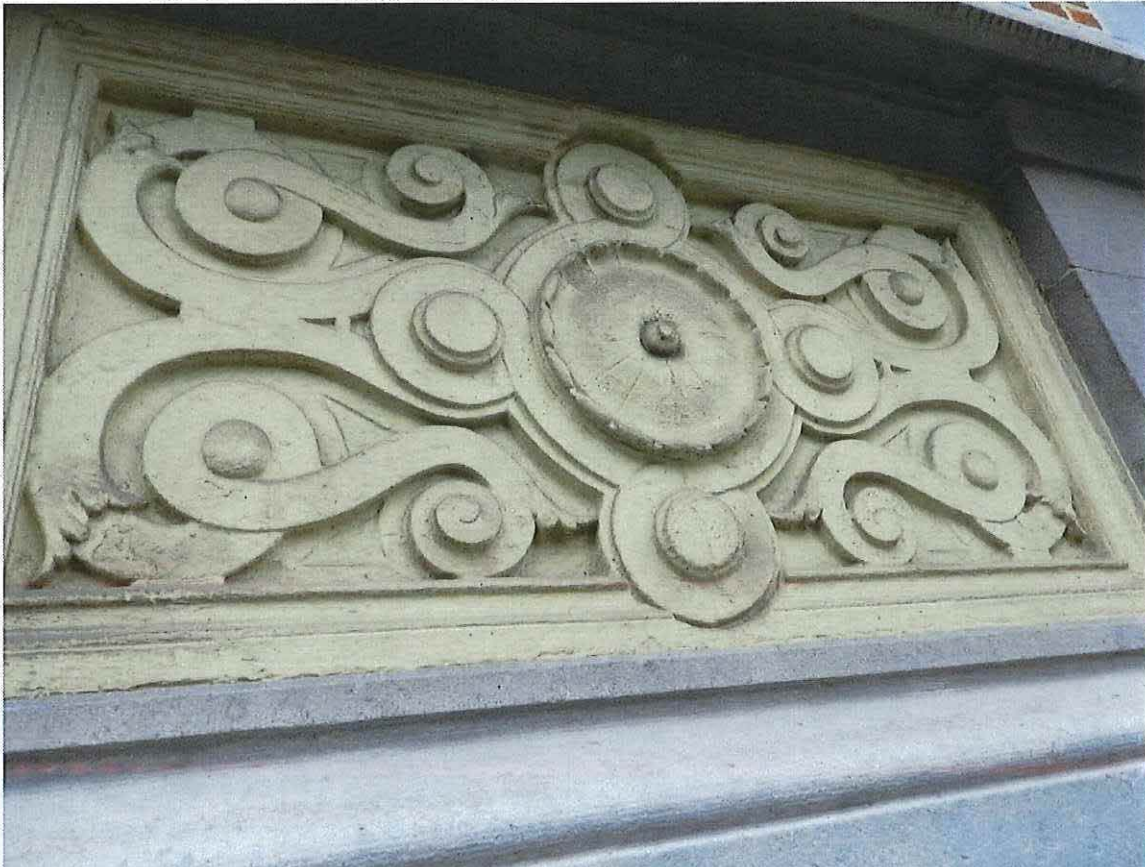
Foto 12: Detail decoratief stucwerkpaneel in de borstwering van de raampartijen in de eerste bouwlaag (18 juni 2018).