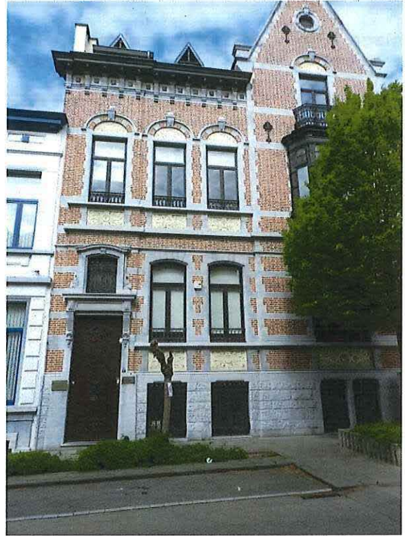
Foto 2: Voorgevel van de herenwoning Delacre in de Van Helmontstraat 2 (24 april 2017).