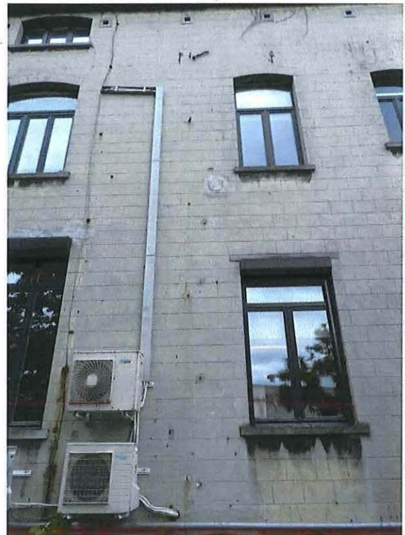
Foto 17: Detail middelste travee achtergevel herenwoning Delacre (18 juni 2018).