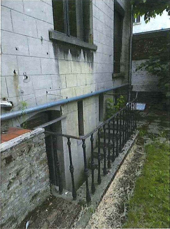
Foto 21: Detail keldertrap met balusterborstwering (18 juni 2018).