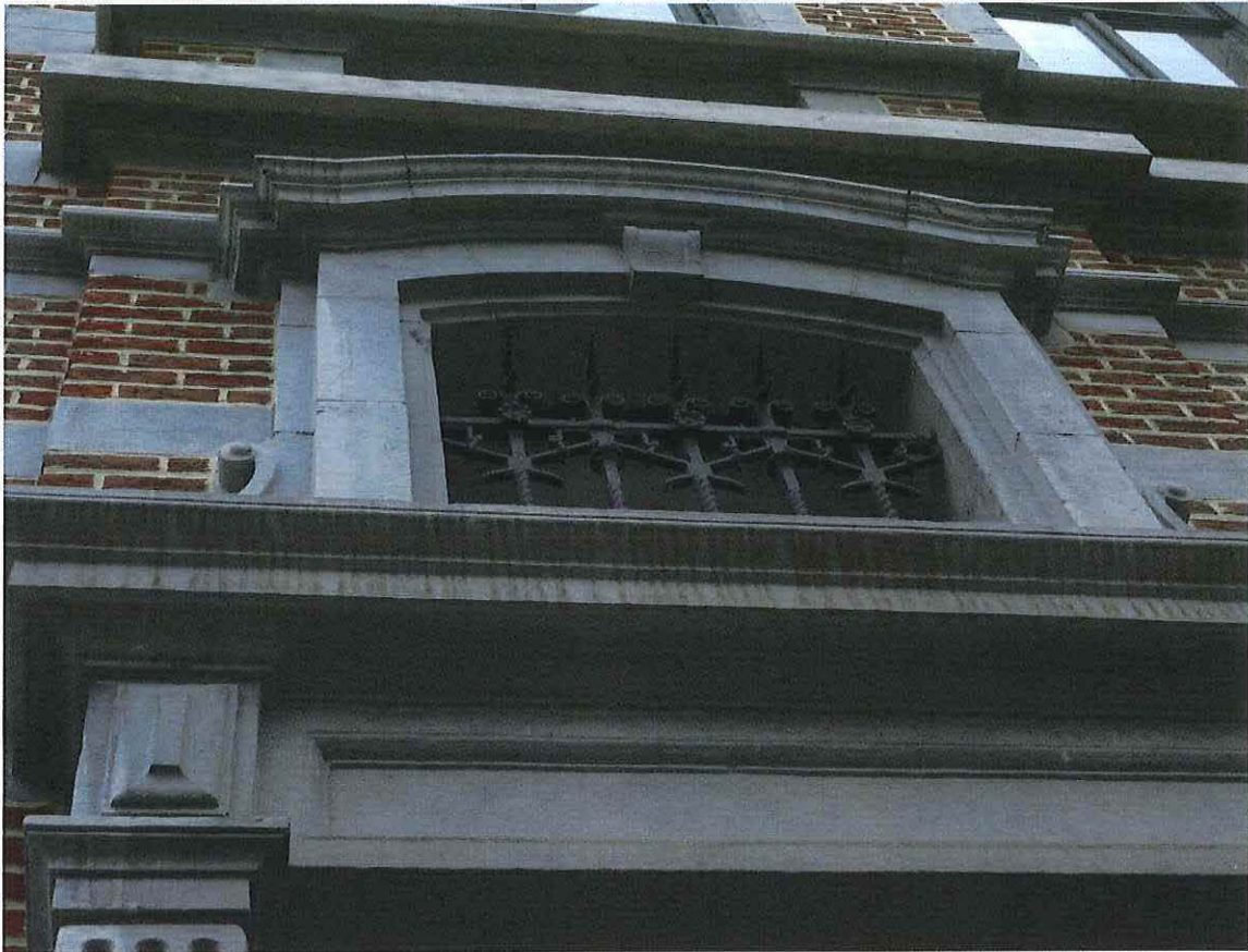
Foto 11: Detail getralied bovenlicht voordeur herenwoning Delacre (18 juni 2018).