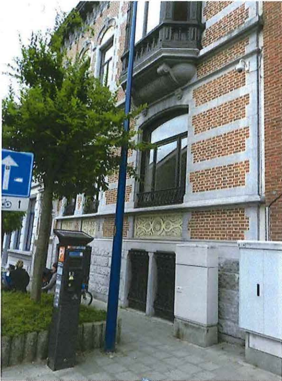
Foto 7: Detail getoogde raampartij rechter zijtravee voorgevel herenwoning Delacre (18 juni 2018).