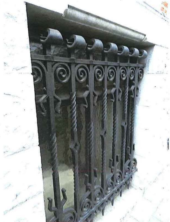
Foto 10: Detail smeedijzeren diefijzer kelderraam onderbouw herenwoning Delacre (18 juni 2018).