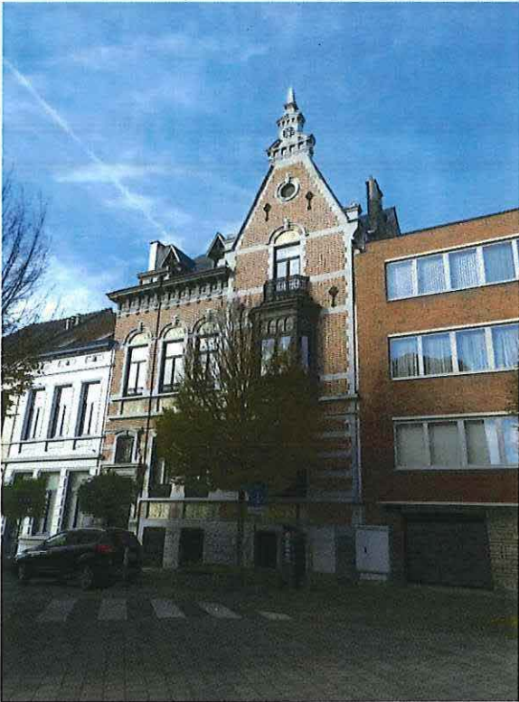
Foto 1: Zicht op de voorgevel van de herenwoning Delacre vanuit de Etienne Blondieastraat (16 november 2017).