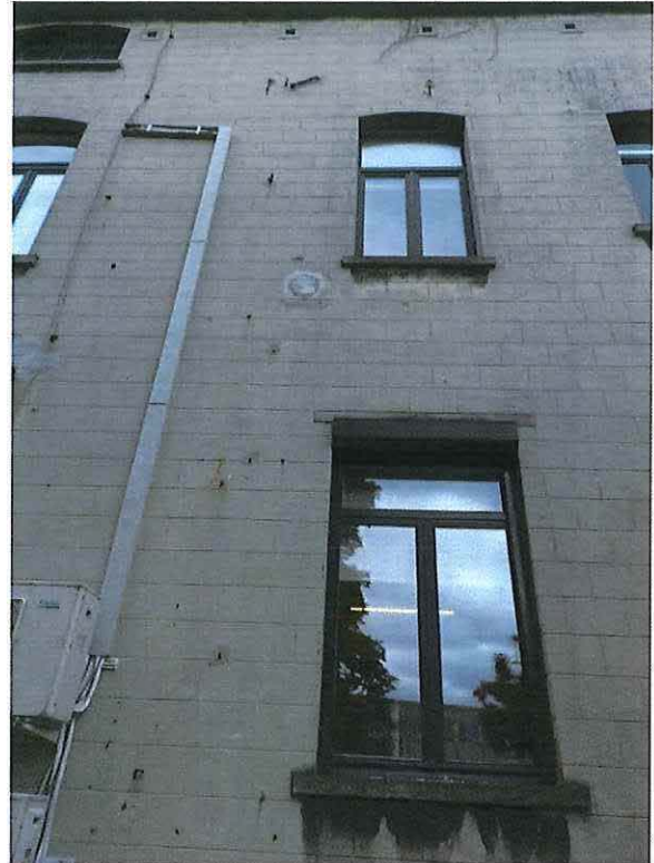
Foto 19: Detail middelste travee achtergevel herenwoning Delacre (18 juni 2018).