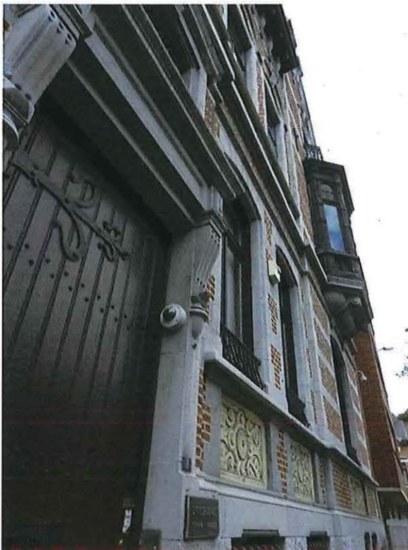
Foto 9: Detail voordeur met deurbeslag herenwoning Delacre (18 juni 2018).