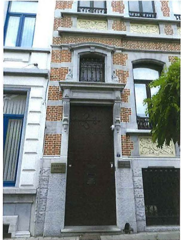
Foto 8: Voordeur herenwoning Delacre met entablementomlijsting in neo-Vlaamserenaissancestijl met getralied bovenlicht (18 juni 2018).