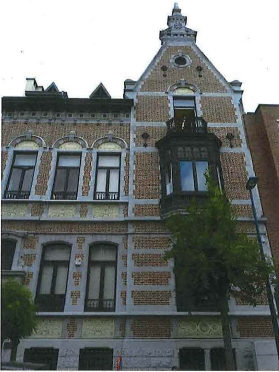
Foto 4: Puntgevel herenwoning Delacre met houten erker (18 juni 2018).