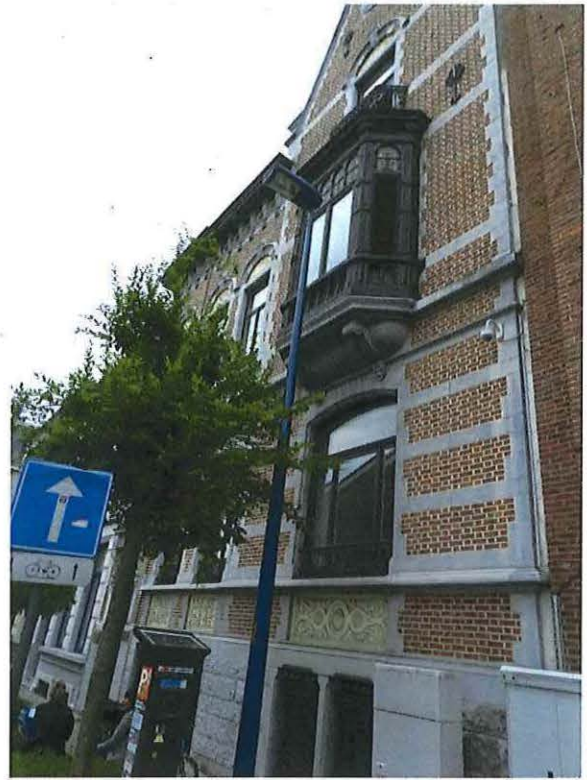
Foto 5: Zicht op de erker op hardstenen sokkel met consoles herenwoning Delacre (18 juni 2018).