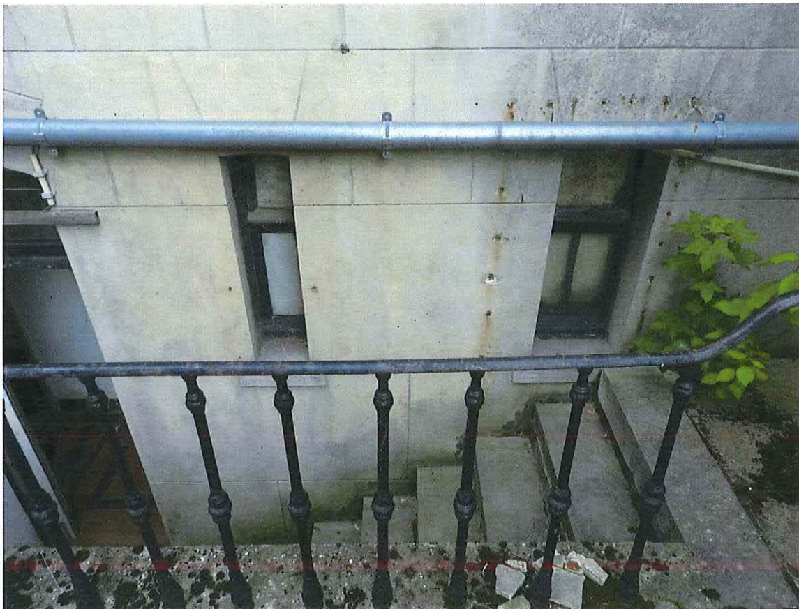
Foto 23: Detail hardstenen keldertrap achtergevel herenwoning Delacre (18 juni 2018).