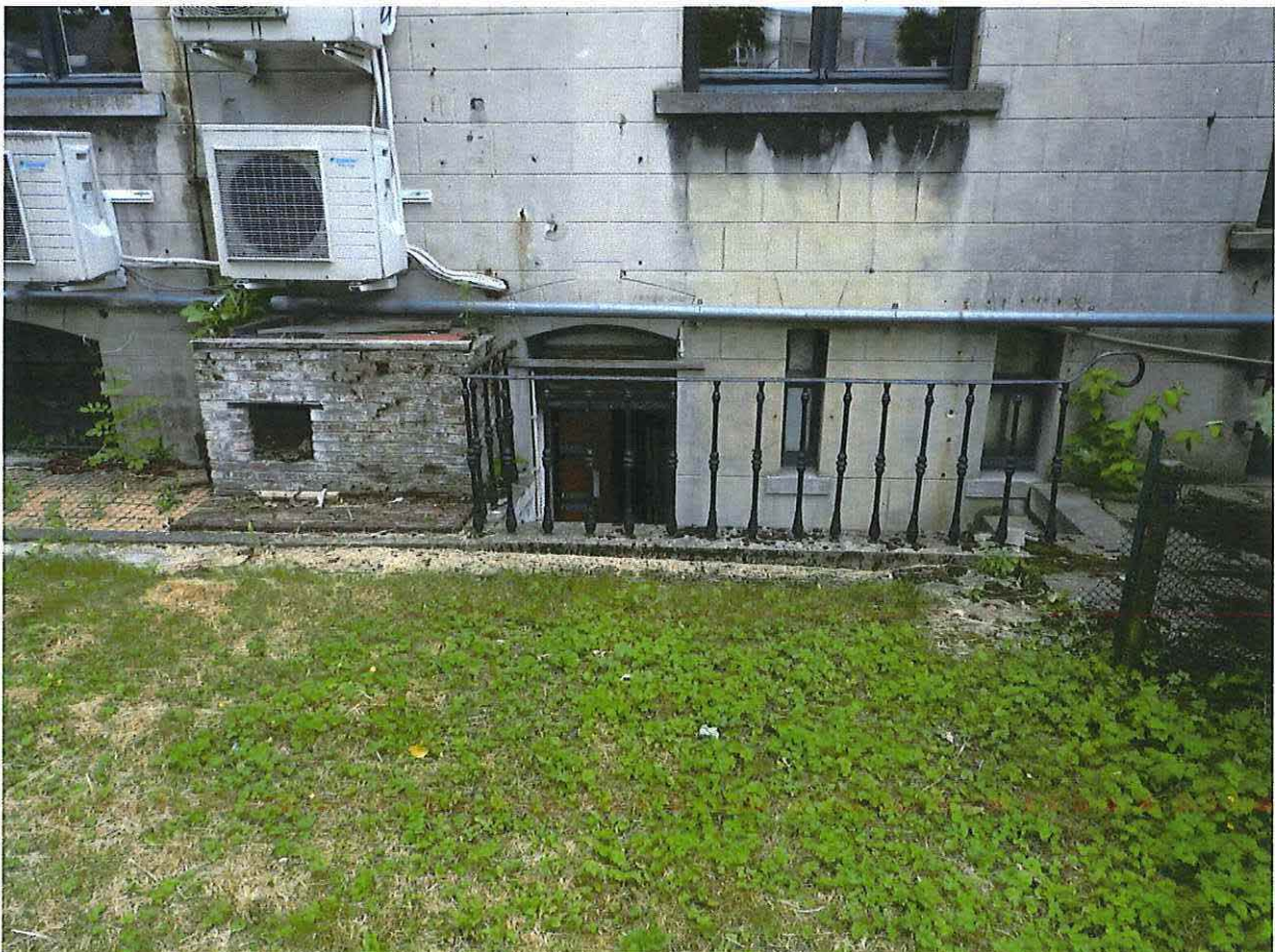
Foto 20: Zicht op de keldertrap achtergevel met ijzeren balusterborstwering (18 juni 2018).