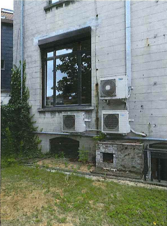
Foto 18: Detail verbreed linker zijtravee achtergevel herenwoning Delacre met later aangebrachte, storende technische installaties en lage bakstenen aanbouw ter hoogte van de plint (18 juni 2018).