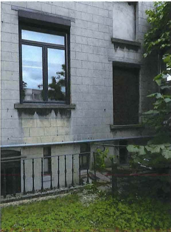
Foto 16: Detail rechtertravee achtergevel herenwoning Delacre (18 juni 2018).