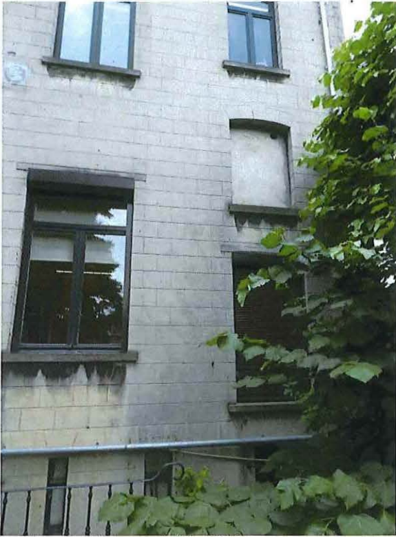
Foto 24: Detail rechter zijtravee herenwoning Delacre (18 juni 2018).