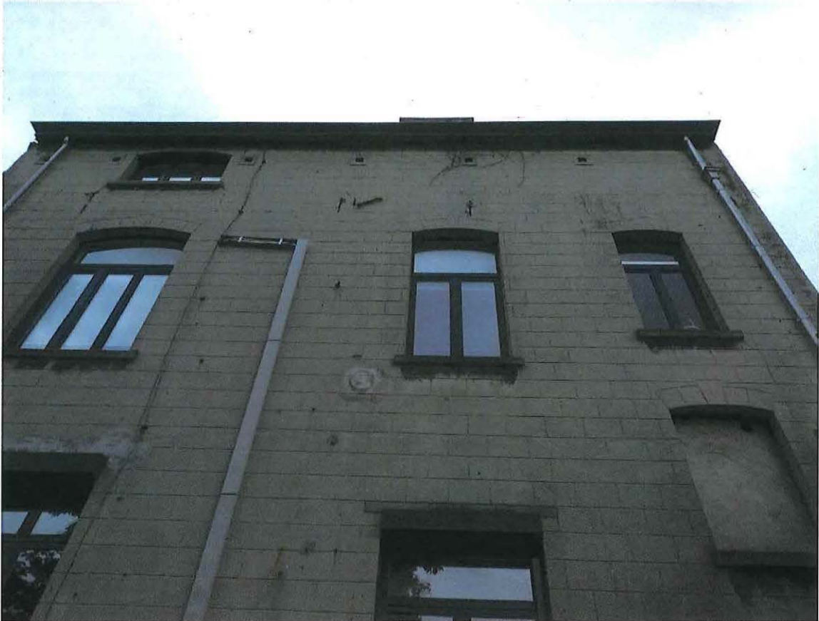
Foto 15: Zicht op de gecementeerde achtergevel van de herenwoning Delacre (18 juni 2018).