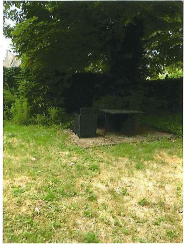
Foto 25: Zicht op de stadstuin met solitaire boom achter de woning (18 juni 2018).