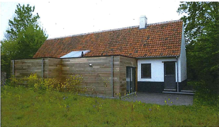
Figuur 2: na verplaatsing, gevel zijde spoorweg