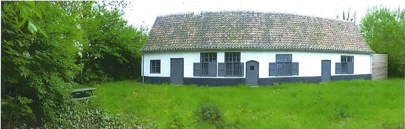
Figuur 1: na verplaatsing, gevel zijde Kerkakkerstraat