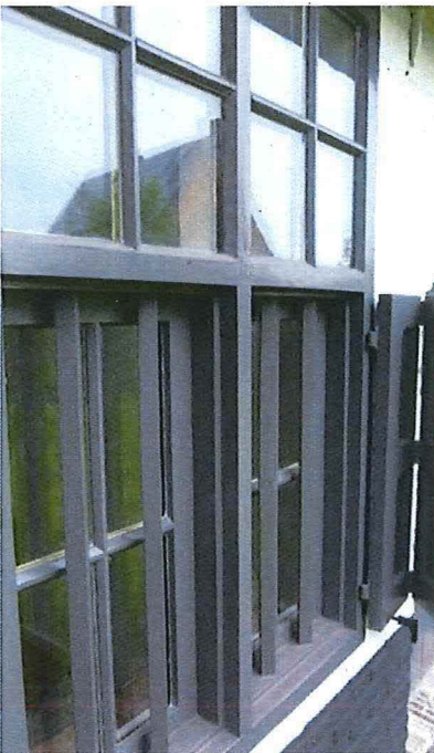
Figuur 6: detail na verplaatsing