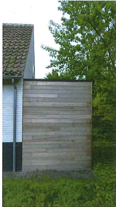
Figuur 5: aanbouw