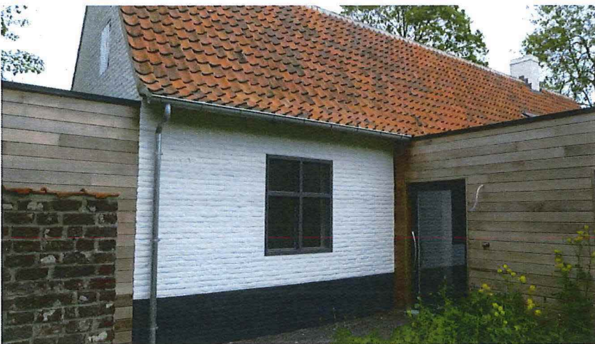
Figuur 3: gevel zijde spoorweg, voordeur in nieuw bijgebouw