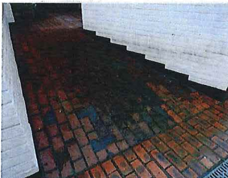
Foto 12: Westgevel, detail hellend vlak tot avondterras (21 december 2018).