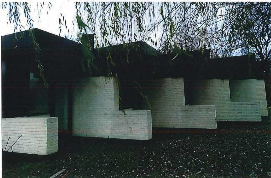
Foto 23: Oostzijde van de woning met verspringende volumes van het nachtgedeelte (21 december 2018).