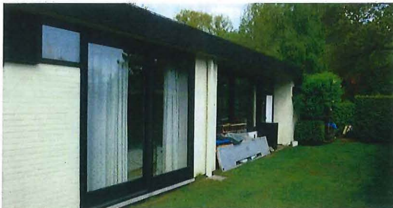
Foto 21: Oostgevel, slaapkamer ouders en tekenatelier (24 april 2017).