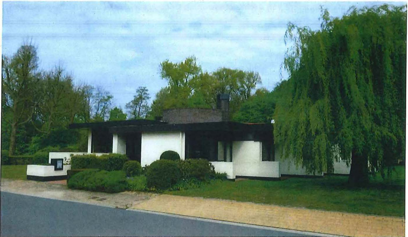
Foto 1: Architectenwoning Daemers; algemeen zicht (24 april 2017).