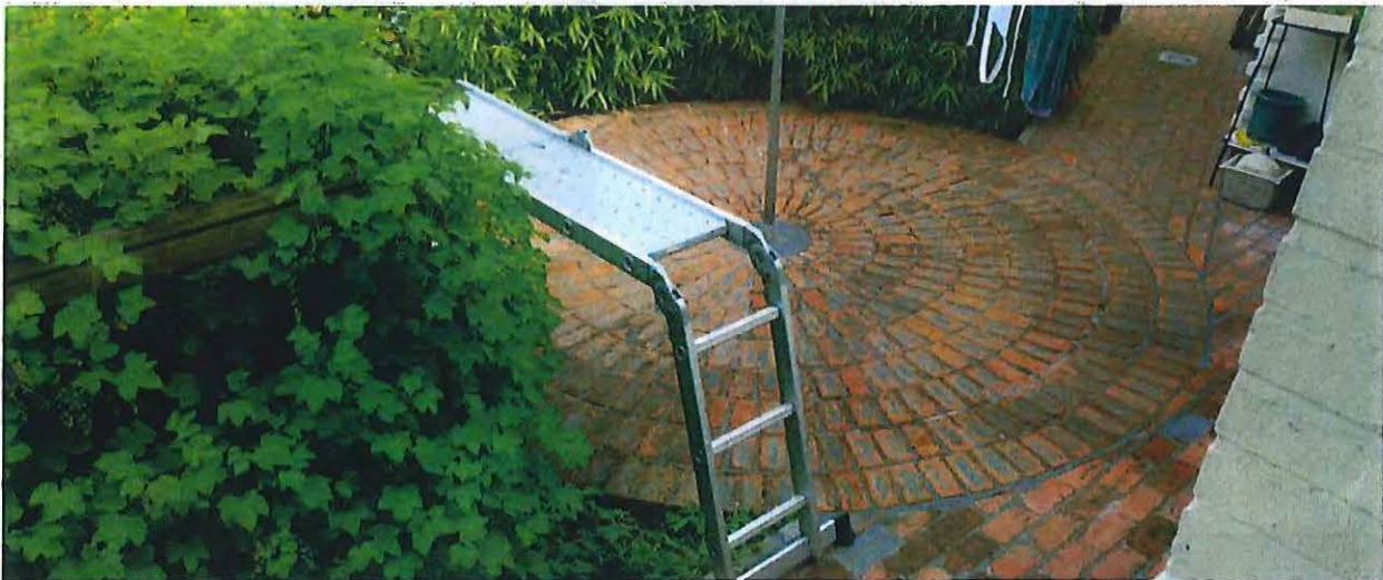
Foto 19: Noordgevel, cirkelvormig terras aan de achterdeur (24 april 2017).