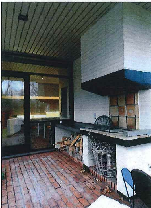
Foto 14: Westgevel, detail avondterras met buitenbarbecue (21 december 2018).