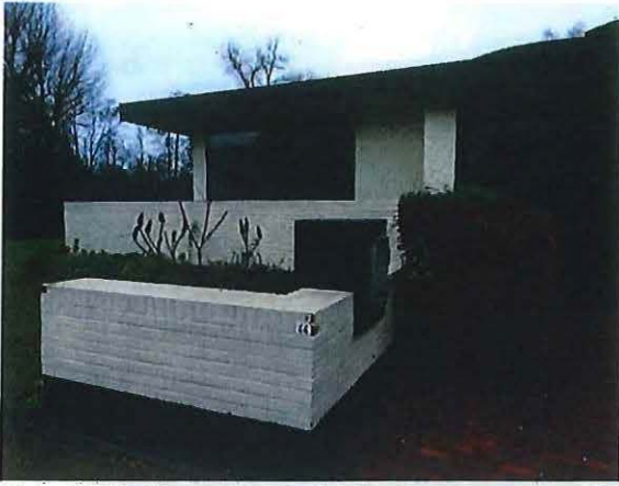
Foto 3: Zuidgevel, detail inkom, toegangspad; brievenbus en middagterras aan de living (21 december 2018).