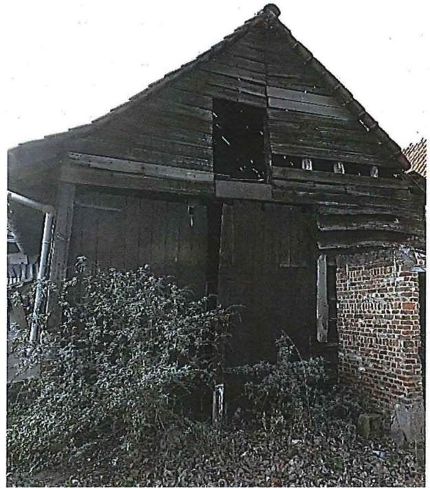
Foto 13: Oostelijke kopgevel van het ruraal gebouw met toegangspoort.