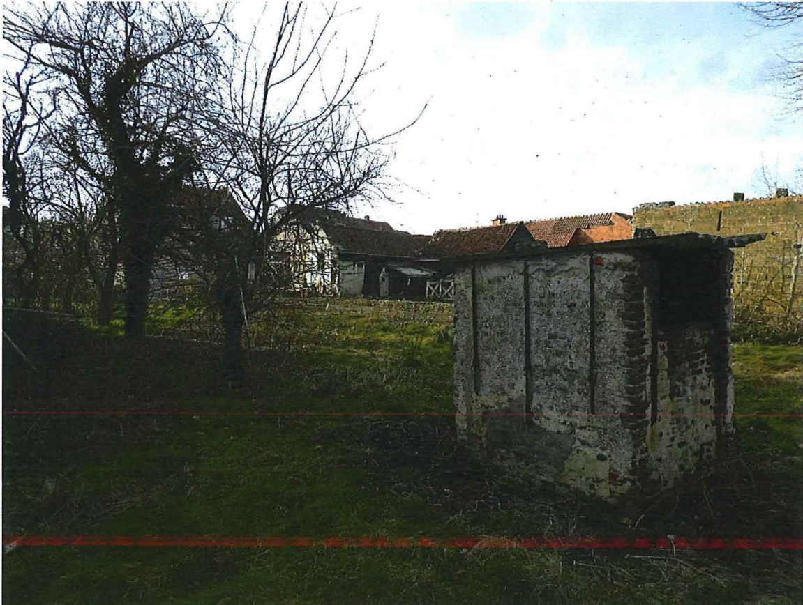
Foto 8: Vooraan rest van de vroegere rookoven gebouwd in 1879, thans gelegen buiten de afbakening van de bescherming, met zicht op de erfgevels van de houten L-vormige blokstal en ruraal gebouw.