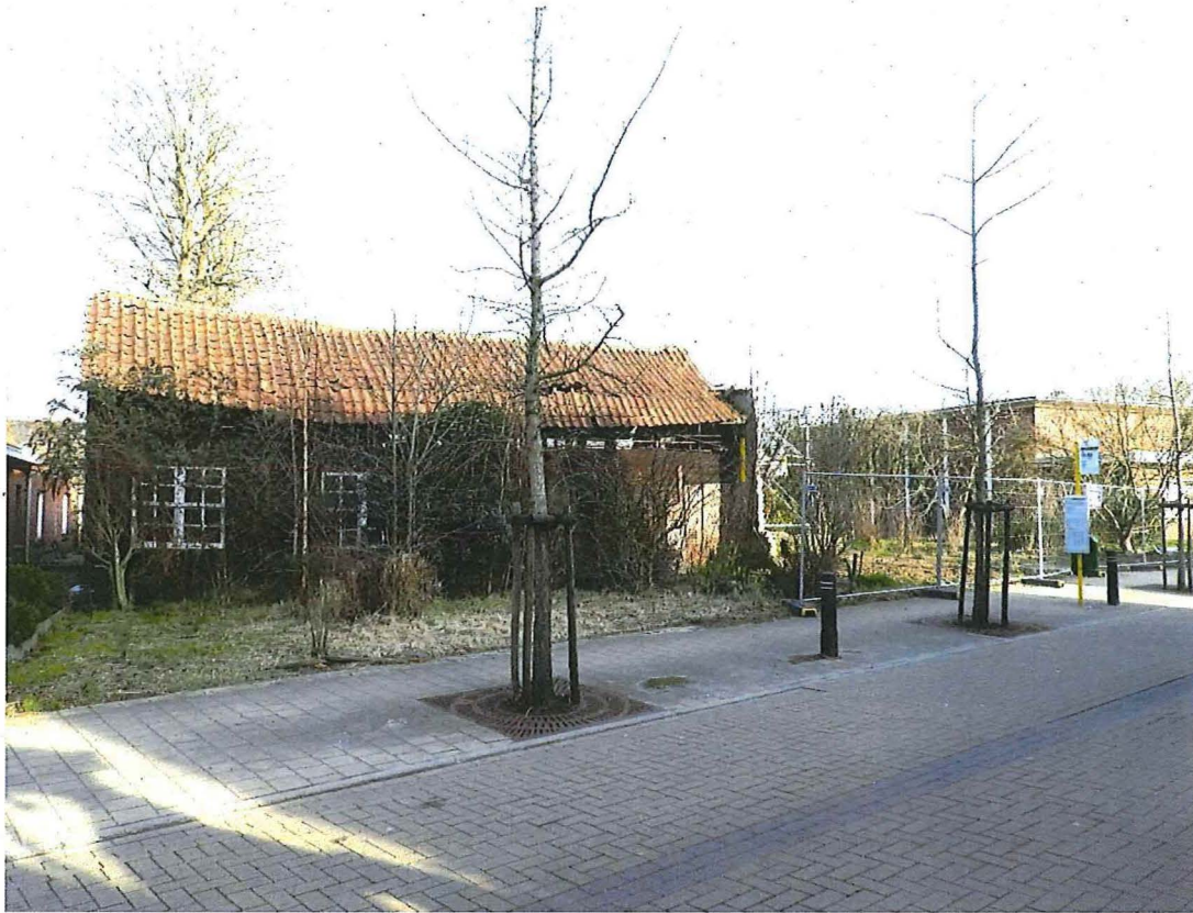
Foto 1: Blokstal met voorliggende houtopslagplaats, vanuit noordwestelijke hoek. De vroegere klompenmakerswoning stond rechts en is inmiddels afgebroken. Enkel de gemeenschappelijke muur bleef behouden.