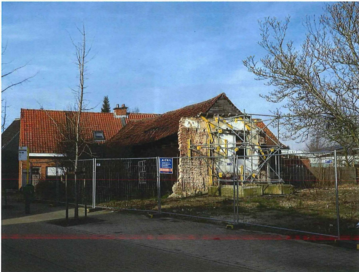
Foto 14: Algemeen zicht op de houten blokstal vanuit zuidelijke hoek. Vooraan bevond zich de klompenmakerswoning.