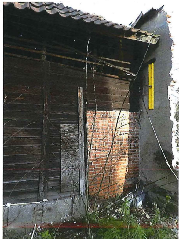
Foto 6: Straatgevel van de blokstal in houtbouw. Metselwerk ter hoogte van de vroegere stookplaats. Rechts daarvan een rest van de gemeenschappelijke muur met de klompenmakerswoning die overeind bleef.