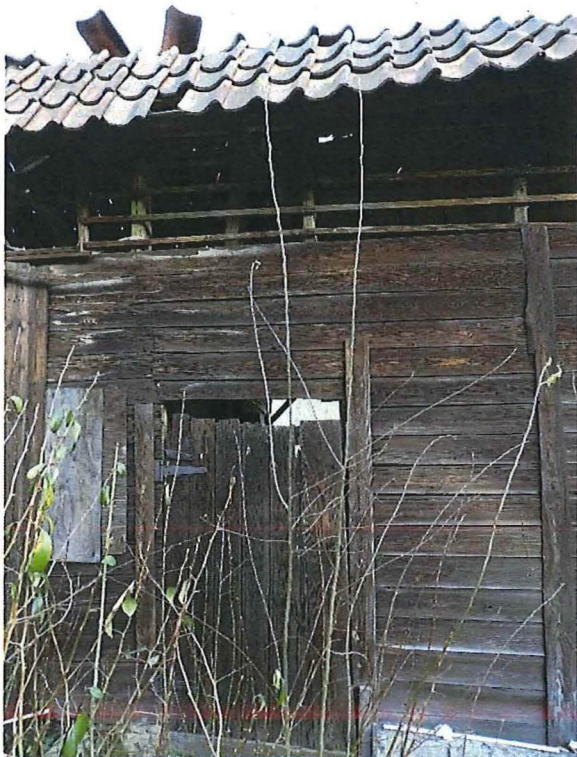
Foto 5: Straatgevel van de blokstal in houtbouw met open stijl- en regelwerk onder dakoverstek, waar de klompen gedroogd werden.