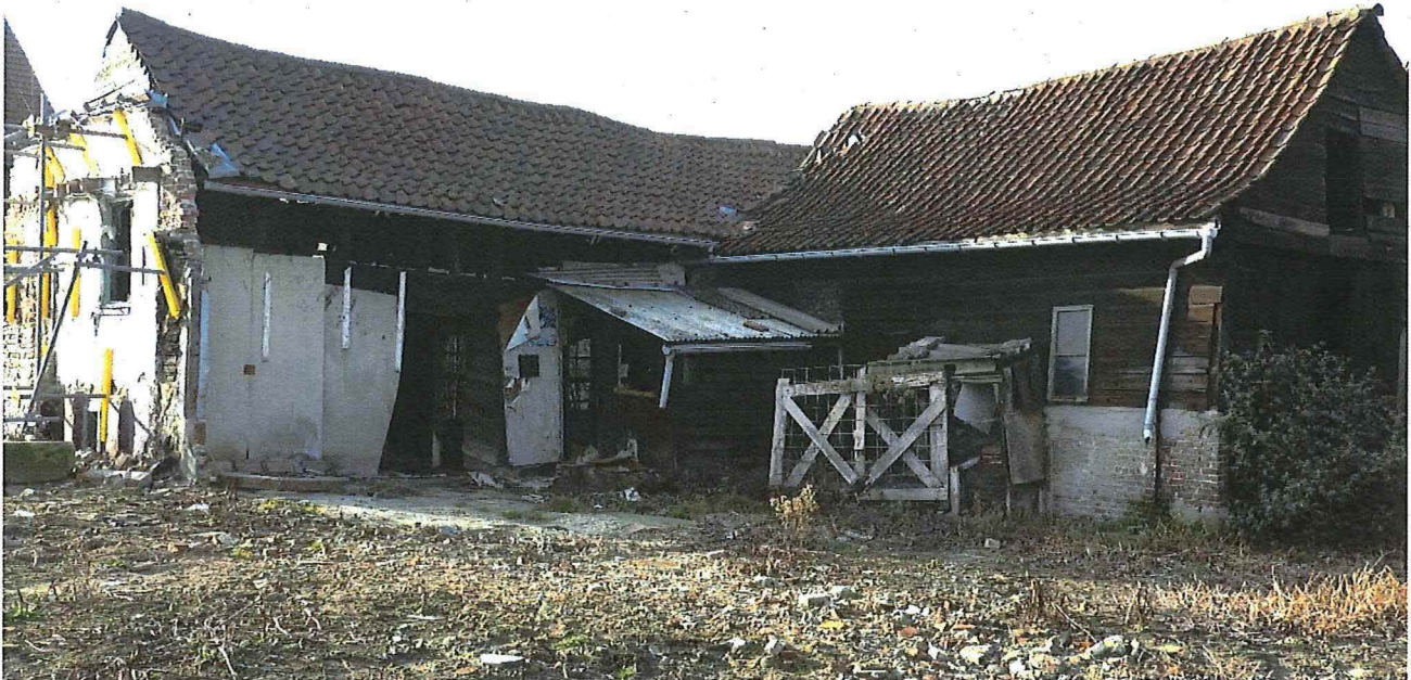
Foto 9: Zicht op de erfgevels van de houten L-vormige blokstal (links) en ruraal gebouw (rechts). Het volume in de oksel is een jongere aanbouw.