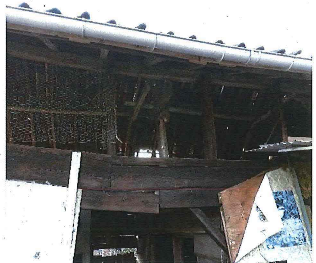
Foto 11: Achter- of erfzijde van de houten blokstal met deels behouden stijl- en regelwerk.