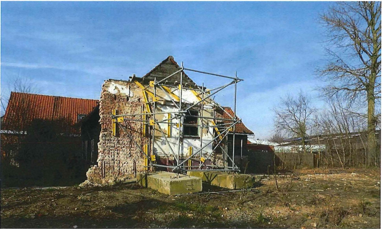
Foto 7: Blokstal met voorliggende zone voor houtstockage. Zicht op een rest van de gemeenschappelijke muur met de klompenmakerswoning. Het gesaneerde achterliggende terrein, dat buiten de bescherming ligt, is voorzien voor de aanleg van een woonwagenpark.