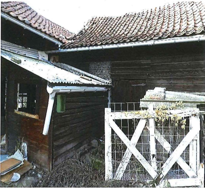
Foto 12: Aansluiting tussen de houten blokstal en het ruraal gebouw. Deels versteende zijgevel van het ruraal gebouw.