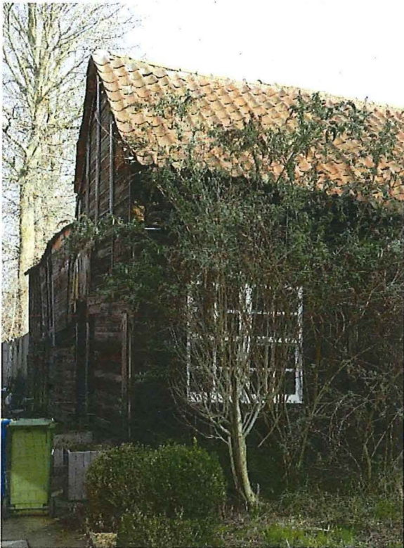
Foto 3: Blokstal in houtbouw met zicht op de houten zijwand van de blokstal en het achterliggende ruraal gebouw.