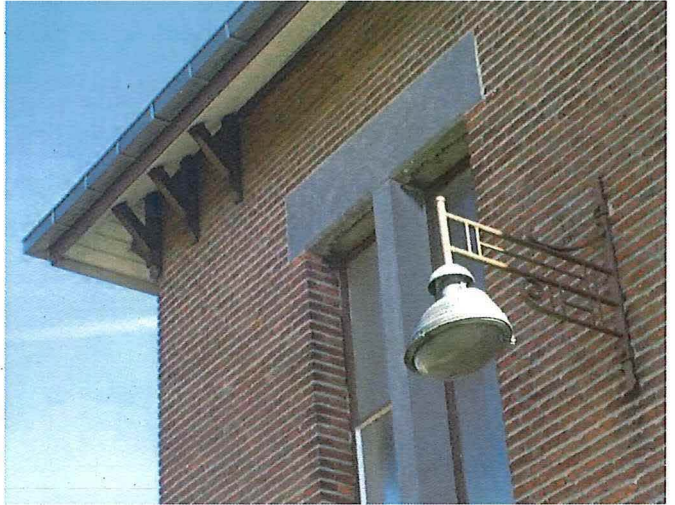
Foto 4-5 : Sint-Annapaviljoen, zijgevel (west) en detail (dakklossen, vensters en verlichting).