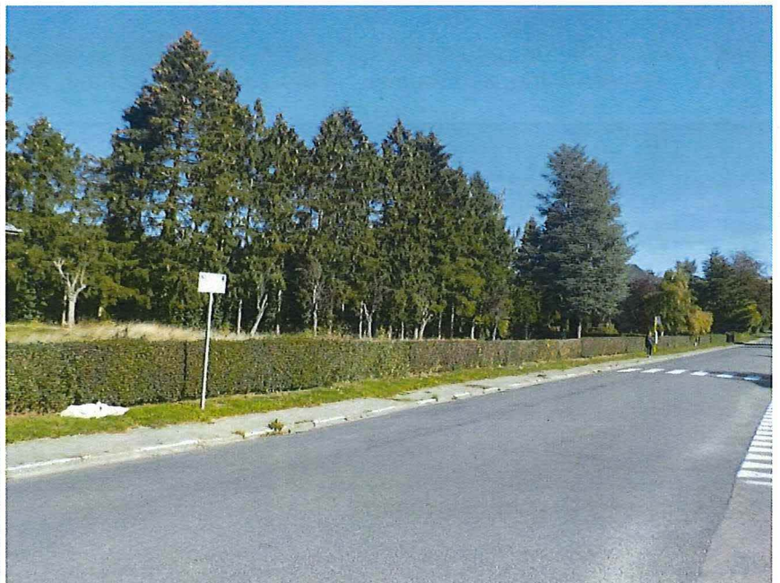
Foto 8-9 : Sint-Annapaviljoen en dienstwoning, perceel aan Grote Hutsesteenweg.