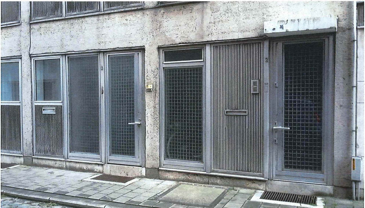
Foto 9: Zijgevel, pui (fietsenstalling, ingang architectenkantoor)