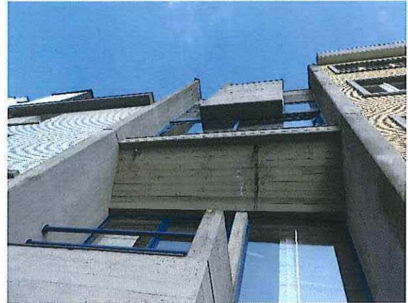
Foto 5: Woning De Zordo – detail van de voorgevel, 23 februari 2018