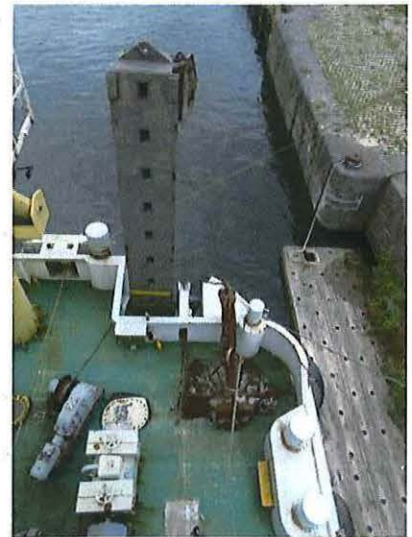
Foto 30: Het achterdek met de geleidingspaal en lier om de paal de bedienen.