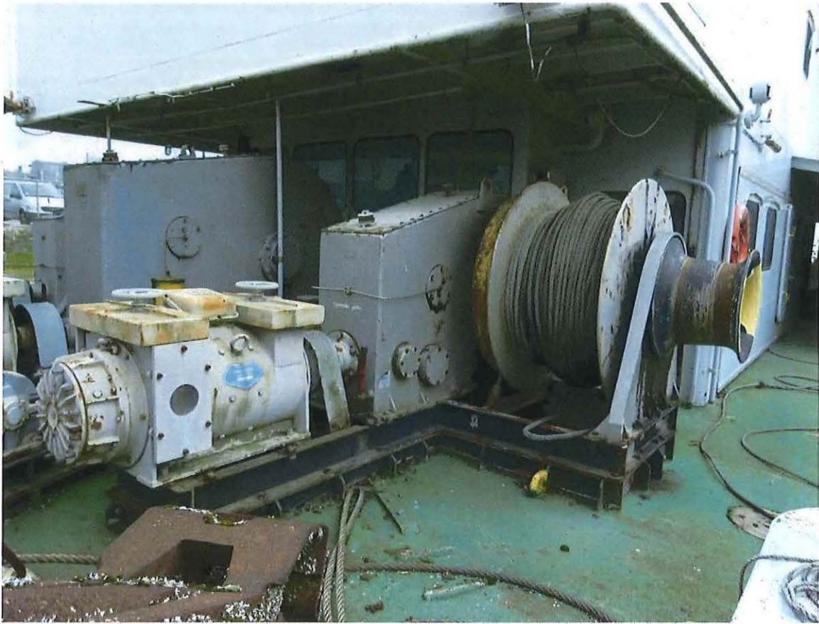
Foto 27: De lieren van het hekanker en de twee achterzij-ankers op het achterdek.