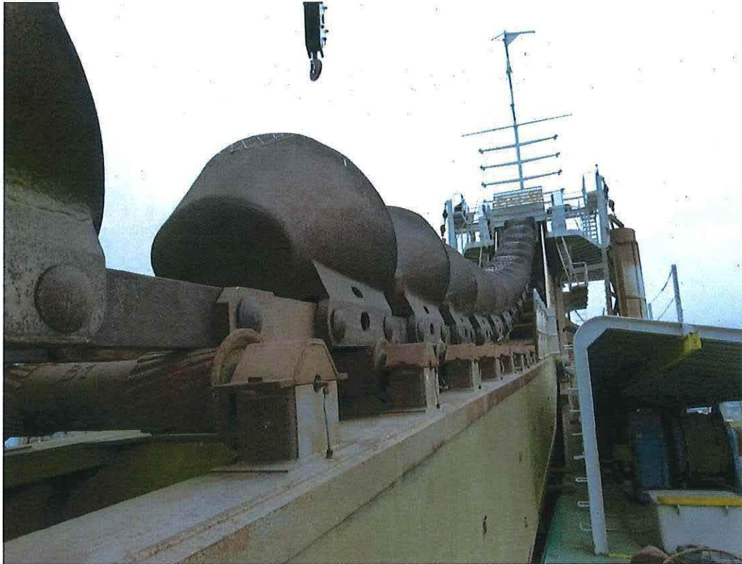
Foto 17: De emmers voeren de baggerspecie naar het hoogste punt van de hoofdbok.