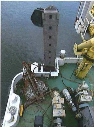
Foto 28: Vogelperspectief op het achterdek, met onder meer de ankers.