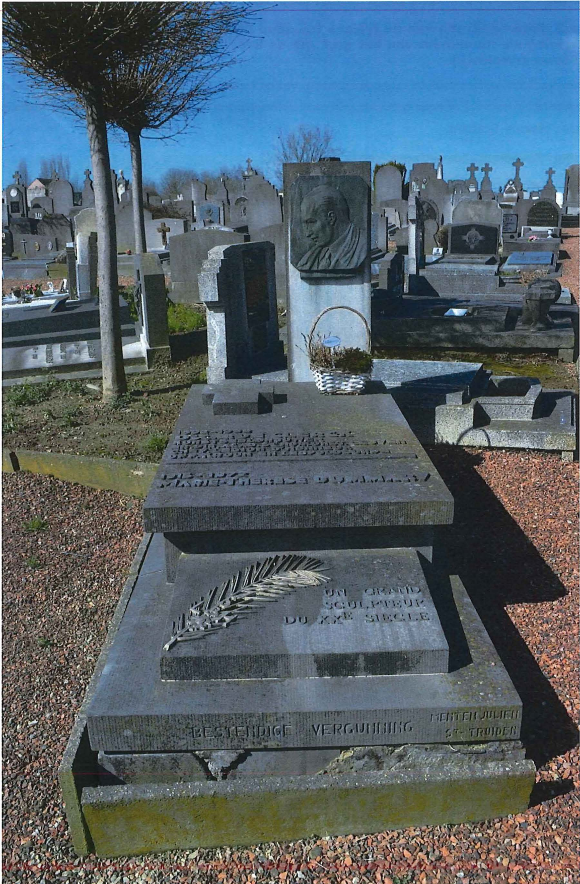
1. Zaventem, het graf van Oscar De Clerck, totaalbeeld