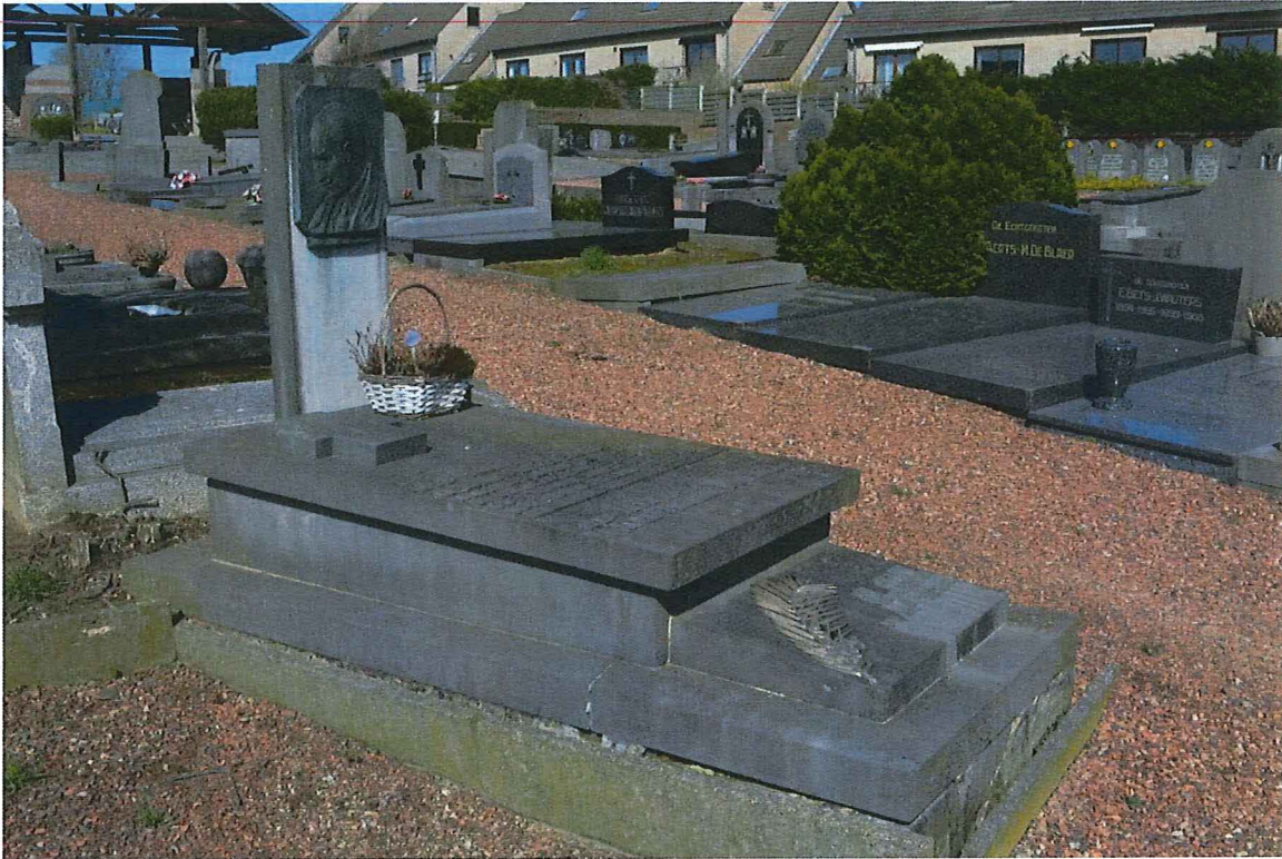
2. Zaventem, het graf van Oscar De Clerck, zijaanzicht