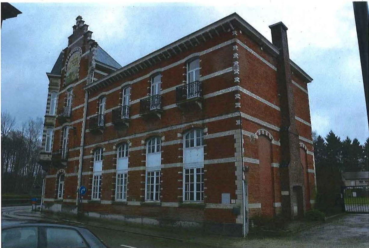
Foto 8: Het volume aan de Terblokstraat en de heden blinde zijgevel (15.01.2018).