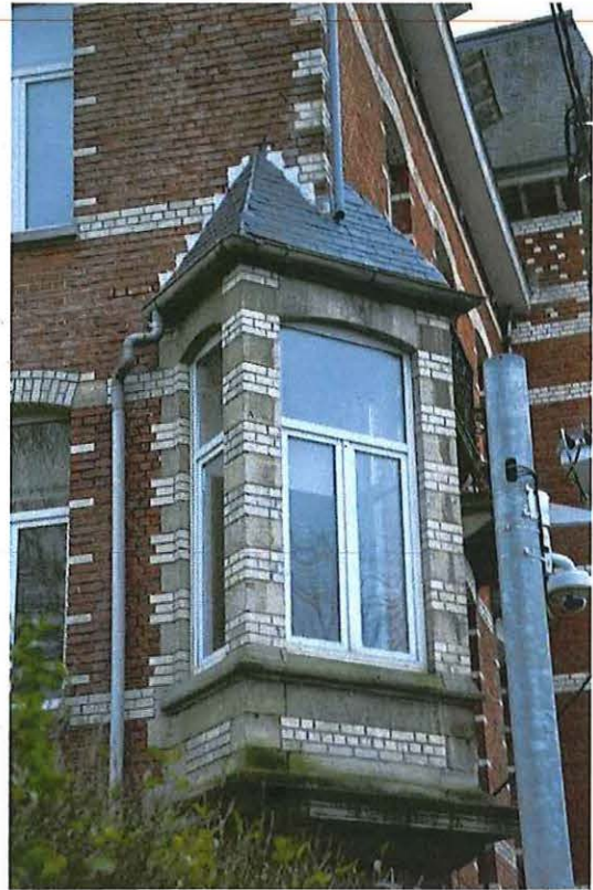
Foto 5: Hoofdgebouw Sint-Jansbergdreef, erker op de noordwestelijke hoek (24.01.2018).