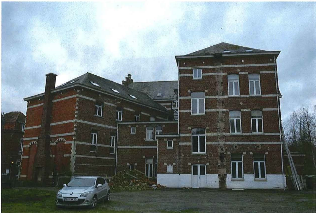
Foto 11: Achtergevels, gezien vanaf het oosten (24.01.2018).