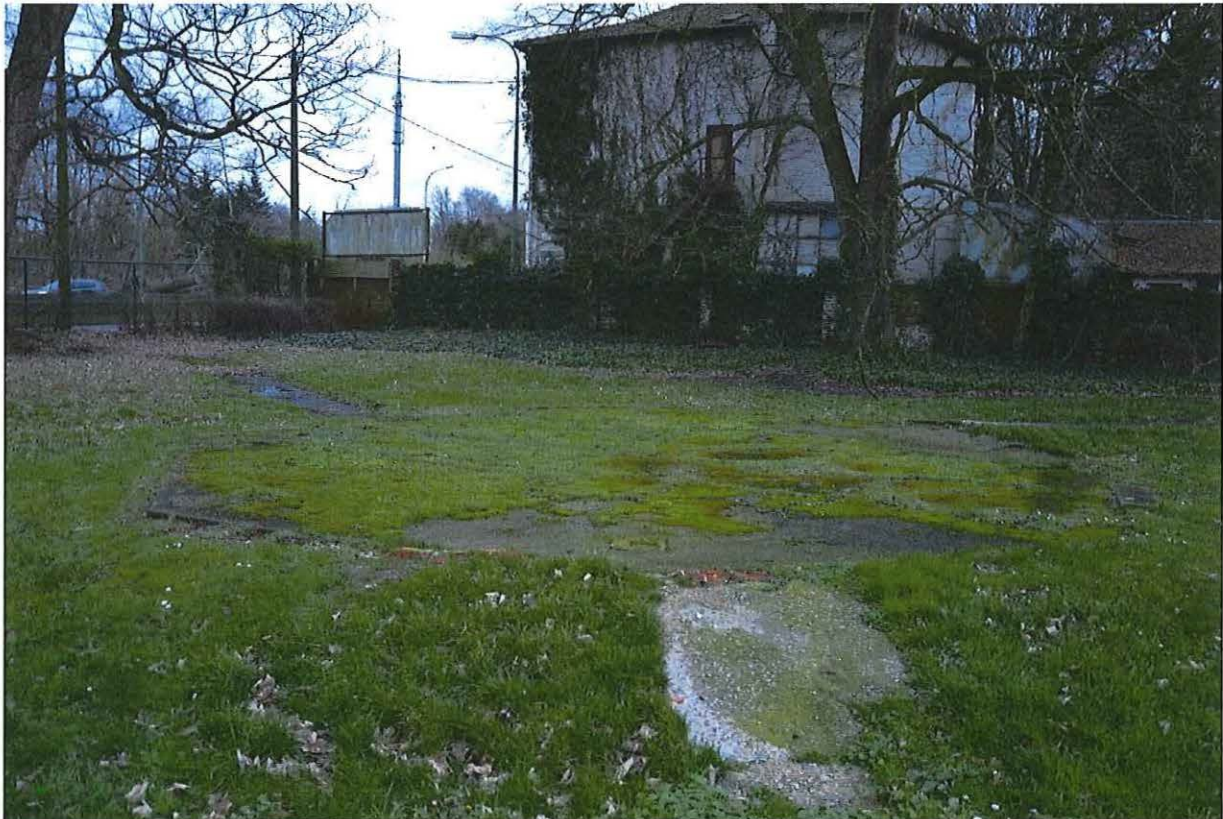
Foto 21: Octogonale verharding van het voormalige tuinpaviljoen (24.01.2018).