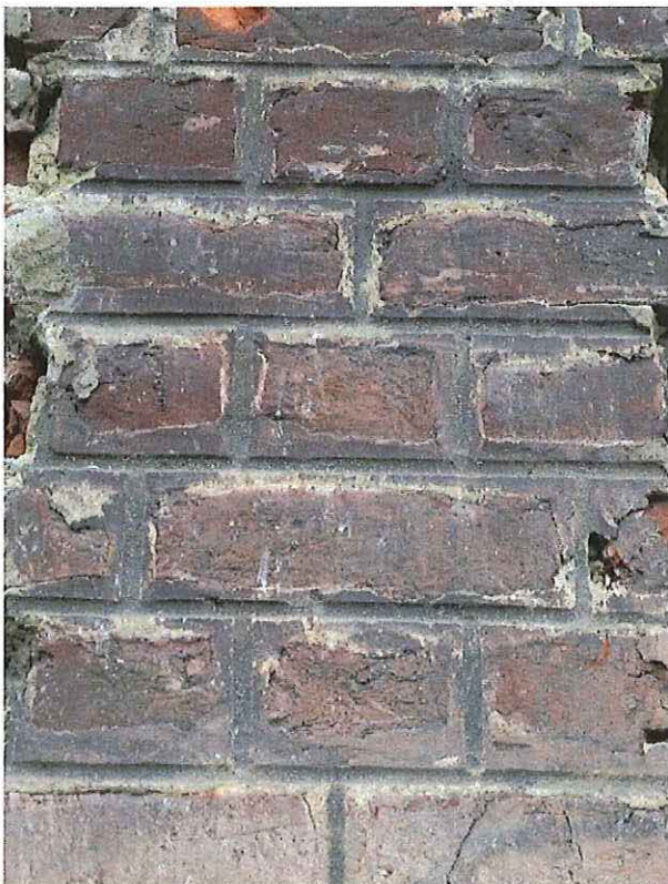
Foto 15: Haakse noordvleugel (oostelijke gevel), detail metselwerk met holle voeg. Onregelmatige bakstenen, aangestreaken met mortel en bijgekleurd. Zicht op deze oorspronkelijke afwerkingslaag die bewaard bleef achter een recent gesloopte schoorsteen (24.01.2018).