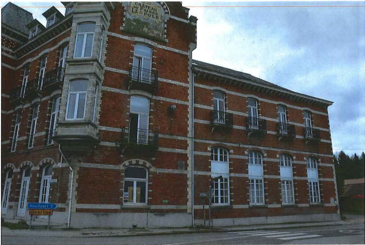
Foto 7: De hoek van de Sint-Jansbergdreef en de Terblokstraat, gezien vanaf het zuidwesten (24.01.2018).