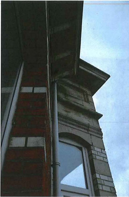
Foto 9: Hoofdvolume Sint-Jansbergdreef, detail erker in de zuidwestelijke hoek en kroonlijsten (15.01.2018).