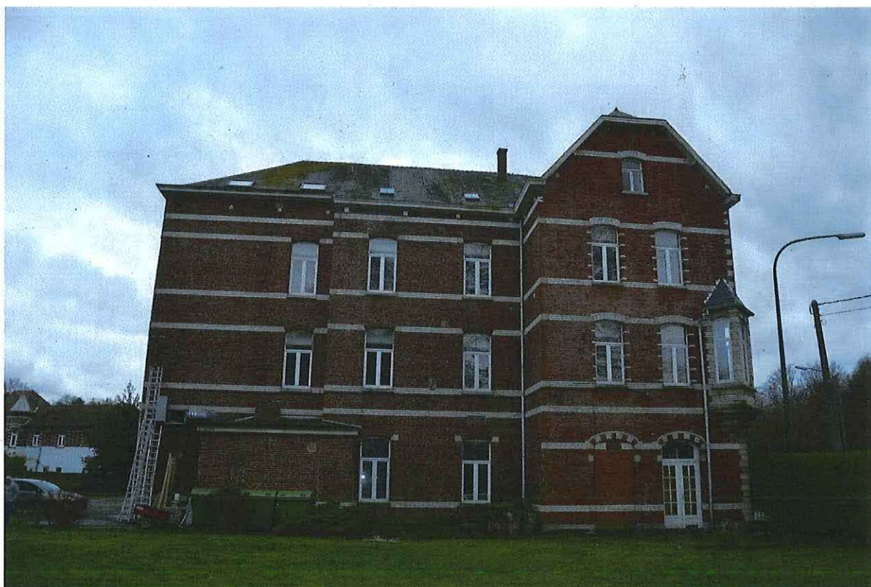
Foto 13: De noordelijke zijgevel van het hoofdvolume aan de Sint-Jansbergdreef (rechts) en de aansluitende haakse noordvleugel (links). Zicht vanaf het noorden (24.01.2018).