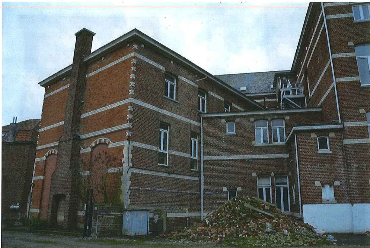
Foto 12: Zij- en achtergevels van het volume aan de Terblokstraat (links) en de aansluitende lagere bijgebouwen in de oksel van het bouwencomplex (rechts) (24.01.2018).