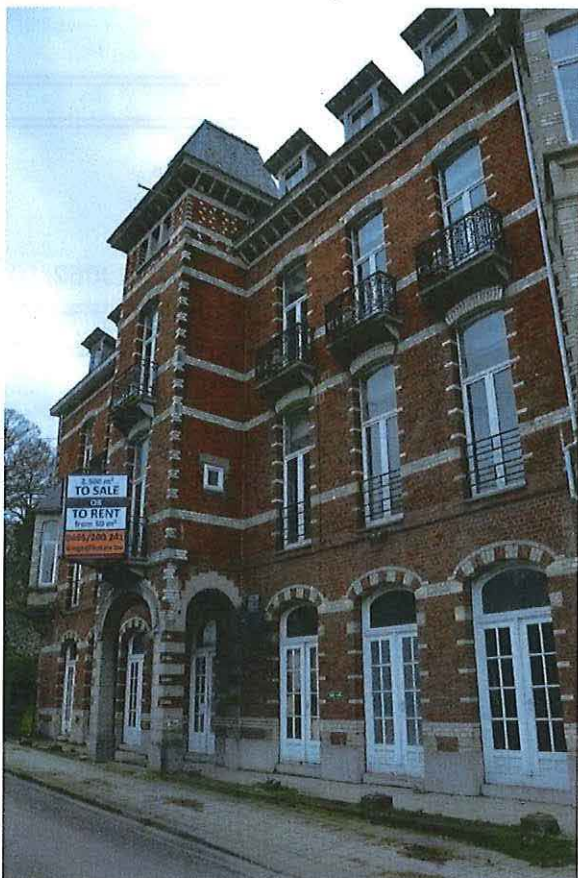
Foto 1: Hoofdvolume Sint-Jansbergdreef, voorgevel (24.01.2018).