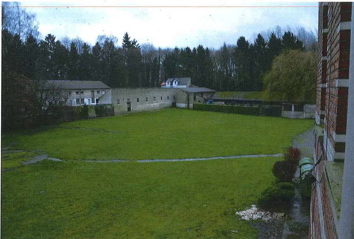
Foto 22: Zicht op de tuin vanaf de eerste verdieping van het Château, met de octagonale verharding van het tuinpaviljoen en een wandelpad naar de achtergevel (15.01.2018).