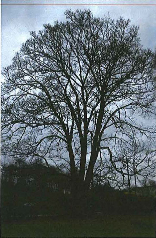
Foto 19: Monumentale es ( Fraxinus excelsior ) in de tuin van het Château (24.01.2018).