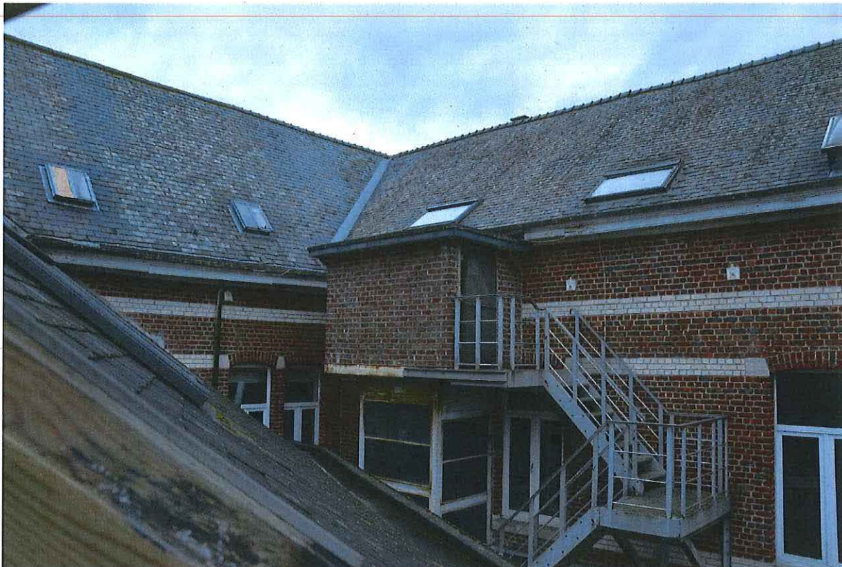
Foto 17: Zicht op de daken van het hoofdvolume en de haakse noordvleugel. Centraal de liftkoker en trap bovenop de lage bijgebouwen in de oksel van het gebouwencomplex (24.01.2018).