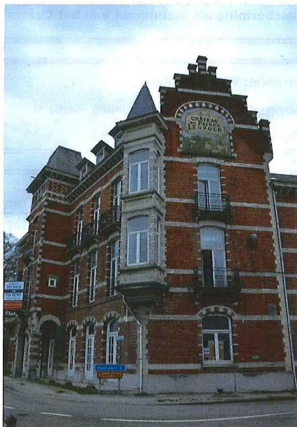
Foto 2: Hoofdvolume Sint-Jansbergdreef, zijtrapgevel met sgraffito (24.01.2018).