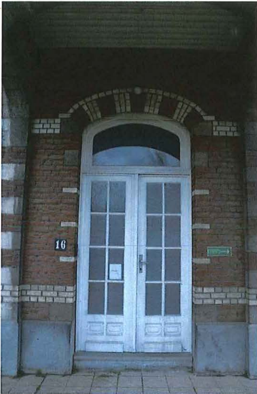
Foto 4: Hoofdgebouw Sint-Jansbergdreef, inkomportaal met hoofdingang (24.01.2018).