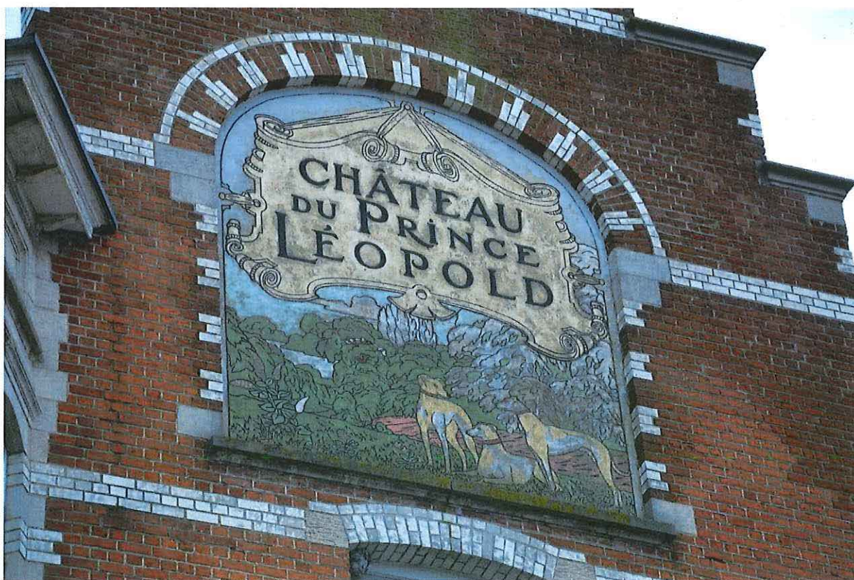
Foto 3: Detail sgraffito "Château du Prince Léopold" (24.01.2018).