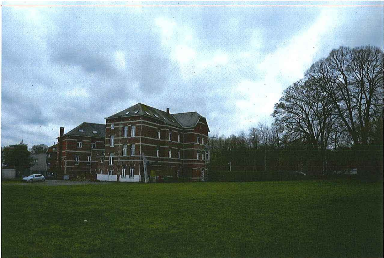
Foto 14: Het Château du Prince Léopold en de omringende tuin, gezien vanaf het noordoosten (24.01.2018).