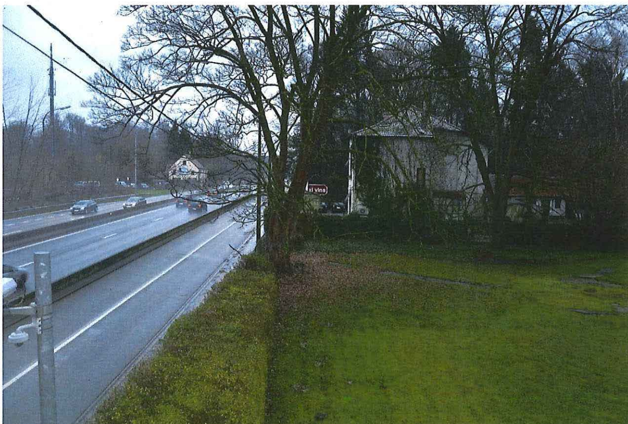
Foto 18: Zicht op de tuin aan de noordzijde van het Château, met de twee monumentale bomen (es en linde), wandelpaden en de octogonale verharding van het voormalige tuinpaviljoen (15.01.2018).