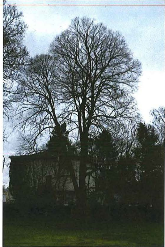
Foto 20: Monumentale linde ( Tilia ) in de tuin van het Château (24.01.2018).