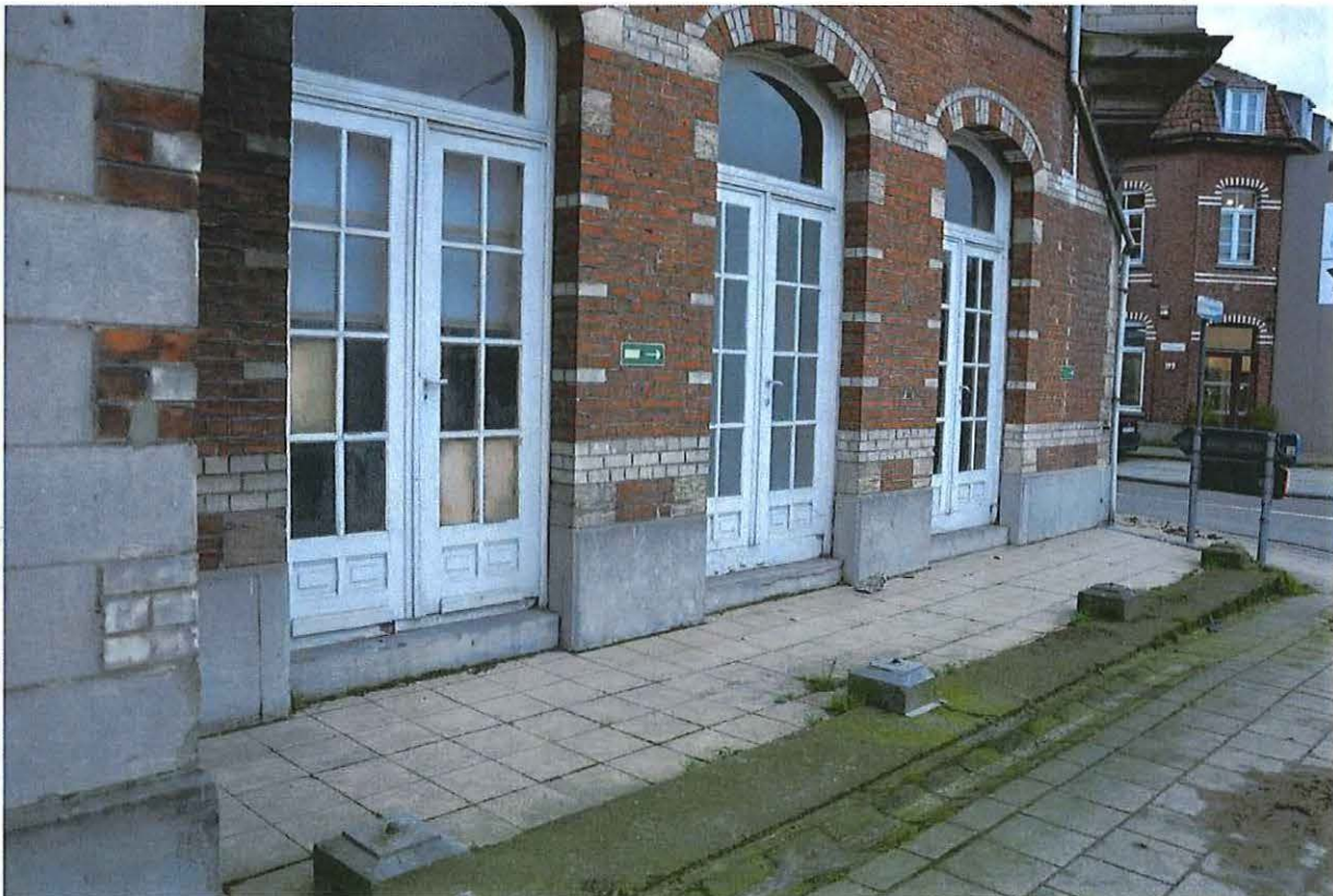
Foto 6: Hoofdvolume Sint-Jansbergdreef, vensterdeuren op de gelijkvloerse verdieping. De oorspronkelijke aflijning van de houten galerij en de natuurstenen basementen zijn nog bewaard (24.01.2018).