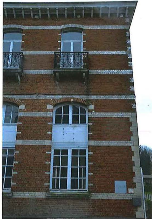
Foto 10: Volume Terblokstraat, detail gevelopeningen met deels vernieuwd schrijnwerk (15.01.2018).