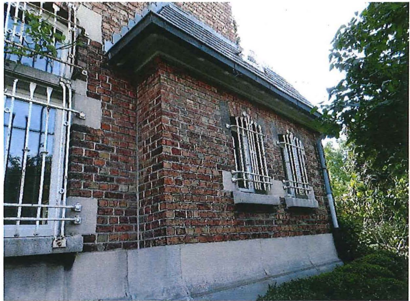
Foto 11: Zicht op het overhoeks volume van de bijkeuken met twee segmentbogige vensters met diefijzers. In de bedaking steekt een origineel ventilatierooster (28/08/2017).