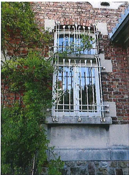
Foto 10: Rechtertravee van de voorgevel met segmentbogig venster voorzien van diefijzers (28/08/2017).