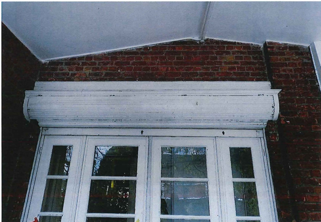
Foto 19: Beglase paneeldeur met zijlichten met rolluikkast in de middentravee van de achtergevel, gezien vanuit het overdekt terras (12/12/2017).