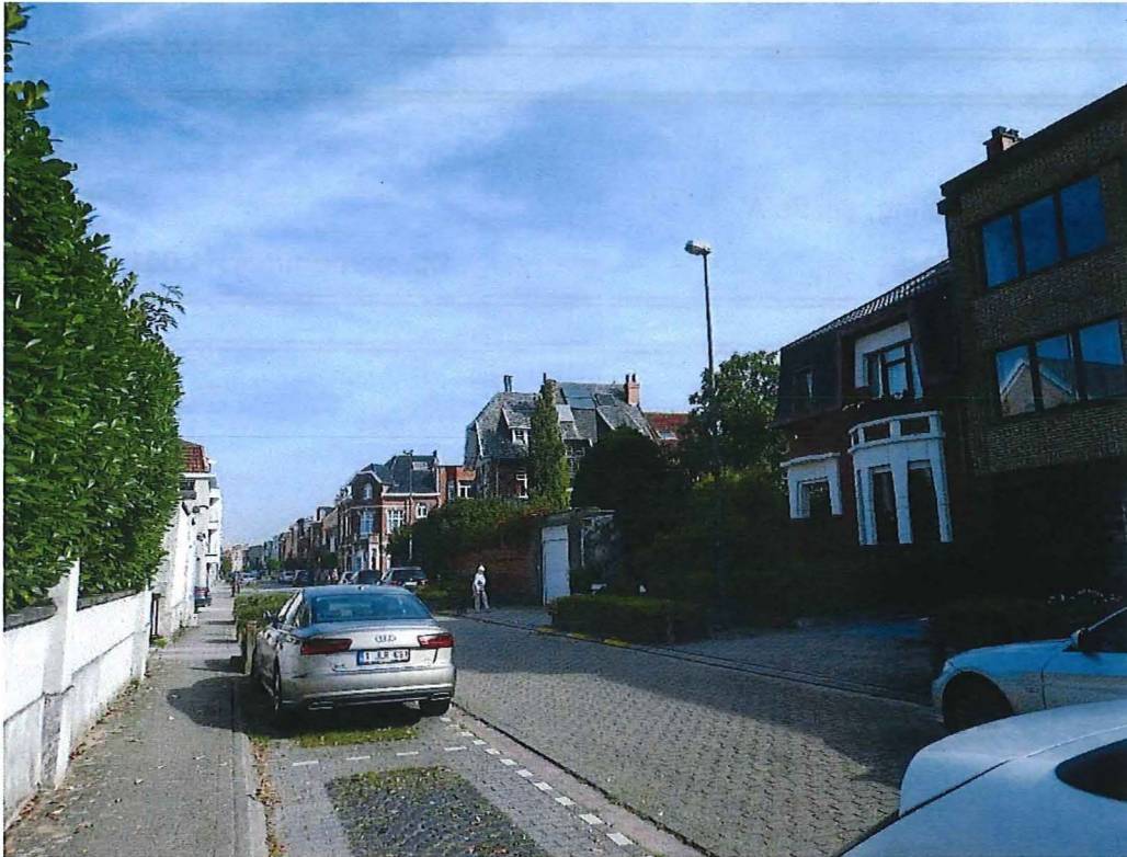
Foto 1: Zicht op de villa in cottigestijl vanuit de Onderwijsstraat (28/08/2017).