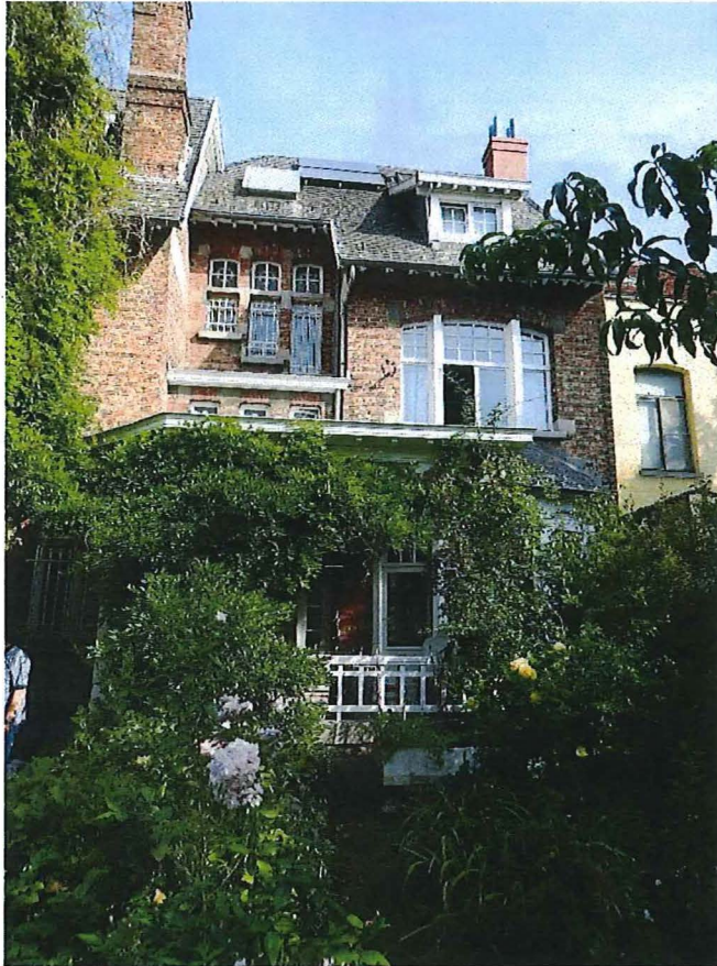
Foto 15: Zicht op de achtergevel met drie smalle verspringende vensters in de middentravee en segmentbogig drielicht in de rechtertravee (28/08/2017).