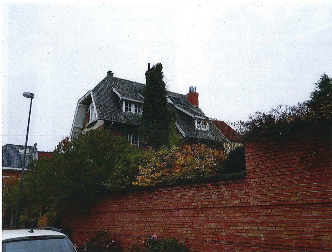
Foto 3: Zicht op de omheiningmuur die ter hoogte van de achtertuin als blinde muur opgemetseld werd om deze laatste aan het zicht te onttrekken. Rechts is deels het volume van de garage in beeld (16/11/2017).