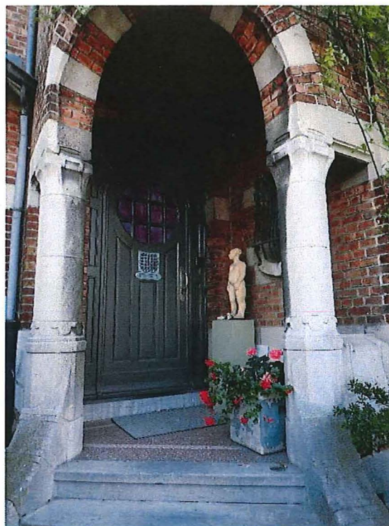
Foto 6: Halfrond inkomportaal met natuurstenen zuiltjes op octogonale sokkels (28/08/2017).