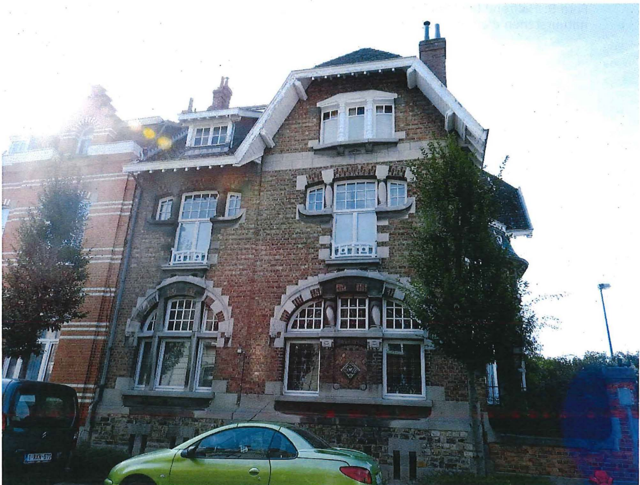
Foto 12: De op het noorden gerichte zijgevel van de villa in cottigestijl (28/08/2017).