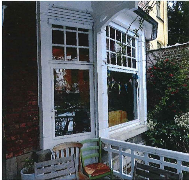
Foto 18: Zicht op het bow-window in de rechtertravee vanuit het overdekt terras (12/12/2017).