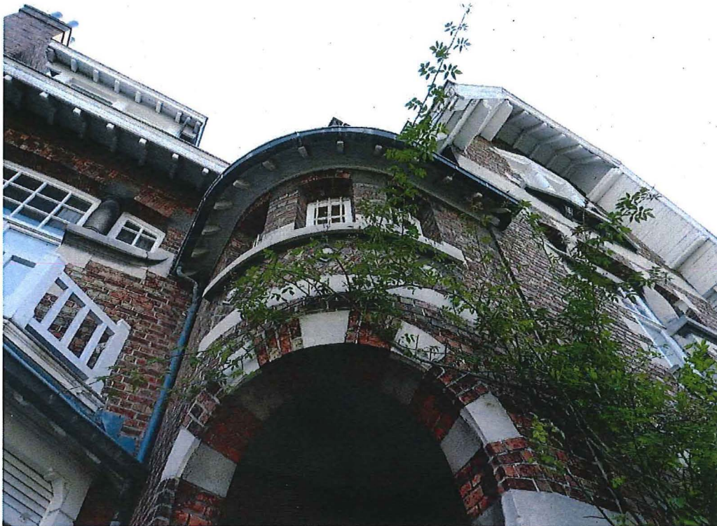
Foto 8: Halfrond hoekportaal met geblokte rondboog en metselmozaïek met natuurstenen diamantkoppen (28/08/2017).