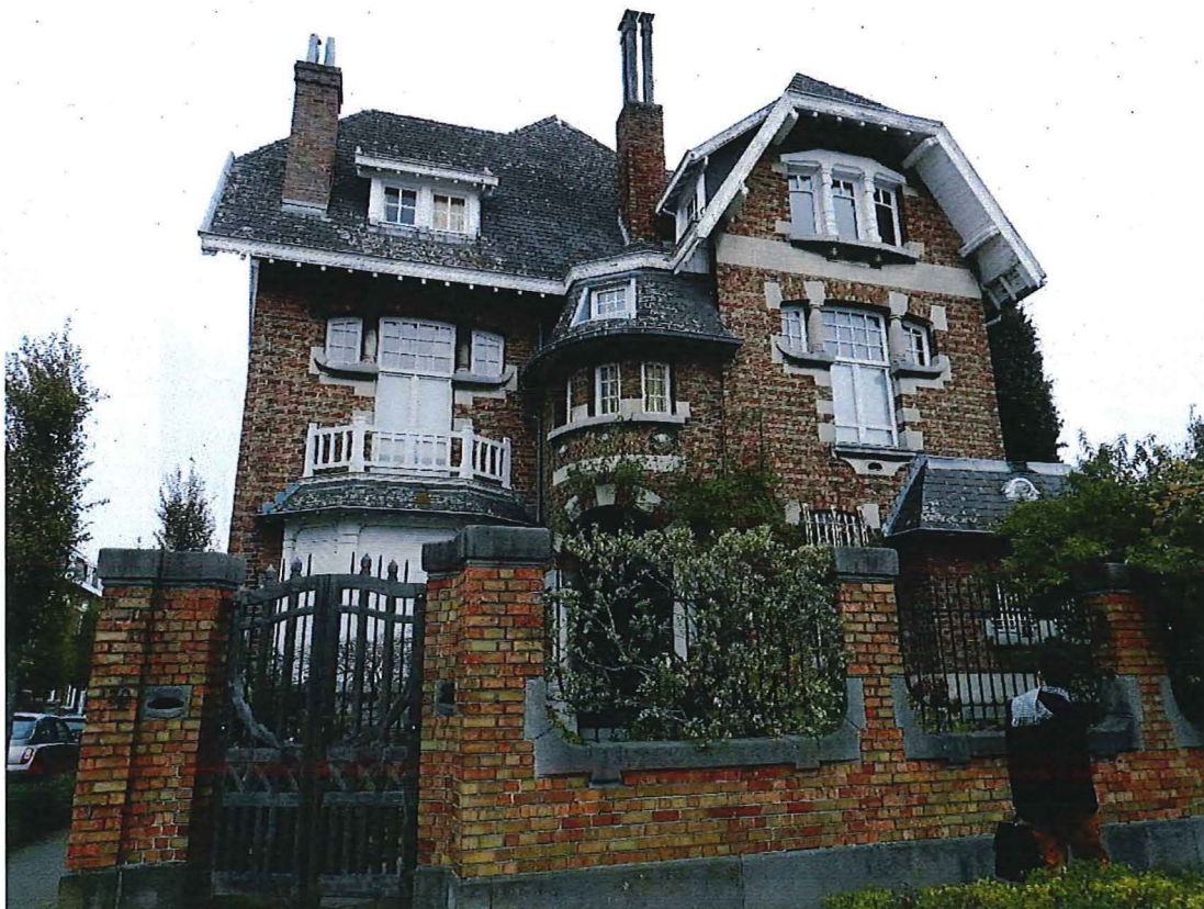
Foto 4: De op het westen gerichte voorgevel van de villa in cottagestijl (16/11/2017).