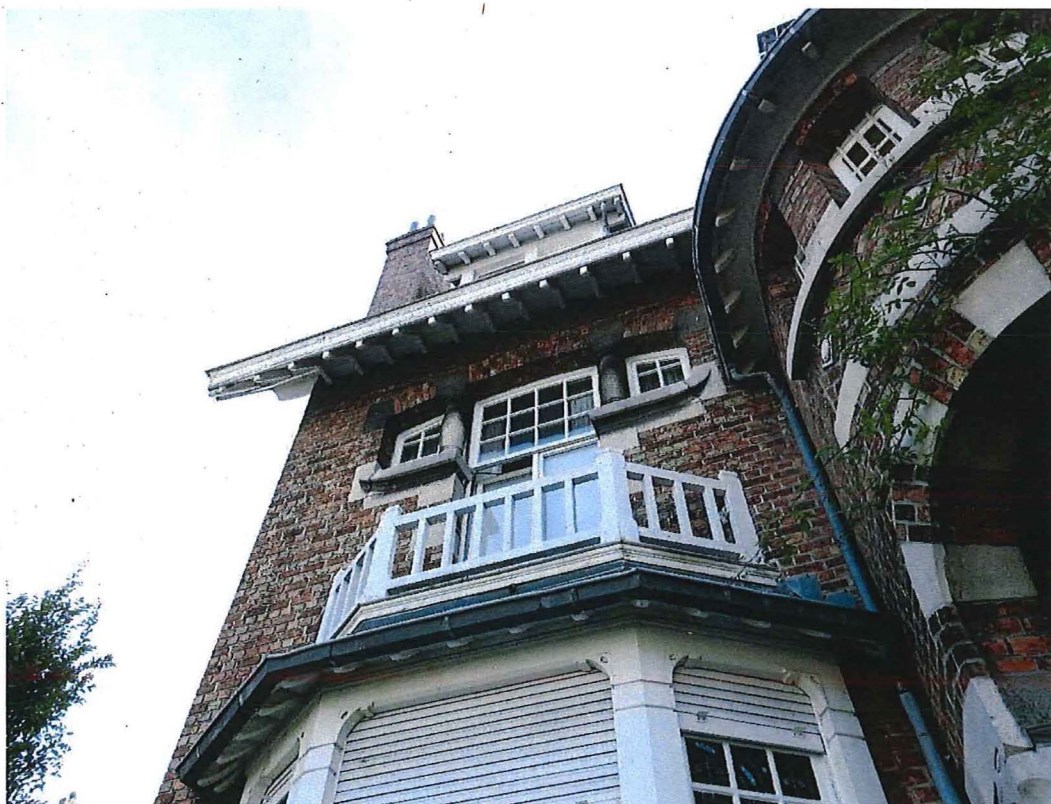
Foto 9: Linkertravee van de voorgevel. Zicht op het rechthoekig venster met drieledig bovenlicht dat uitgeeft op een balkon met vernieuwde borstwering (28/08/2017).