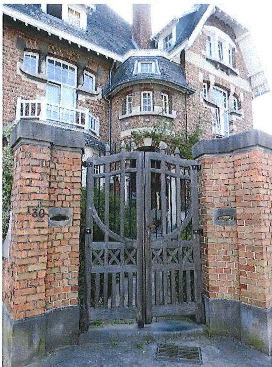
Foto 5: Hekpijlers met houten toegangshek met ingewerkte natuurstenen brievenbusopening (28/08/2017).