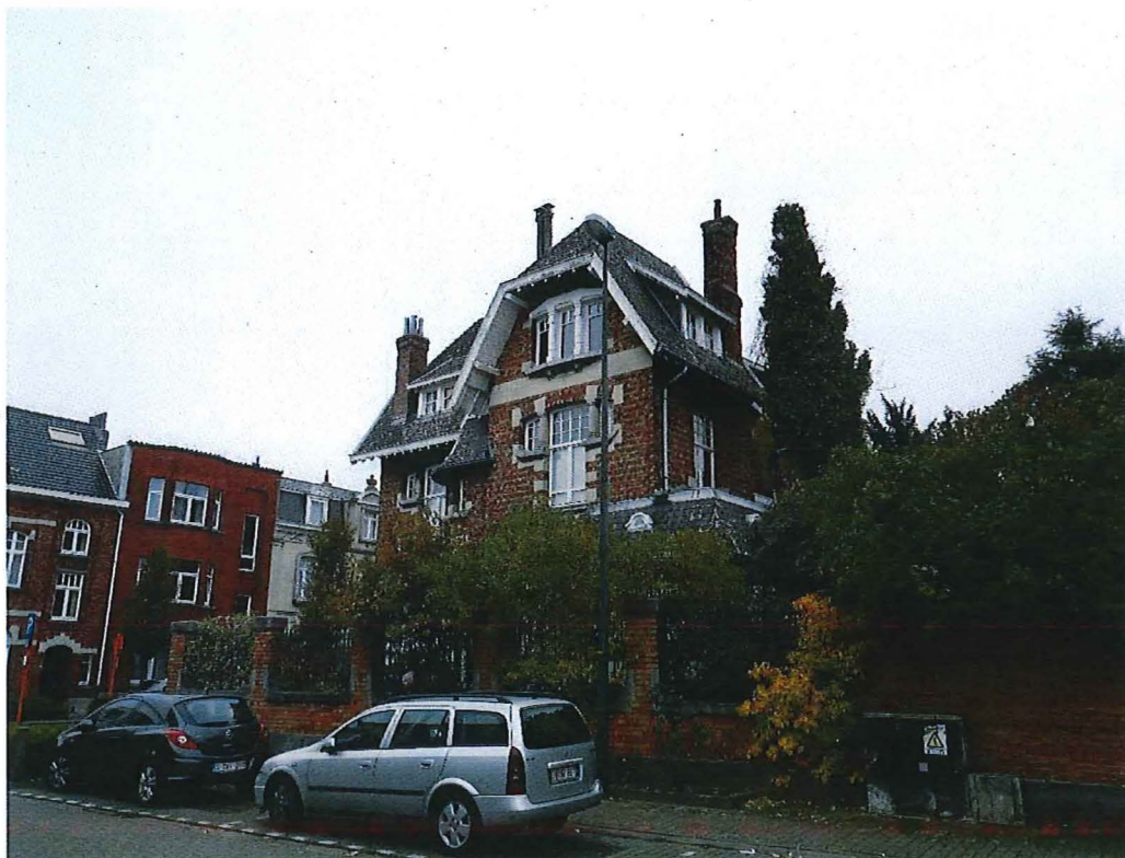
Foto 2: Zicht op de villa in cottigestijl met omheiningsmuur en hekwerk vanuit de Onderwijsstraat (16/11/2017).