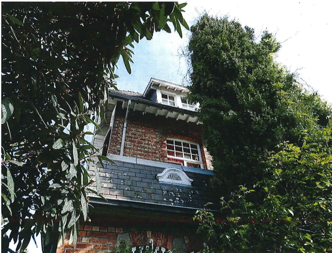
Foto 16: Zicht op de linkertravee van de achtergevel. In het dakvolume van de bijkeuken steekt een origineel ventilatierooster (28/08/2017).