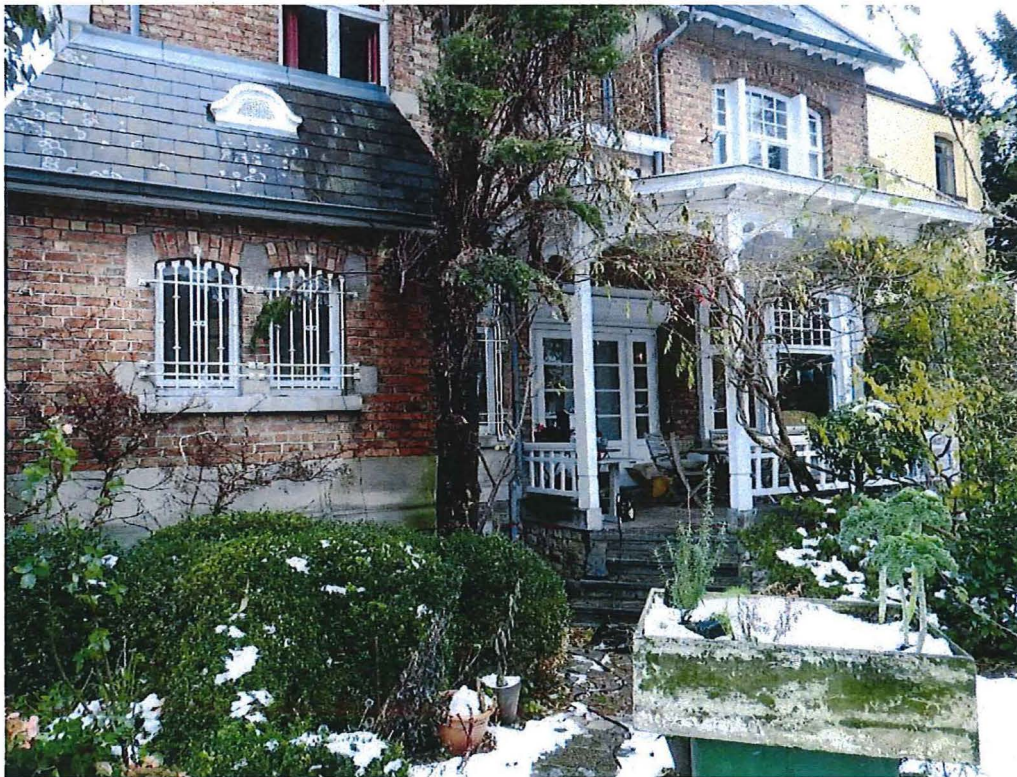
Foto 14: Zicht op het overdekt terras en het overhoeks volume van de bijkeuken in de linkertravee (12/12/2017).