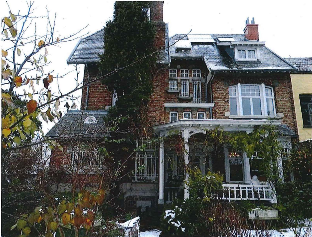
Foto 13: De op het zuiden gerichte achtergevel van de villa in cottigestijl met bow-window en overdekt terras (12/12/2017).