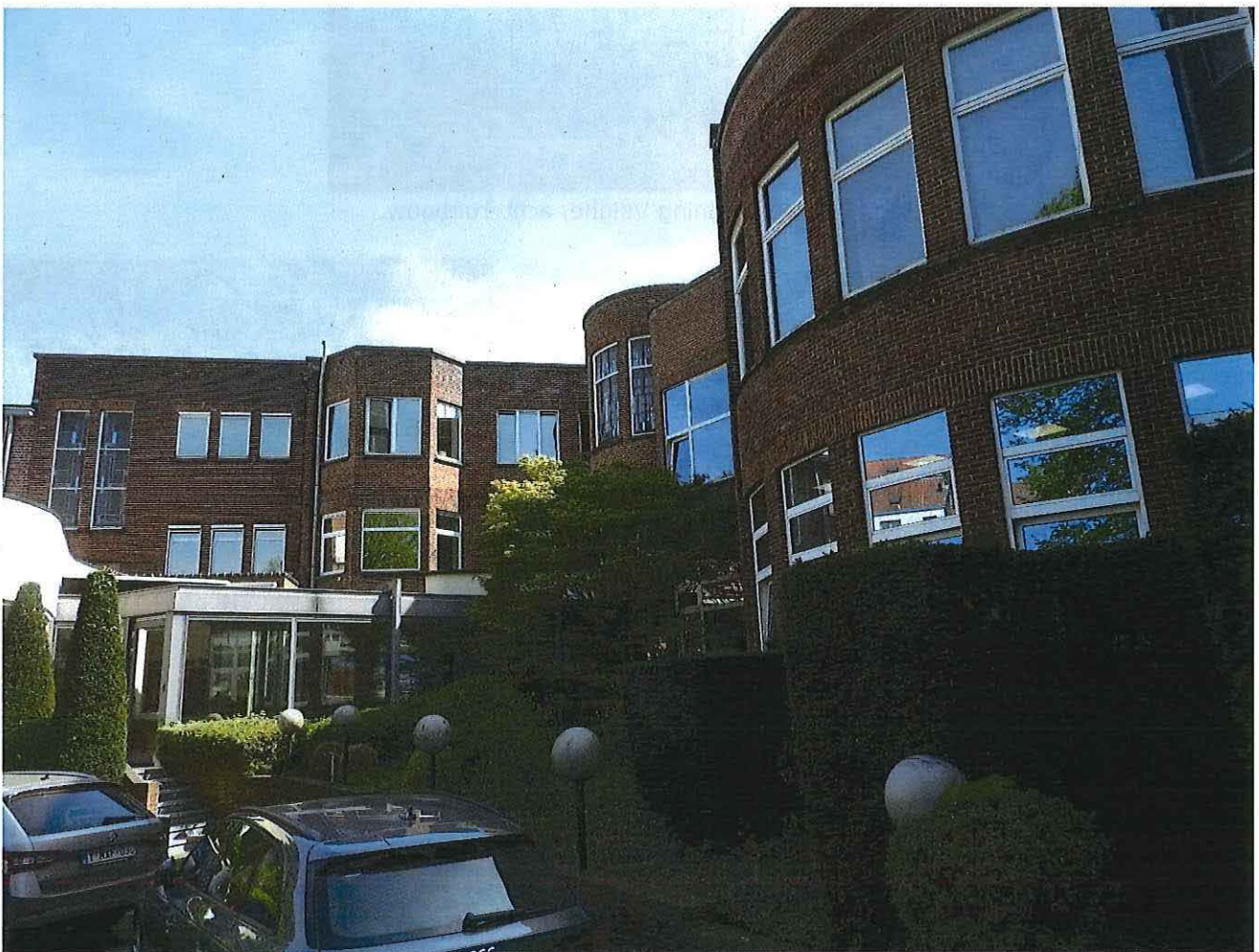
Foto 14: Woning Velghe en kantoren ACLVB, achtergevels (west) en zijgevel achterbouw ACLVB (noord), zicht vanuit het binnengebied.