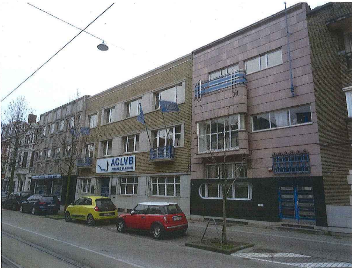
Foto 2: Van rechts naar links: Woning Velghe (1936), Secretariaat van de ACLVB (1936, uitgebreid 1947), en uitbreiding kantoren ACLVB (1966), Koning Albertlaan 93-97 in Gent.