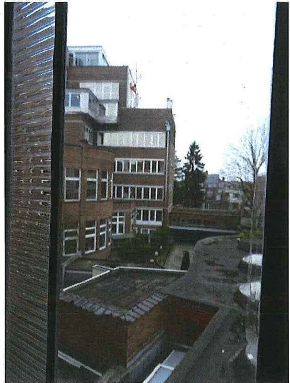
Foto 11: Kantoren ACLVB, binnengebied, zicht vanuit Woning Velghe.