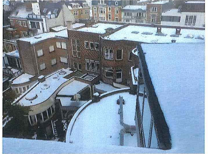
Foto 13: Woning Velghe en kantoren ACLVB, achtergevels (west), zicht vanuit de kantoren ACLVB.