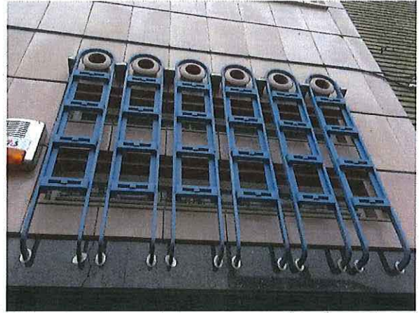
Foto 8: Voorgevel, detail decoratieve afscherming van de vensters boven de deur.