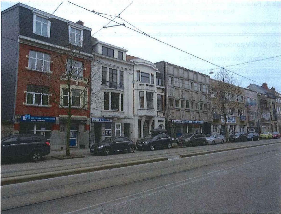
Foto 1: Huidige kantoren Algemene Centrale der Liberale Vakbonden (ACLVB), Koning Albertlaan 87-97 in Gent.