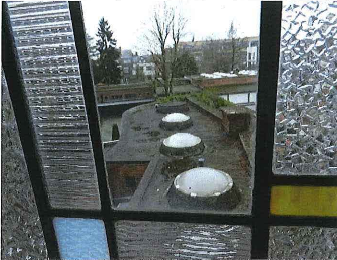
Foto 12: Woning Velghe, achteruitbouw, zicht vanaf de bovenverdieping.