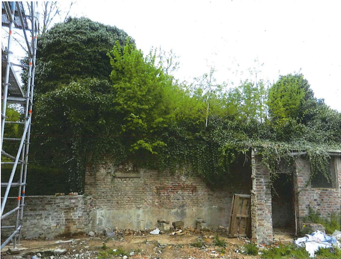
Foto 4: overwoekerd restant van de westgevel, gezien vanuit het zuiden (straatzijde).