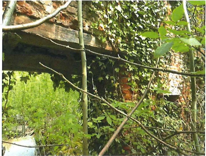
Foto 6: een van de twee kleine doorbrekingen op de begane grond van het poortgebouw, uitkijkend op het erf van de hoeve.