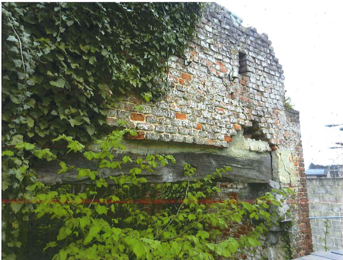
Foto 11: erfzijde van het poortgebouw, met doorbreking (wagenhuis?) onder houten latei..