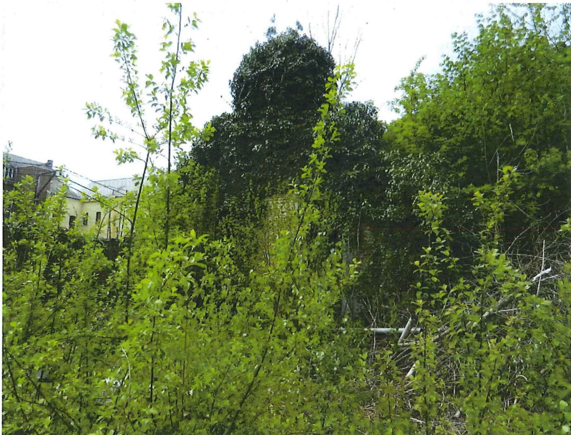
Foto 1: overwoekerd restant van de oostgevel van de boerenwoning.