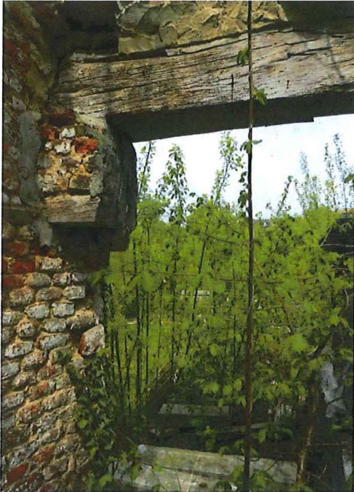
Foto 14: doorbreking (van wagenhuis?) in het poortgebouw, uitkijkend op het erf van de hoeve.