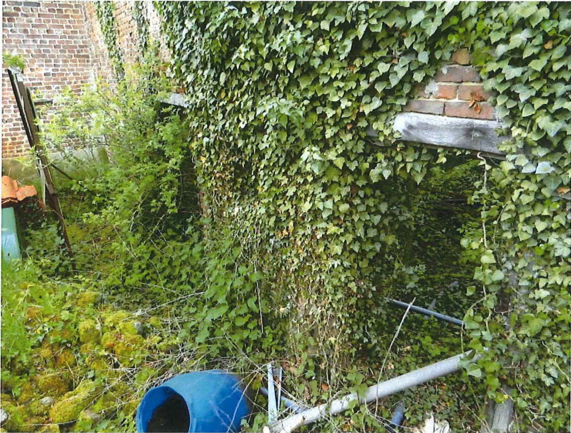
Foto 12: erfzijde van het poortgebouw met twee doorbrekingen naar de begane grond.