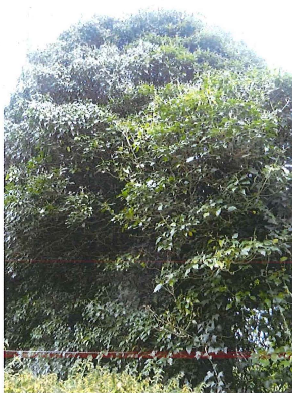
Foto 5: overwoekerd restant van de westgevel, gezien vanuit het westen.