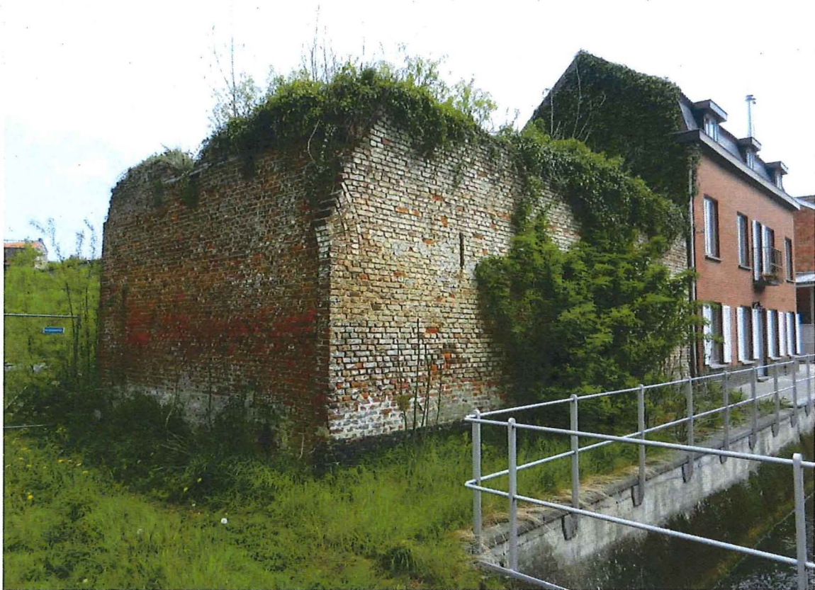
Foto 10: het poortgebouw, met aanzet van de korfboog van de verdwenen poort.