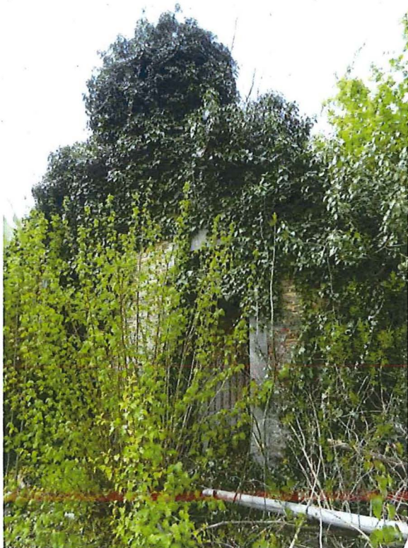
Foto 2: overwoekerd restant van de oostgevel van de boerenwoning.