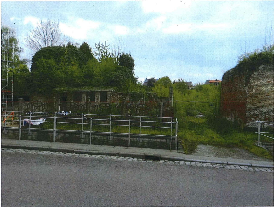
Foto 8: het erf van de Josephinehoeve naast het poortgebouw, gezien vanuit de Kloosterstraat.