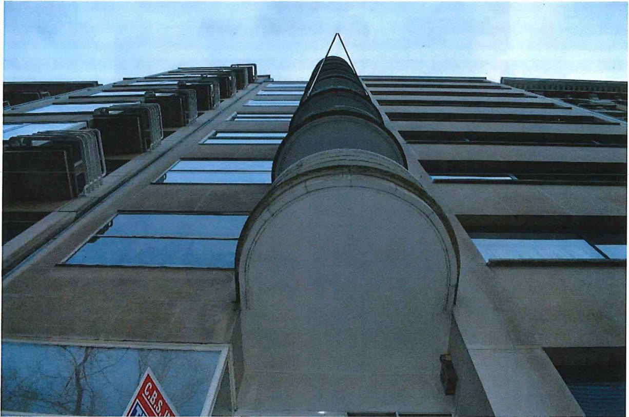
Foto 4: Voorgevel: verschil in plaatsing vensters (in het gevelvlak/verdiept)