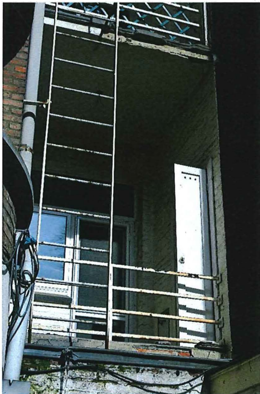
Foto 12: Achtergevel: keuken met koer, voorzien van ingebouwde voorraadkast en vuilluik