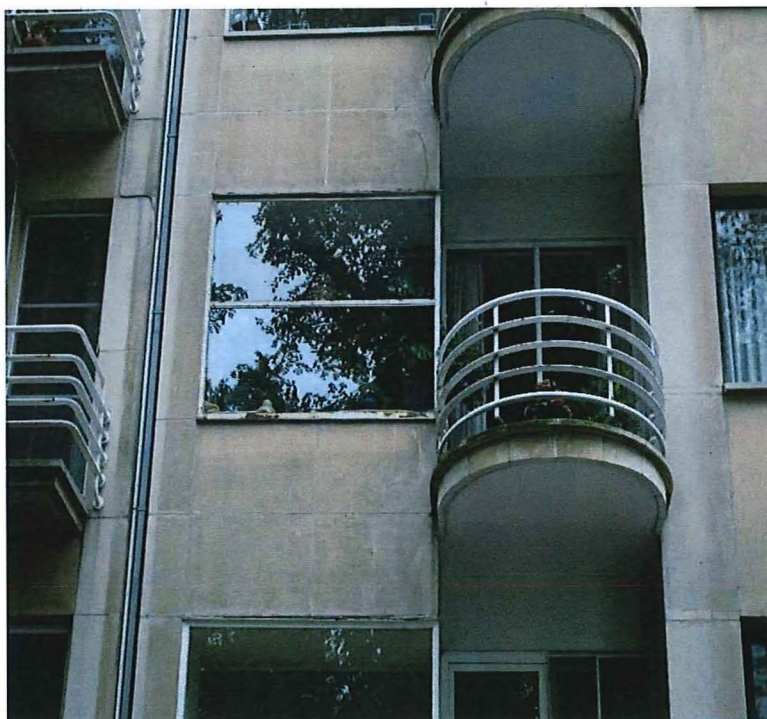
Foto 3: Voorgevel, 2de verdieping: venster eetplaats (vroegere wintertuin) en balkon