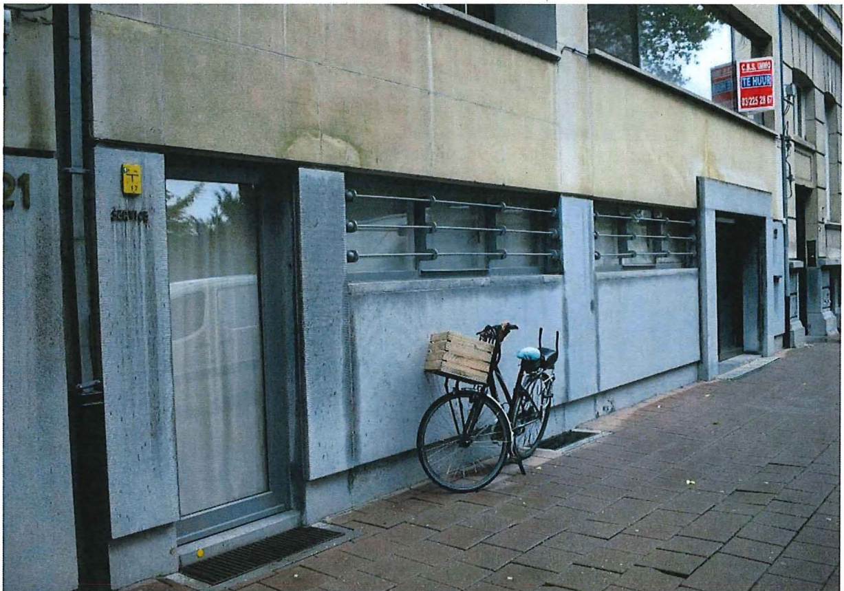
Foto 5: Voorgevel: begane grond met gedrukte pui in blauwe hardsteen: dienstingang en hoofdingang