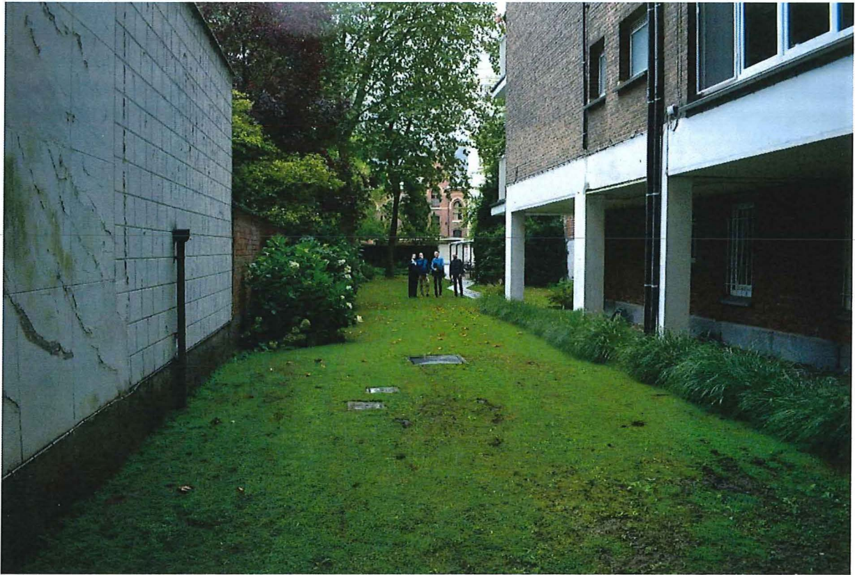
Foto 14: Achterbouw en diep perceel met tuin dat reikt tot aan de De Merodelei