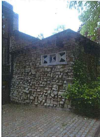
Foto 6: Noordelijke uitbouw met de inkom, claustra in de oostzijde.