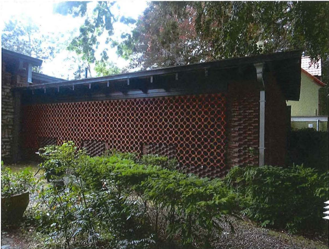
Foto 12: Volume ten noordwesten (keuken en diensttoegang), met oostzijde afgeschermd door claustra.