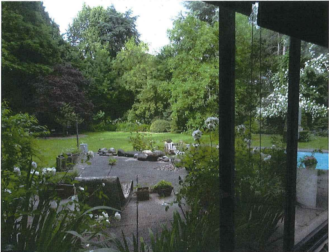
Foto 33: Terras boven het souterrain van de oostvleugel (zicht vanuit interieur).