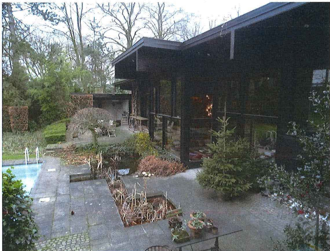
Foto 34: Terrassen aansluitend bij de zuidgevel (zicht vanuit interieur).