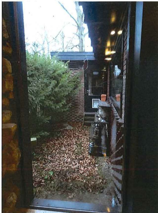
Foto 37: Westzijde van de noordwestelijke vleugel met keuken en diensttoegang (zicht vanuit interieur).