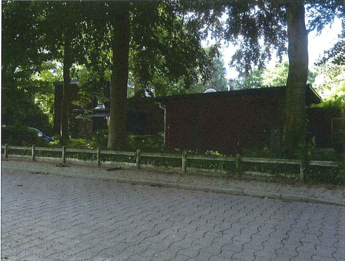
Foto 1: Voorgevel (noorden) van Woning De Somviele met voortuin en beuken langs de Oudeheerweg, zicht vanuit het noordwesten.