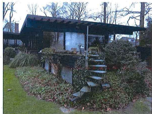
Foto 21: Terras boven het souterrain van de oostelijke vleugel, toegankelijk met draaitrap.