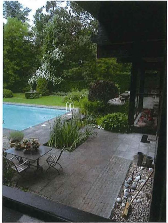
Foto 36: Zwembad en terras met waterpartij (zicht vanuit interieur).