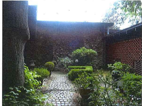
Foto 9: Voortuinaanleg en toegangspad tot de voordeur, zicht naar de noordgevel van de living.