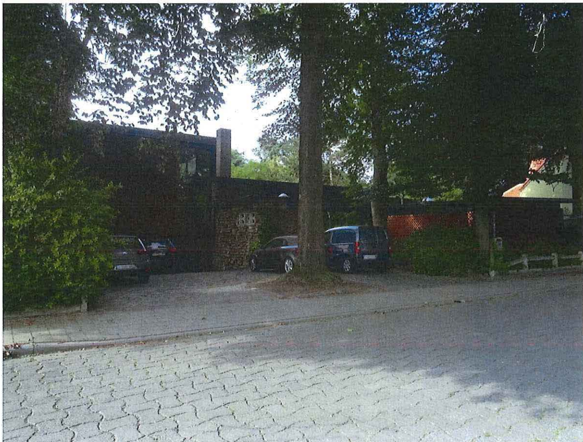
Foto 2: Voorgevel (noorden) en oprit aan de Oudeheerweg, zicht vanuit het noordoosten.