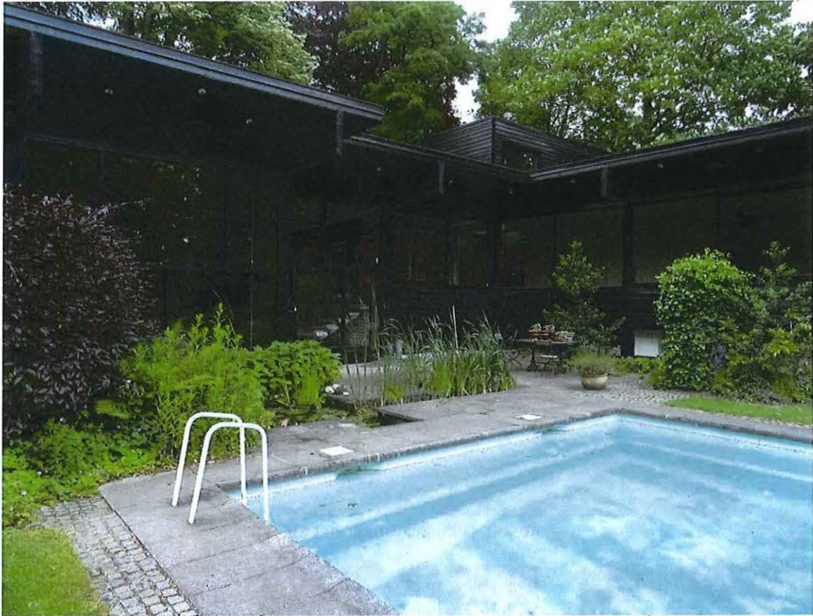
Foto 22: Tuingevel (zuiden) en terras met waterpartij en zwembad.