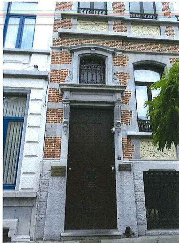
Foto 8: Voordeur herenwoning Delacre met entablementomlijsting in neo-Vlaamserenaissancestijl met getralied bovenlicht (18 juni 2018).