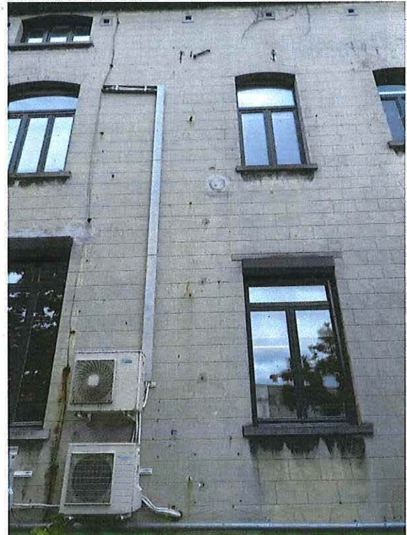
Foto 17: Detail middelste travee achtergevel herenwoning Delacre (18 juni 2018).