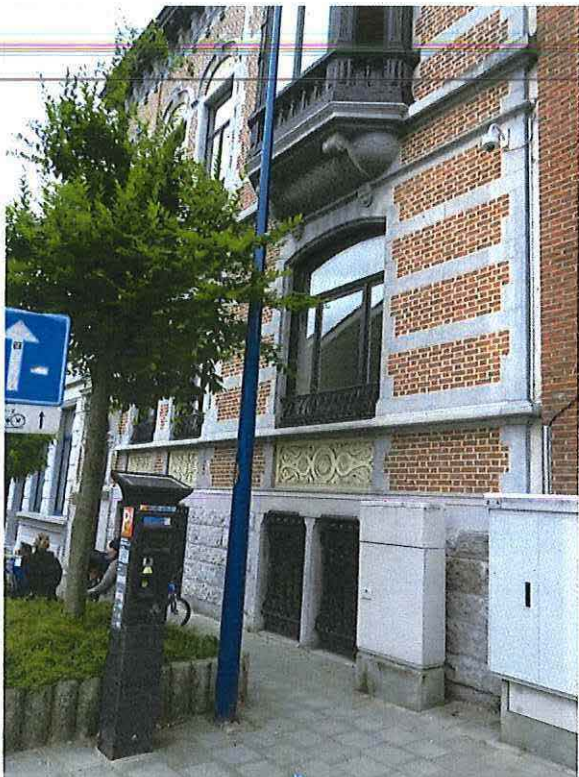
Foto 7: Detail getoogde raampartij rechter zijtravee voorgevel herenwoning Delacre (18 juni 2018).