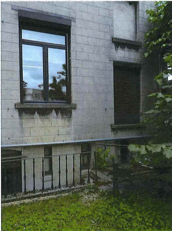
Foto 16: Detail rechtertravee achtergevel herenwoning Delacre (18 juni 2018).