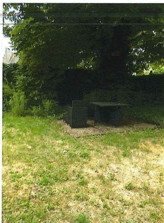
Foto 25: Zicht op de stadstuin met solitaire boom achter de woning (18 juni 2018).