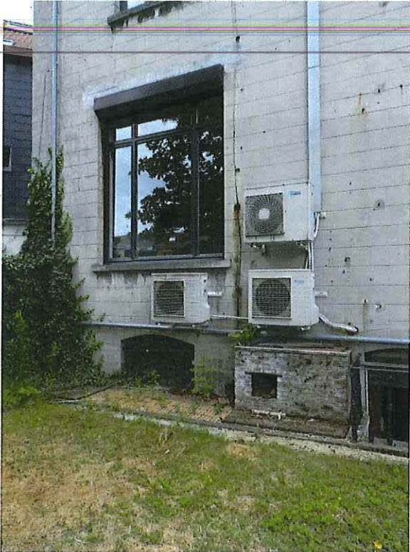
Foto 18: Detail verbreed linker zijtravee achtergevel herenwoning Delacre met later aangebrachte, storende technische installaties en lage bakstenen aanbouw ter hoogte van de plint (18 juni 2018).