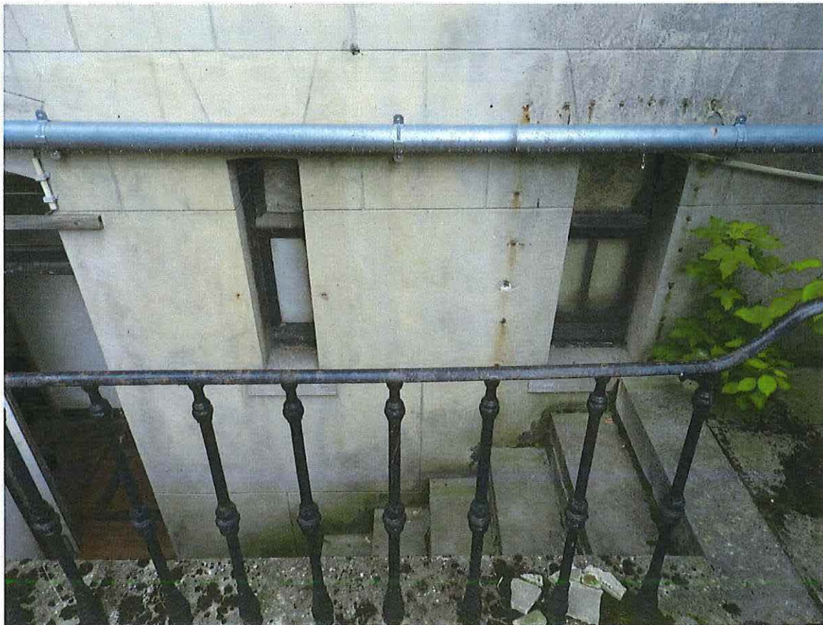
Foto 23: Detail hardstenen keldertrap achtergevel herenwoning Delacre (18 juni 2018).