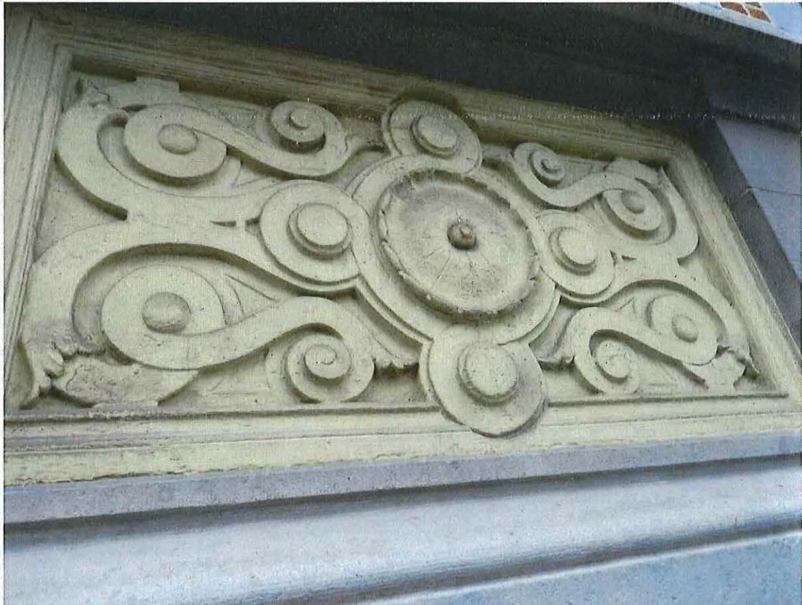
Foto 12: Detail decoratief stucwerkpaneel in de borstwering van de raampartijen in de eerste bouwlaag (18 juni 2018).