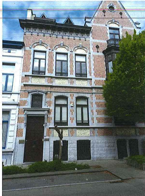
Foto 2: Voorgevel van de herenwoning Delacre in de Van Helmontstraat 2 (24 april 2017).