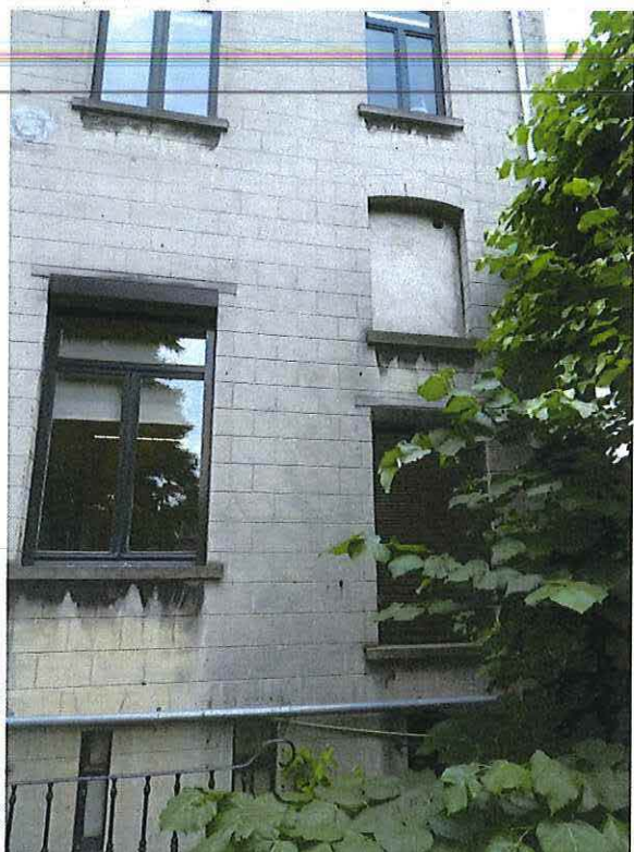
Foto 24: Detail rechter zijtravee herenwoning Delacre (18 juni 2018).