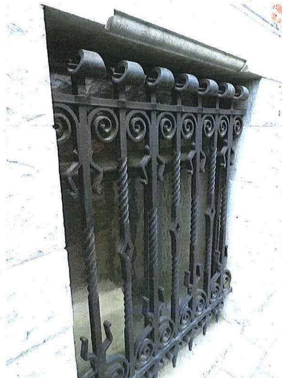
Foto 10: Detail smeedijzeren diefijzer kelderraam onderbouw herenwoning Delacre (18 juni 2018).