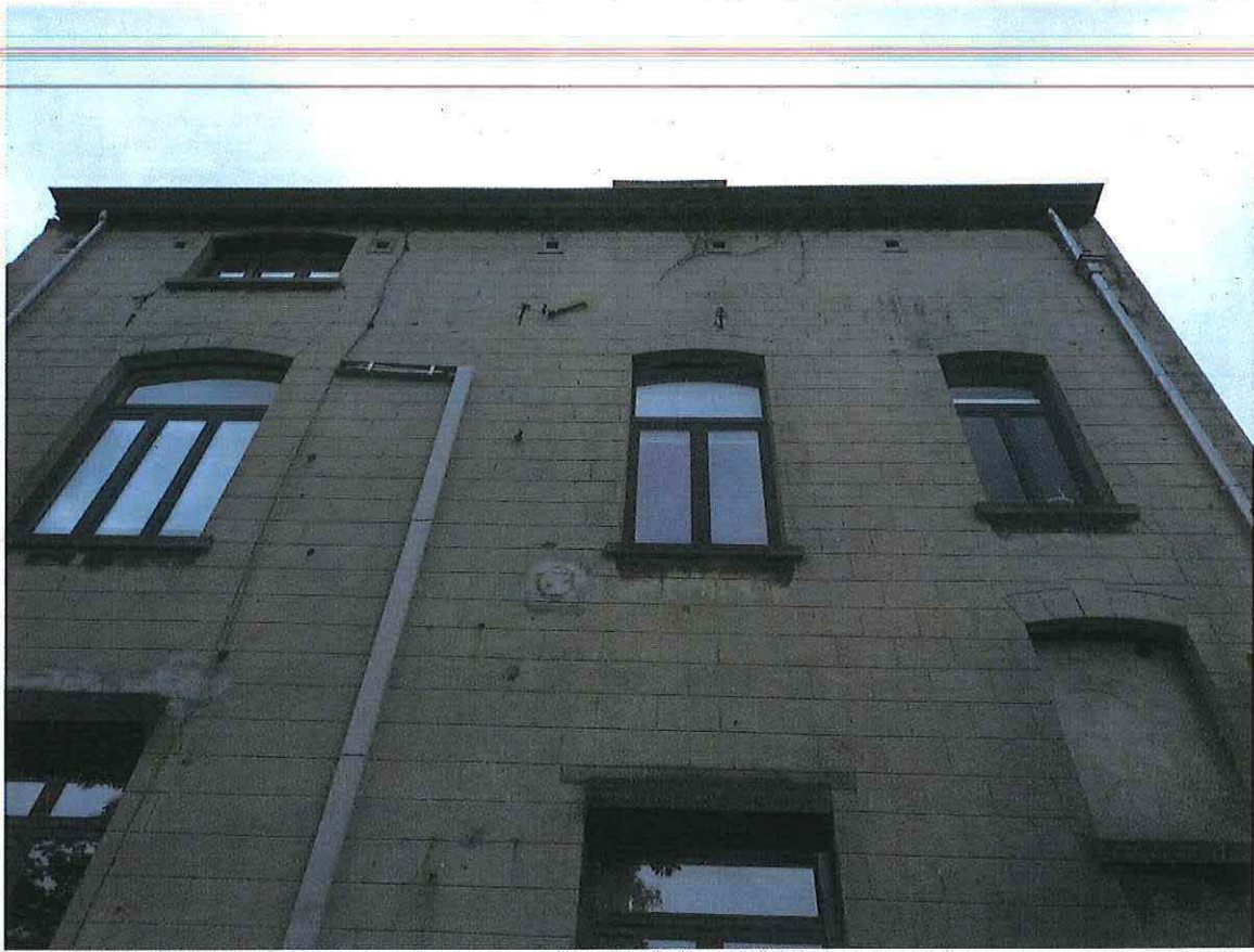
Foto 15: Zicht op de gecementeerde achtergevel van de herenwoning Delacre (18 juni 2018).