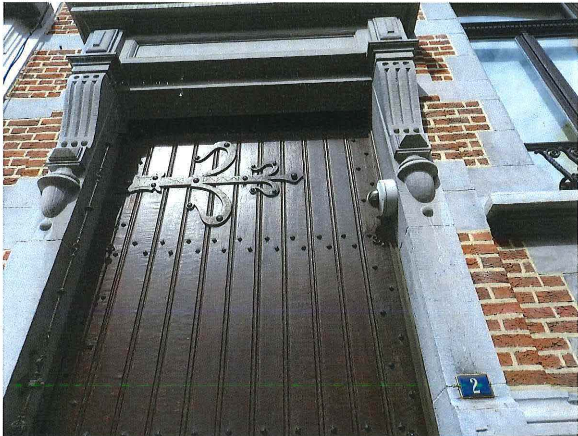
Foto 14: Detail geklante voordeur met origineel deurbeslag en trekbel. De voordeur is voorzien van een neo-Vlaamserenaissance-getinte hardstenen entablementomlijsting (18 juni 2018).