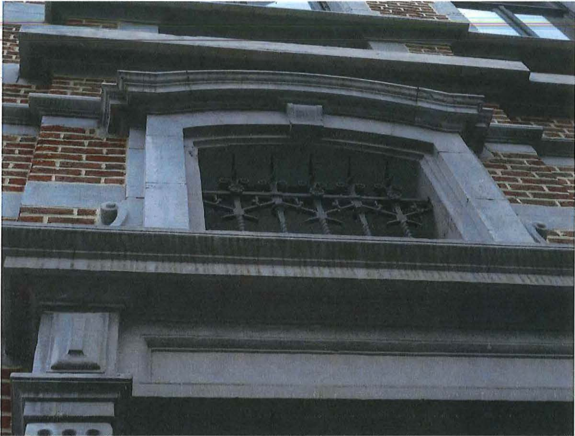
Foto 11: Detail getralied bovenlicht voordeur herenwoning Delacre (18 juni 2018).