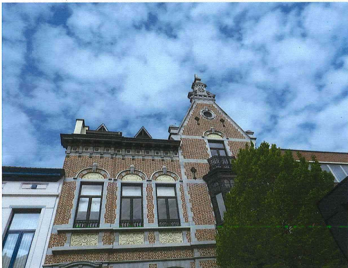
Foto 3: Lijst- en puntgevel met geveltop van de herenwoning Delacre (24 april 2017).