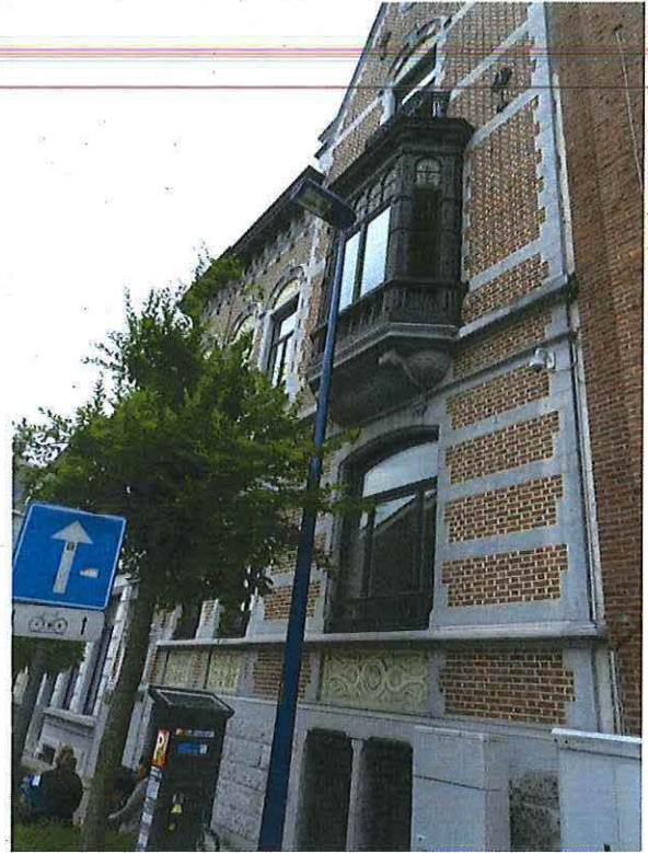
Foto 5: Zicht op de erker op hardstenen sokkel met consoles herenwoning Delacre (18 juni 2018).