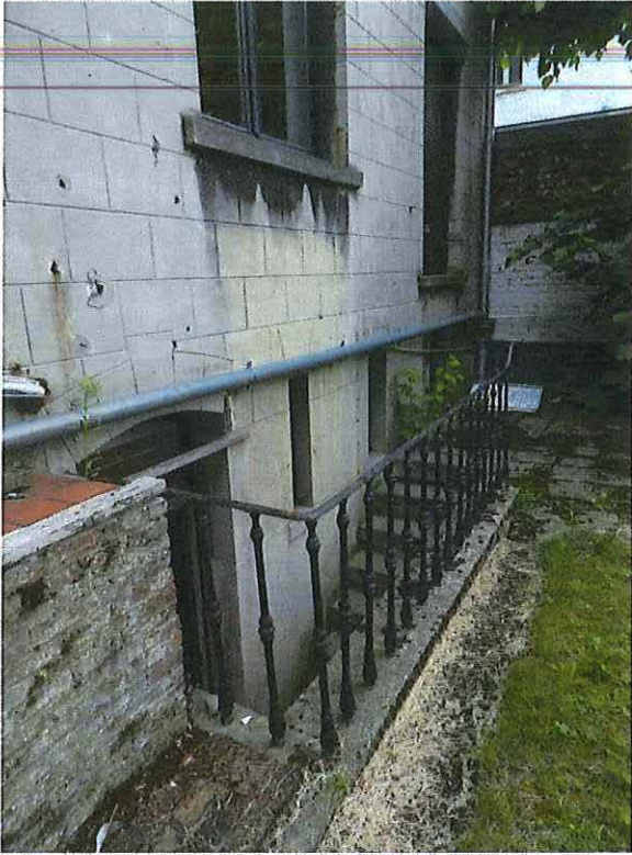
Foto 21: Detail keldertrap met balusterborstwering (18 juni 2018).