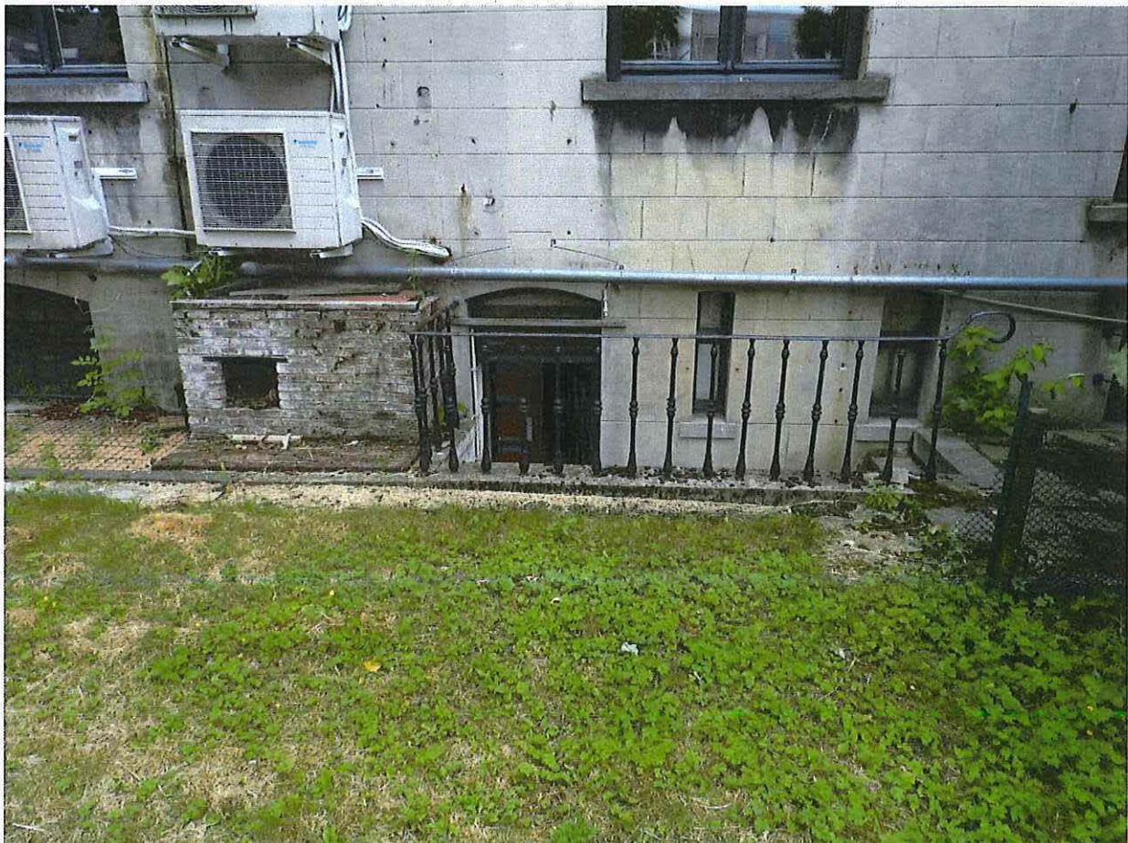
Foto 20: Zicht op de keldertrap achtergevel met ijzeren balusterborstwering (18 juni 2018).