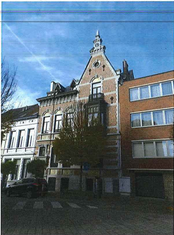
Foto 1: Zicht op de voorgevel van de herenwoning Delacre vanuit de Etienne Blondieastraat (16 november 2017).