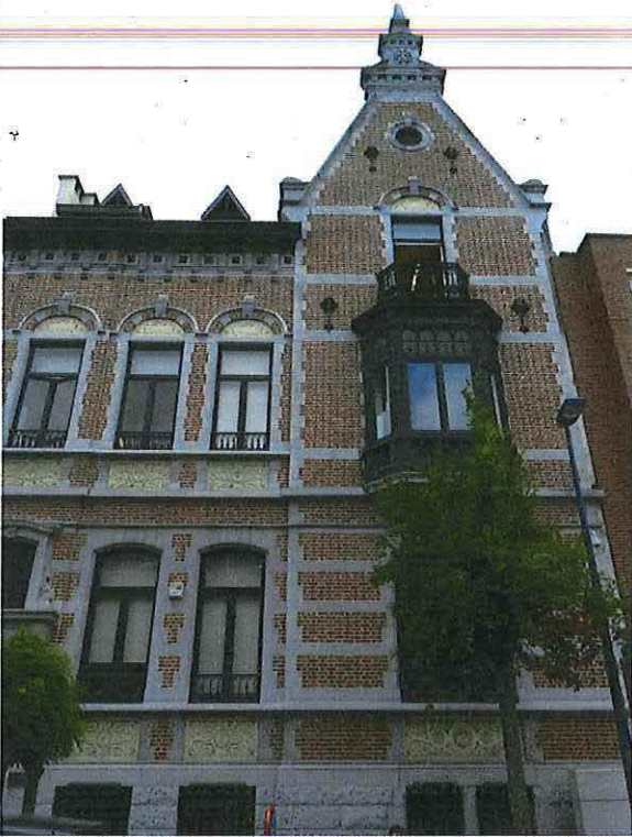
Foto 4: Puntgevel herenwoning Delacre met houten erker (18 juni 2018).