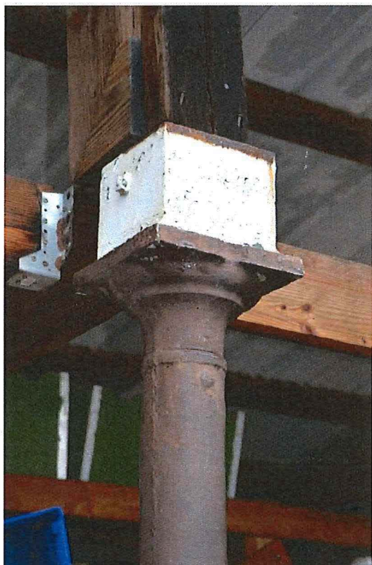
Foto 21: Overdekte speelplaats, detail kapiteel gietijzeren zuil (13/12/2017).