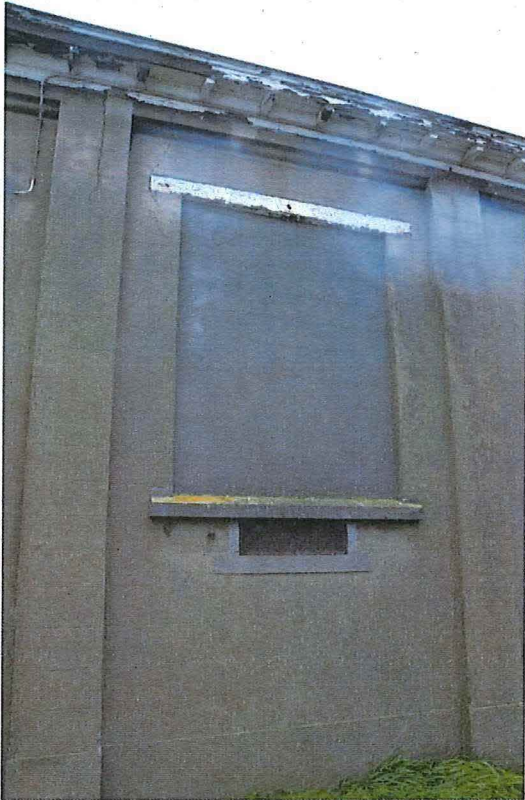
Foto 15: Detail dichtgemaakt venster in de centrale travee van de zuidelijke zijgevel (13/12/2017).