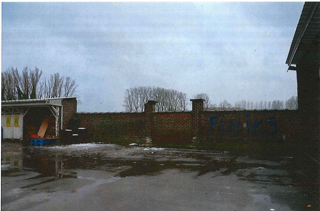
Foto 23: Zicht op de speelkoer en de westelijke schoolmuur met toegangspoort tussen pijlers. Links bevindt zich het volume van de sanitaire blok (13/12/2017).