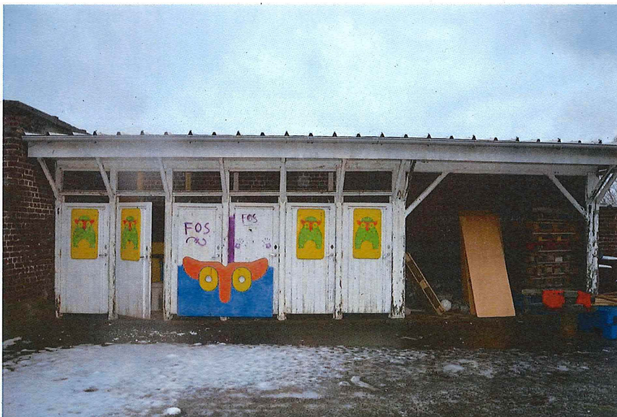
Foto 26: Zicht op de sanitaire blok, met links zes wc-hokjes voorzien van scheidingswanden en rechts een open volume met urinoirs (13/12/2017).