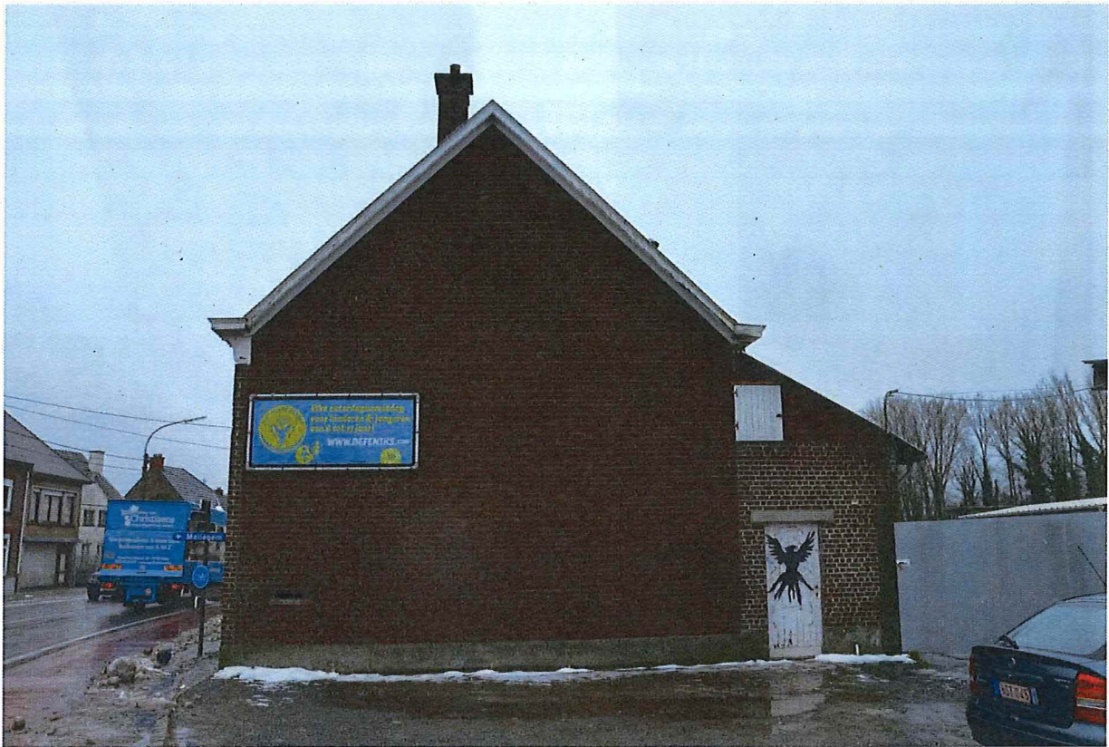
Foto 31: Noordelijke zijgevel van de gemeenteschool (13/12/2017).