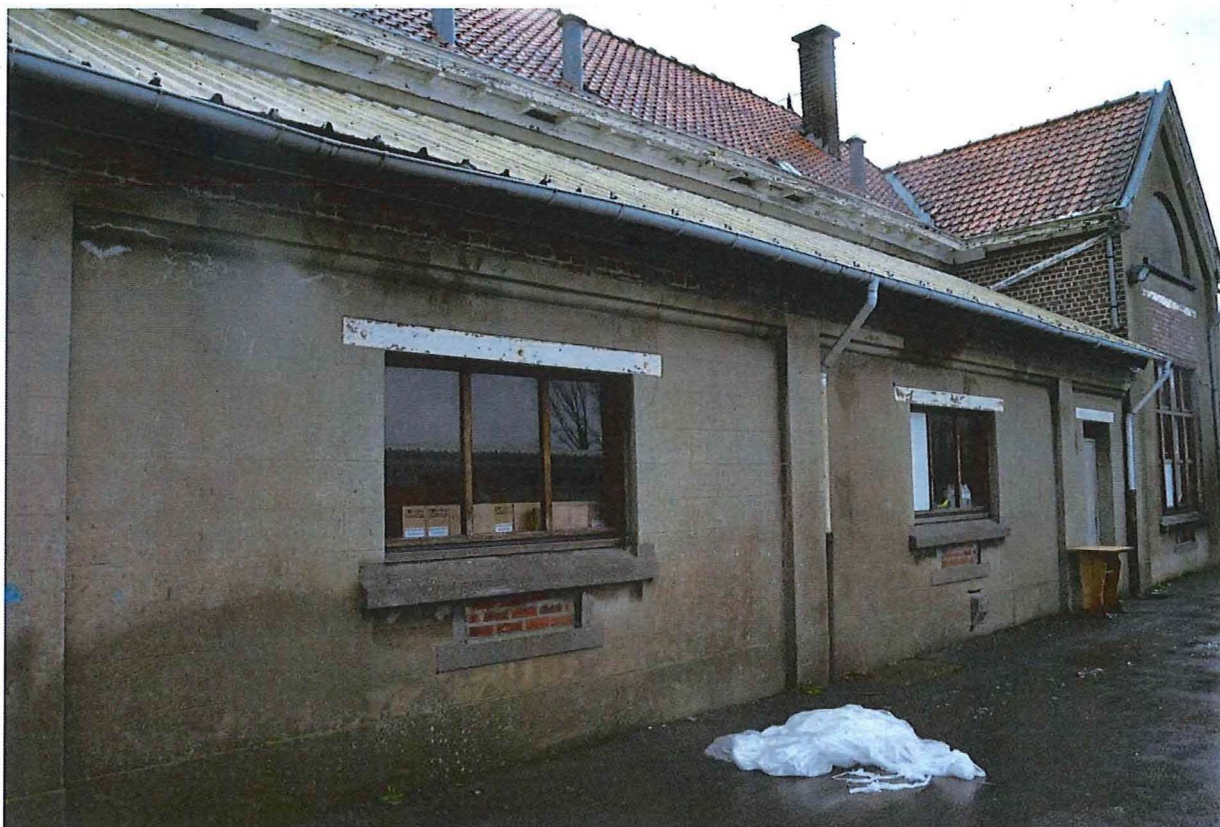
Foto 18: Achtergevel gemeenteschool, volume van de gang (13/12/2017).