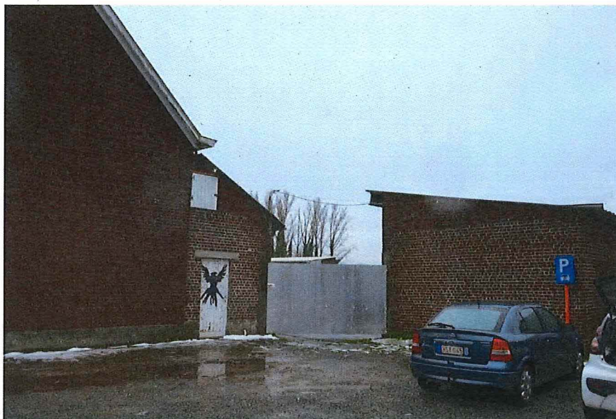
Foto 2: Oprit gemeenteschool Nederzwalm, zicht op toegangshek tot de ommuurde schoolkoer, het volume van de overdekte speelplaats en de toegang tot het schoolgebouw (13/12/2017).