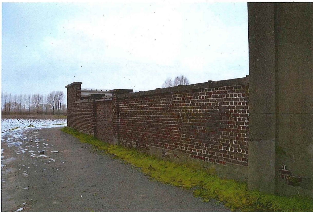
Foto 14: Schoolmuur met gecementeerde plint en toegangspoort tussen pijlers. Deze laatste werd dichtgemetseld (13/12/2017).