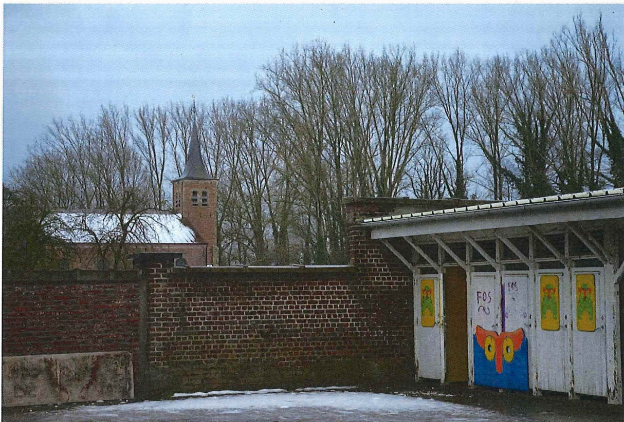
Foto 25: Speelkoer gemeenteschool, detail schoolmuur en sanitaire blok in zuidwestelijke hoek (13/12/2017).