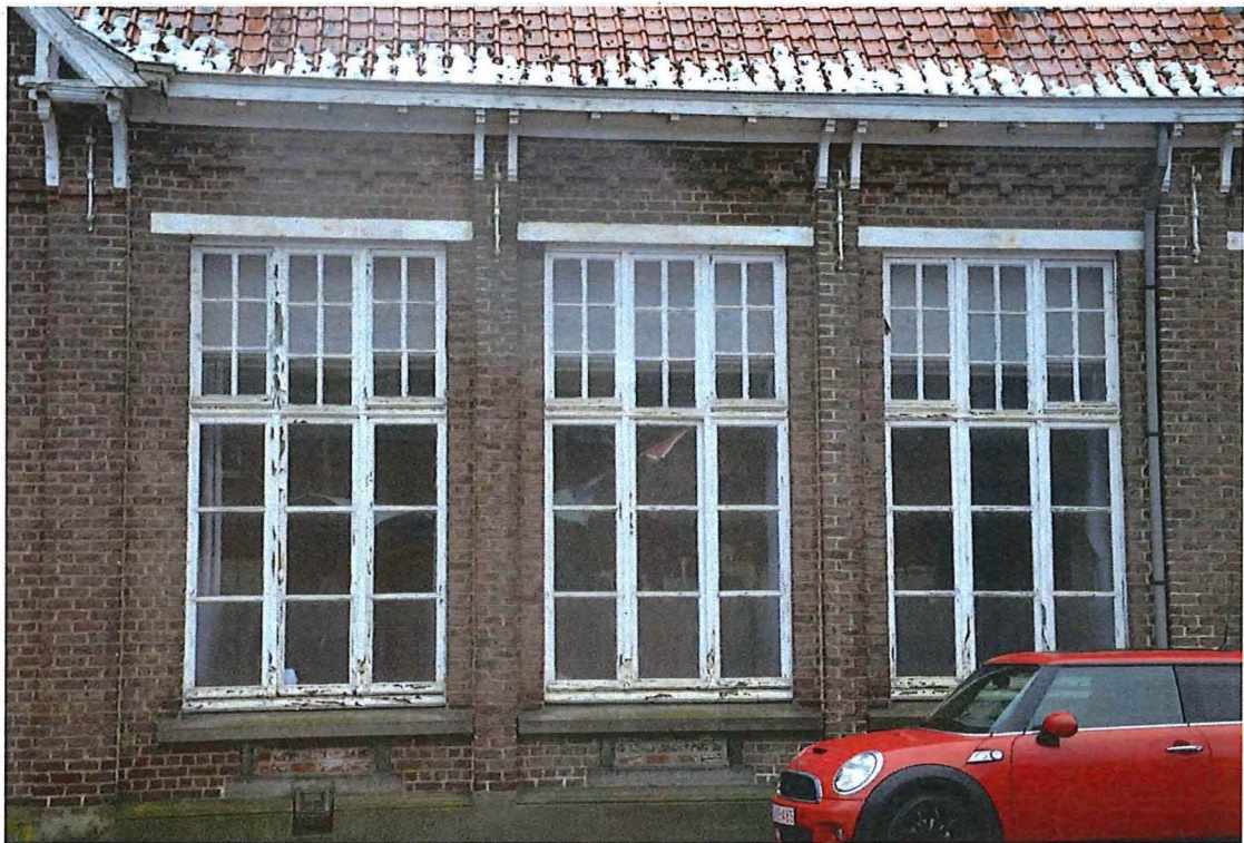
Foto 4: Detail rechthoekige raampartijen voorgevel gemeenteschool Nederzwalm (13/12/2017).