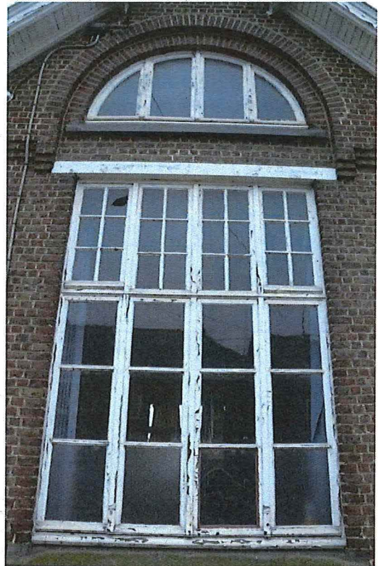
Foto 6: Detail raampartij puntgevel met half rond venster in de geveltop (13/12/2017).