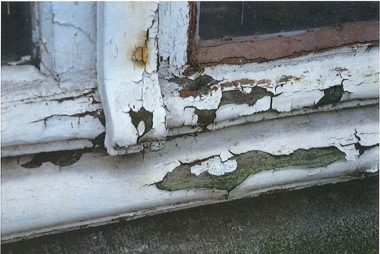
Foto 12: Detail schrijnwerk rechthoekige raampartijen voorgevel. Onder de huidige verflaag bevindt zich de oorspronkelijke groene afwerkingslaag van het schrijnwerk (13/12/2018).