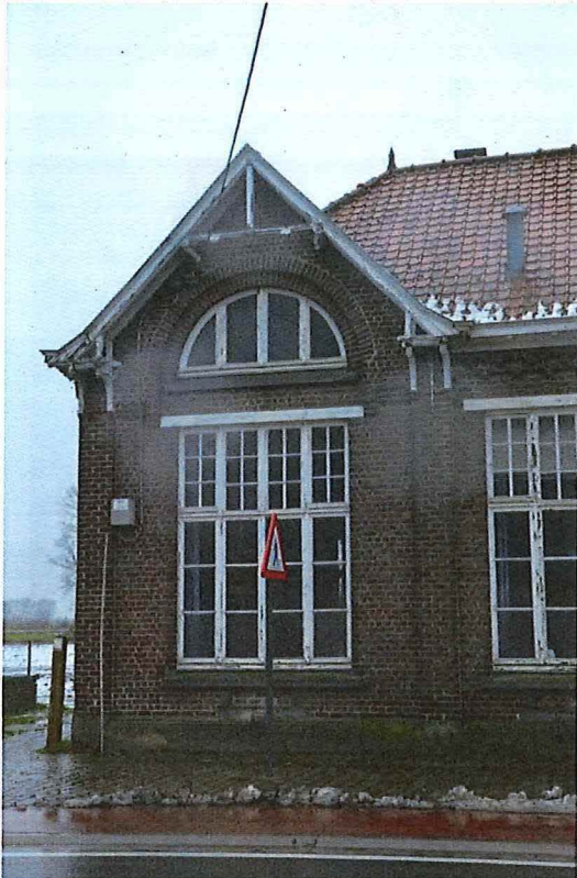
Foto 5: Puntgevel met geprononceerde dakoversteek en piron ter hoogte van de nok (13/12/2017).