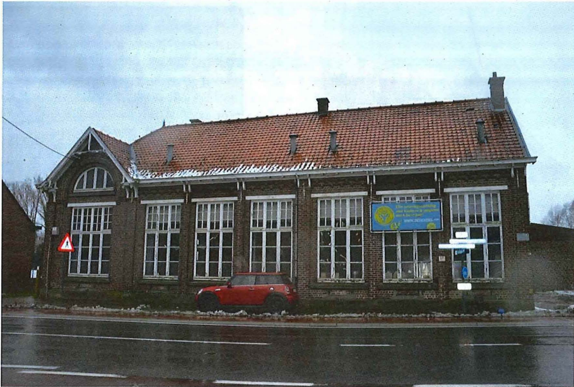
Foto 3: Voorgevel gemeenteschool Nederzwalm, zicht vanuit het oosten (13/12/2017).