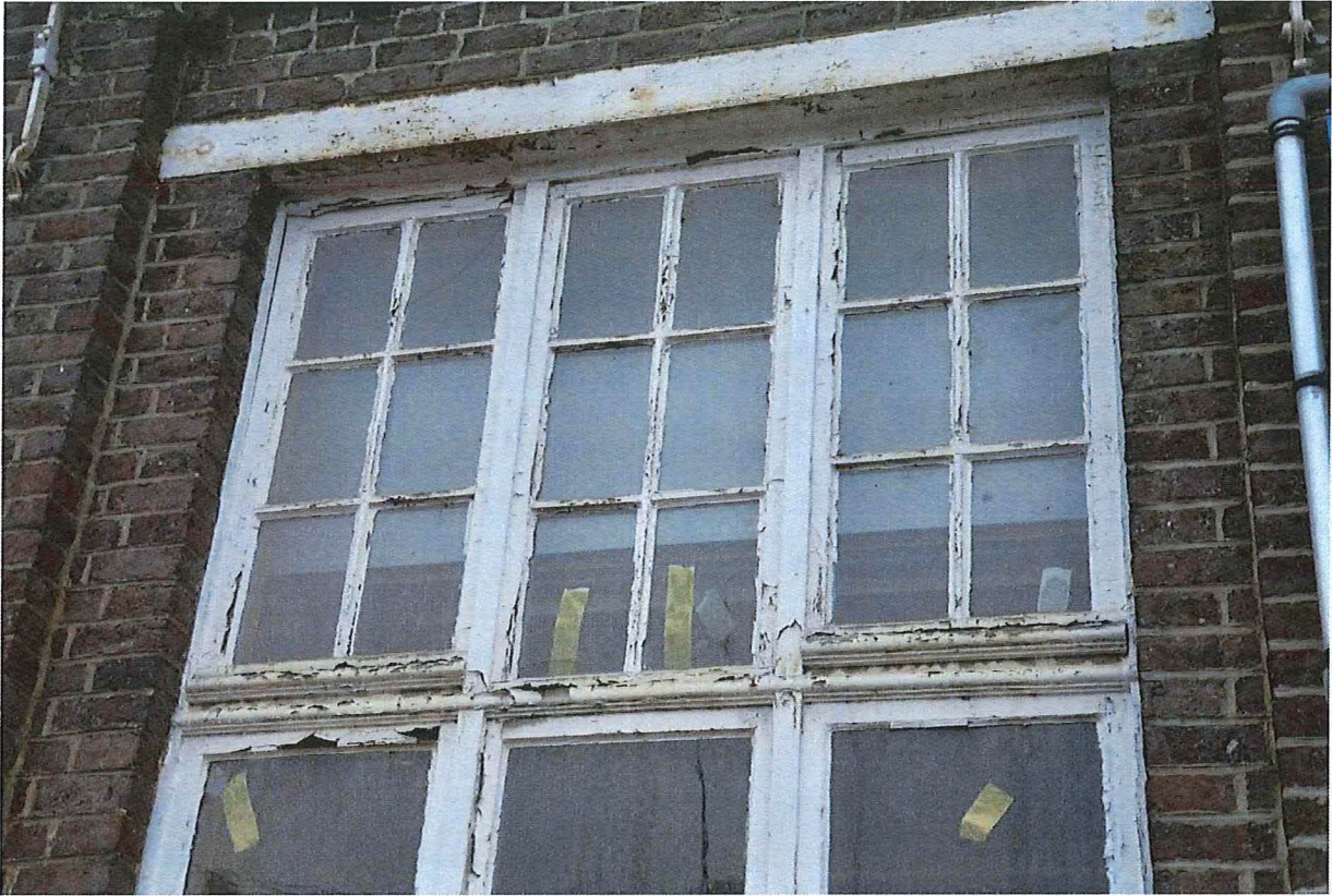
Foto 11: Detail bovenlichten raampartijen voorgevel (13/12/2018).