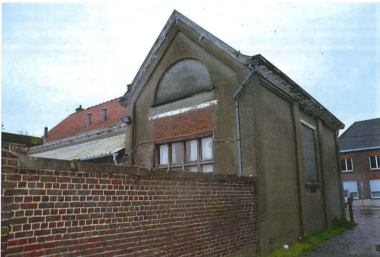
Foto 13: Gecementeerde zuidelijke zijgevel. Langsheen het domein loopt een smalle landweg. Zicht op de schoolmuur en puntgevel van de achtergevel. (13/12/2017).