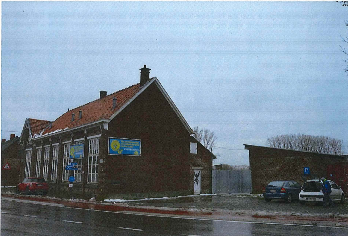
Foto 1: Zicht op de gemeenteschool in Nederzwalm, gezien vanuit het noordoosten (13/12/2017).