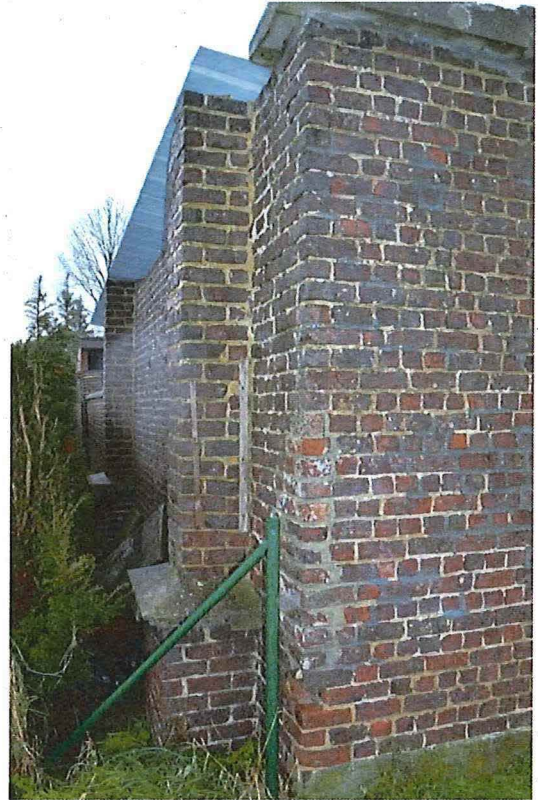
Foto 16: Detail schoolmuur aan de zuidwestelijke hoek (13/12/2017).