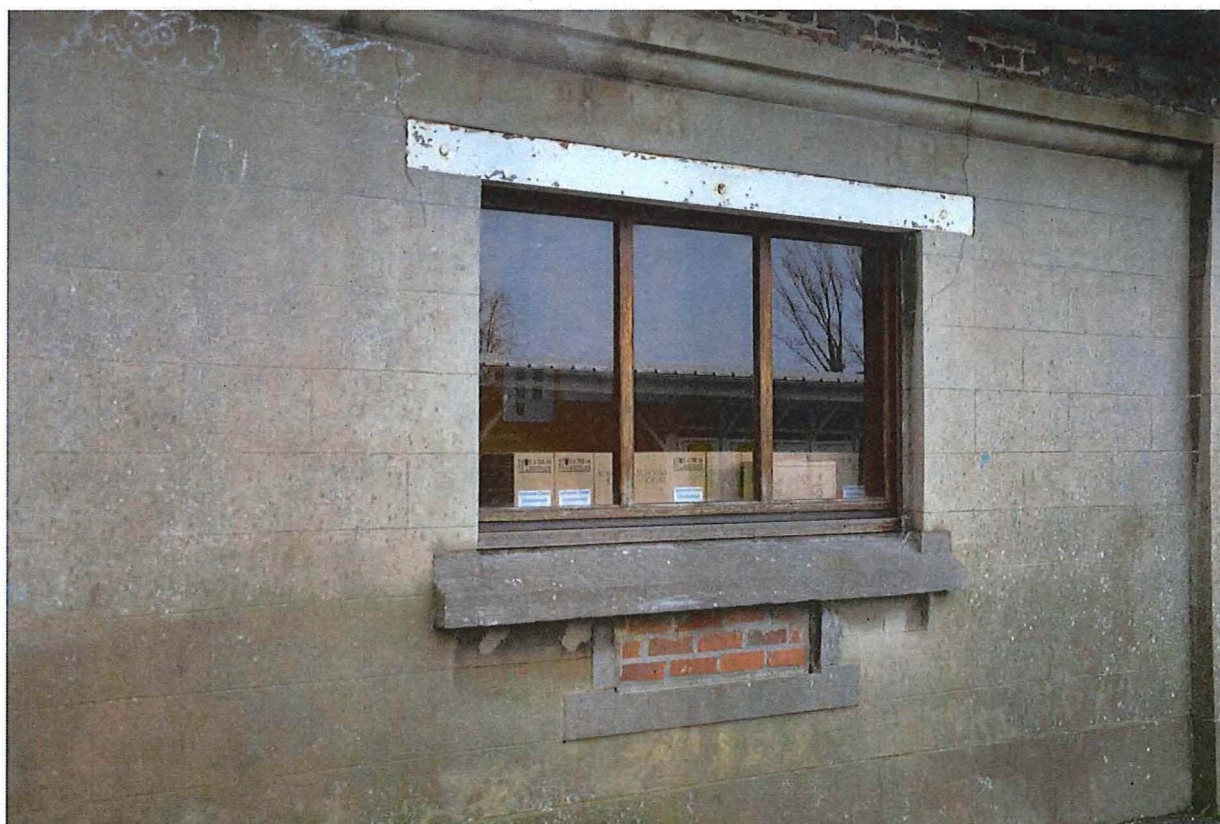
Foto 19: Achtergevel gemeenteschool, detail rechthoekig venster met vernieuwd schrijnwerk (13/12/2017).