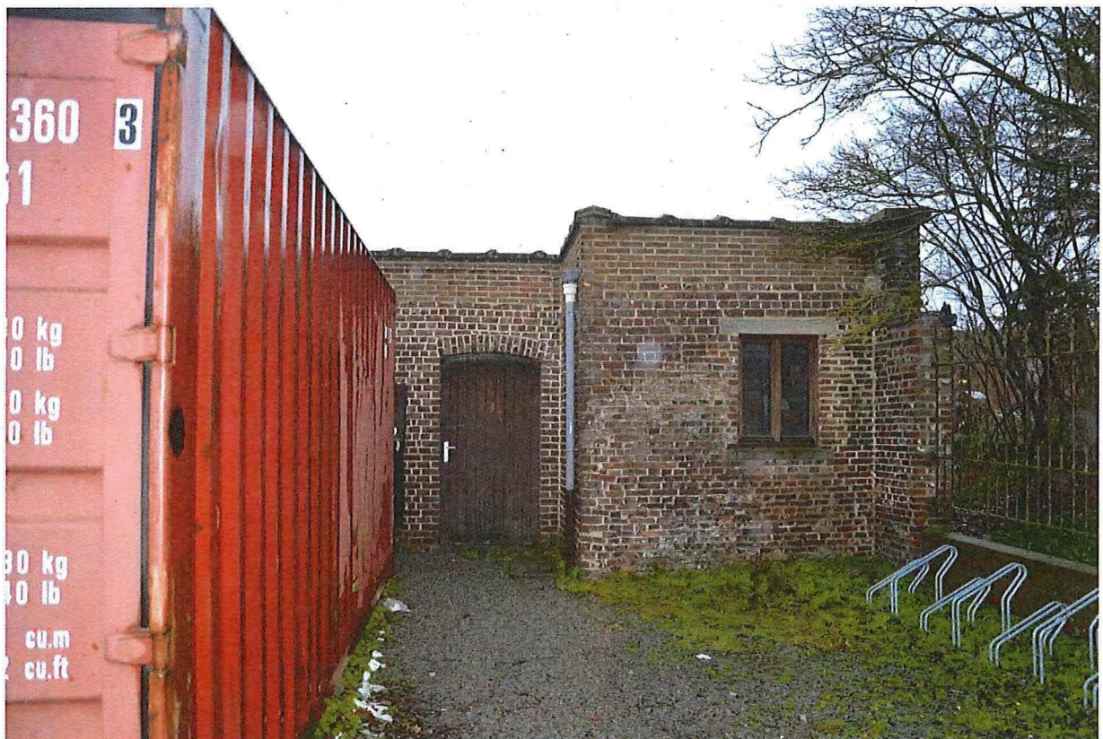
Foto 32: Bijgebouwen aan noordelijke zijde van de schoolsite (13/12/2017).