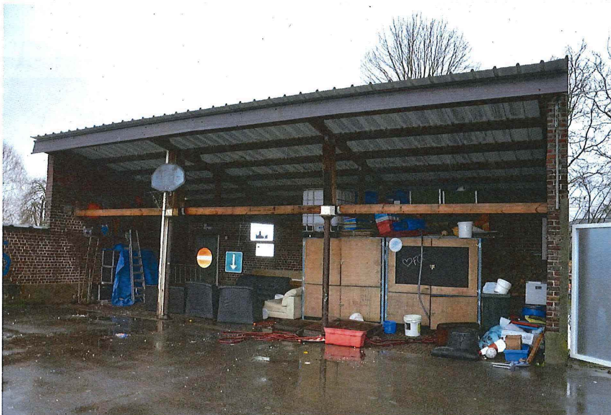
Foto 20: Overdekte speelplaats in noordwestelijke hoek van het domein (13/12/2017).