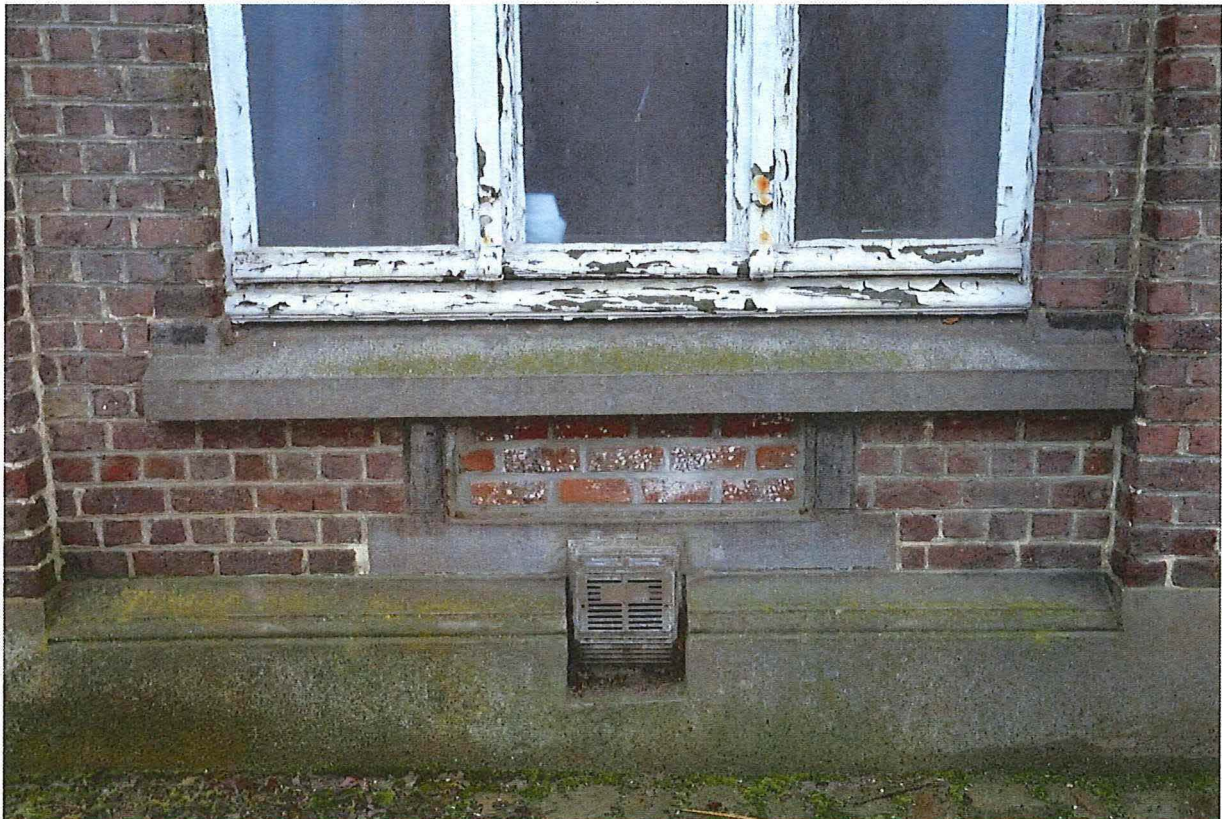
Foto 7: Detail drieledig raam voorgevel. Onder de hardstenen dorpel bevindt zich de omlijsting van de ventilatieroosters. Deze openingen werden dichtgemetseld. Onderin steekt een nieuw ventilatie mechanisme (13/12/2017).