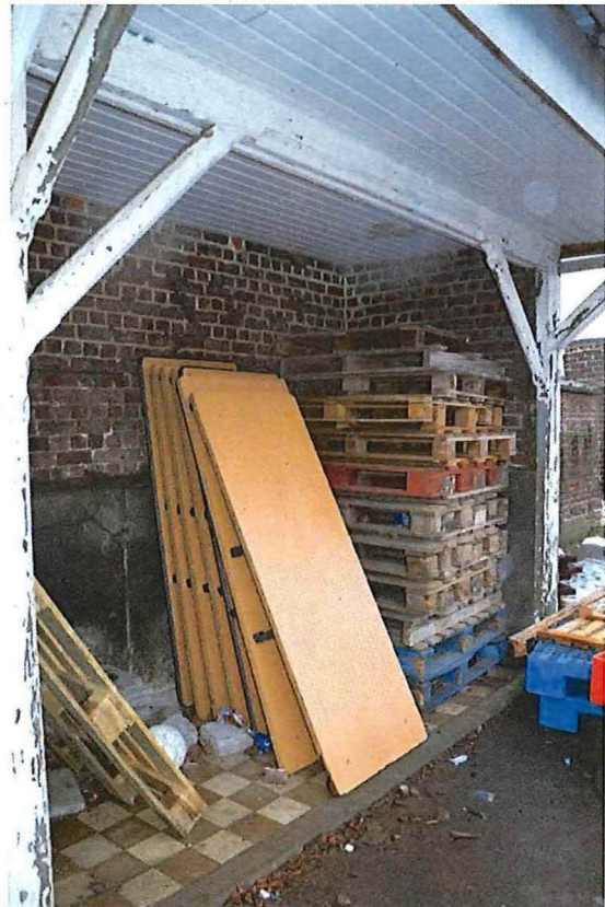
Foto 30: Sanitaire blok, volume met urinoirs waarvan de hardstenen wanden nog bewaard bleven (13/12/2017).