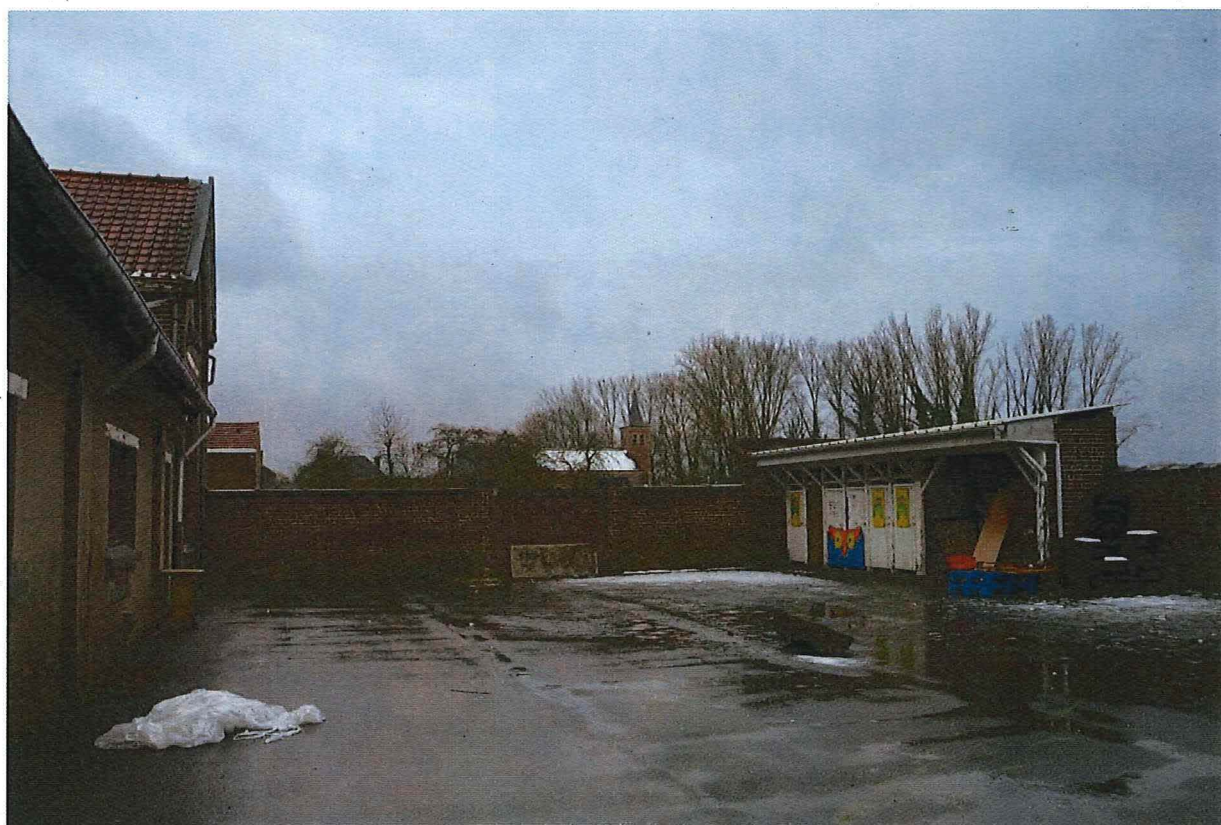
Foto 24: Zicht op de speelkoer en de zuidelijke schoolmuur met toegangspoort (13/12/2017).