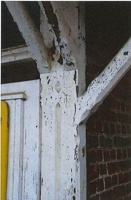
Foto 29: Sanitaire blok, detail korbelen van de dakoversteek (13/12/2017).