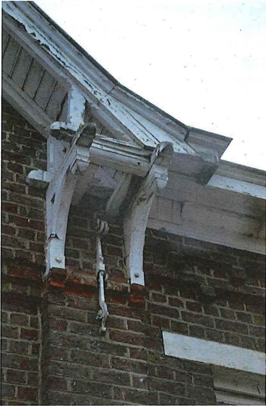
Foto 8: Detail dakoversteken en consoles ter hoogte van de puntgevel (13/12/2017).