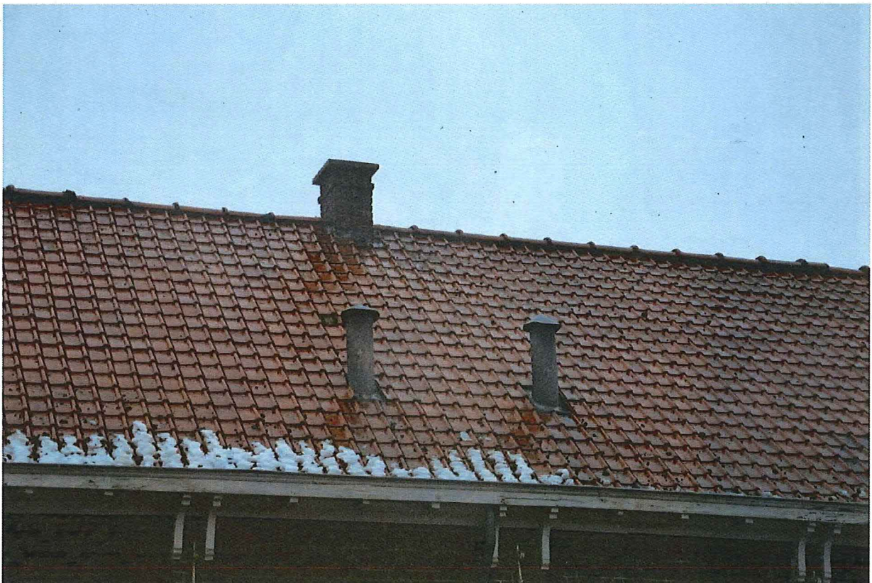
Foto 10: Verluchtingsschachten met regenhoed ter bediening van het ventilatiesysteem van de klassen (13/12/2018).