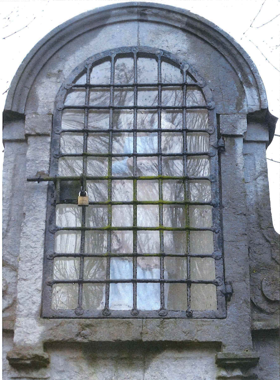
3. Sint-Annakapel 27/2/2017