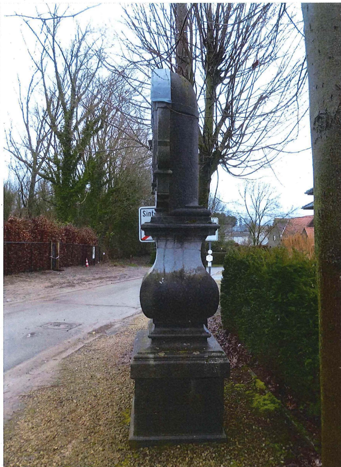
2. Sint-Annakapel, 27/02/2017