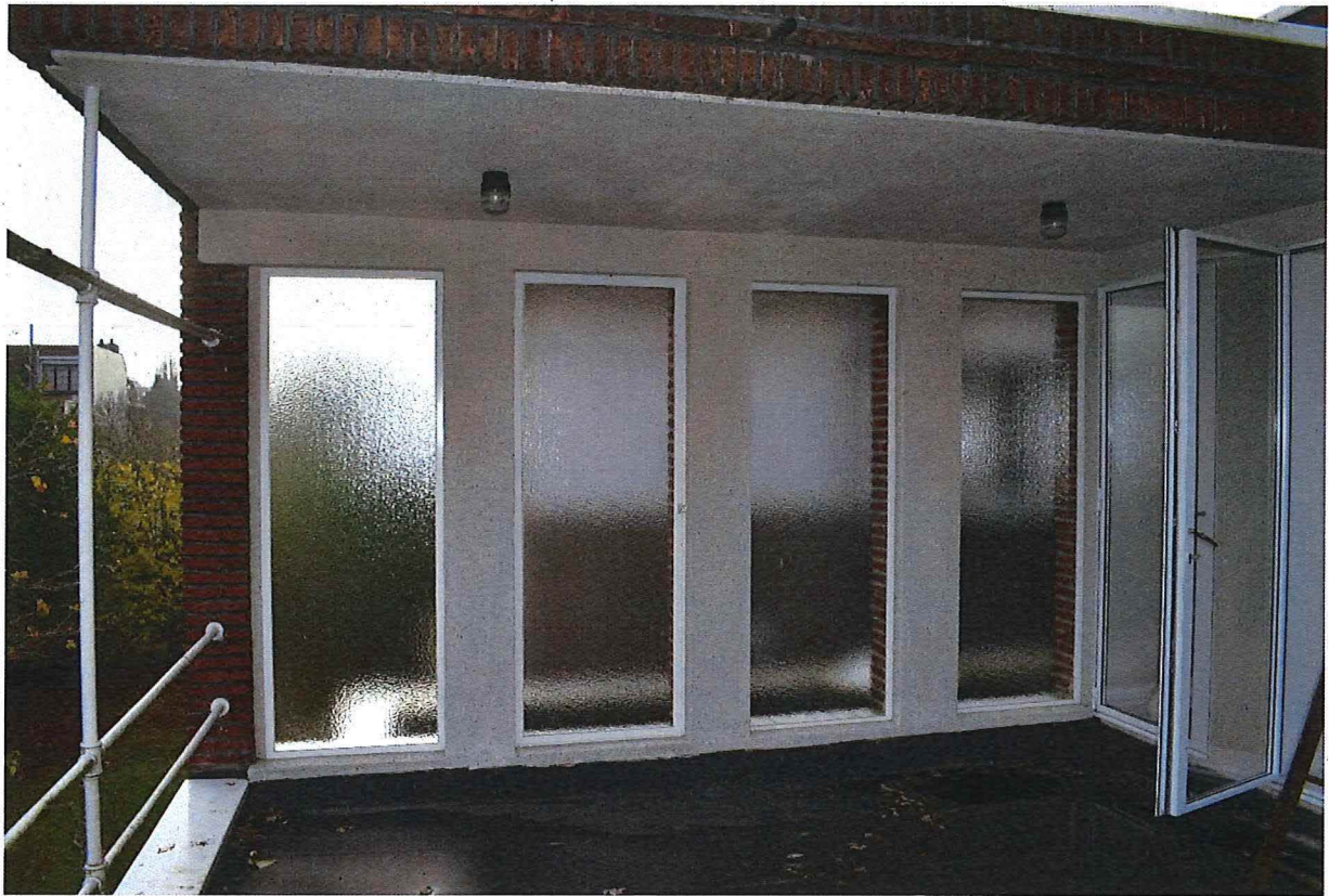
Foto 12: achtergevel: terras (solarium) op de bovenverdieping met muurafsluiting