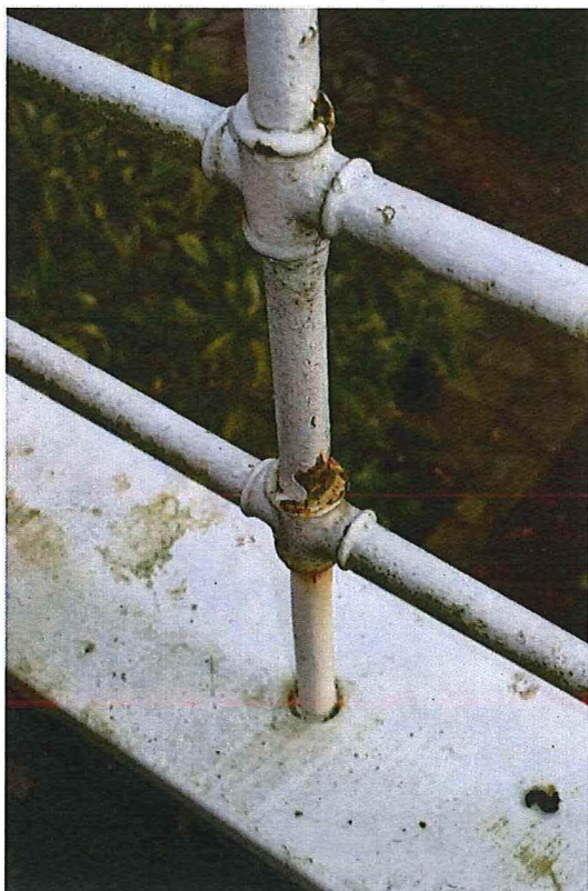
Foto 13: achtergevel: detail buisleuning terras (solarium) op de bovenverdieping