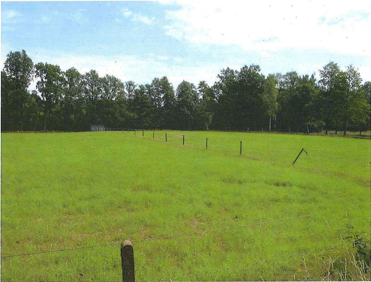
Foto 3 – De schans van Niel-bij-As (gezicht vanuit het zuidwesten)