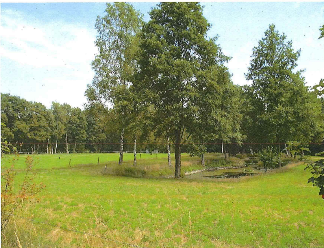
Foto 4 – De schans van Niel-bij-As. Ter hoogte van de oostelijke gracht is nog een vijver aanwezig.