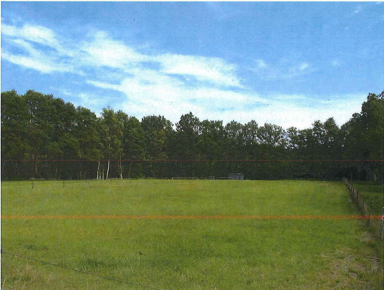
Foto 2 – De schans van Niel-bij-As (gezicht vanuit het zuidoosten) Fotoregistratie