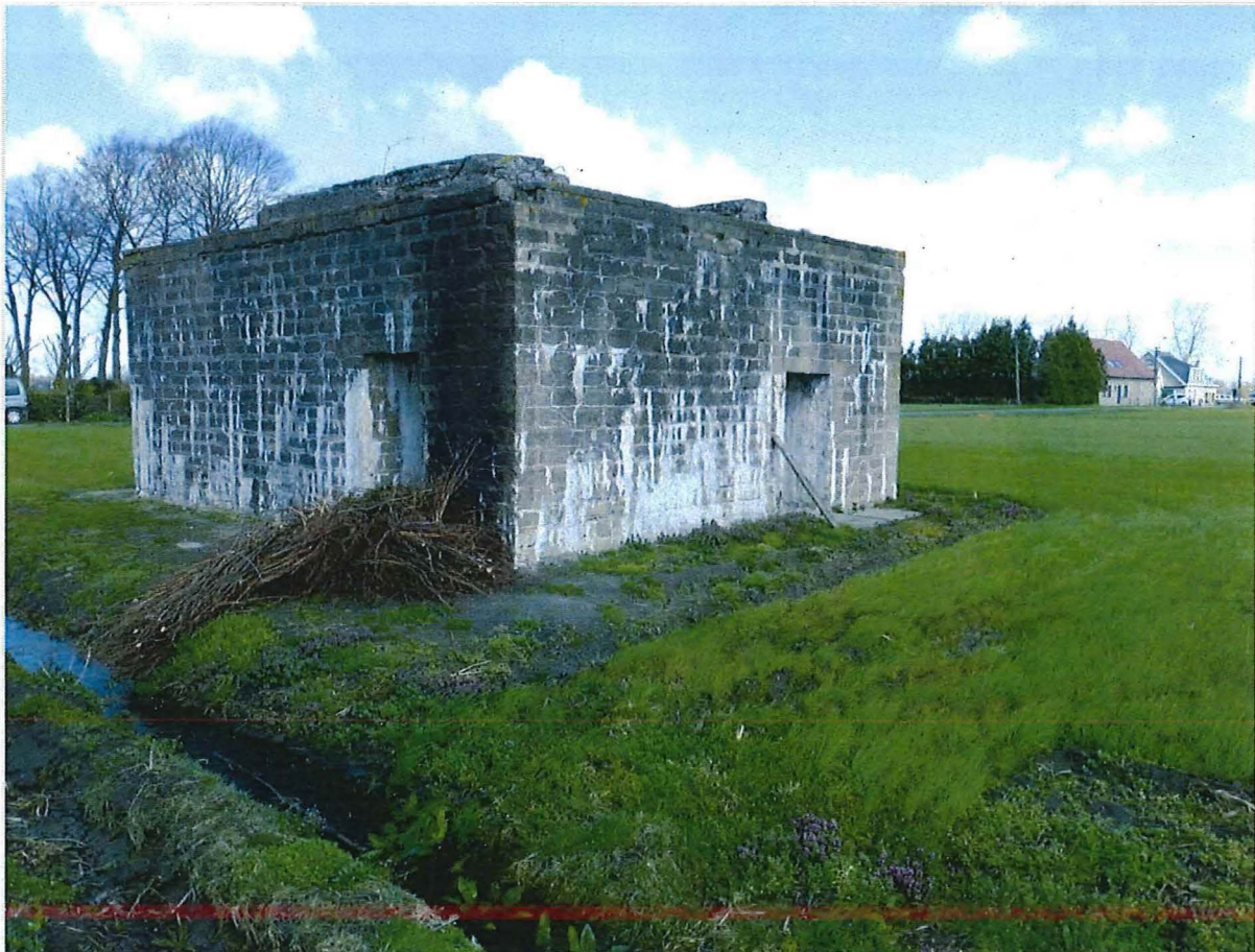
Foto 17: Bunker 5: westelijke en zuidelijke zijde. De betonnen trap is verdwenen.