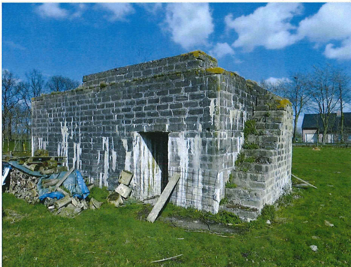
Foto 10: Bunker 3: Zicht op toegang aan westelijke zijde en trap aan zuidelijke zijde.