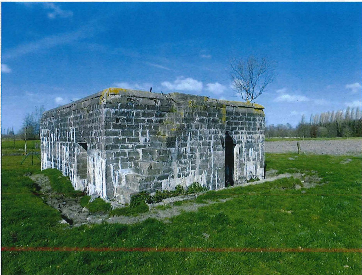
Foto 4: Bunker 2, met een afgebakend looppad ter hoogte van de toegangen. Op het dak zijn er geen sporen van een borstwering.