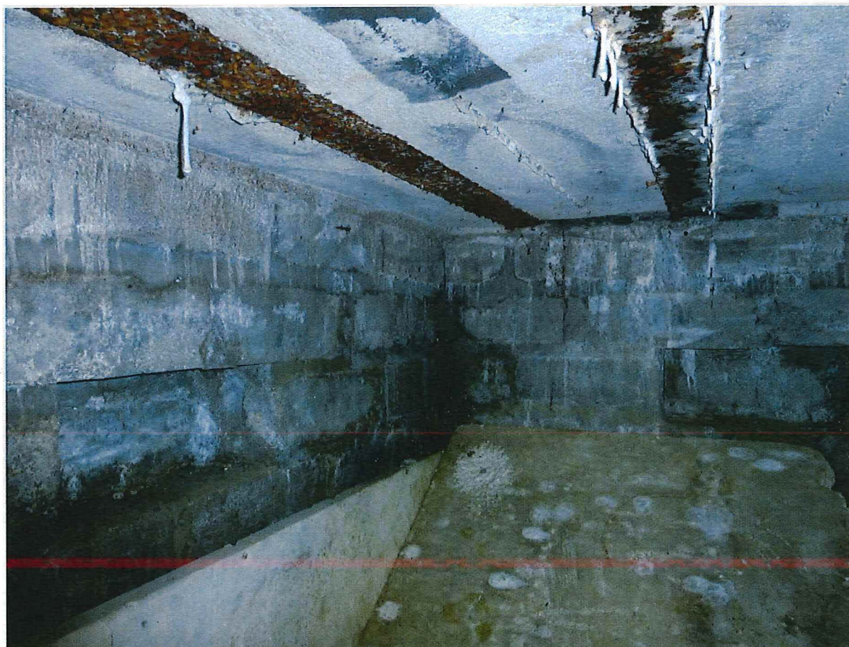
Foto 2: Bunker 1: interieur. In de binnenmuren zijn nissen gecreëerd door het weglaten van betonstenen.