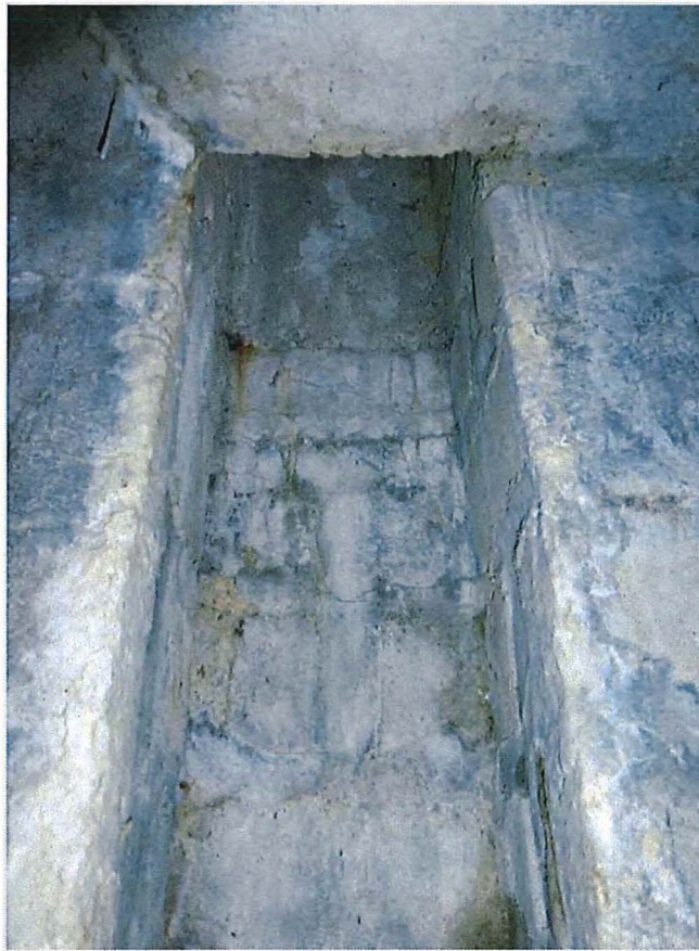
Foto 3: Bunker 1: Gleuf in zijmuur, vanaf grond tot doorheen plafond.