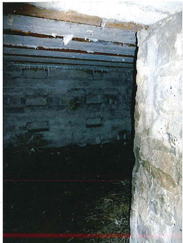
Foto 9: Bunker 2: de ruimte binnenin. In de binnenmuren zijn nissen uitgespaard.