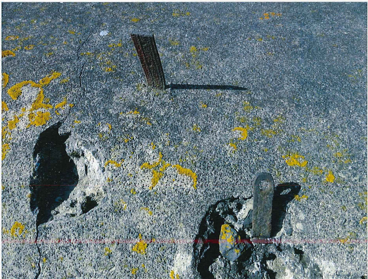
Foto 6: Bunker 2: Op het dak en tegen de dakrand zitten ijzers met ronde openingen.