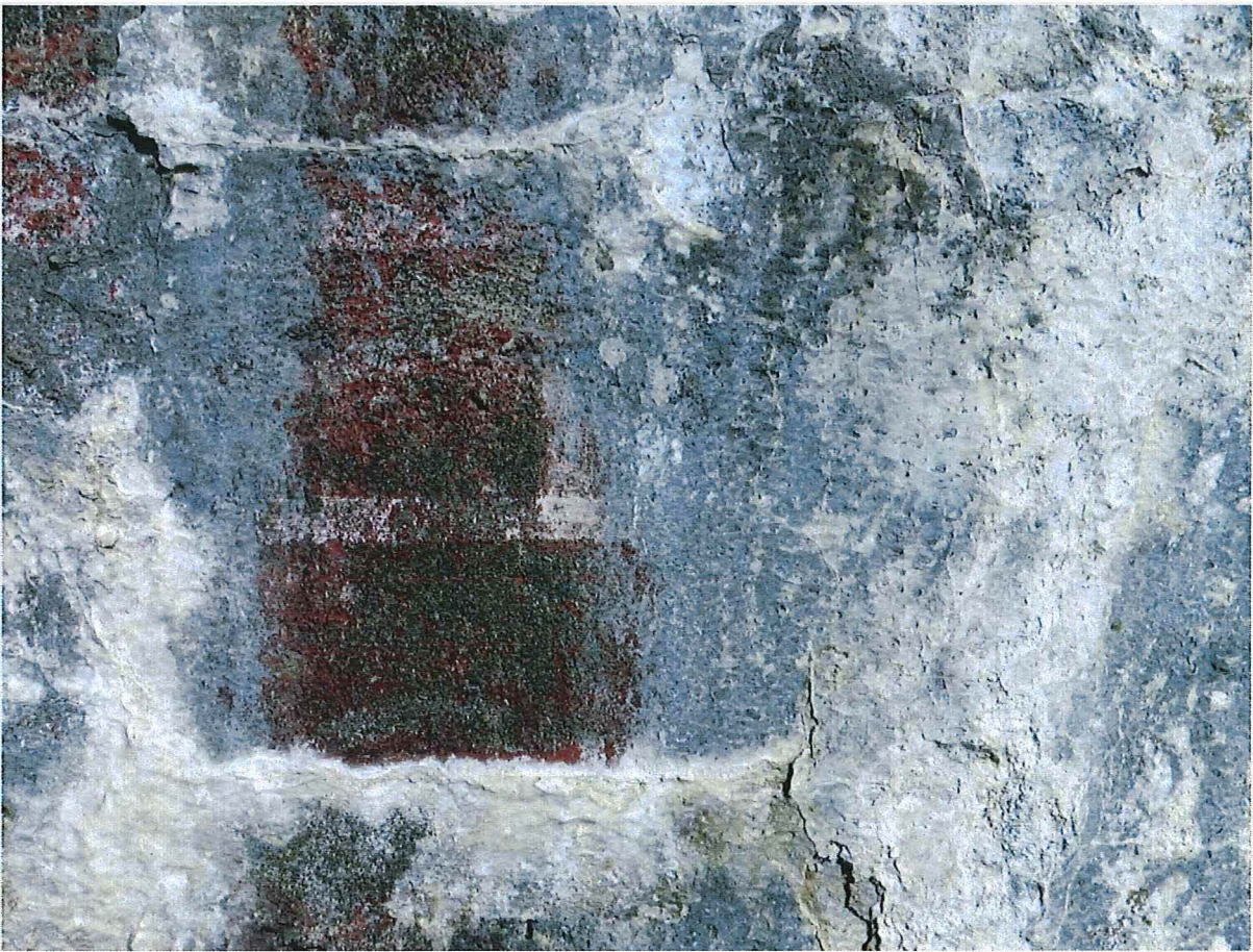
Foto 5: Bunker 2:.. Op de buitenmuren zijn verfsporen van een rood baksteenmotief terug te vinden.