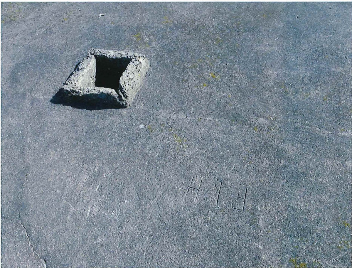
Foto 7: Bunker 2: Op het dak zijn de inscripties F.R.H. terug te vinden.