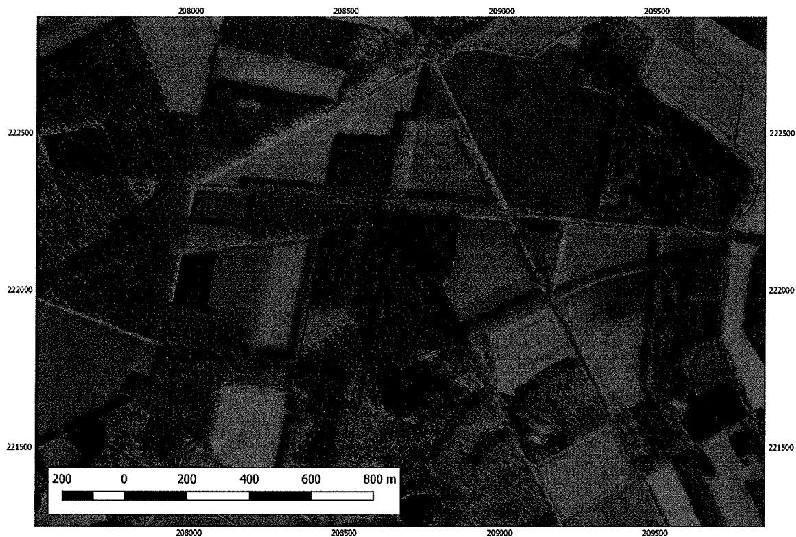
Foto 2 – Verwerking van het Digitaal Hoogtemodel Vlaanderen II van de beschermde site