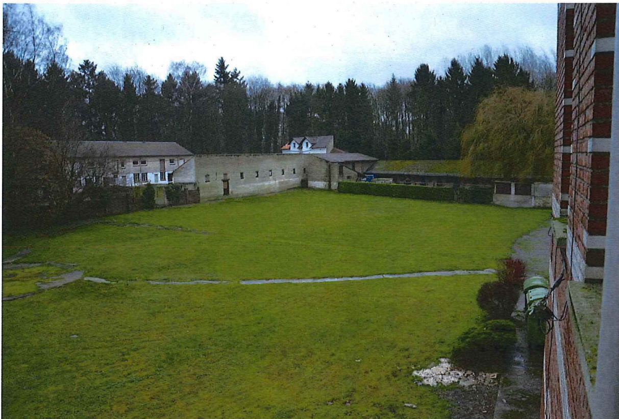
Foto 22: Zicht op de tuin vanaf de eerste verdieping van het Château, met de octagonale verharding van het tuinpaviljoen en een wandelpad naar de achtergevel (15.01.2018).