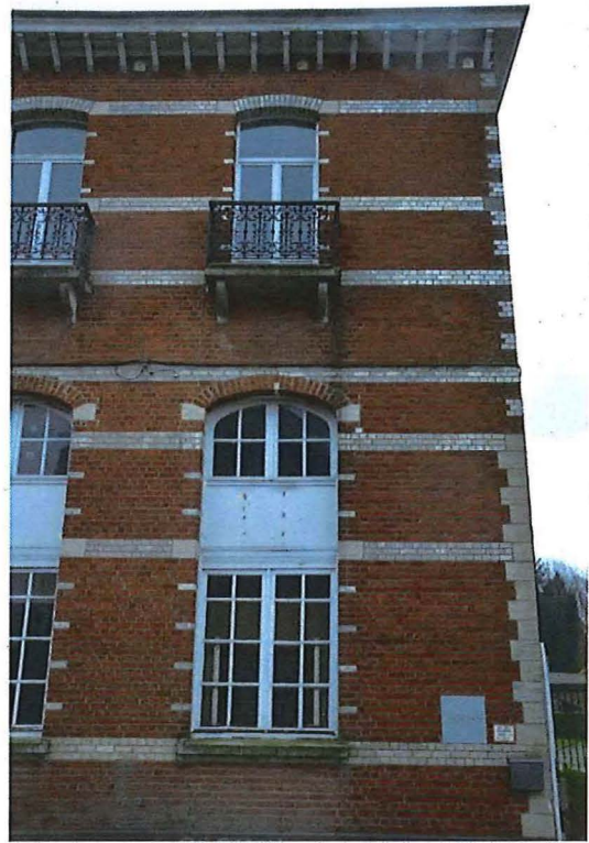
Foto 10: Volume Terblokstraat, detail gevelopeningen met deels vernieuwd schrijnwerk (15.01.2018).