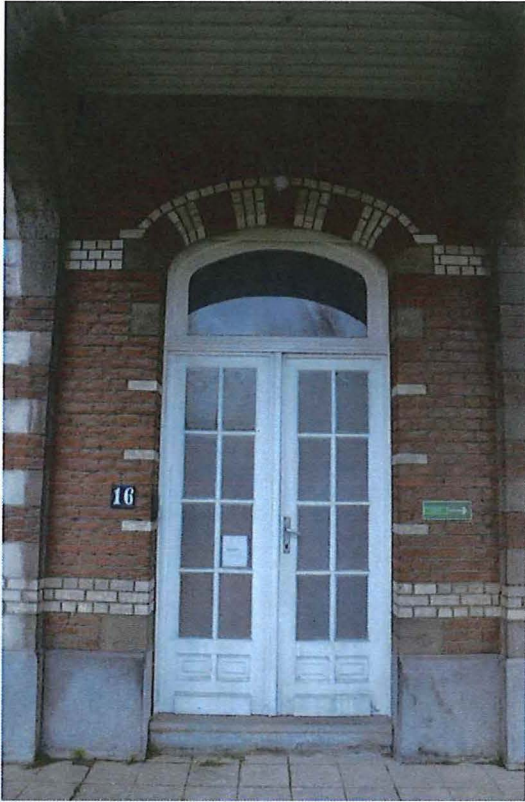
Foto 4: Hoofdgebouw Sint-Jansbergdreef, inkomportaal met hoofdingang (24.01.2018).