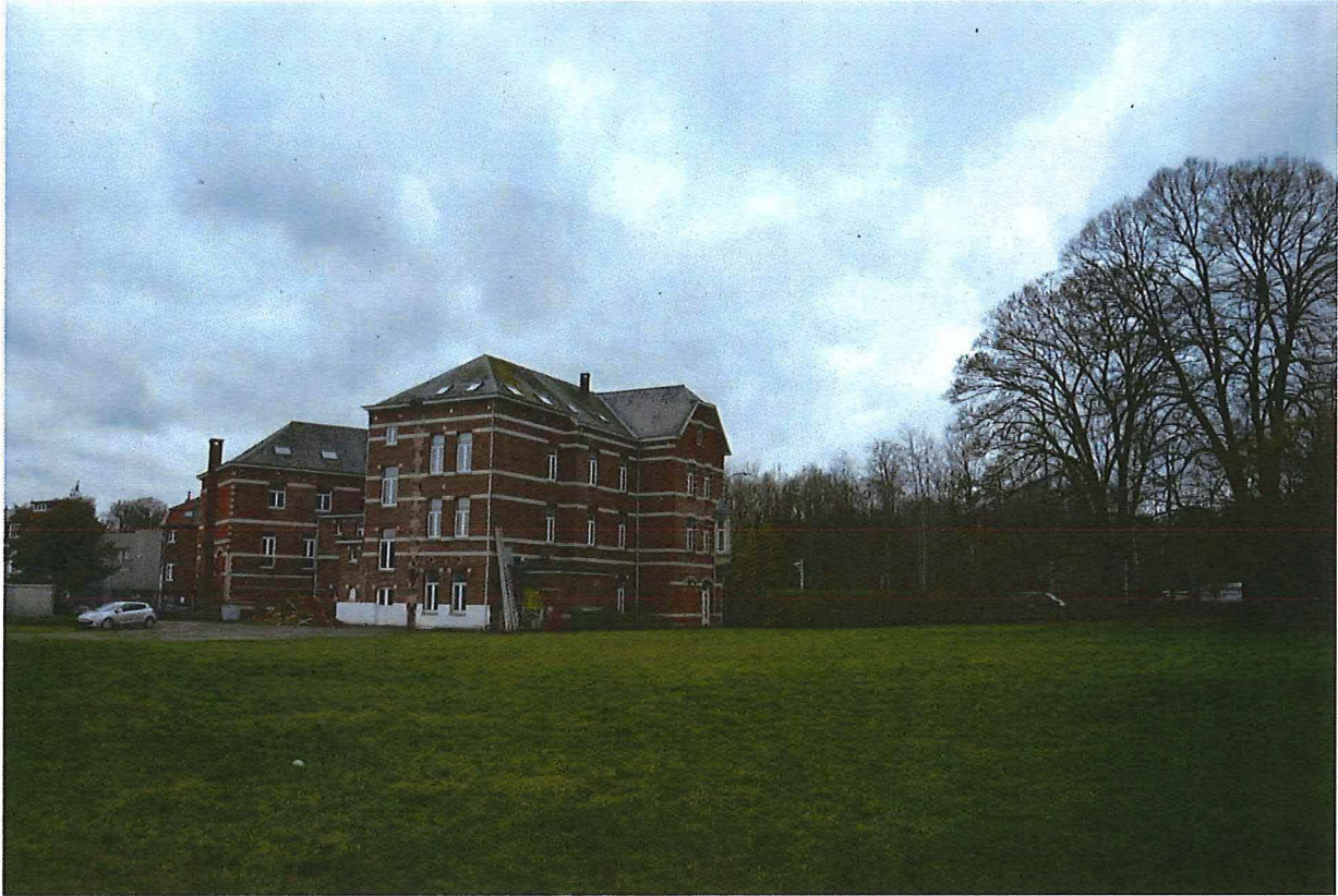
Foto 14: Het Château du Prince Léopold en de omringende tuin, gezien vanaf het noordoosten (24.01.2018).