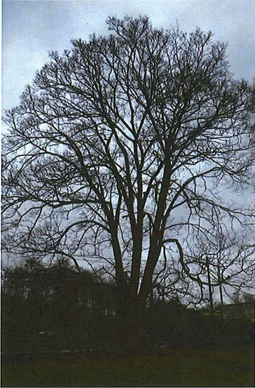
Foto 19: Monumentale es ( Fraxinus excelsior ) in de tuin van het Château (24.01.2018).