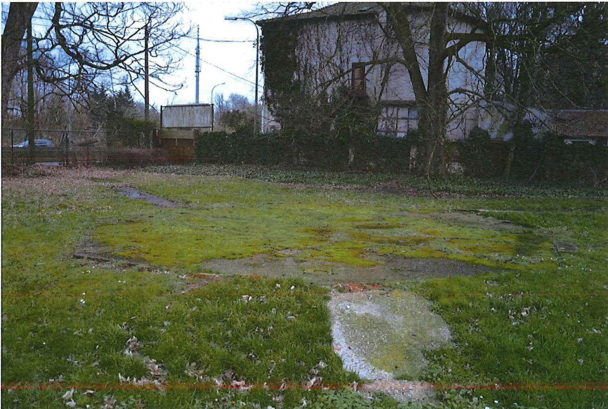
Foto 21: Octogonale verharding van het voormalige tuinpaviljoen (24.01.2018).