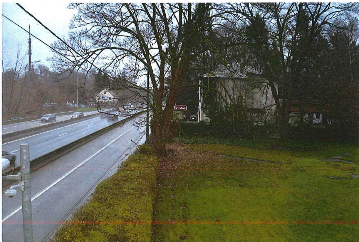
Foto 18: Zicht op de tuin aan noordzijde van het Château, met de twee monumentale bomen (es en linde), wandelpaden en de octagonale verharding van het voormalige tuinpaviljoen (15.01.2018).