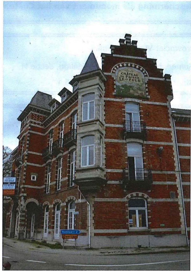
Foto 2: Hoofdvolume Sint-Jansbergdreef, zijtrapgevel met sgraffito (24.01.2018).