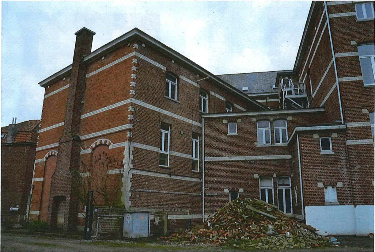
Foto 12: Zij- en achtergevels van het volume aan de Terblokstraat (links) en de aansluitende lagere bijgebouwen in de oksel van het gebouwencomplex (rechts) (24.01.2018).