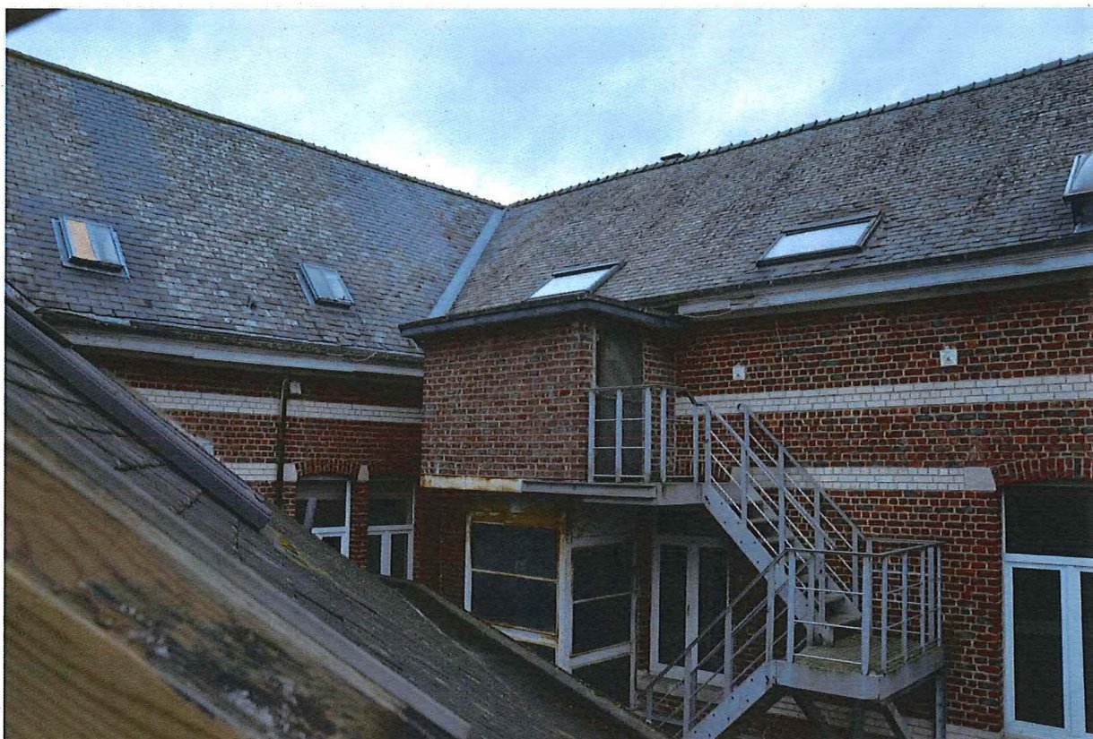
Foto 17: Zicht op de daken van het hoofdvolume en de haakse noordvleugel. Centraal de liftkoker en trap bovenop de lage bijgebouwen in de oksel van het bouwencomplex (24.01.2018).