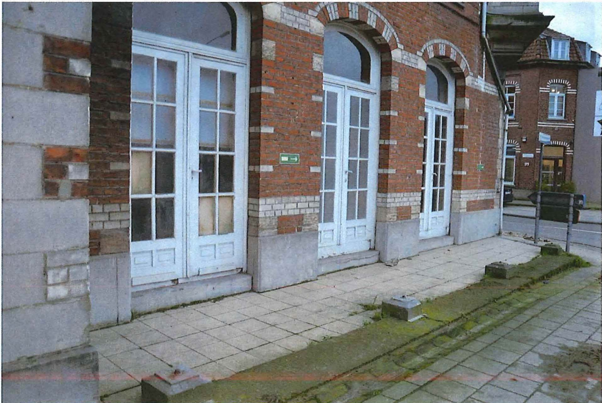
Foto 6: Hoofdvolume Sint-Jansbergdreef, vensterdeuren op de gelijkvloerse verdieping. De oorspronkelijke aflijning van de houten galerij en de natuurstenen basementen zijn nog bewaard (24.01.2018).