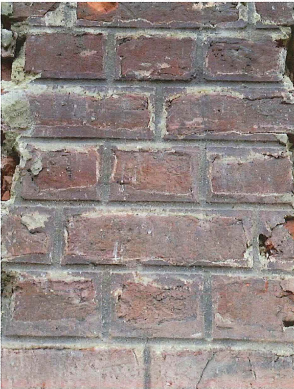
Foto 15: Haakse noordvleugel (oostelijke gevel), detail metselwerk met holle voeg. Onregelmatige bakstenen, aangestreaken met mortel en bijgekleurd. Zicht op deze oorspronkelijke afwerkingslaag die bewaard bleef achter een recent gesloopte schoorsteen (24.01.2018).