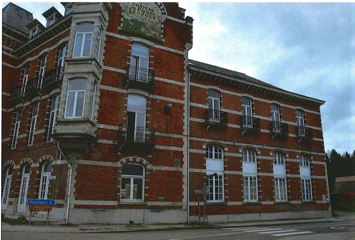
Foto 7: De hoek van de Sint-Jansbergdreef en de Terblokstraat, gezien vanaf het zuidwesten (24.01.2018).