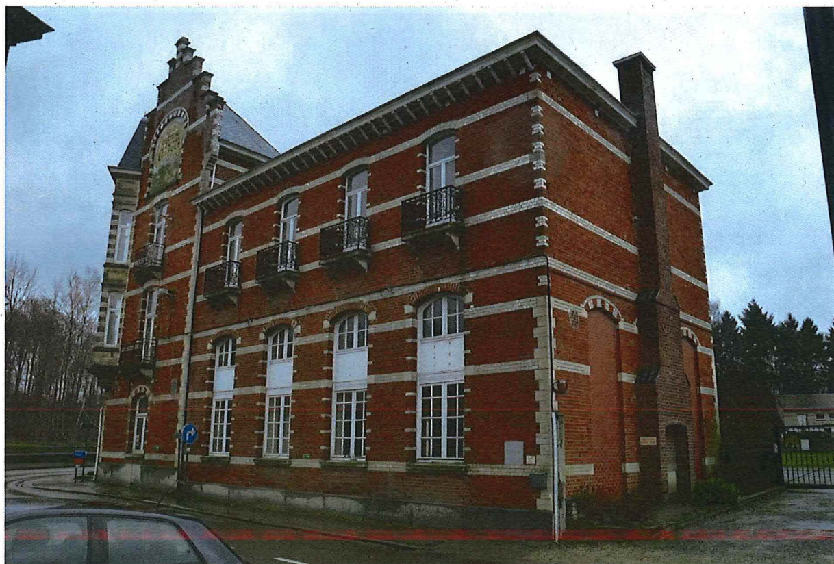
Foto 8: Het volume aan de Terblokstraat en de heden blinde zijgevel (15.01.2018).