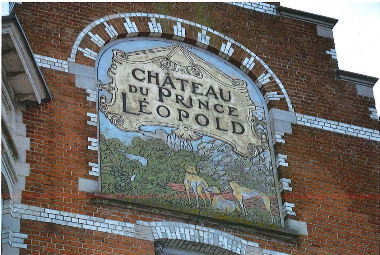
Foto 3: Detail sgraffito "Château du Prince Léopold" (24.01.2018).