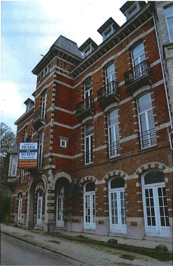
Foto 1: Hoofdvolume Sint-Jansbergdreef, voorgevel (24.01.2018).