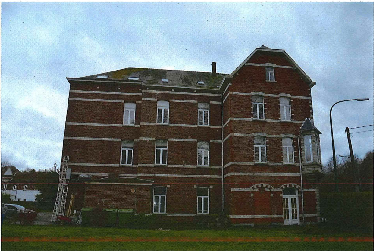
Foto 13: De noordelijke zijgevel van het hoofdvolume aan de Sint-Jansbergdreef (rechts) en de aansluitende haakse noordvleugel (links). Zicht vanaf het noorden (24.01.2018).