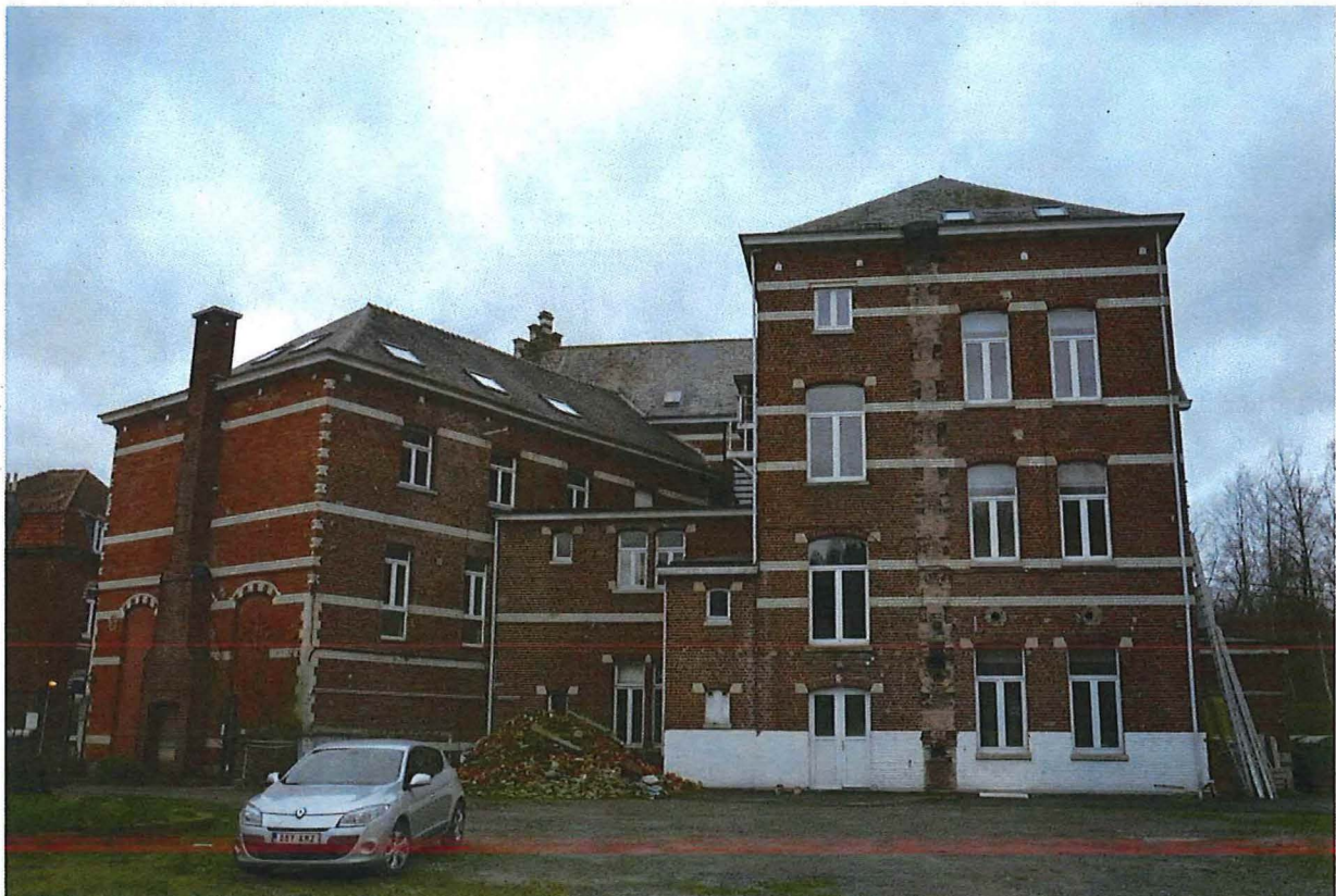
Foto 11: Achtergevels, gezien vanaf het oosten (24.01.2018).