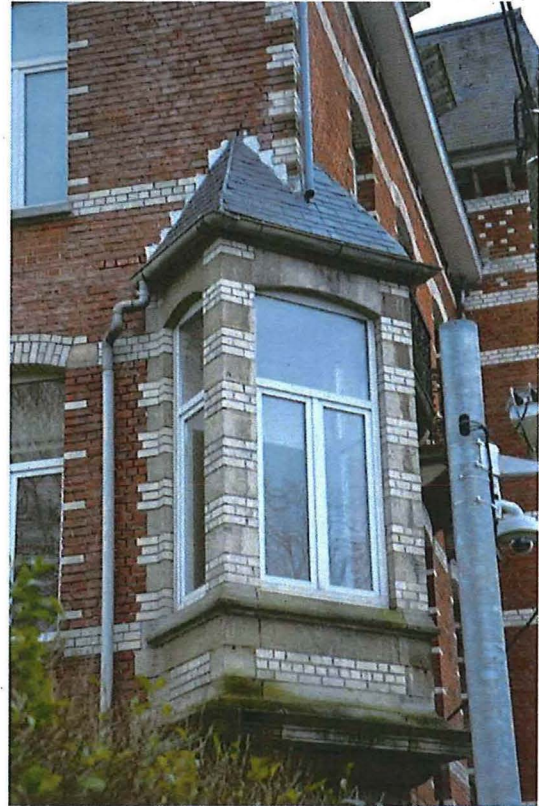
Foto 5: Hoofdgebouw Sint-Jansbergdreef, erker op de noordwestelijke hoek (24.01.2018).