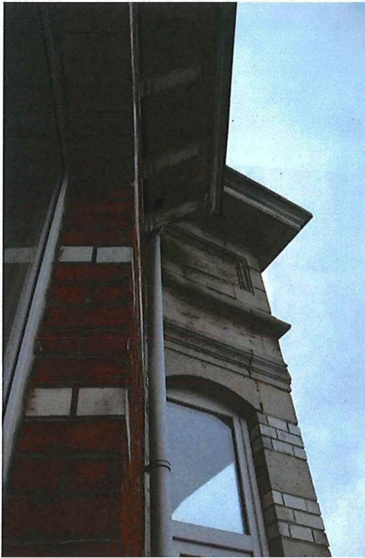
Foto 9: Hoofdvolume Sint-Jansbergdreef, detail erker in de zuidwestelijke hoek en kroonlijsten (15.01.2018).