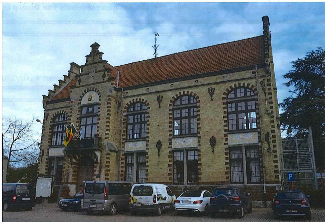
1. voorgevel, 14/11/2017