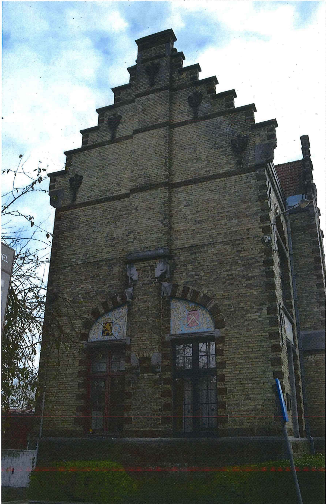
3. Linker zijgevel, 14/11/2017