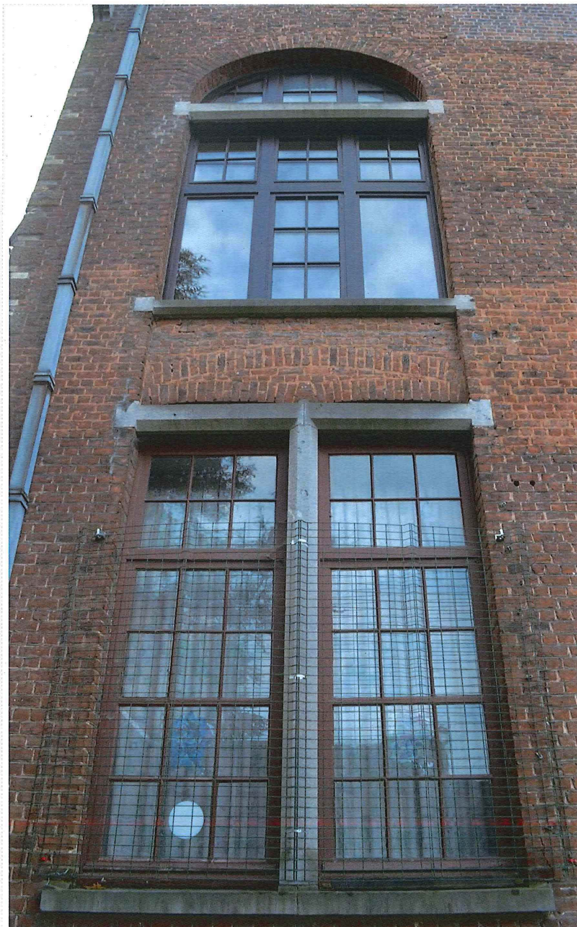
19. historisch schrijnwerk in de achtergevel, 14/11/2017