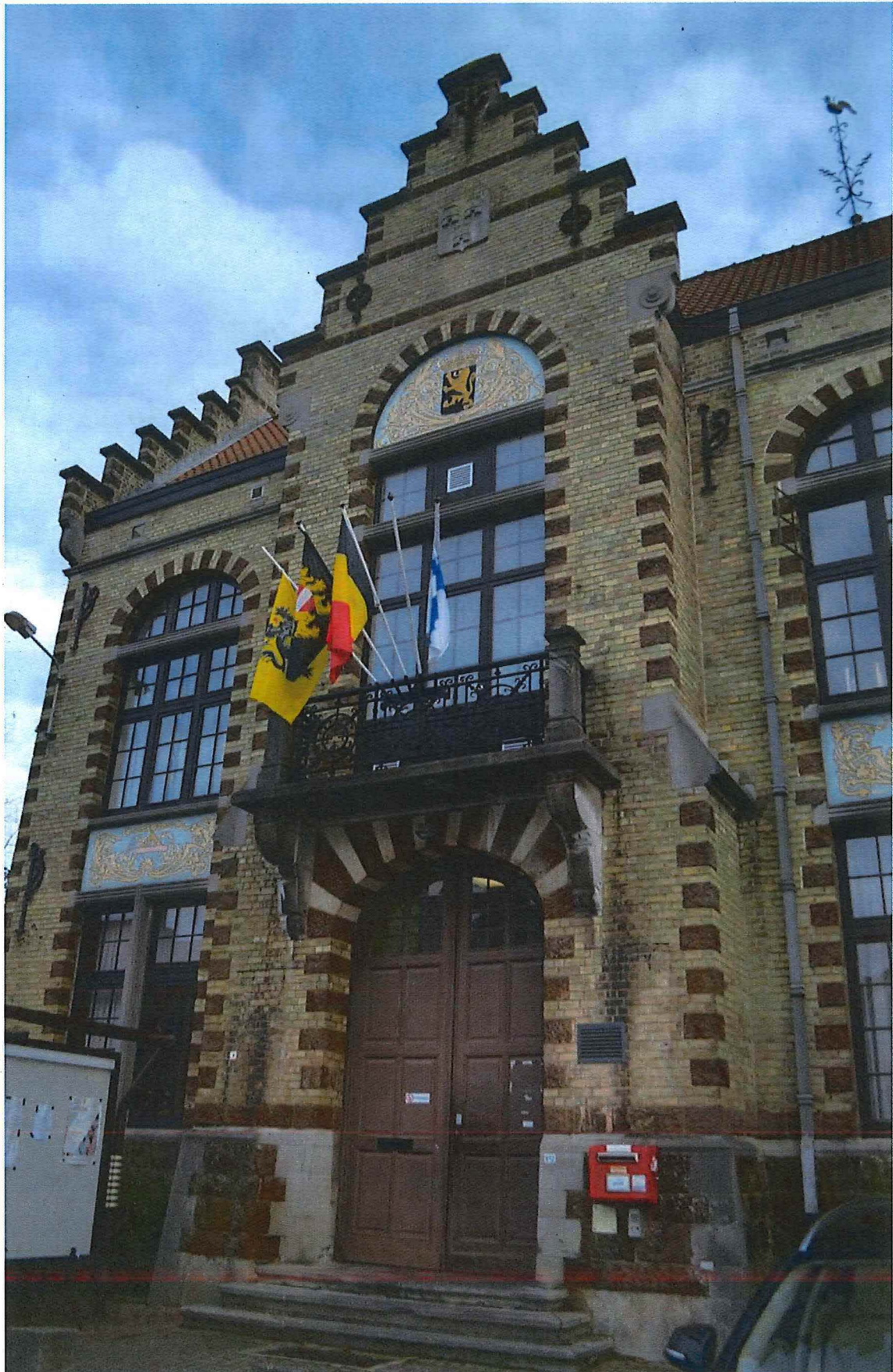
6. voorgevel, 14/11/2017