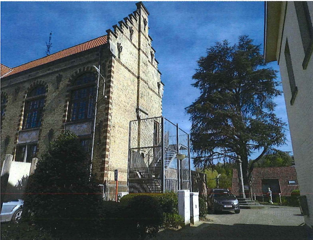
21. overgangszone rechts van het gemeentehuis met schandpaal en de bijgebouwen, 19/04/2018