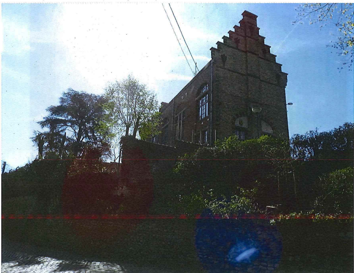
23. overgangszone achter het gemeentehuis, 19/04/2018