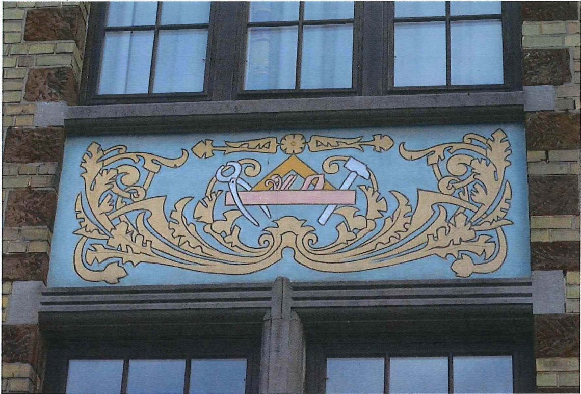
9. sgraffito op de voorgevel, 14/11/2017