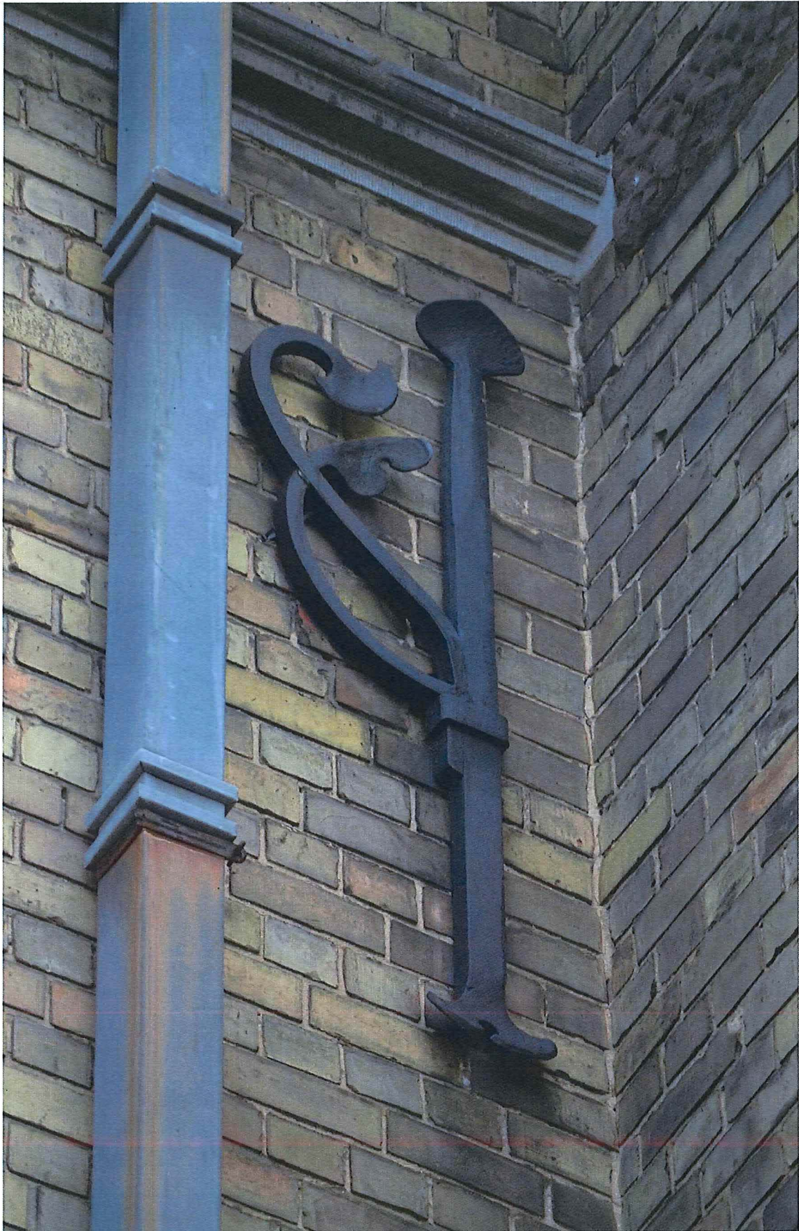
18. muuranker aan de voorgevel, 14/11/2017