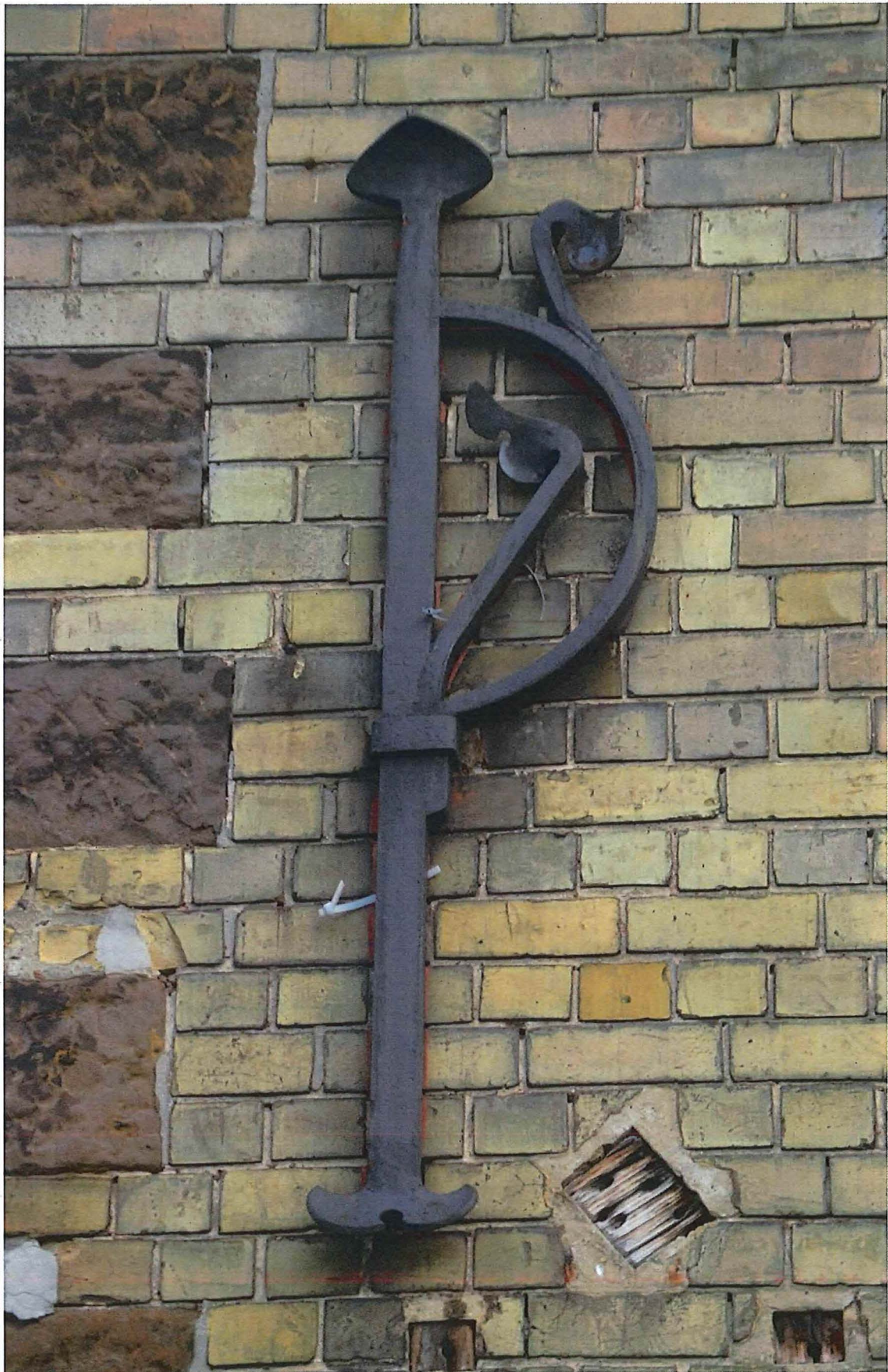
17. muuranker aan de voorgevel, 14/11/2017