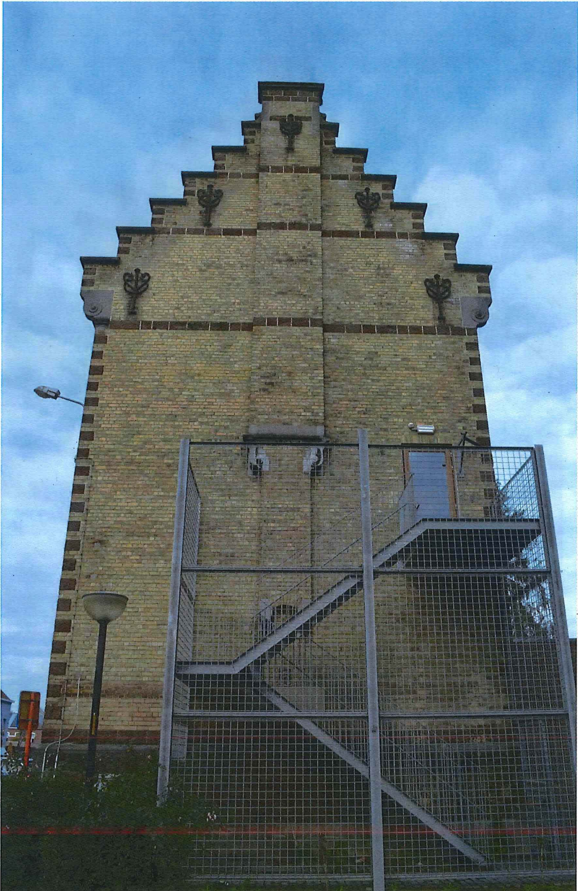
2. rechter zijgevel, 14/11/2017