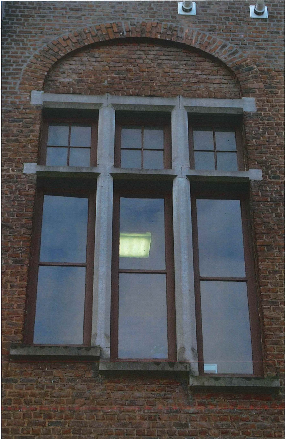
5. achtergevel met historisch schrijnwerk, 14/11/2017