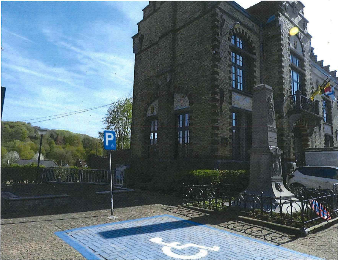
24. overgangszone links van het gemeentehuis met het oorlogsgedenkteken, 19/04/2018