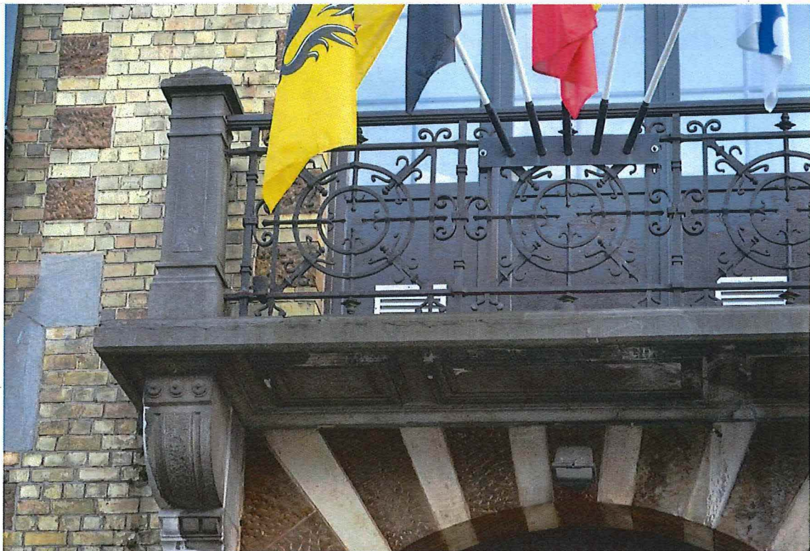
7. balkon detail, 14/11/2017