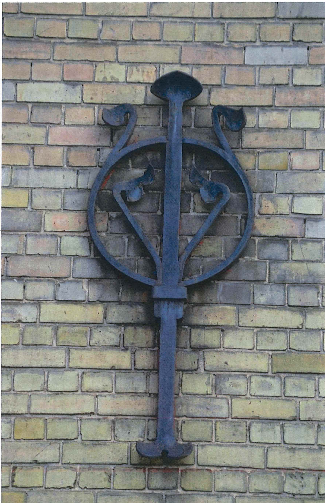
16. muuranker aan de voorgevel, 14/11/2017