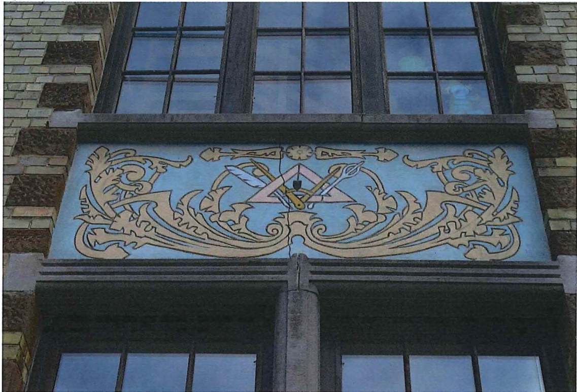
11. sgraffito op de voorgevel, 14/11/2017