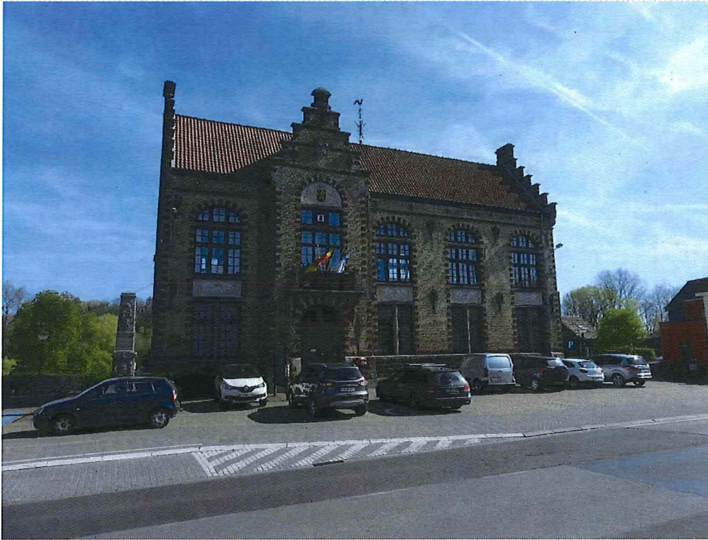
20. overgangszone straatzijde, 19/04/2018