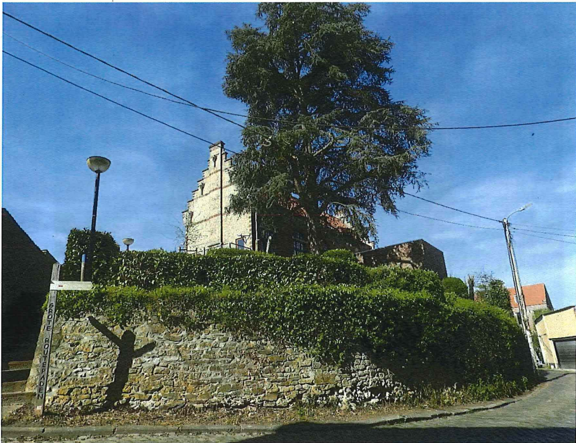
22. overgangszone achter het gemeentehuis, 19/04/2018