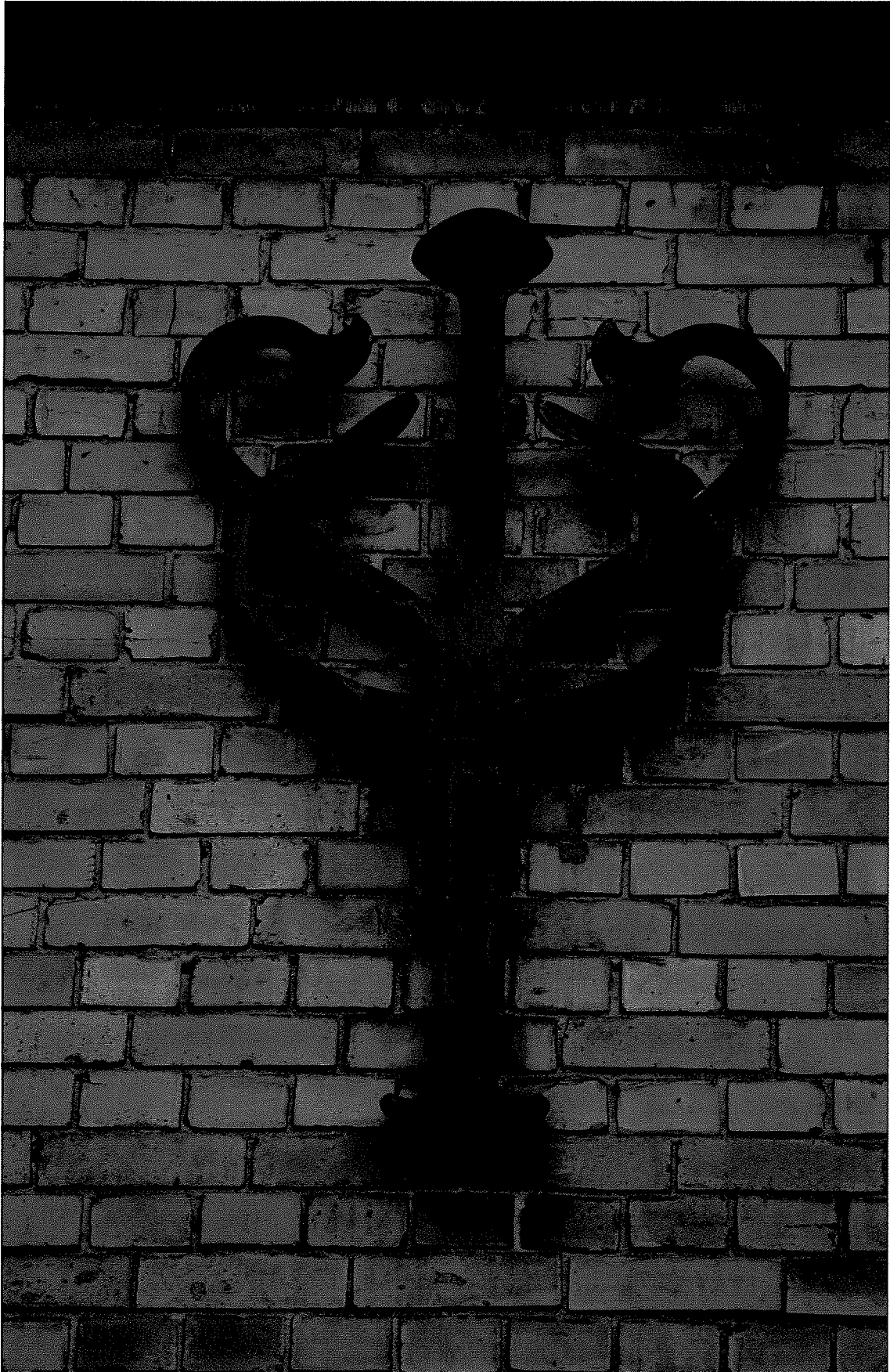
15 muuranker aan de voorgevel , 14/11/2017