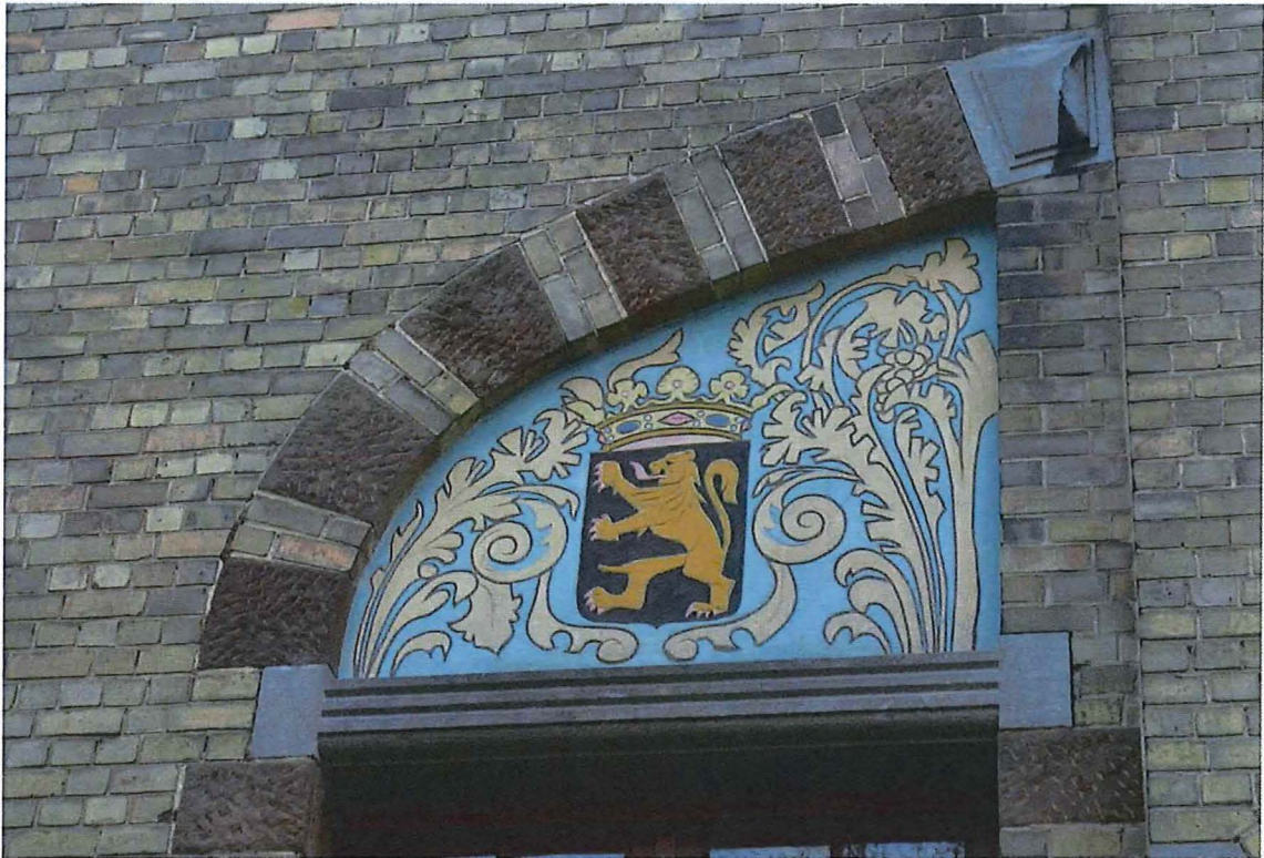
13. sgraffito op de linker zijgevel, 14/11/2017