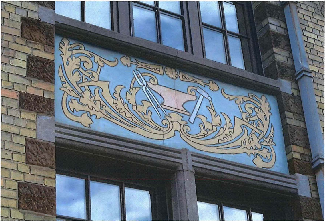
12. sgraffito op de voorgevel , 14/11/2017