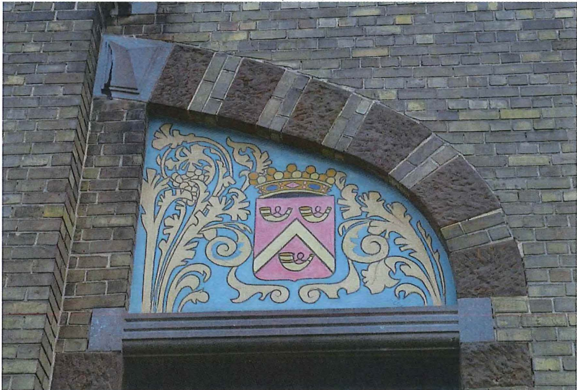
14. sgraffito op de linker zijgevel , 14/11/2017