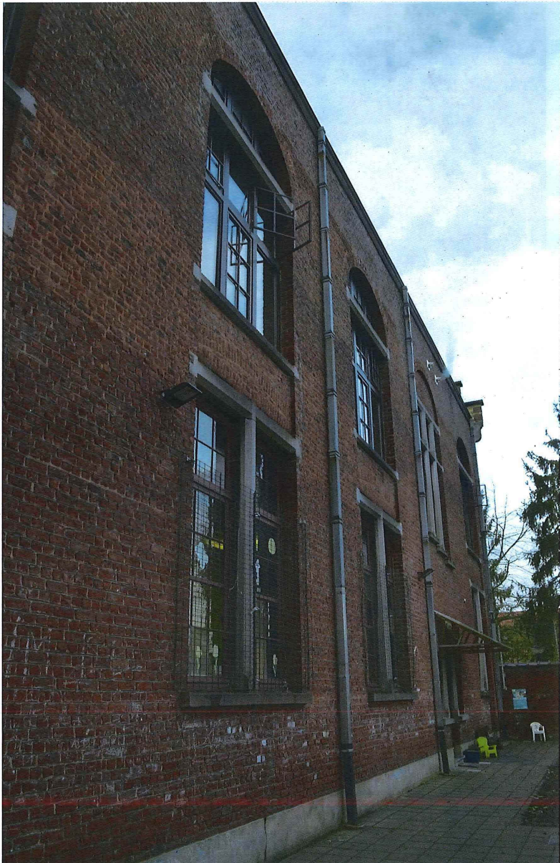
4. achtergevel, 14/11/2017