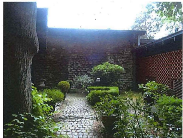
Foto 9: Voortuinaanleg en toegangspad tot de voordeur, zicht naar de noordgevel van de living.