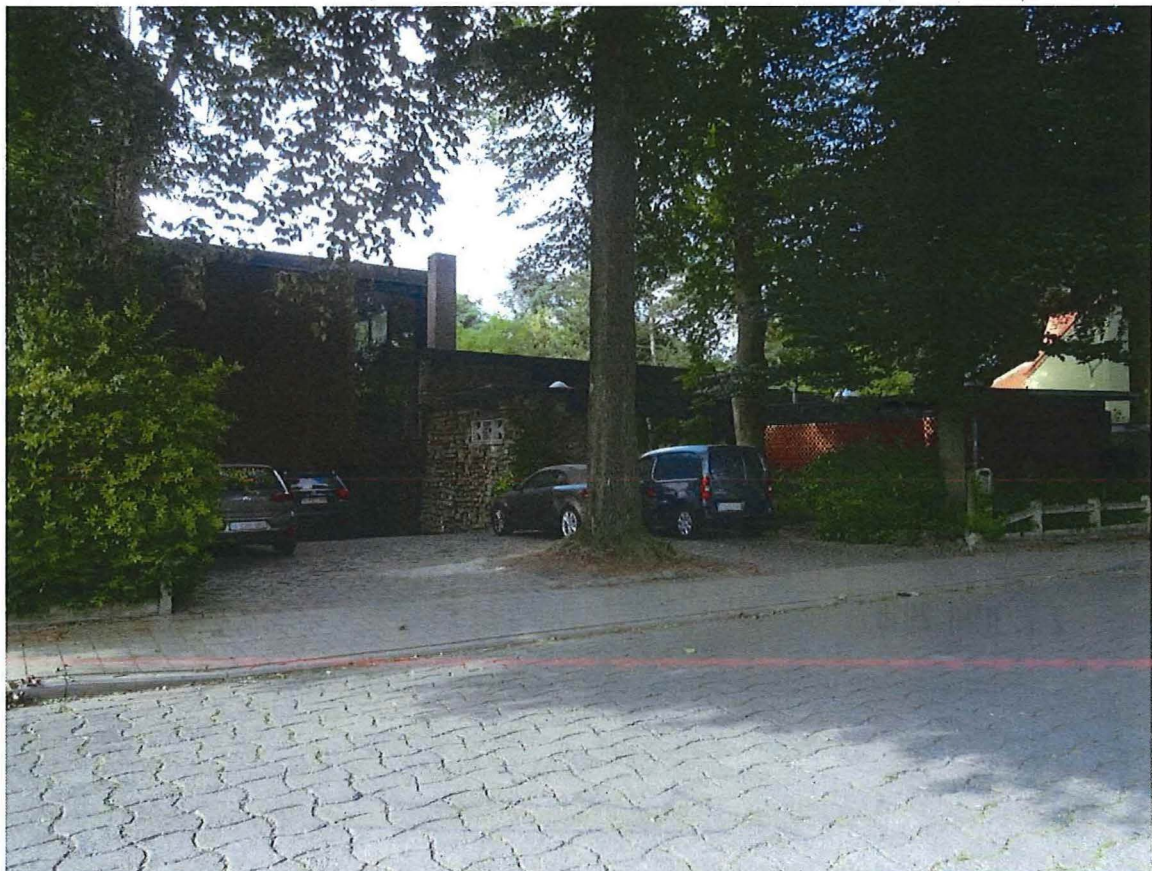
Foto 2: Voorgevel (noorden) en oprit aan de Oudeheerweg, zicht vanuit het noordoosten.