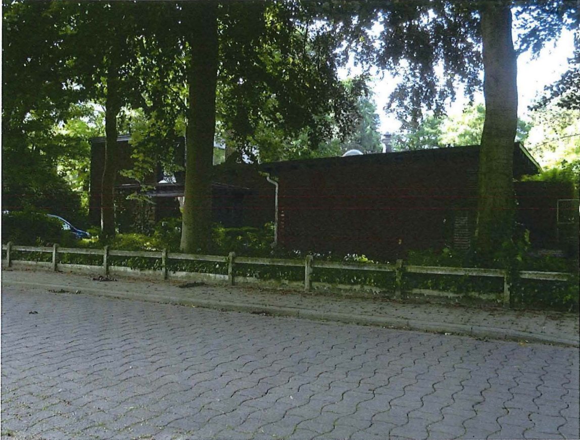
Foto 1: Voorgevel (noorden) van Woning De Somviele met voortuin en beuken langs de Oudeheerweg, zicht vanuit het noordwesten.