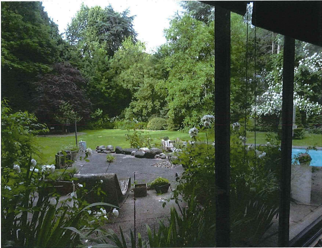
Foto 33: Terras boven het souterrain van de oostvleugel (zicht vanuit interieur).