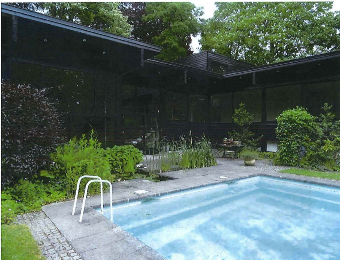
Foto 22: Tuingevel (zuiden) en terras met waterpartij en zwembad.