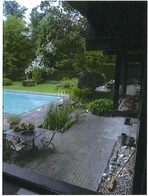
Foto 36: Zwembad en terras met waterpartij (zicht vanuit interieur).