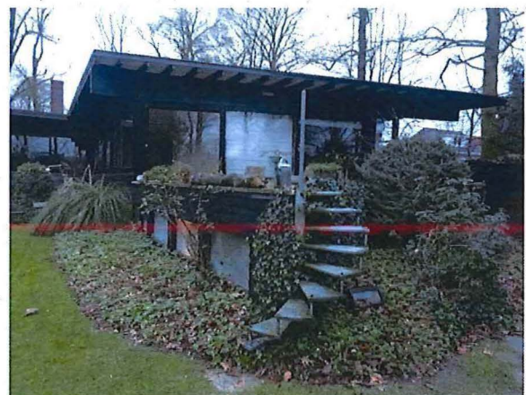
Foto 21: Terras boven het souterrain van de oostelijke vleugel, toegankelijk met draaitrap.