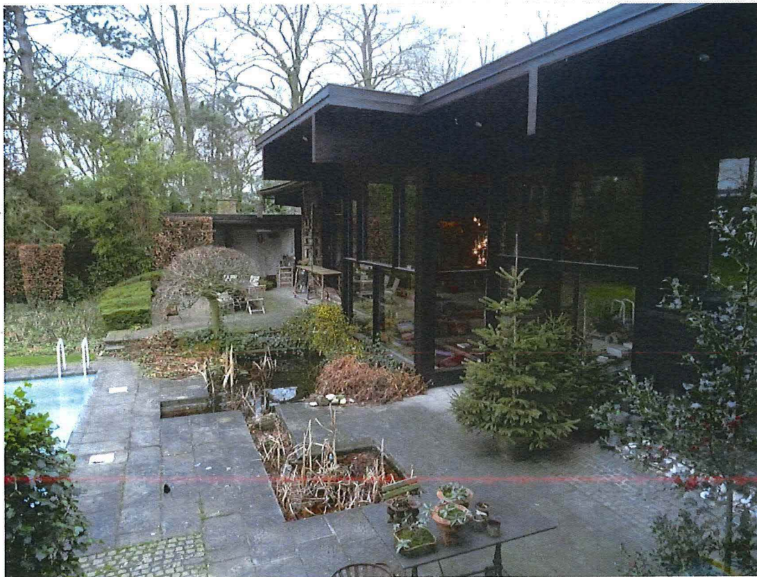
Foto 34: Terrassen aansluitend bij de zuidgevel (zicht vanuit interieur).