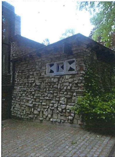
Foto 6: Noordelijke uitbouw met de inkom, claustra in de oostzijde.