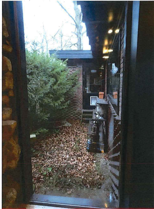
Foto 37: Westzijde van de noordwestelijke vleugel met keuken en diensttoegang (zicht vanuit interieur).