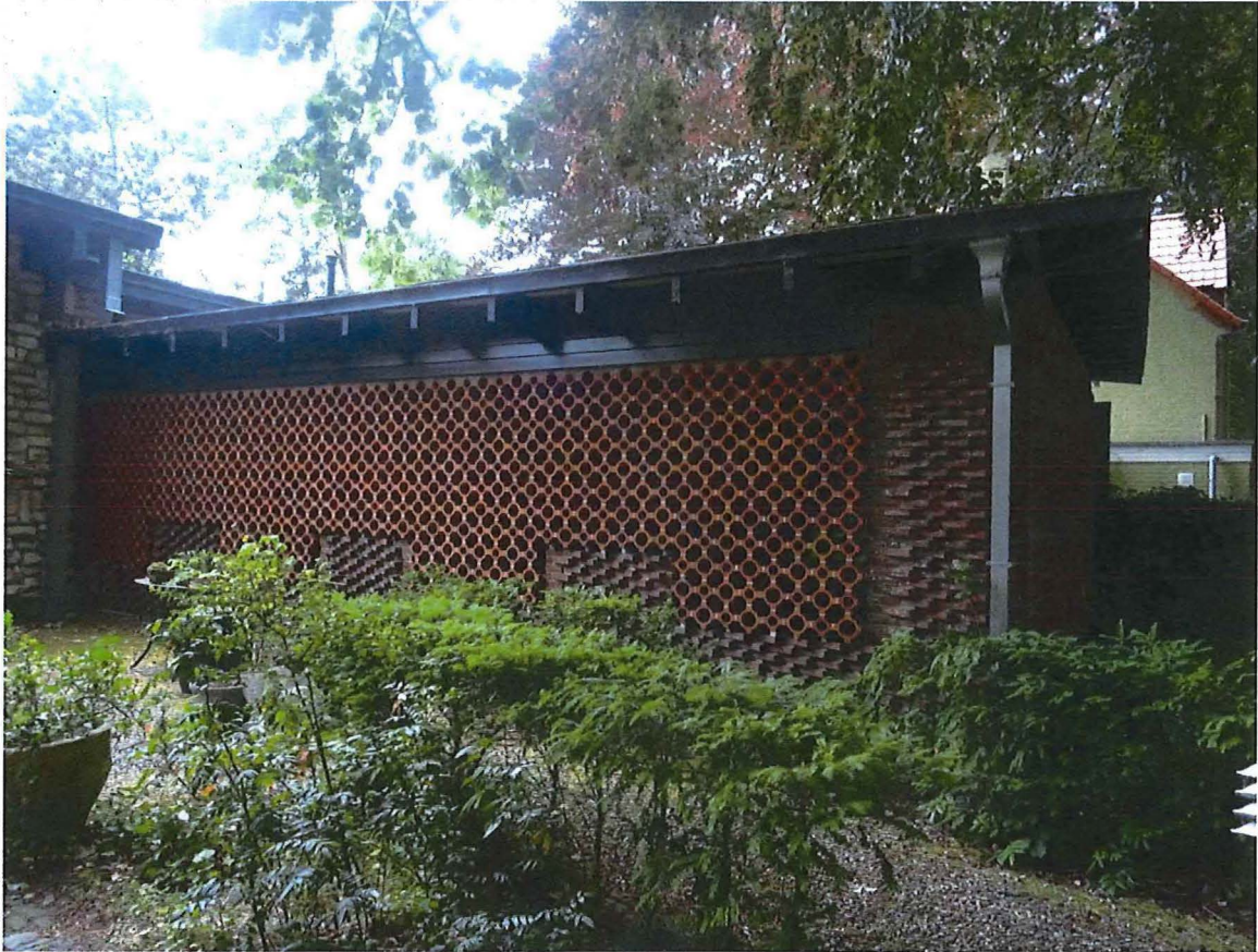
Foto 12: Volume ten noordwesten (keuken en diensttoegang), met oostzijde afgeschermd door claustra.