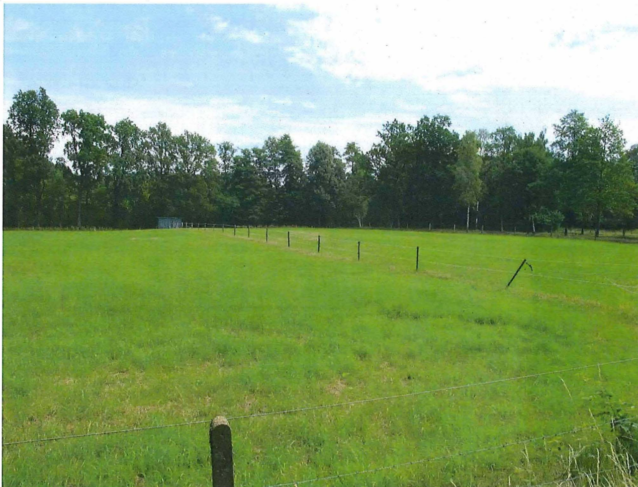
Foto 3 – De schans van Niel-bij-As (gezicht vanuit het zuidwesten)