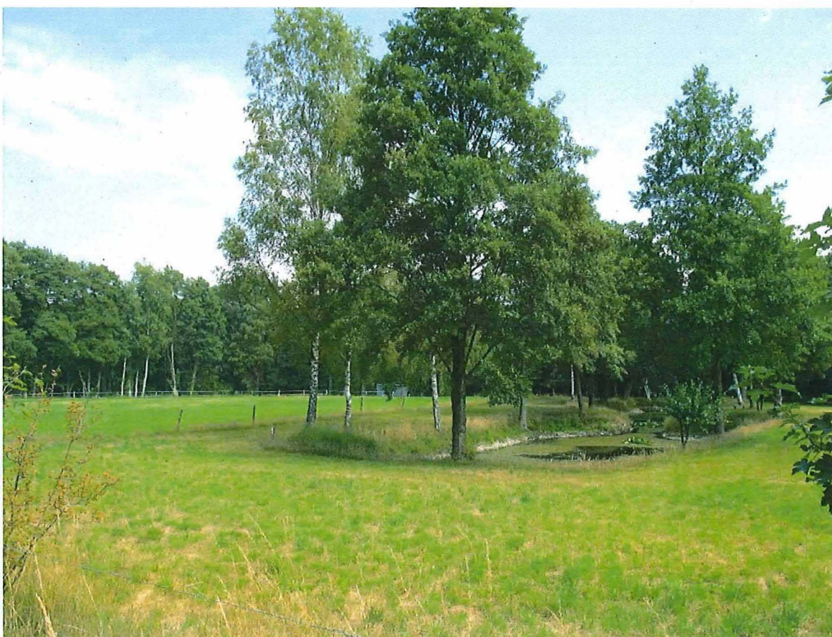
Foto 4 – De schans van Niel-bij-As. Ter hoogte van de oostelijke gracht is nog een vijver aanwezig.