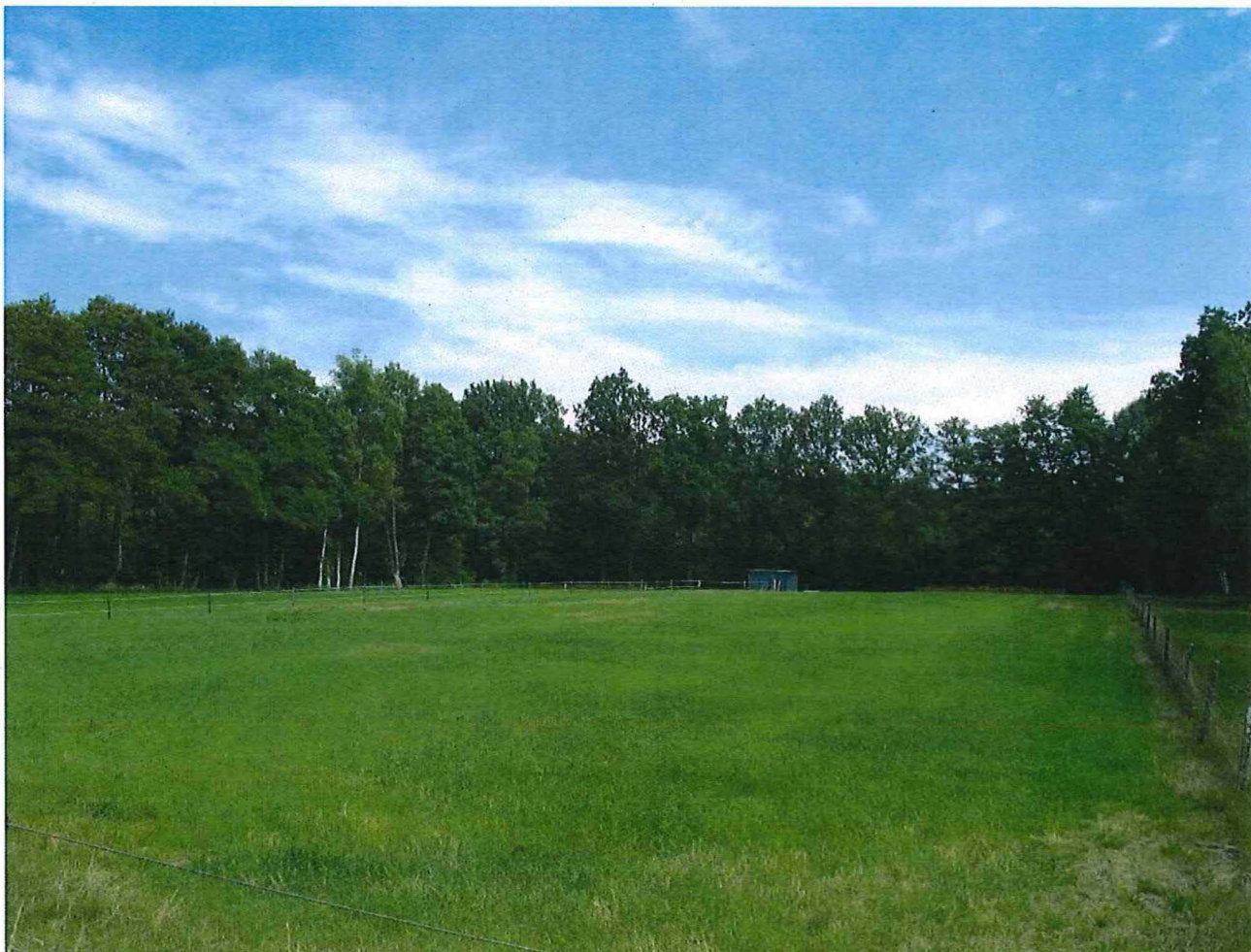
Foto 2 – De schans van Niel-bij-As (gezicht vanuit het zuidoosten) Fotoregistratie