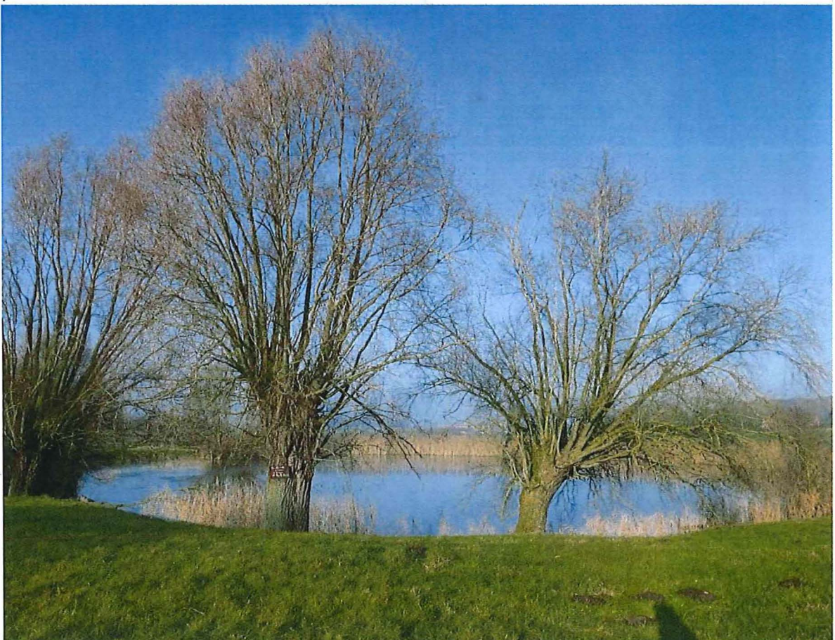
6. Krater 2 met rietkraag en bomenrij van knotwilg, 17 januari 2017.