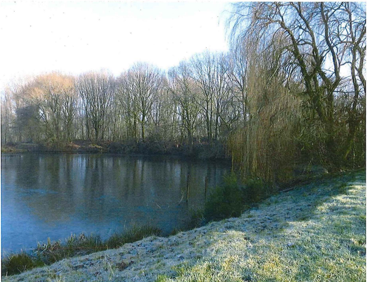
2. Bosrand van krater 1 bij Petit Bois , 17 januari 2017. Treurwilg rechts op de foto. Spontaan opgeschoten brem langs de waterrand.