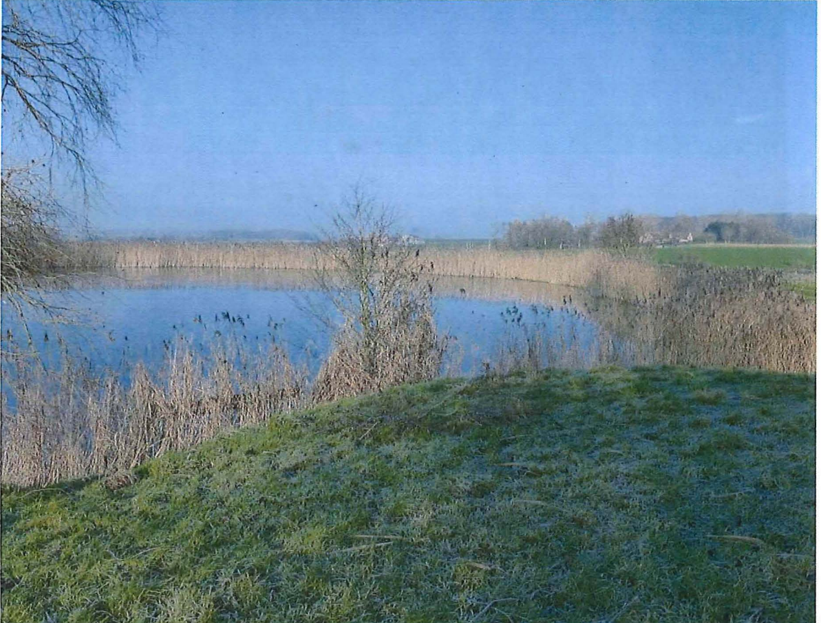
4. Krater 2 met rietkraag en sleedoorn, 17 januari 2017.