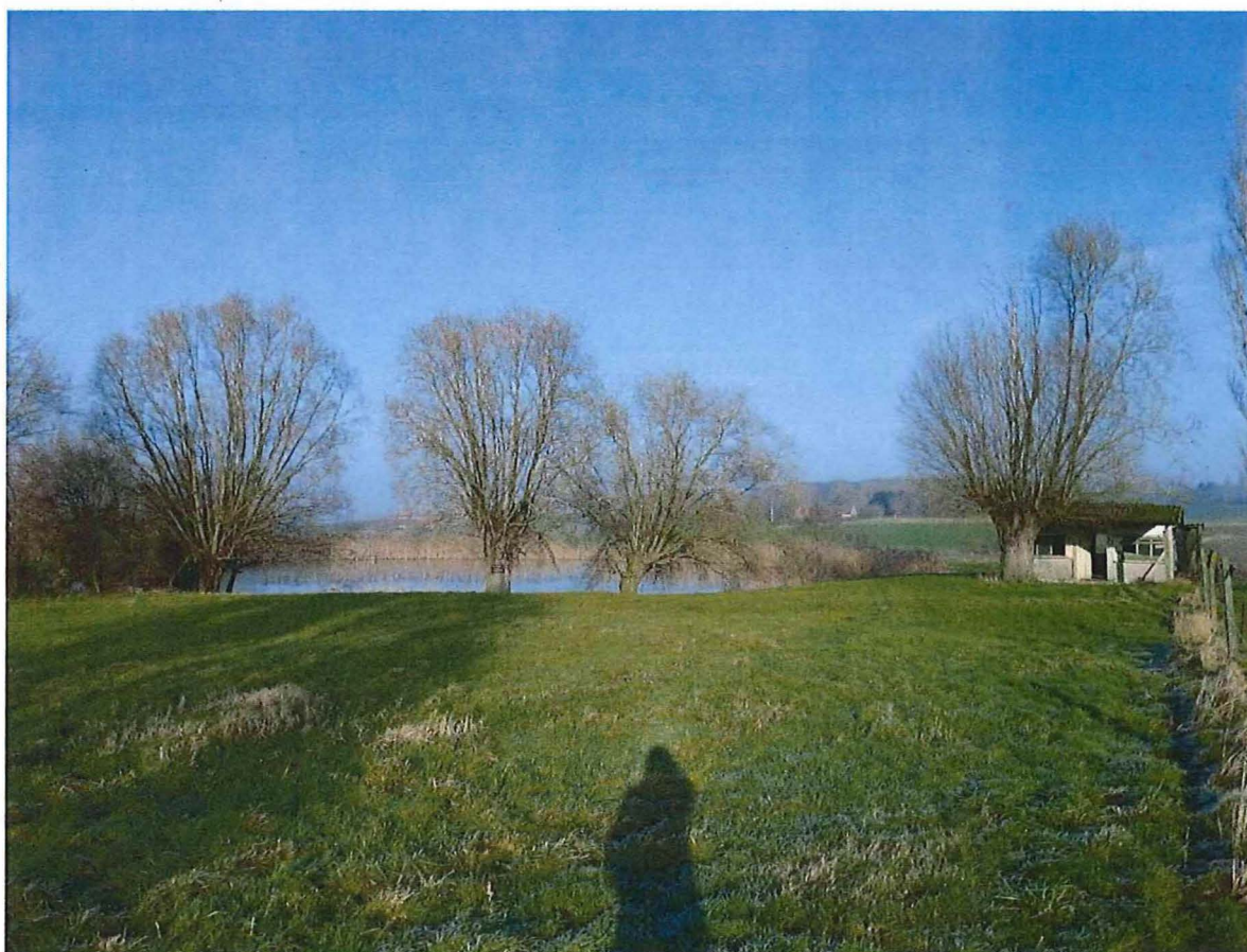
7. Zicht op krater 2, de zuidkant van de krater is begroeid met knotwilgen. Rechts een bouwvallig hok in betonplaten, 17 januari 2017.