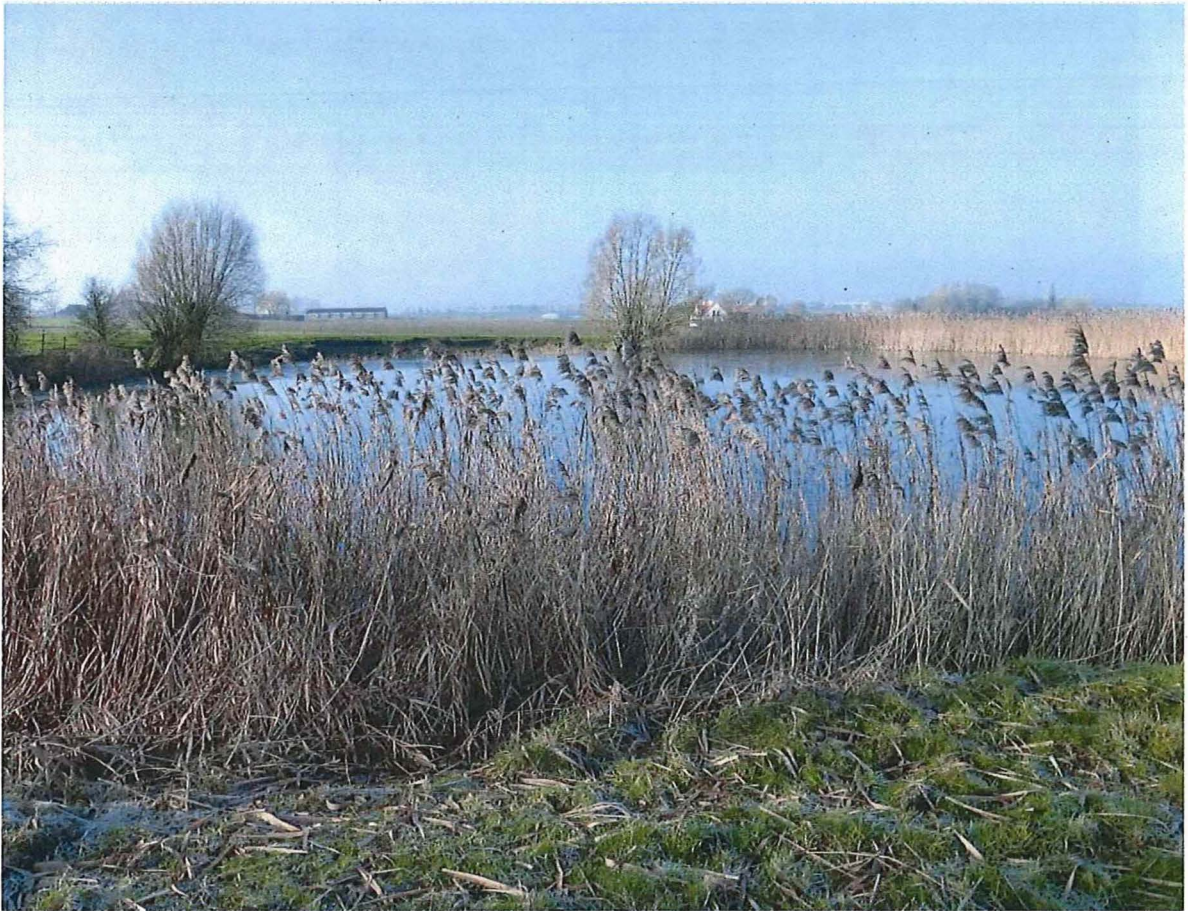
5. Krater 2 met spontaan ontwikkelde rietkraag, 17 januari 2017.