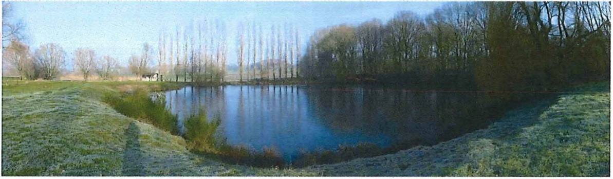
3. Panoramafoto van krater 1 bij Petit Bois , 17 januari 2017.