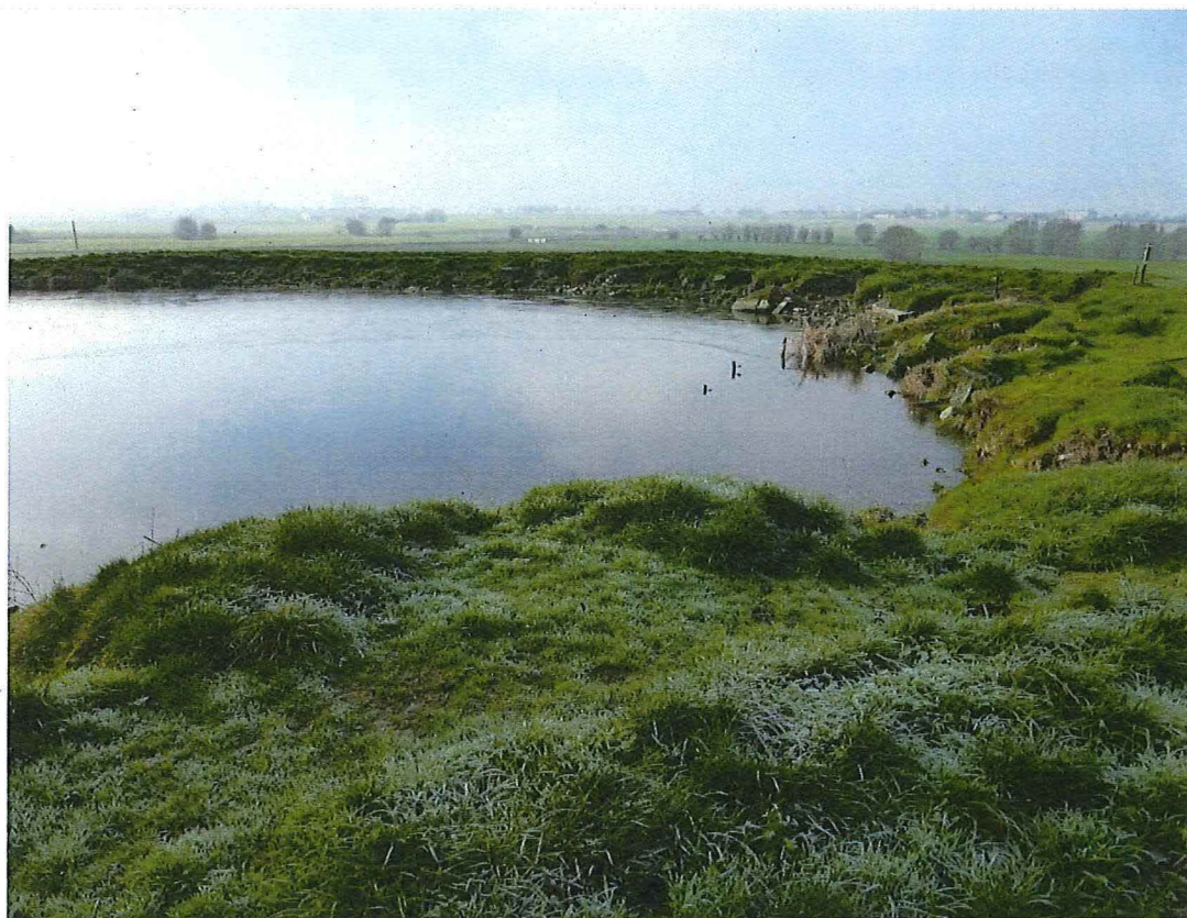
7. Krater 2 bij hoeve Hollandse Schuur, de noordelijke kraterrand is deels opgevuld/versterkt met puin, 17/01/2017