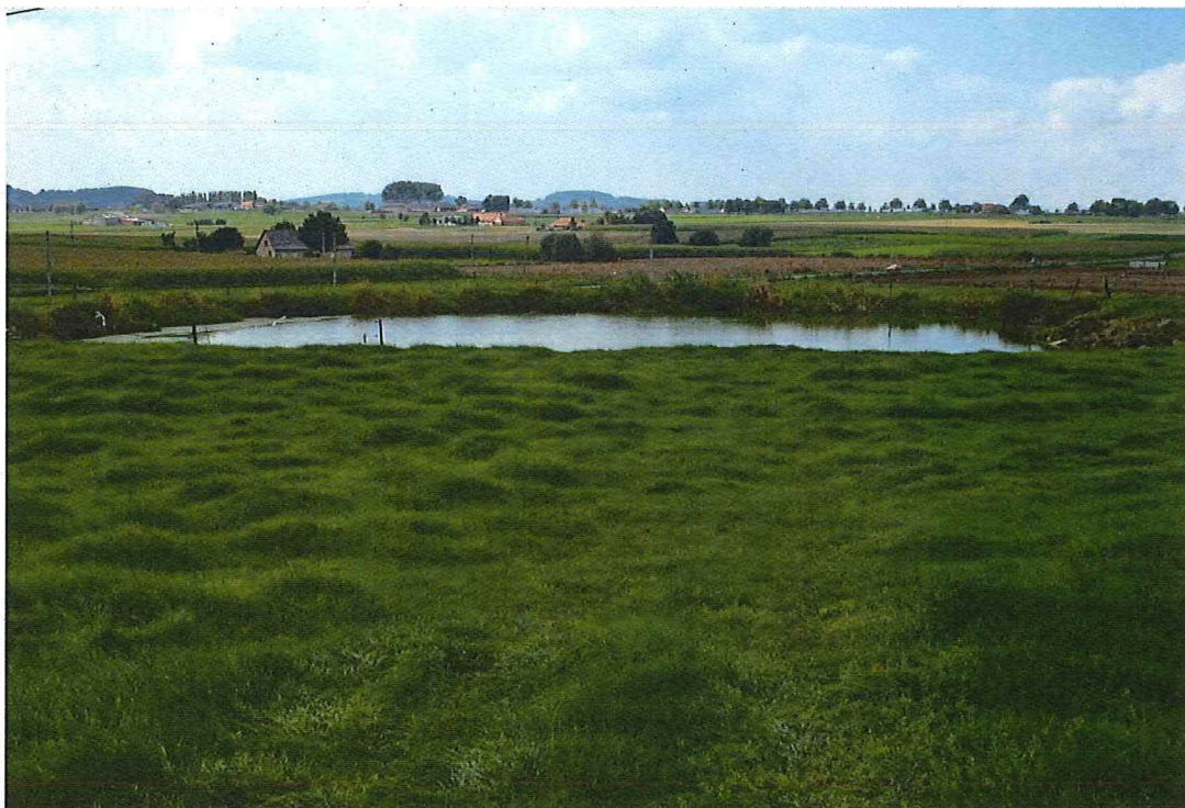
8. Krater 3 bij hoeve Hollandse Schuur, met de Kemmelberg in de achtergrond, 9/09/2014