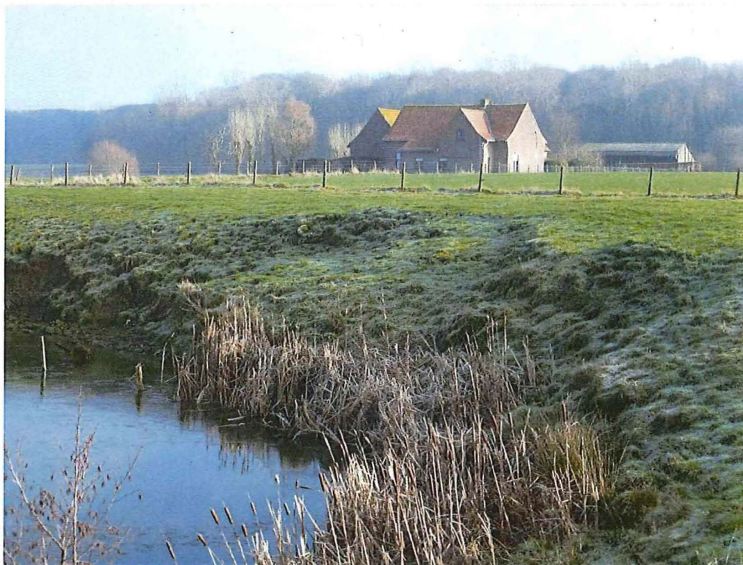
4. Krater 1 bij hoeve Hollandse Schuur, deels afgekalfde kraterwand, 17/01/2017