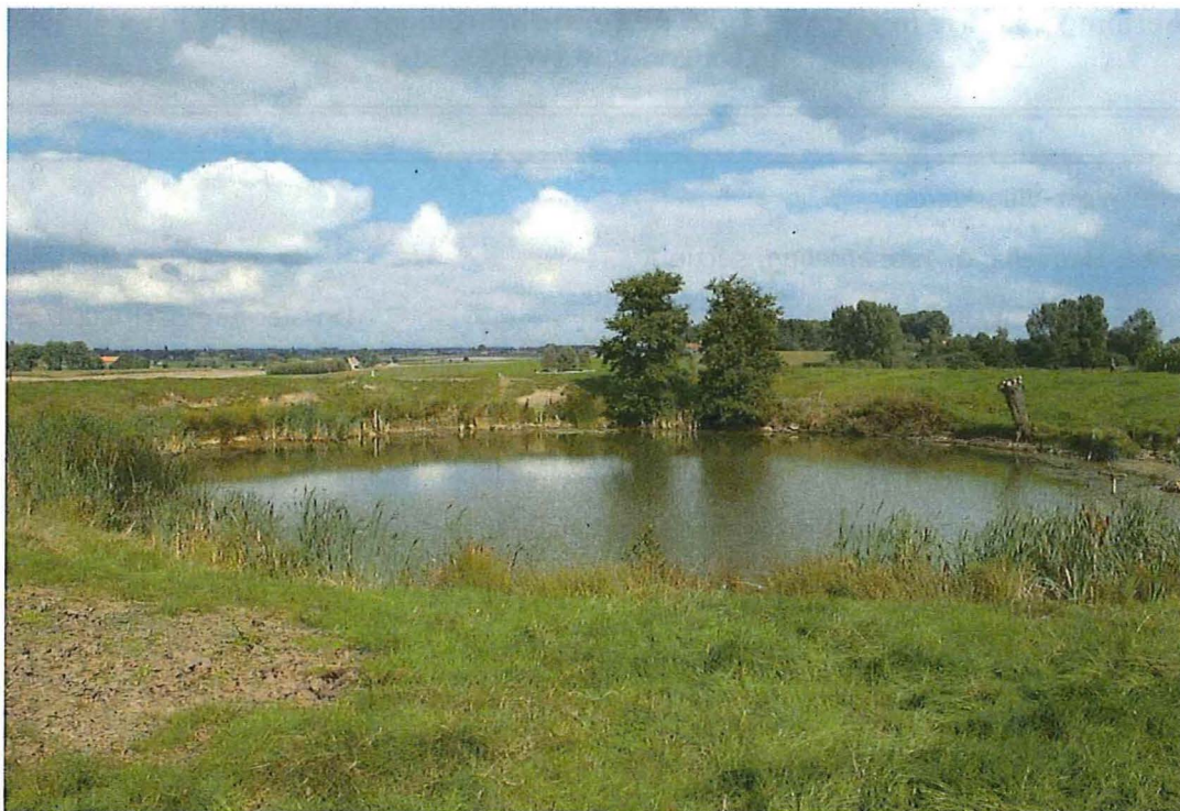
1. Krater 1 bij hoeve Hollandse Schuur in Heuvelland (Wijtschate), 9/09/2014