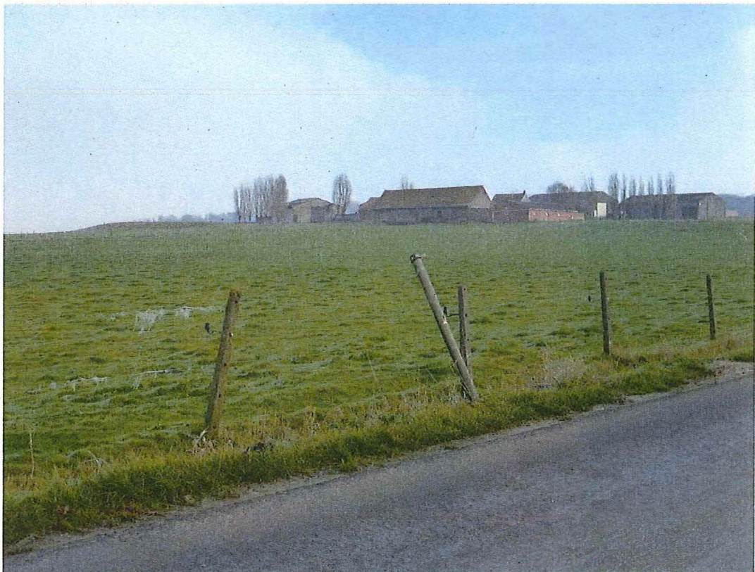
12. Zicht op hoeve Hollandse Schuur vanaf de Vierstraat, 17/01/2017