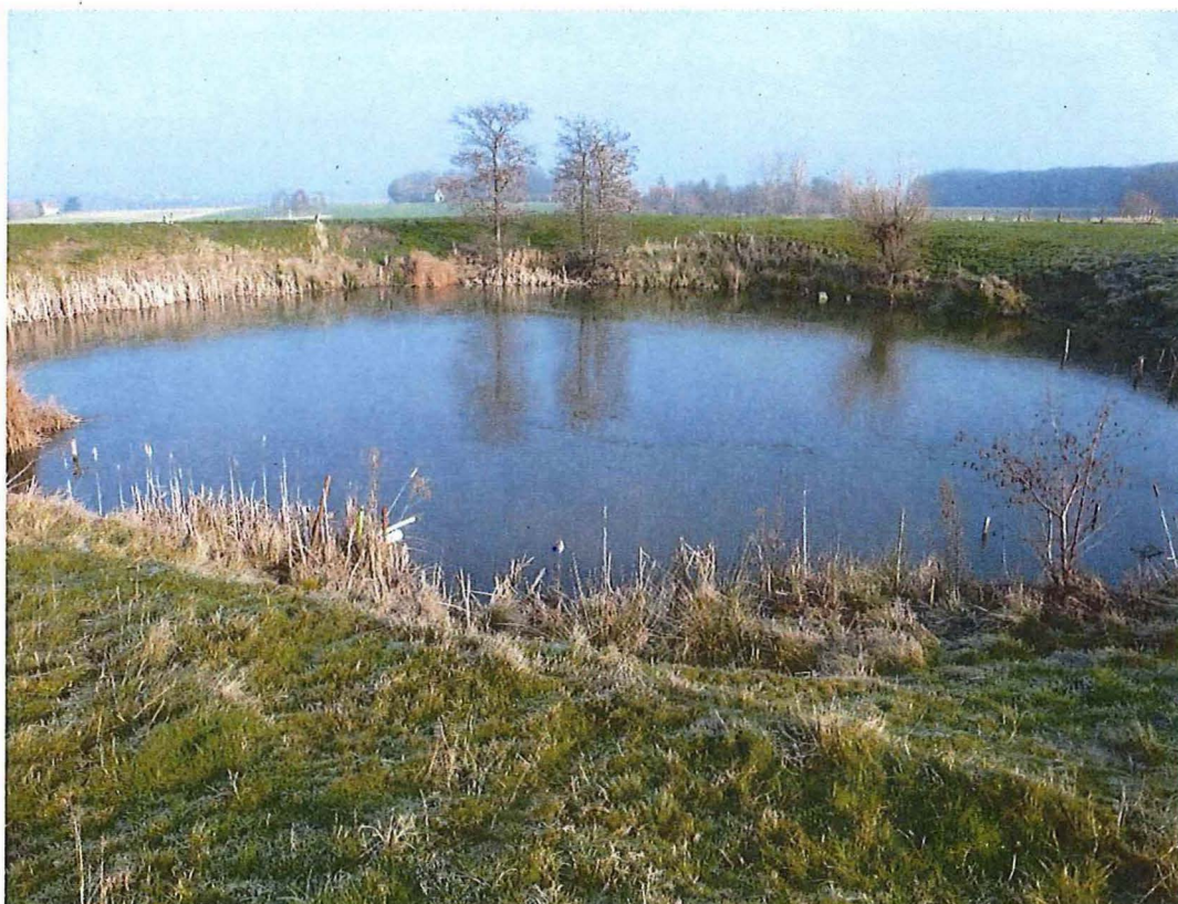
2. Krater 1 bij hoeve Hollandse Schuur met rietvegetatie en bomen op de kraterrand, 17/01/2017