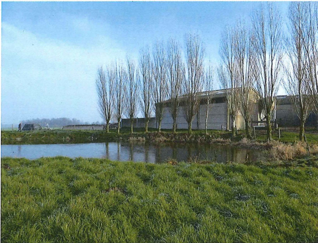
5. Krater 2 bij hoeve Hollandse Schuur, 17/01/2017