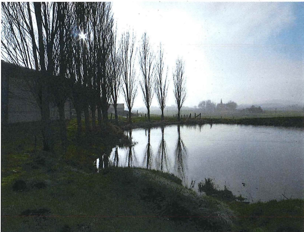
6. Krater 2 bij hoeve Hollandse Schuur, met bedrijfsgebouw op de achtergrond, 17/01/2017