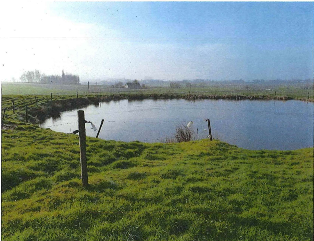
10. Krater 3 bij hoeve Hollandse Schuur, rietvegetatie waar de kraterrand het best bewaard is, 17/01/2017