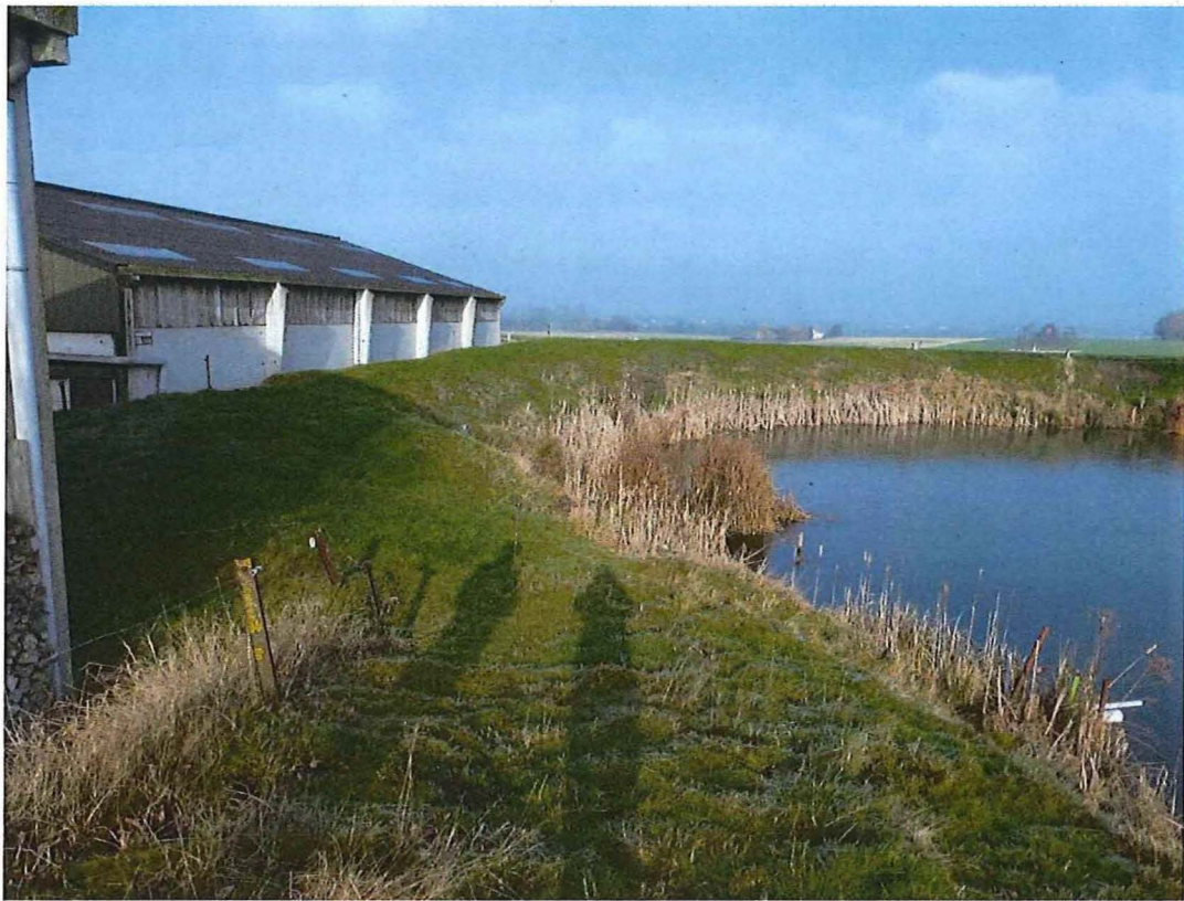
3. Krater 1 bij hoeve Hollandse Schuur, bedrijfsgebouw in de kraterlip gebouwd, 17/01/2017