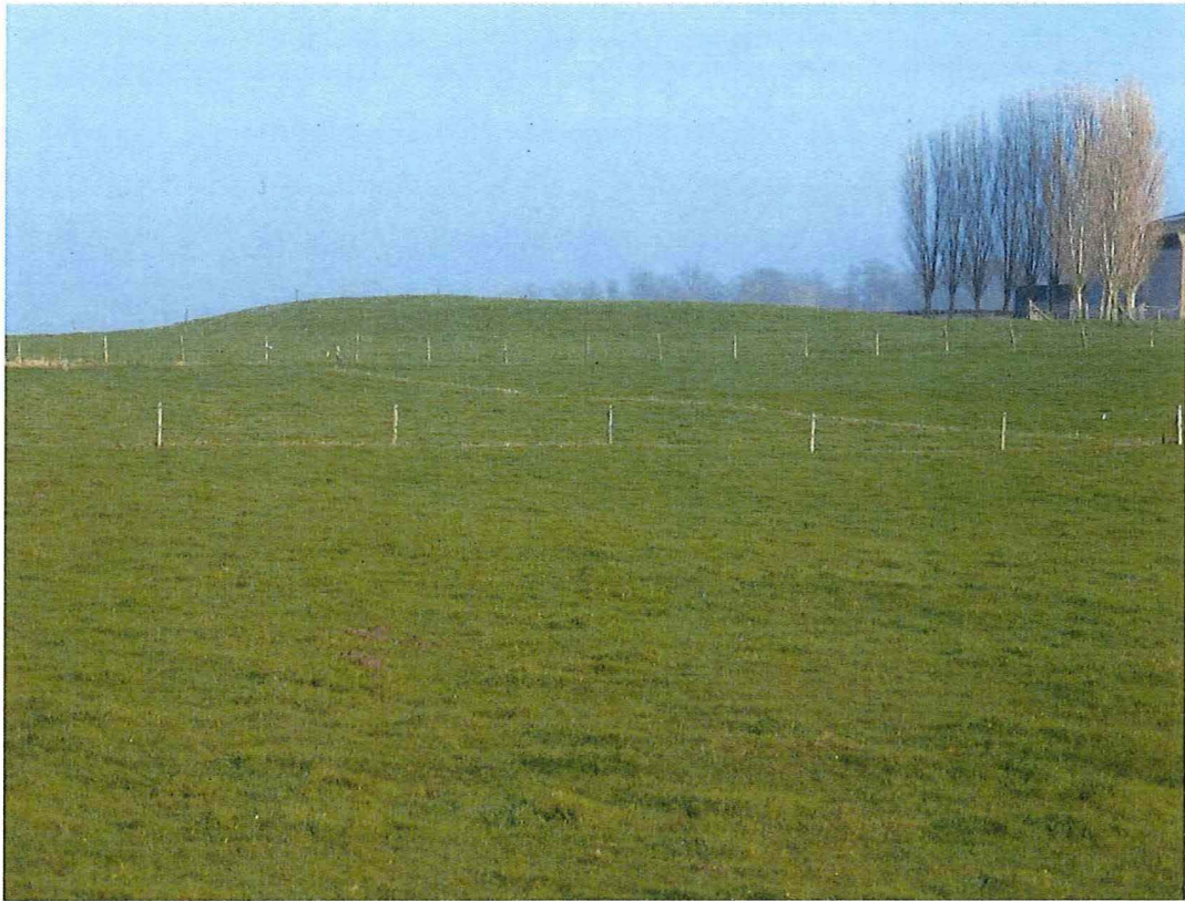
11. Krater 3 bij hoeve Hollandse Schuur, reliëf van de kraterlip zichtbaar in de topografie, foto vanaf de Vierstraat, 17/01/2017