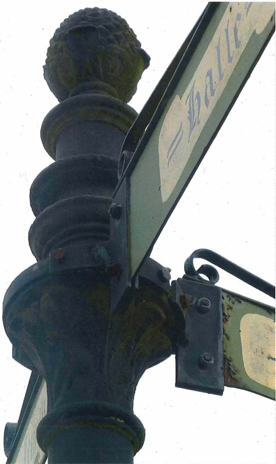
3. Gietijzeren wegwijzer A. Van Aerschot en zonen (detail), 27/02/2017