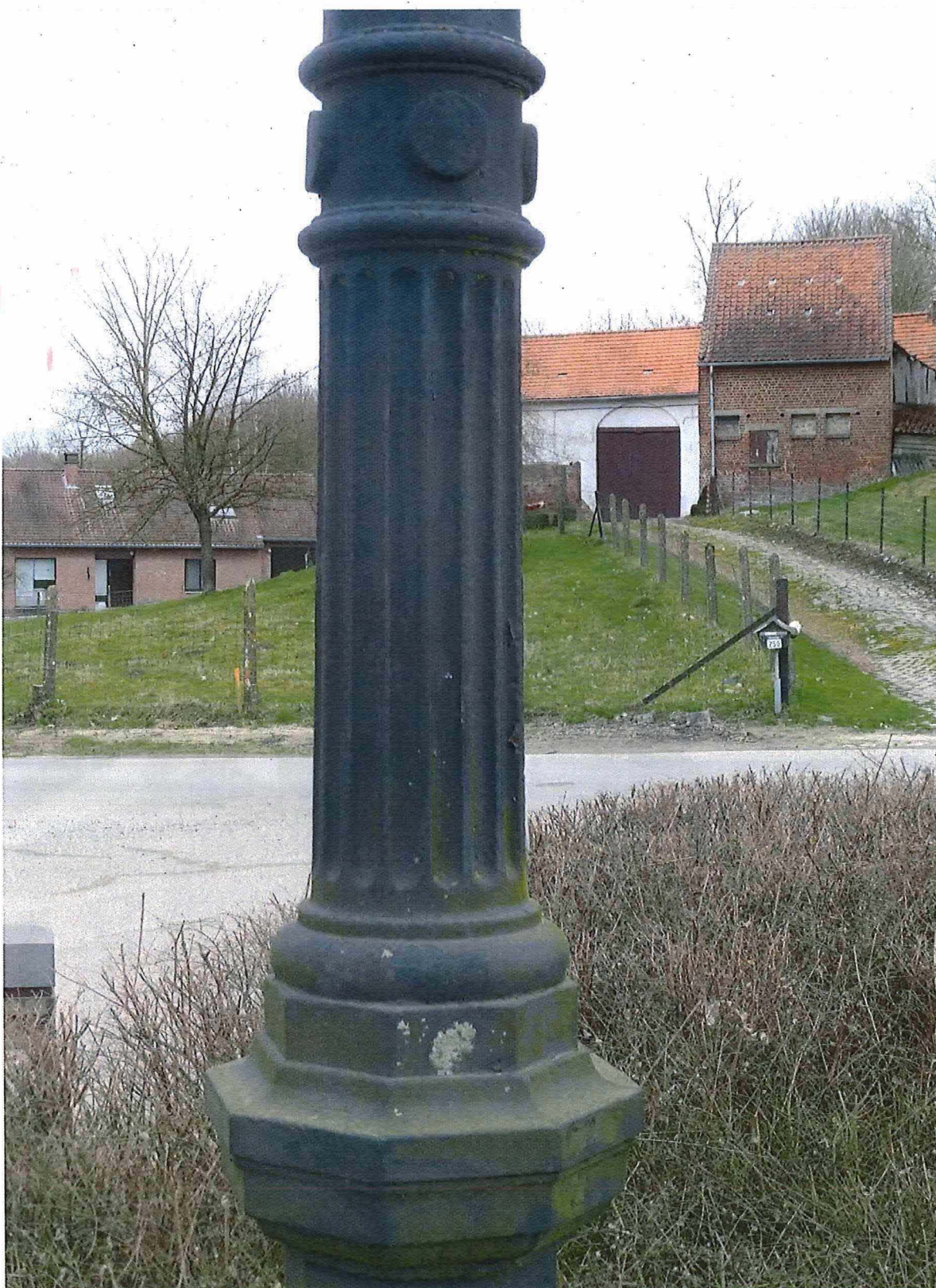
2. Gietijzeren wegwijzer A. Van Aerschot en zonen (detail), 27/02/2017