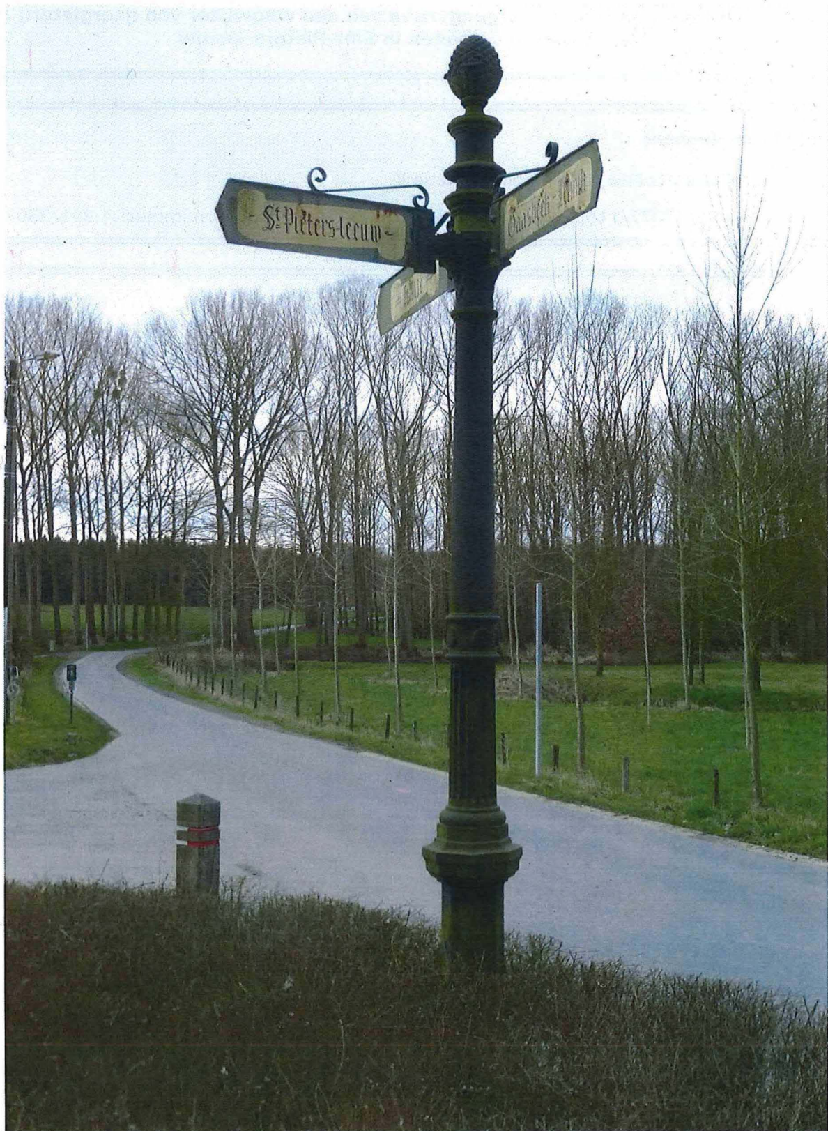
1. Gietijzeren wegwijzer A. Van Aerschot en zonen 27/2/2017