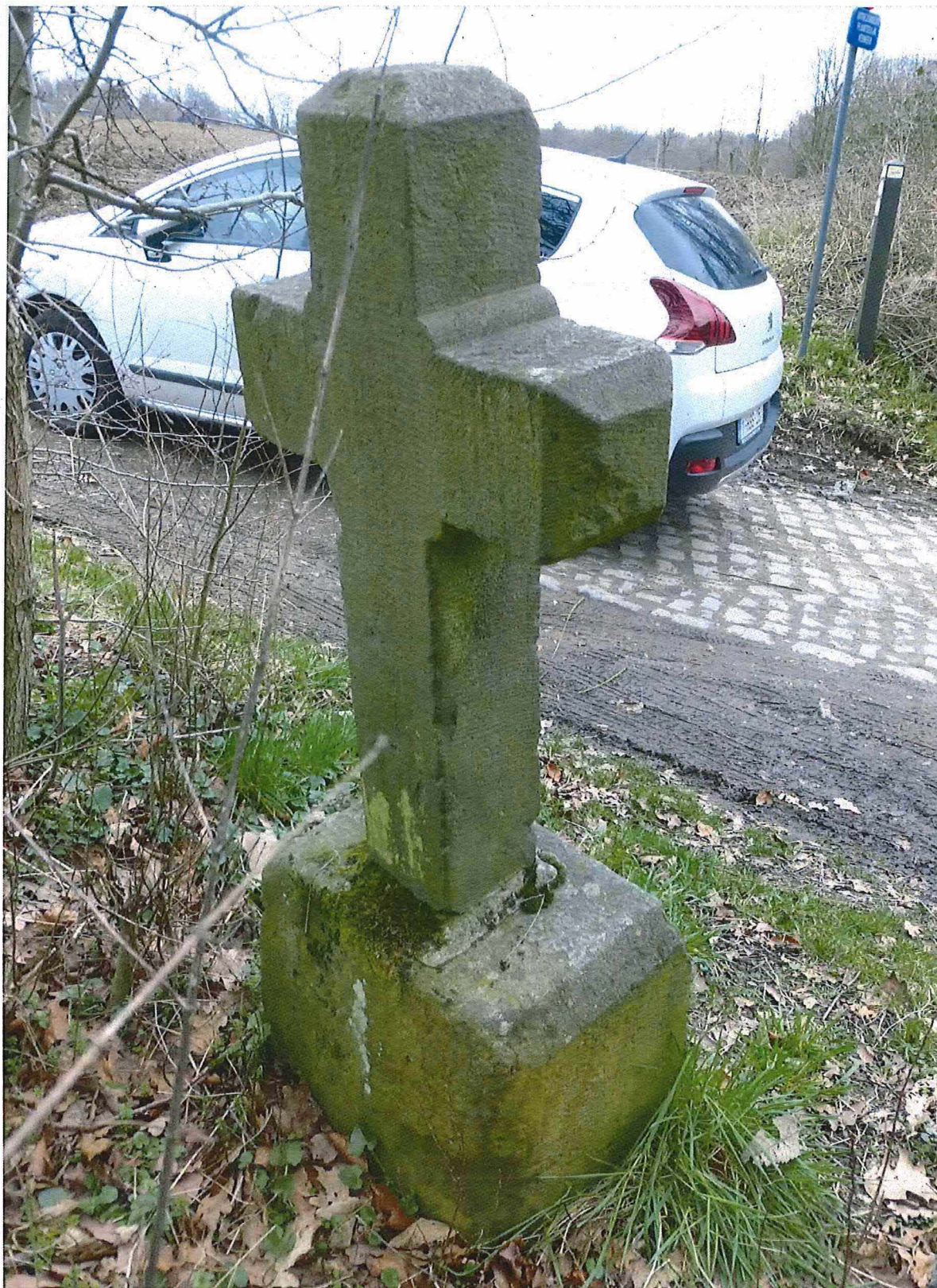
4. ongevalskruis De Blaeser, 27/02/2017