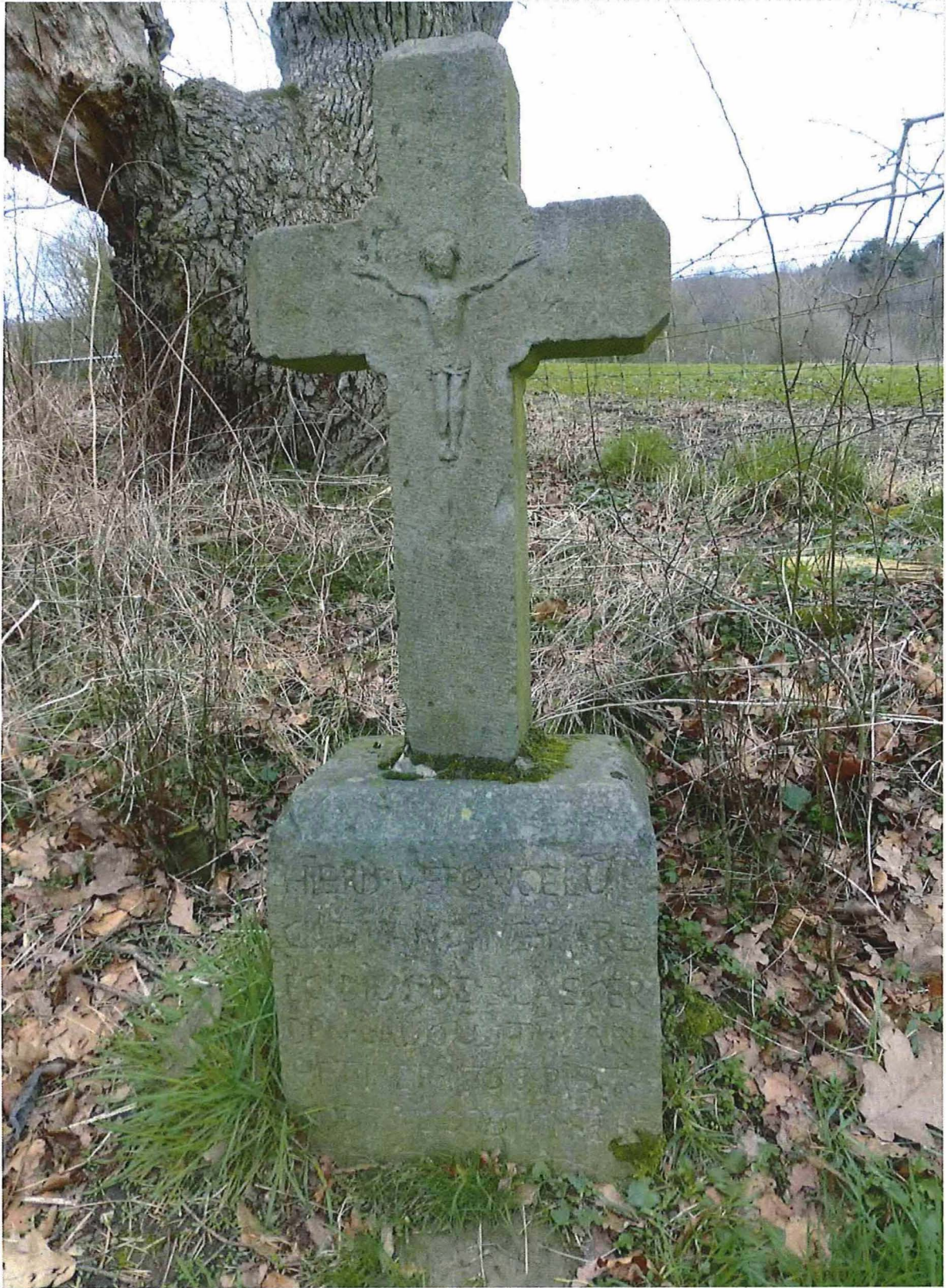
1. Ongevalskruis De Blaeser, 27/02/2017