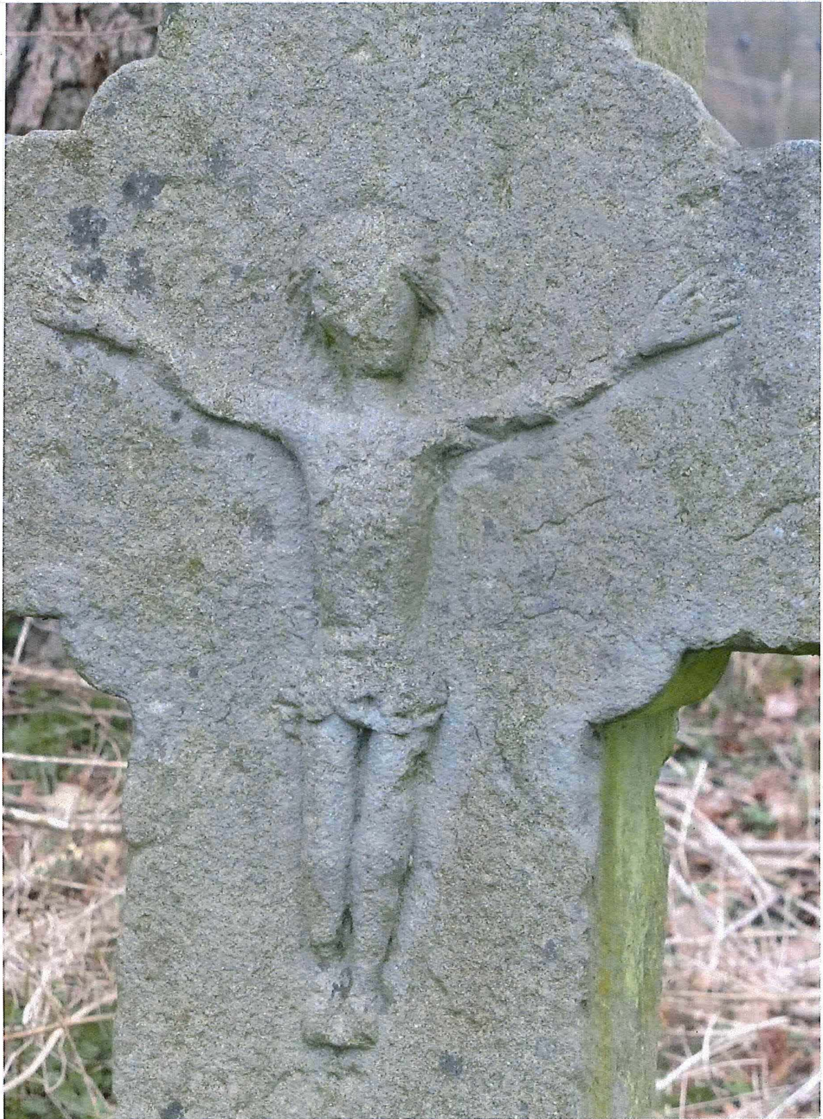
2. ongevalskruis De Blaeser, 27/02/2017