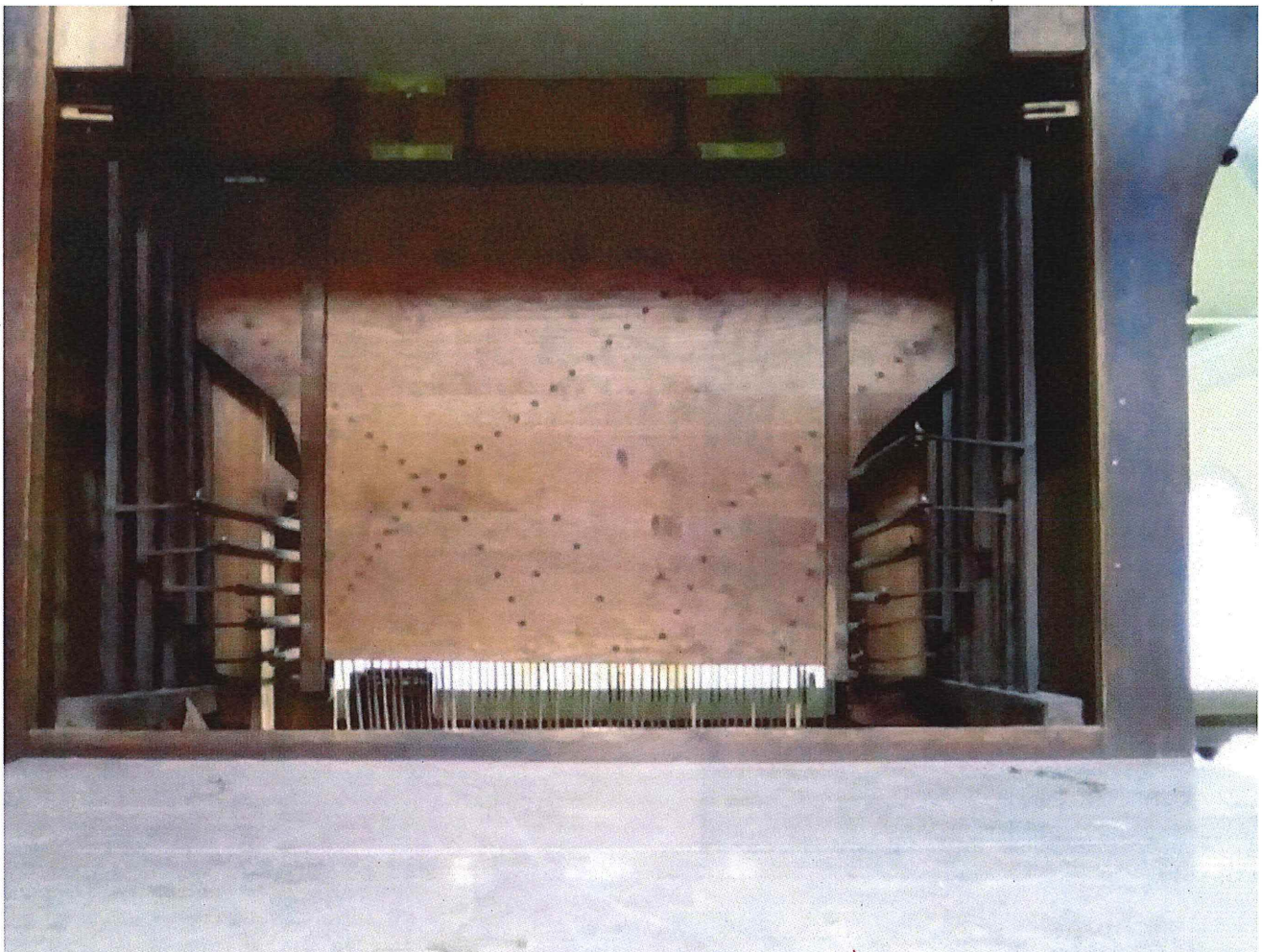
Foto 6 : Achterzijde wellenbord met registertracturen en windlade Fotoregistratie