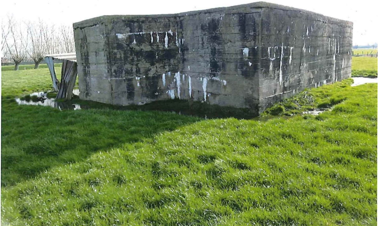
Foto 3: De noordwestelijke en zuidwestelijke zijde van de bunker.