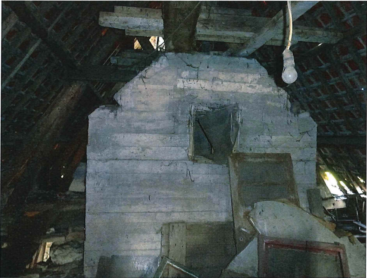
Foto 1: Zicht op de observatiepost met opening aan noordoostelijke zijde.