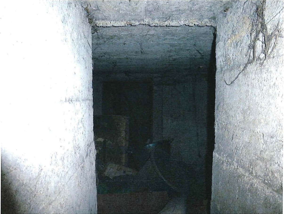
Foto 7: Zicht op de binnenruimte van de gelijkvloerse verdieping.