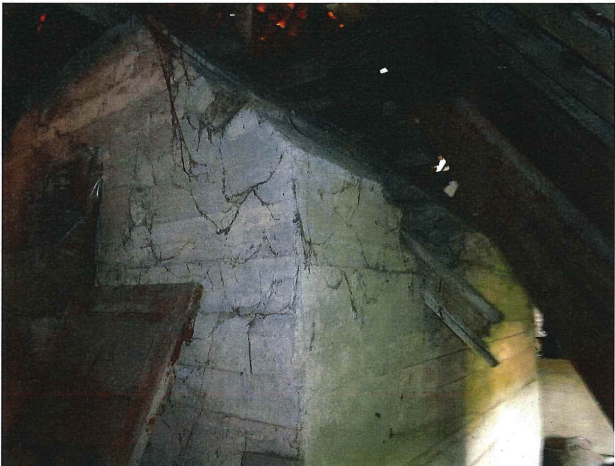
Foto 2: De bewaarde keper van het vooroorlogse dak aan noordwestelijke zijde.