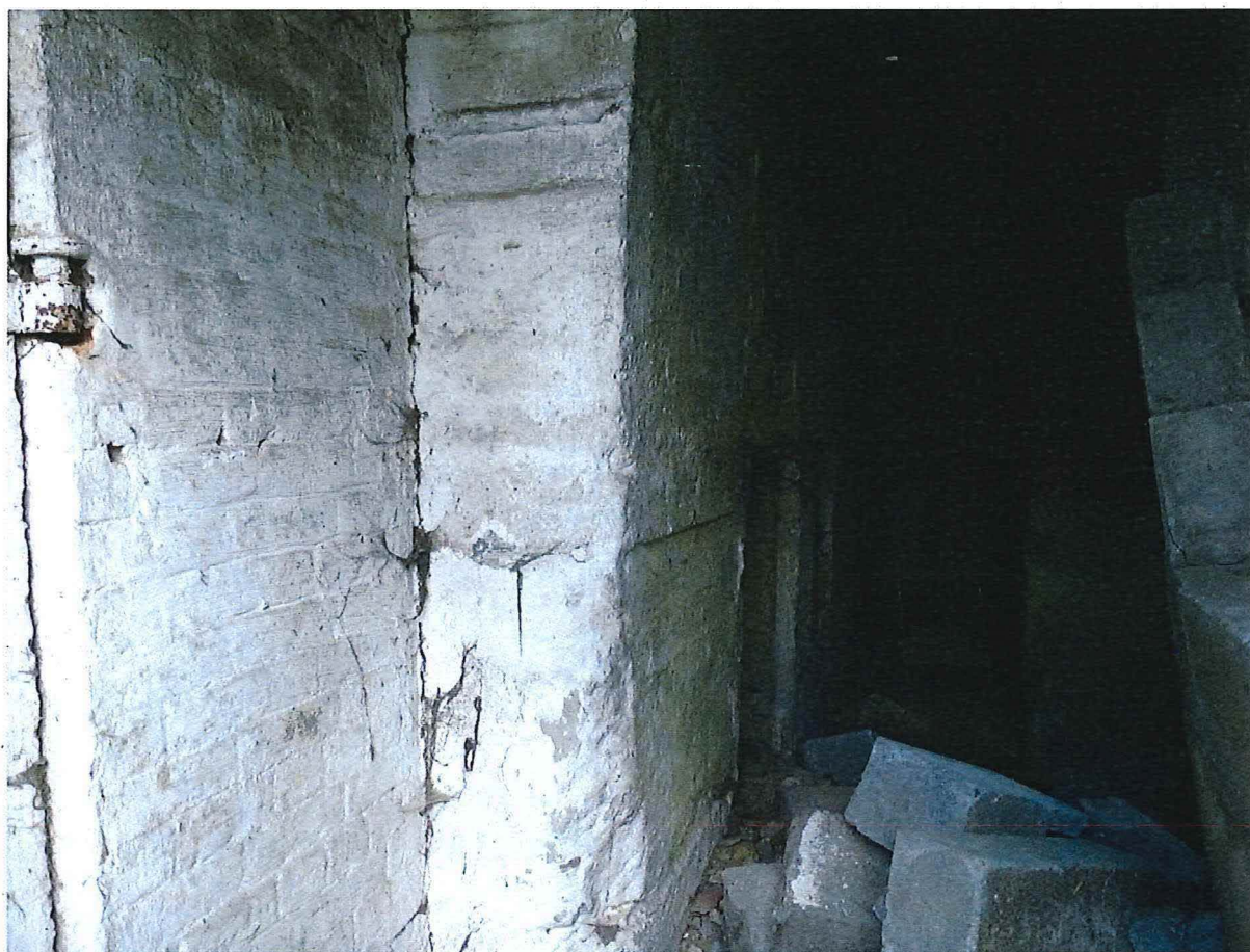
Foto 6: Toegangszijde tot het gelijkvloerse van de observatiepost.