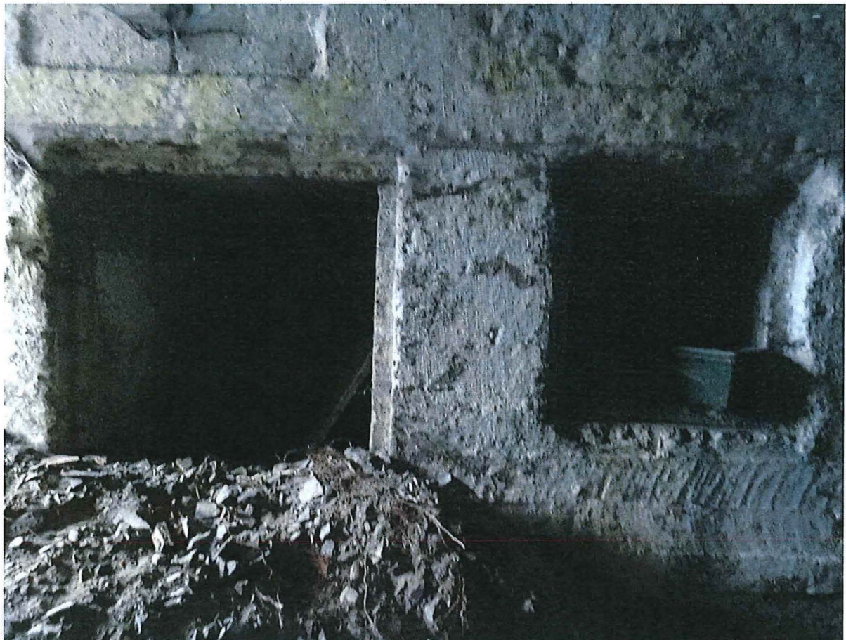
Foto 8: Toegang en vensteropening op de gelijkvloerse verdieping.