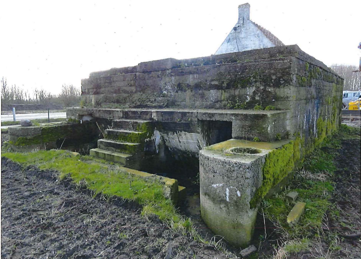
Foto 2: De sterk uitgewerkte oostelijke zijde van de mitrailleurspost.