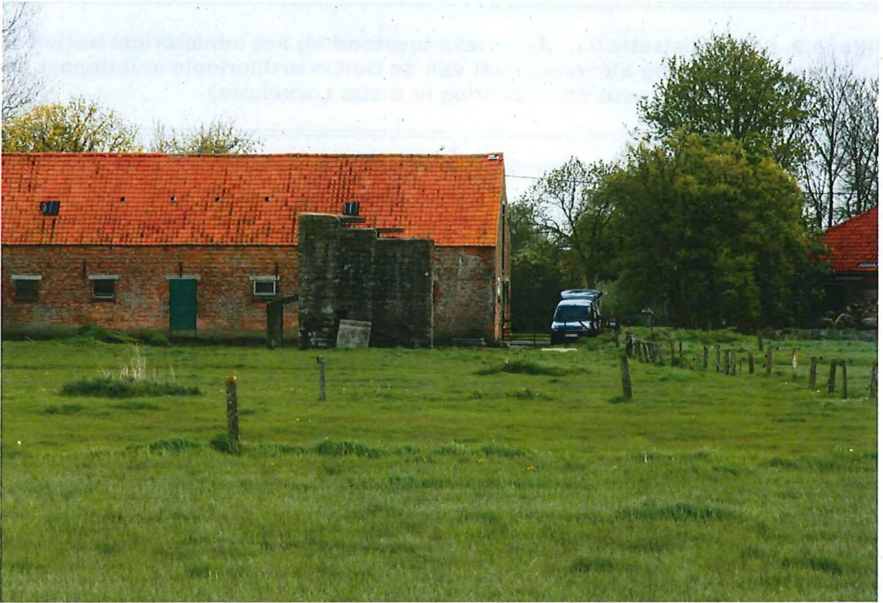
Foto 1: Zicht op de artillerieobservatiepost vanuit noordelijke richting.