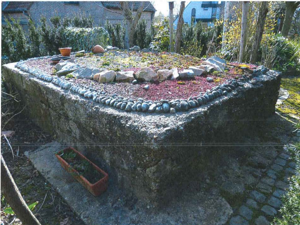
Foto 1: Bunker 1: de uitstekende muren vormden een platform, waardoor het dak als borstwering gebruikt kon worden.