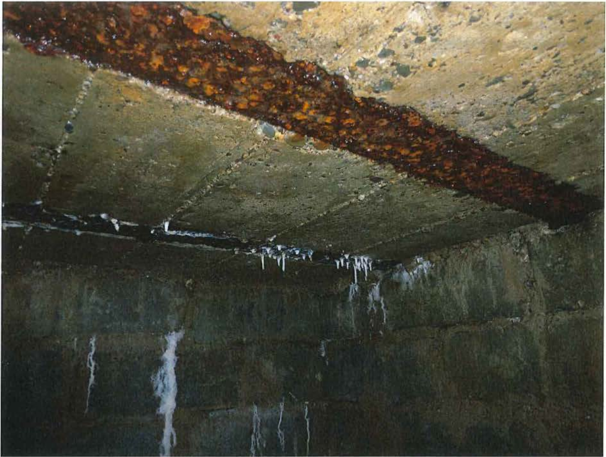
Foto 3: Bunker 1: het plafond is gegoten en versterkt met ijzeren balken.