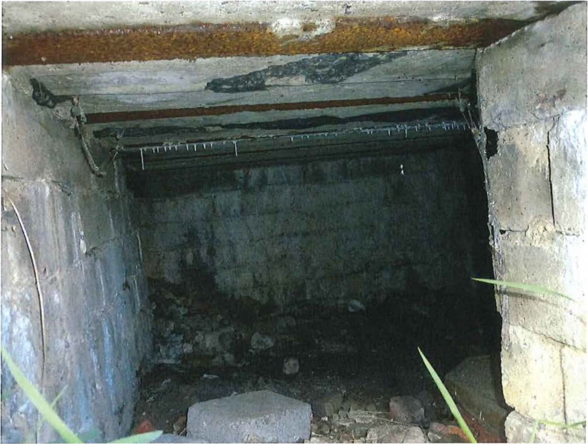
Foto 7: Bunker 2: zicht in de betonnen post. Tegen het plafond, dat versterkt is met ijzeren profielen, zitten sporen van teerpapier.