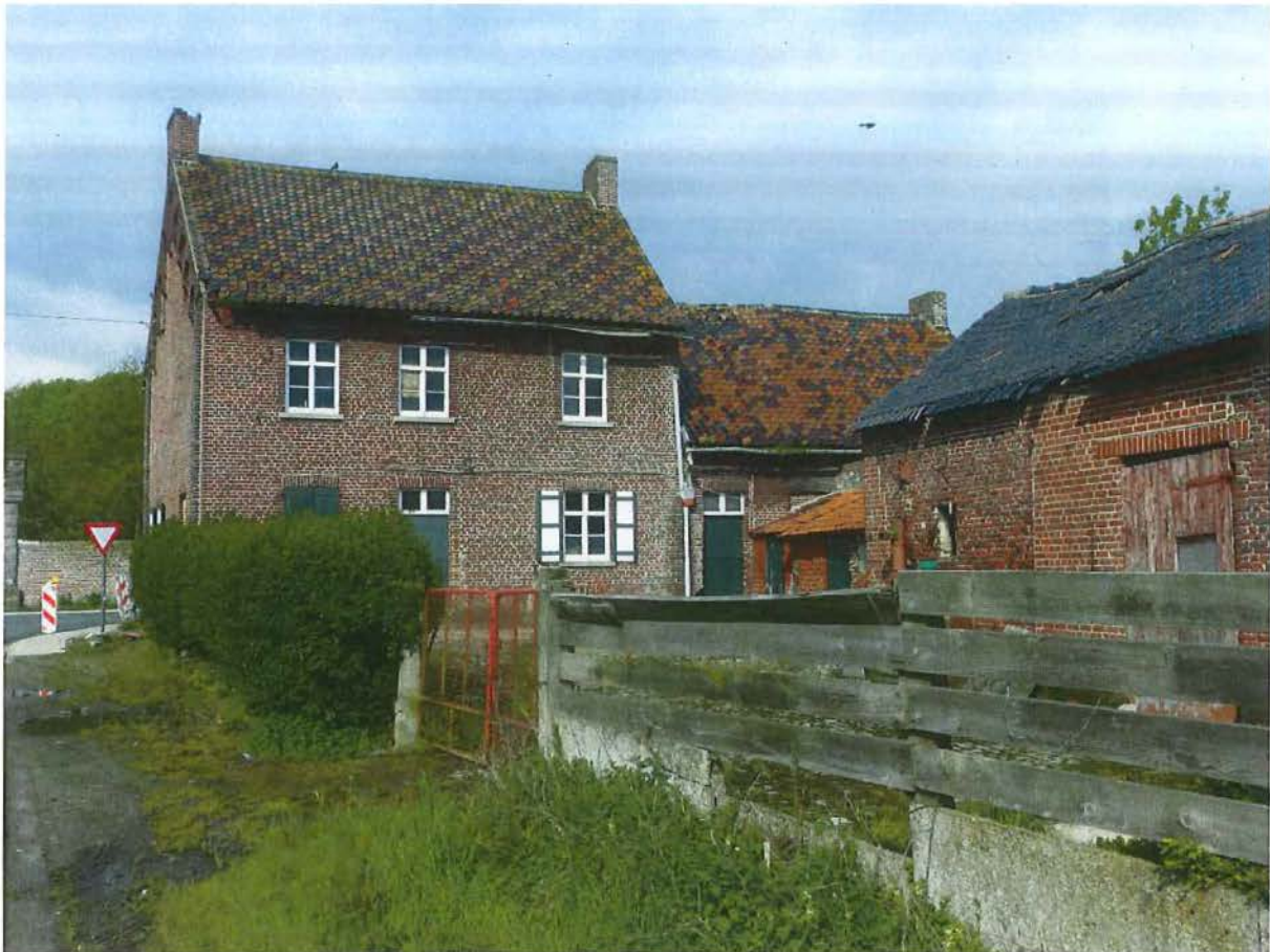
Foto 17: zicht op het achtererf met ensemble van het herbergvolume, het aansluitende lagere volume met huis en stalling, en het dwarsschuurtje (plaatsbezoek 28 april 2016).