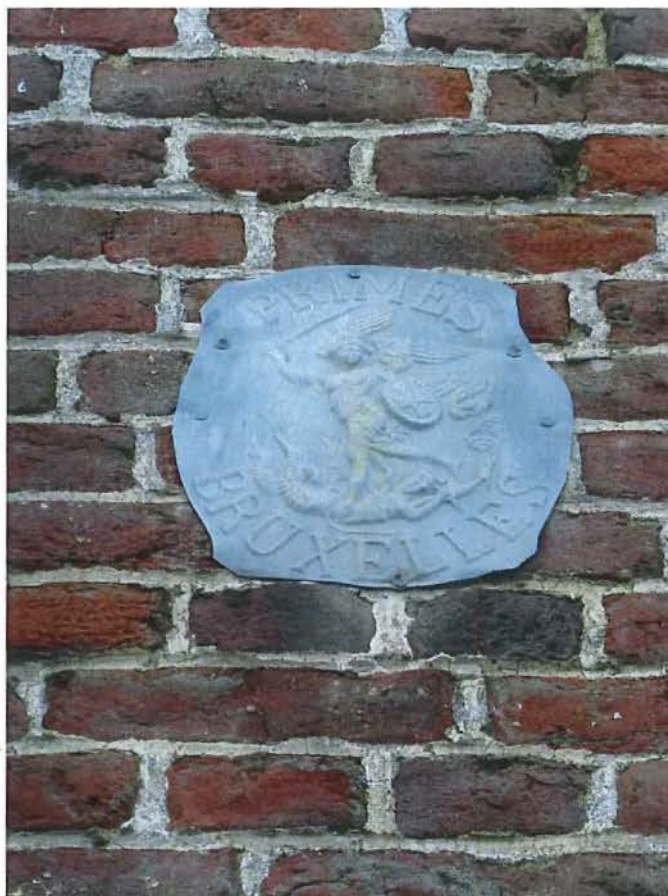
Foto 13: detailfoto metalen verzekeringsplaat "Primes Bruxelles" op zuidelijke zijgevel (03 maart 2017).