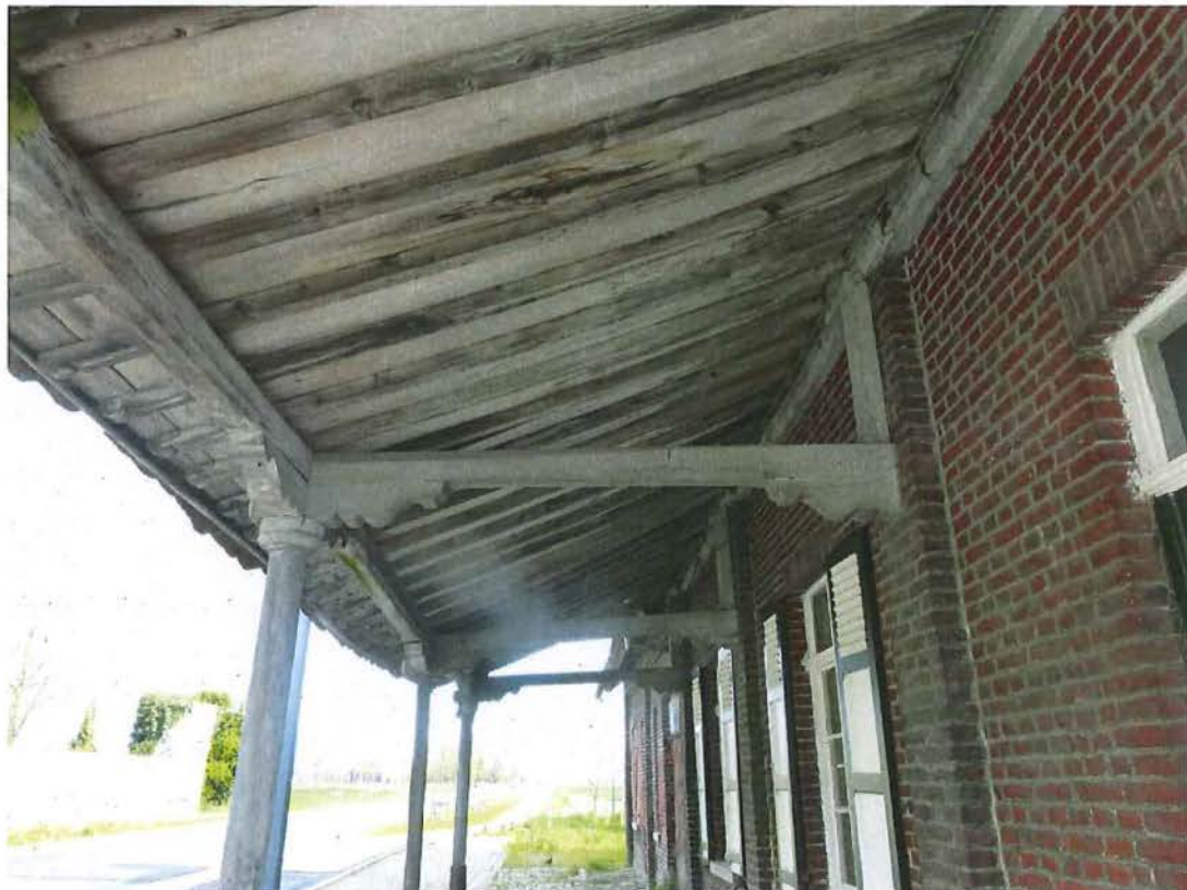
Foto 8: de verzorgde houten constructie van de herbergluifel (plaatsbezoek 28 april 2016).