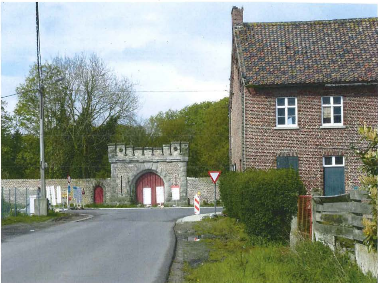
Foto 2: visuele relatie tussen de herberg en de "Wijnendalepoort" aan de overzijde van de Oostendestraat. Zichtas vanuit de Wijnendale-Satationsstraat op de poort (plaatsbezoek 28 april 2016).