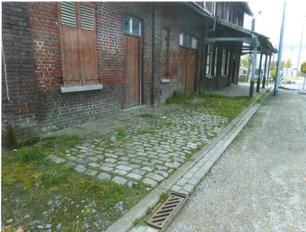
Foto 12: de gekasseide stoep voor het lagere volume met huis en stalling (plaatsbezoek 28 april 2016).