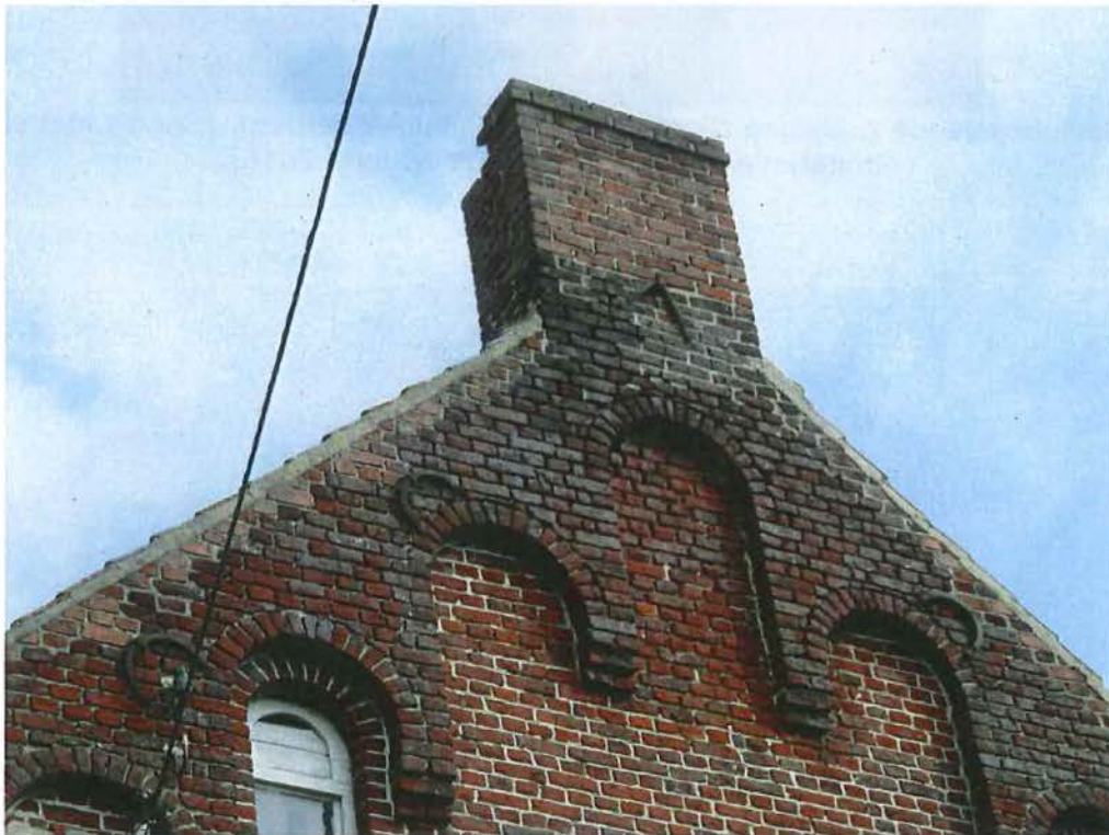
Foto 4: beeldbepalende zuidelijke zijgevel van de eigenlijke herberg, sierlijk metselwerk met rondboogfries (plaatsbezoek 28 april 2016).