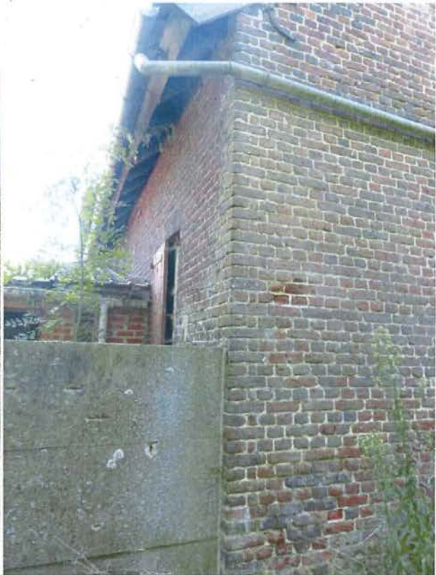
Foto 15: achtergevel van het herbergvolume met pomp, keldervenster met diefijzers en opkamervenster (plaatsbezoek 14 september 2016).