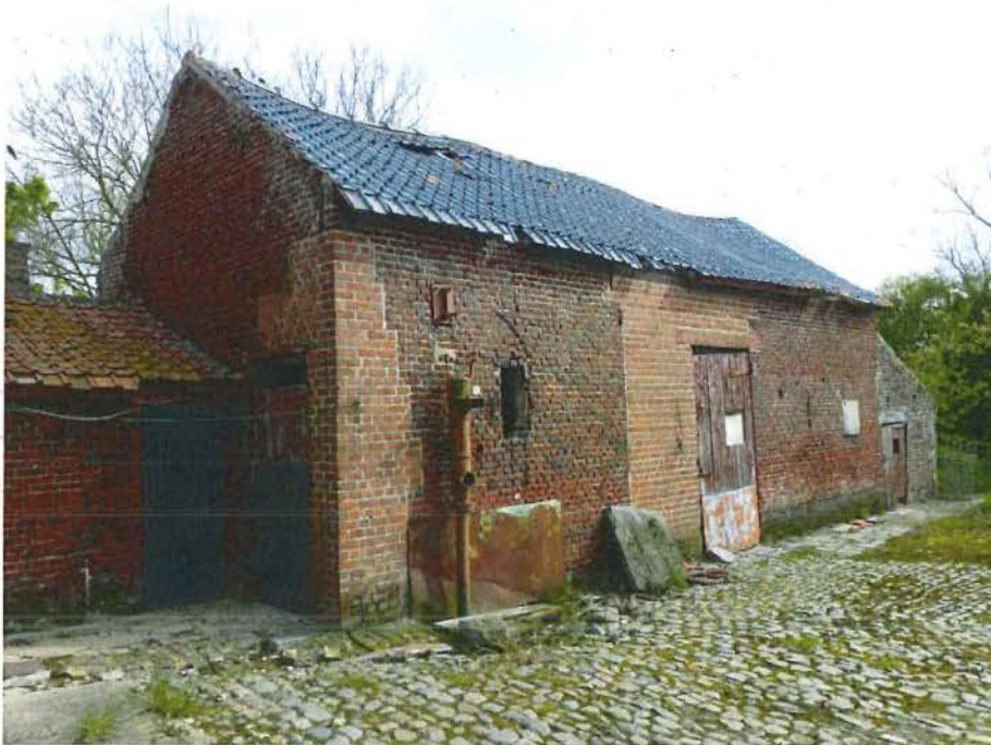
Foto 19: het kleine dwarsschuurtje sluit het gekasseide achtererf af. Recent metselwerk geeft de vroegere hoge schuurpoort aan in het midden (plaatsbezoek 14 september 2016).