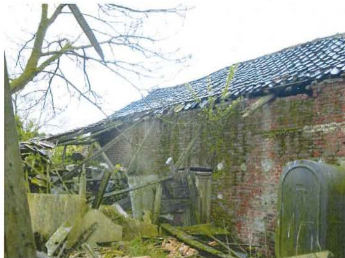
Foto 21: achterzijde van het dwarsschuurtje – bemerk hetzelfde type geglazuurde pannen als bij het hoofdvolume (plaatsbezoek 14 september 2016).