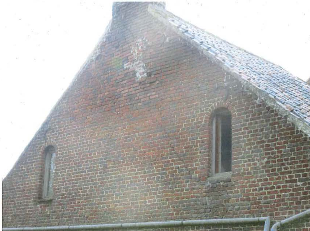
Foto 6: linker zijgevel van het aansluitende lagere volume met huis en stalling, twee rondboogvensters (plaatsbezoek 28 april 2016).