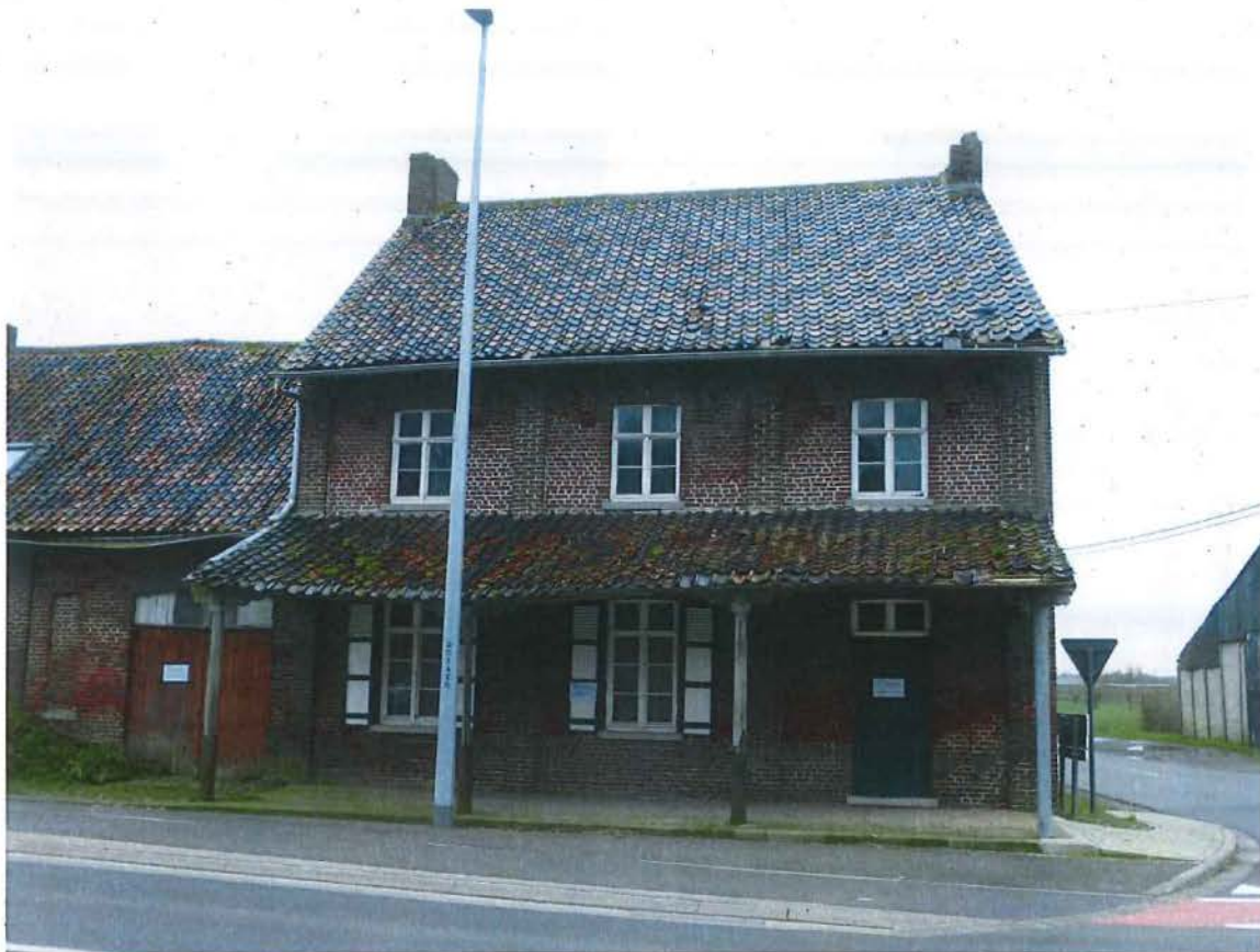
Foto 7: de eigenlijke herberg met aansluitende herbergluifel (03 maart 2017).