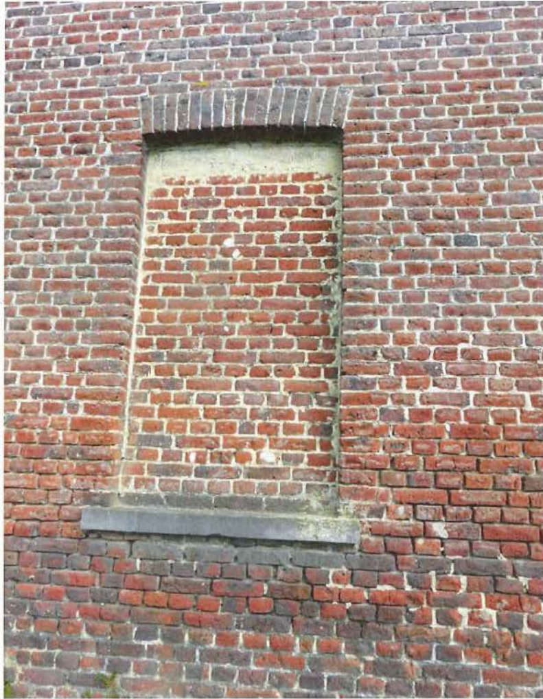
Foto 5: beeldbepalende zuidelijke zijgevel van de eigenlijke herberg, blindnis met sporen van imitatievenster (plaatsbezoek 28 april 2016).