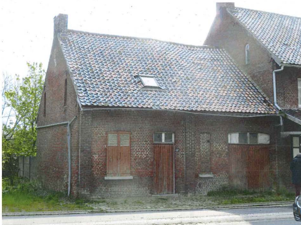
Foto 11: het lagere volume met huis en stalling (plaatsbezoek 28 april 2016).