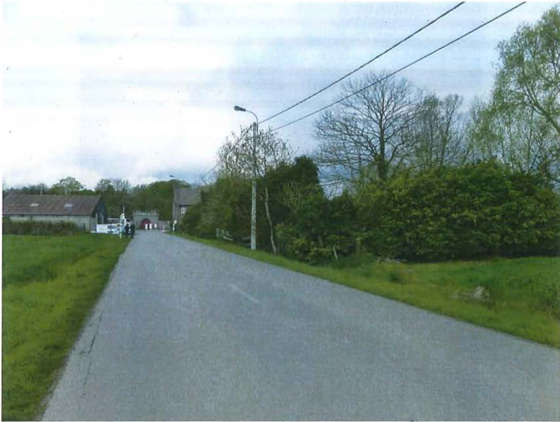
Foto 3: visuele relatie tussen de herberg en de "Wijnendalepoort" aan de overzijde van de Oostendestraat. Zichtas vanuit de Wijnendale-Satationsstraat op de poort (plaatsbezoek 28 april 2016).