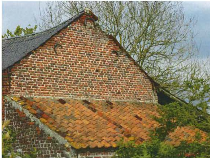
Foto 20: dwarsschuurtje, rechter zijgevel met halfcirkelvormige muurankers. De recentere aanbouw onder lessenaarsdak hoeft niet bewaard te blijven (plaatsbezoek 14 september 2016).