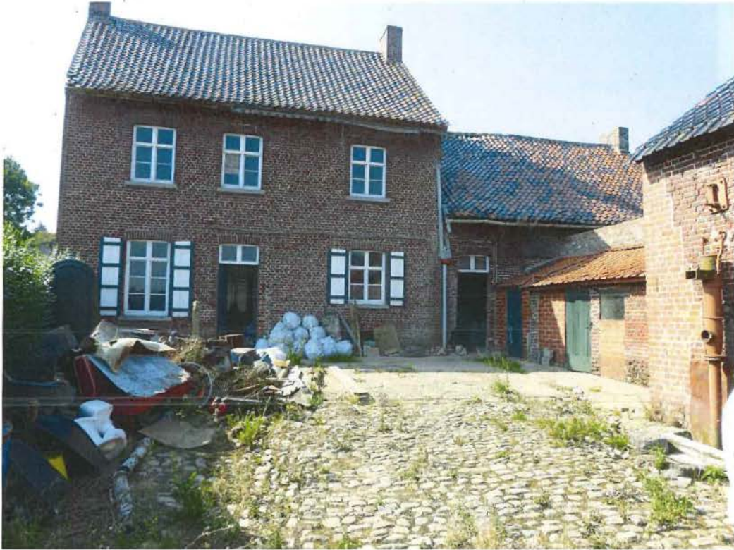
Foto 14: de achtergevel van het herbergvolume met opkamer, en de lagere vleugel met stalling en huis (plaatsbezoek 14 september 2016).