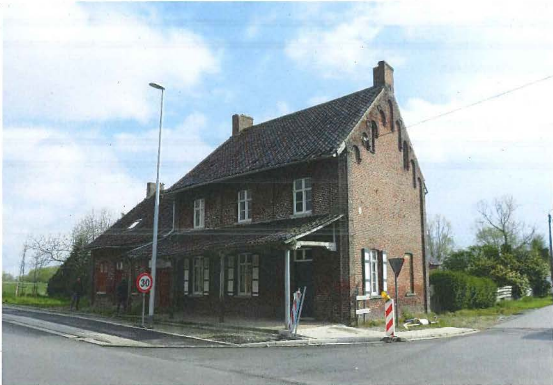
Foto 1: algemeen beeld van de herberg "A la Belle Vue" vanaf de zuidwestzijde. Voorgevel met herbergluifel, sierlijk metselwerk met lisenen en fries. Zuidelijke zijgevel met aflijnende rondboogfries en blindnis (plaatsbezoek 28 april 2016).