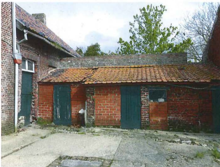
Foto 18: de vleugel die het hoofdvolume verbindt met het dwarsschuurtje is in hoge mate verbouwd en hoeft niet bewaard te blijven (plaatsbezoek 14 september 2016).