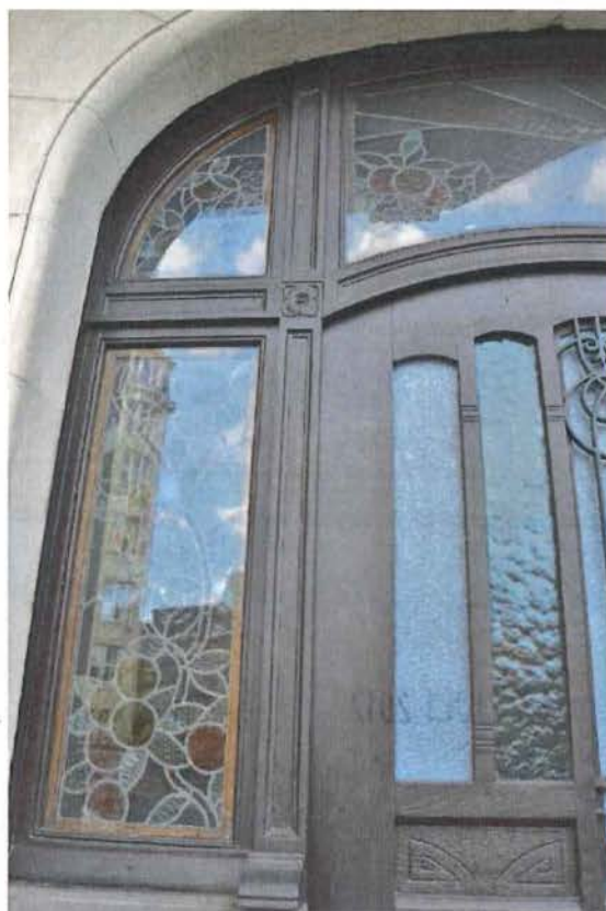
Foto 3: Extérieur, voorgevel. Detail houtsnijwerk en glas-in-lood voordeur.