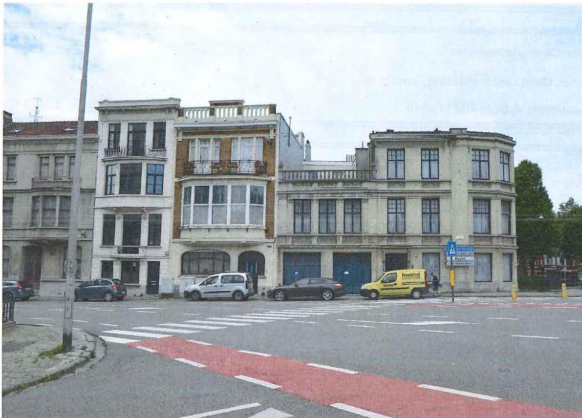
Foto 1: Situering van de Woning De Keukelaere-Brico in zijn ruimere omgeving, gezien vanaf de Emile Clauslaan. Rechts achterin bevindt zich de Parklaan met dubbele rij gekandelaarde platanen.