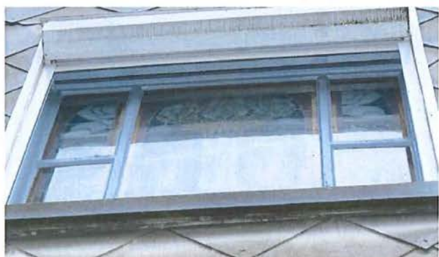
Foto 13: Achtergevel van de achterbouw, gezien vanuit de tuin. Detail van het glas-in-loodraam op de eerste verdieping (zie volgende foto).