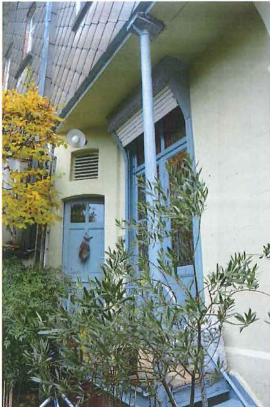
Foto 10: Achtergevel van de achterbouw, gezien vanuit de tuin. Balkon met buitentoilet en vensterdeur naar de keuken, met rolluikkast.