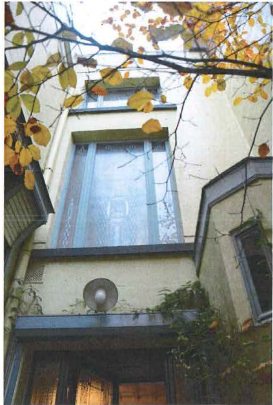
Foto 8: Achtergevel van het hoofdvolume met drie ramen van respectievelijk: de vensterdeur naar de ontvangstruimte, de grote traphal en de mezzanine.