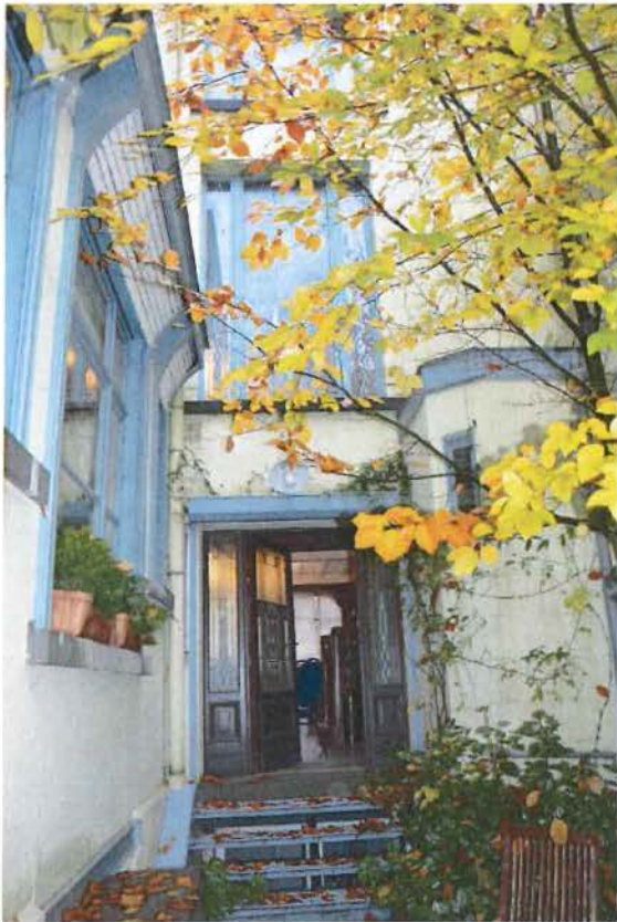
Foto 7: Achtergevel van hoofdvolume (centraal) en achterbouw (links), gezien vanaf de koer. Links de vensters van de keuken met rolluiken. Centraal de toegang naar de grote ontvangstruimte. Rechts de kleine uitbouw van het gastentoilet.