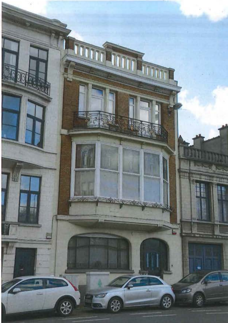
Foto 4: Extérieur Woning De Keukelaere-Brico, voorgevel aan de Krijgslaan.