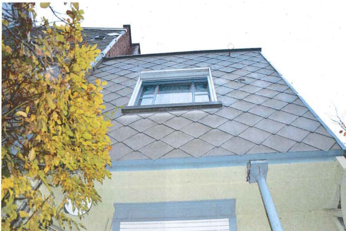
Foto 14: Achtergevel van de achterbouw, gezien vanuit de tuin. Zicht op de overkragende eerste verdieping en het glas-in-loodraam.