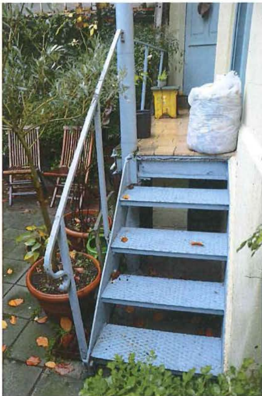
Foto 12: Trap naar het balkon aan de achterbouw, gezien vanuit het zuiden, met links achterin zicht op een deel van de tuin (met verharding).