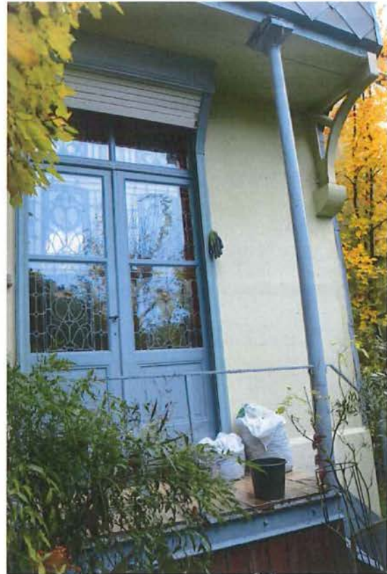
Foto 11: Achtergevel van de achterbouw, gezien vanuit de tuin. Zicht op het balkon met overkragende verdieping, ondersteund door metalen kolom en console.