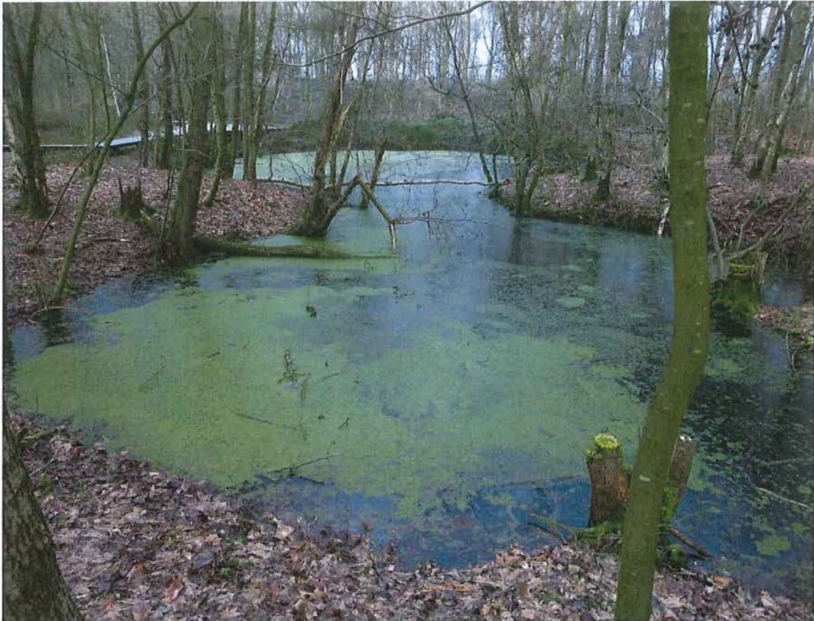
7. Krater C, ontstaan uit twee mijnontploffingen vanaf 22 oktober 1916, 17/01/2017