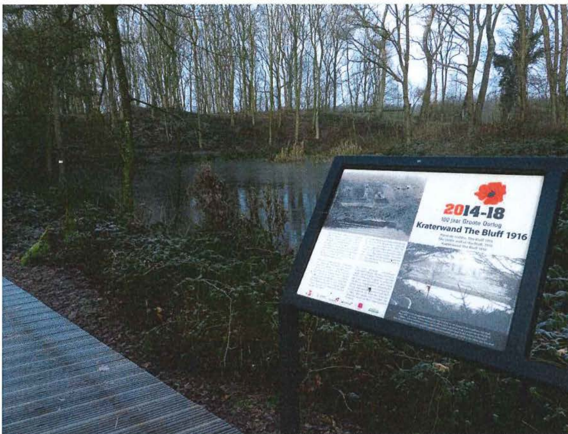
6. Krater B met infopaneel, de randen zijn begroeid met bramen, rietvegetatie in het ondiepe gedeelte van de waterplas in de kratermond, 17/01/2017