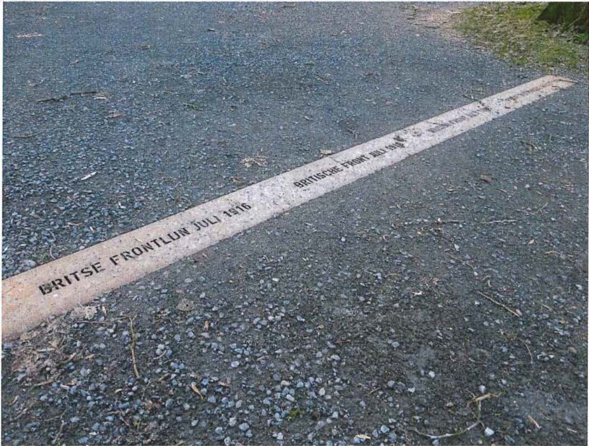
13. Markering op het pad ter hoogte van krater B, 17/01/2017