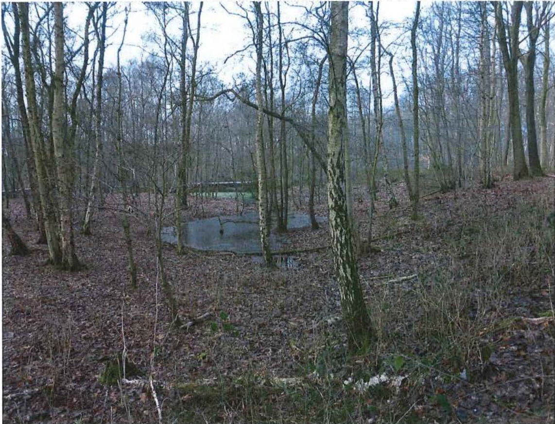
8. Krater D met krater C in de achtergrond, 17/01/2017