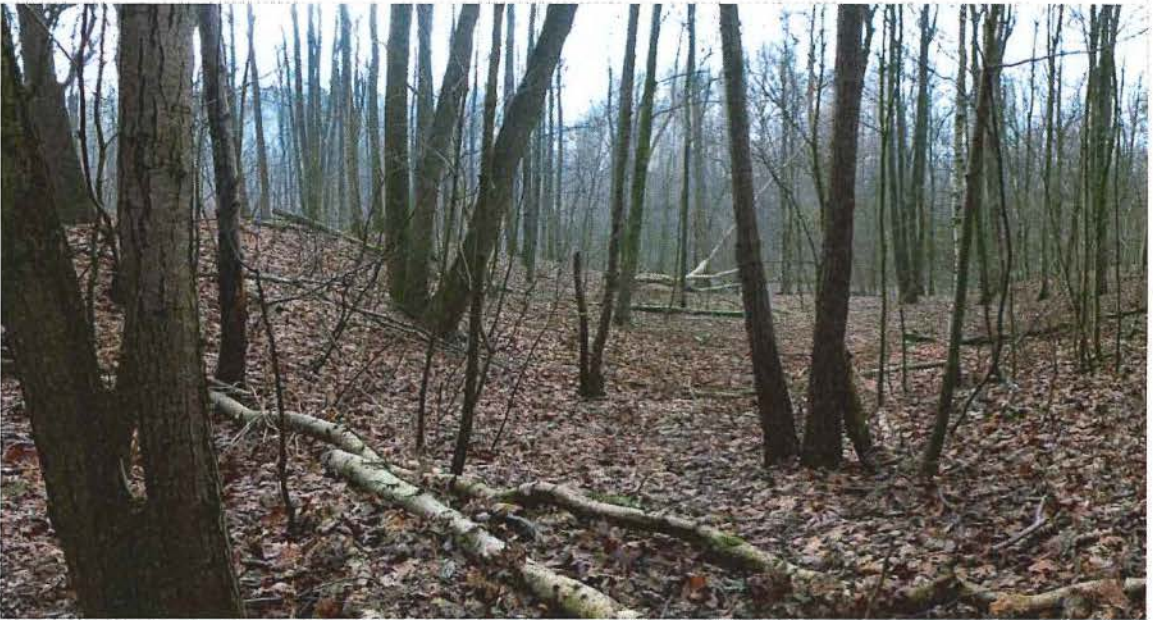
10. Krater F, deze krater markeert de voormalige Duitse posities, 17/01/2017