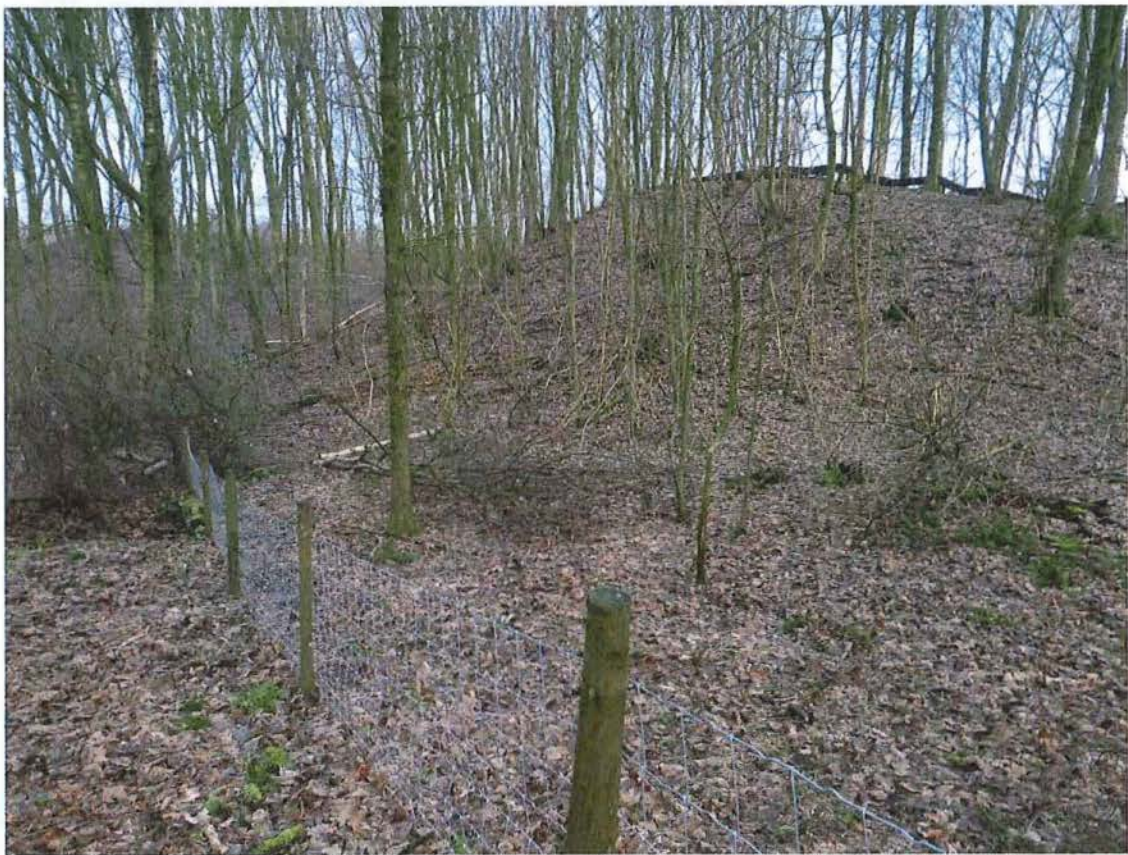
4. Omheining door krater A, rechts de rand van het gronddepot tussen krater A en B, 17/01/2017