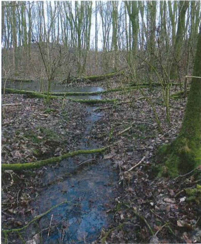
3. Kleine en ondiepe waterplas in krater A, die voor het overige droog staat en met bomen begroeid, 17/01/2017