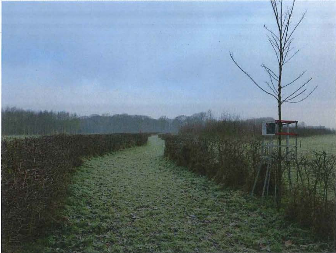
11. Visualisering van de Duitse frontlijn door meidoornhagen en herdenkingsbomen (olm), 17/01/2017