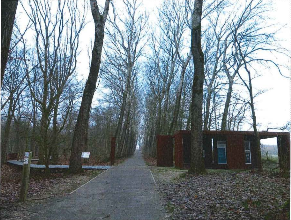
1. Toegang tot de ingerichte mijnkratersite in domein Palingbeek op de helling van de kanaaloever; 17/01/2017