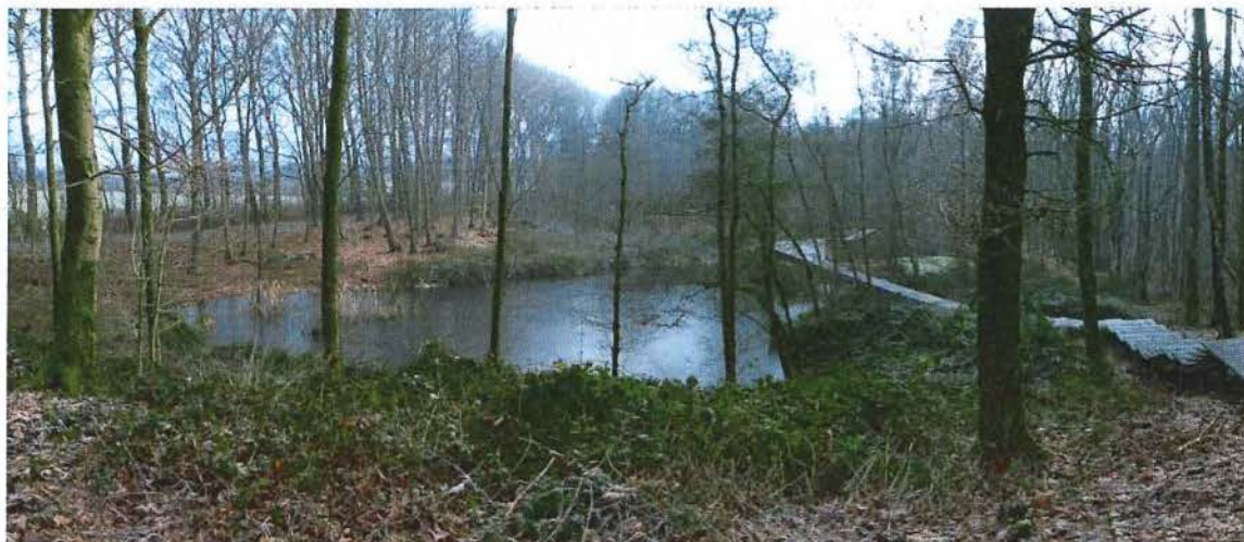
5. Krater B, foto gemaakt boven op de hoog gelegen rand van het gronddepot tussen krater B en A, 17/01/2017