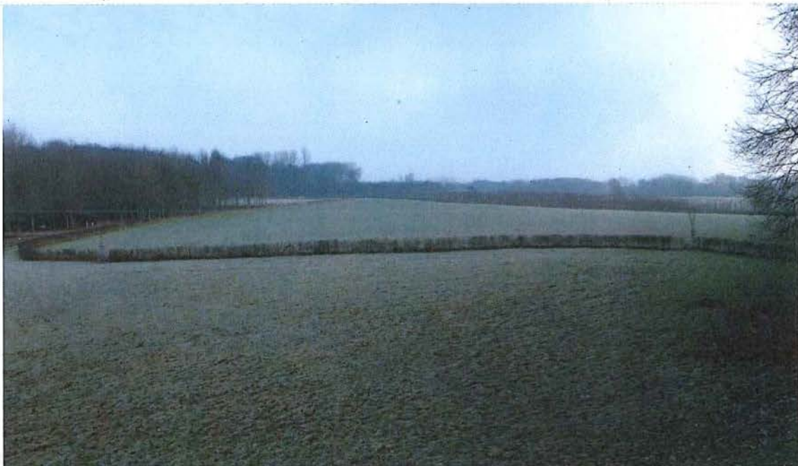
12. Zicht vanaf de uitkijkpost over het voormalige niemandsland ten noorden van de Bluff , frontlijnen gemarkeerd door hagen, 17/01/2017