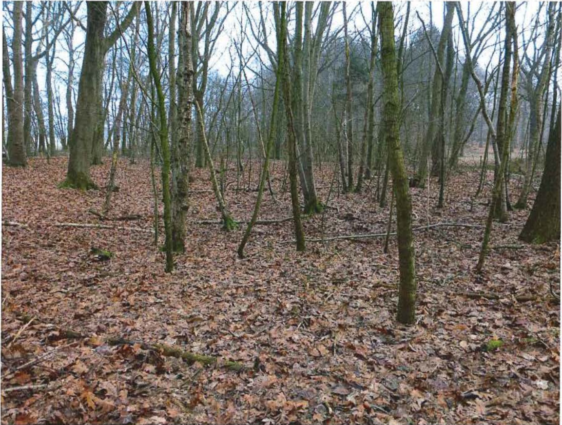
9. De kleinste krater is alleen zichtbaar door een depressie in het reliëf, 17/01/2017